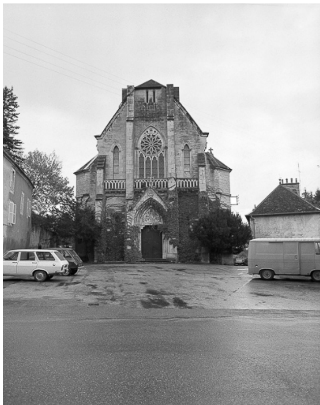
Extérieur : façade antérieure.