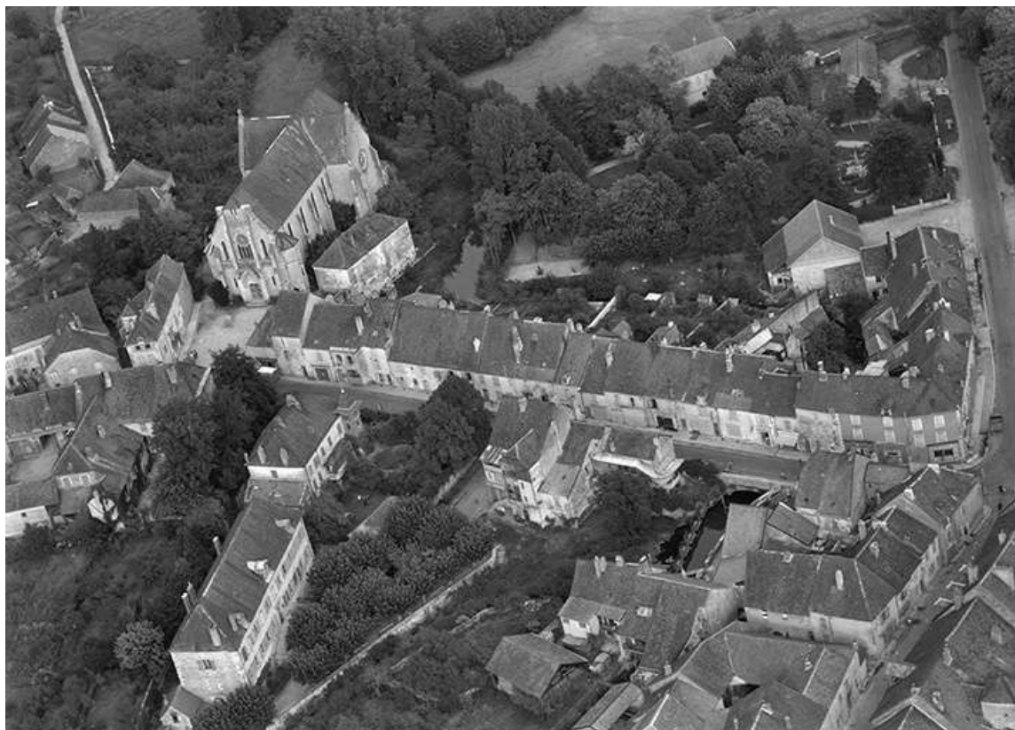
Vue aérienne en 1956.