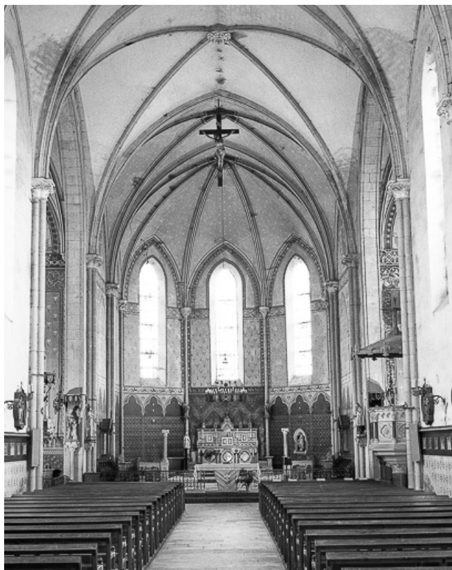
Extérieur : chœur vu de la nef.