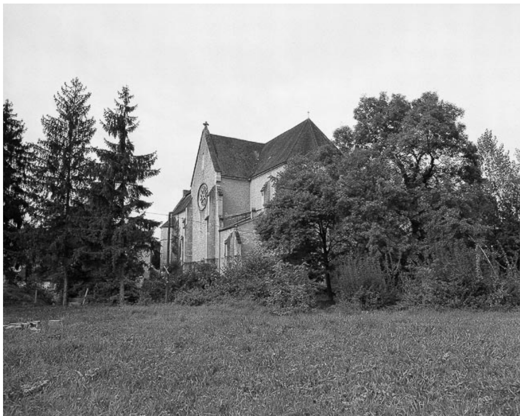
Extérieur : face droite vue de trois quarts.