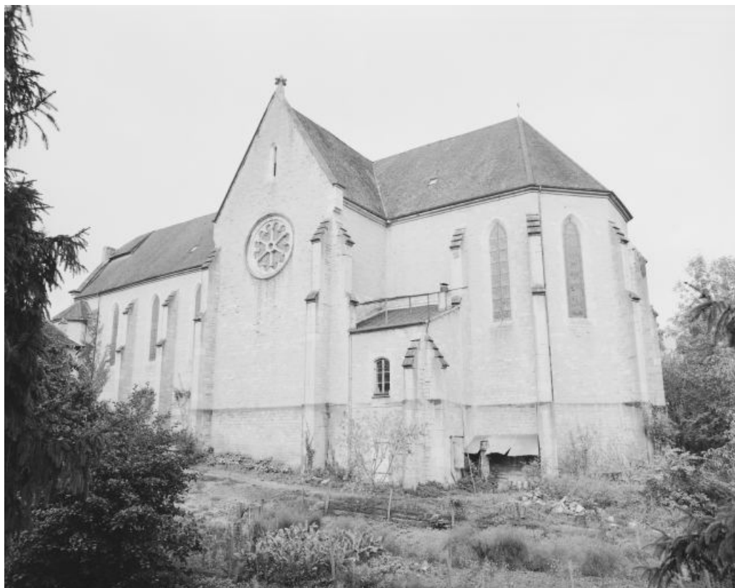
Extérieur : façade latérale droite.