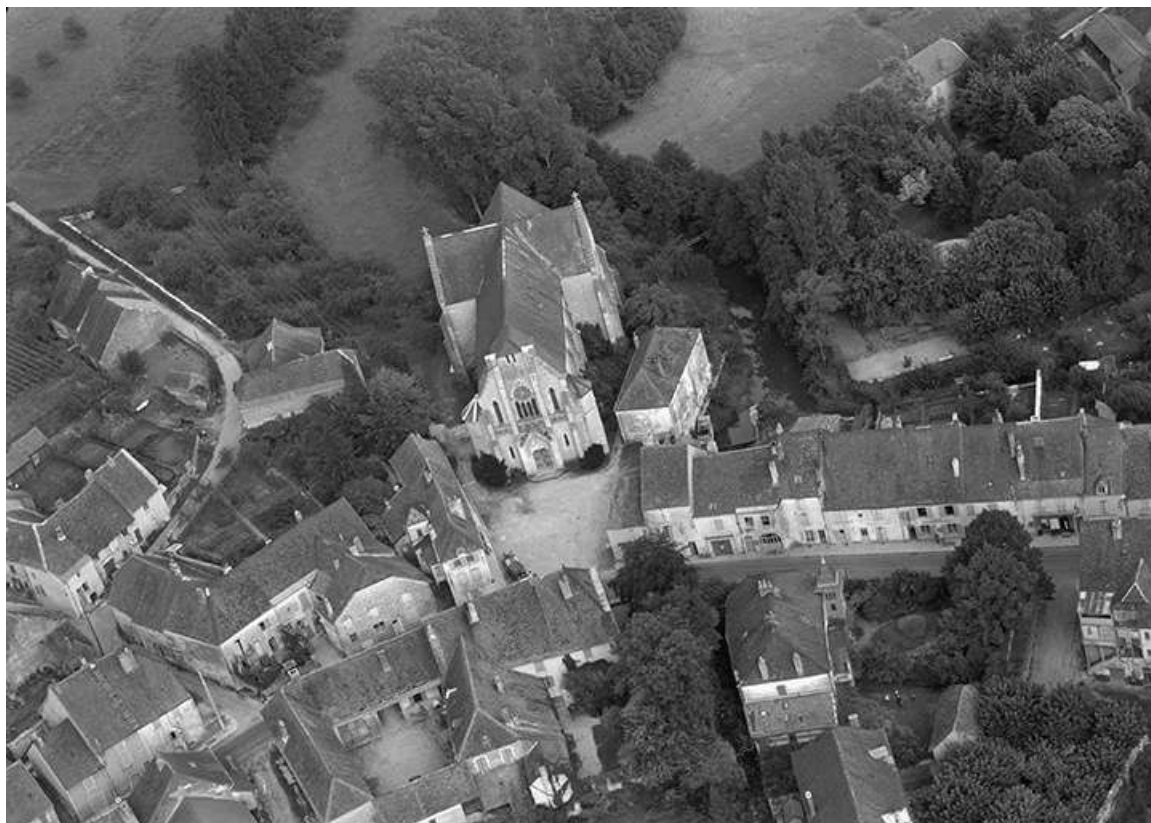
Vue aérienne en 1956.