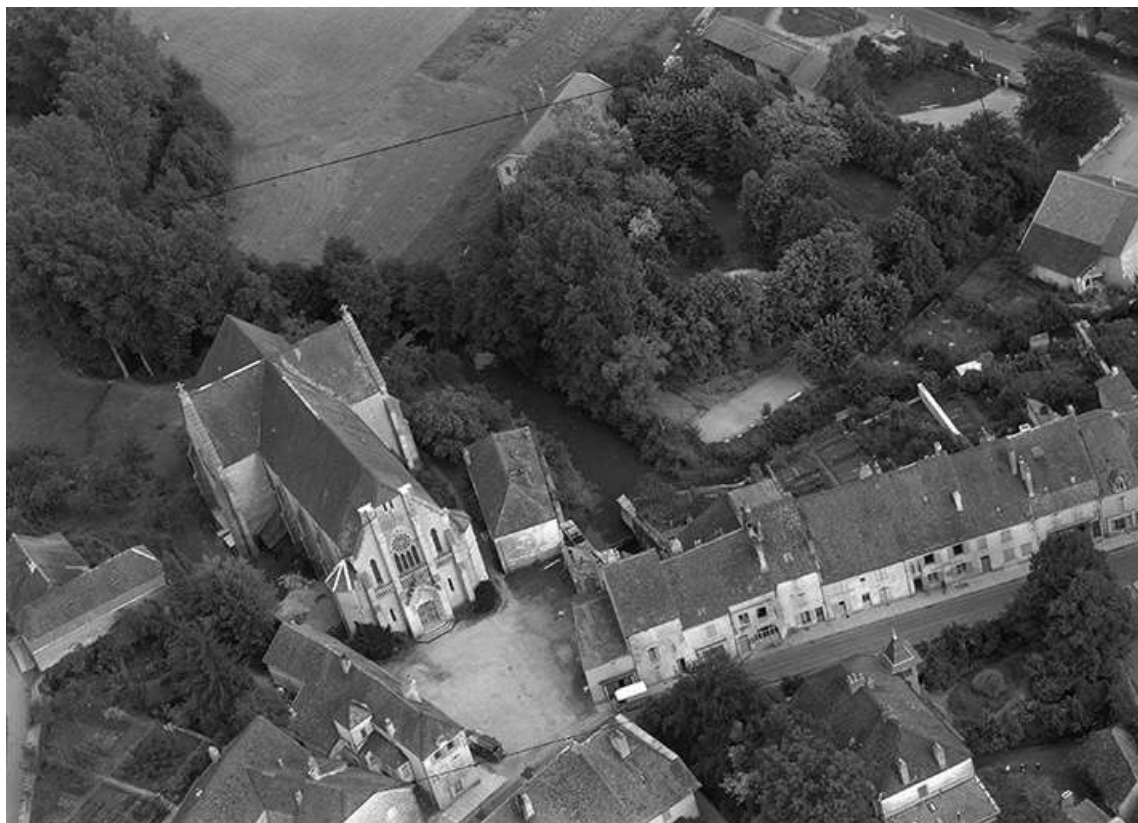
Vue aérienne en 1956.