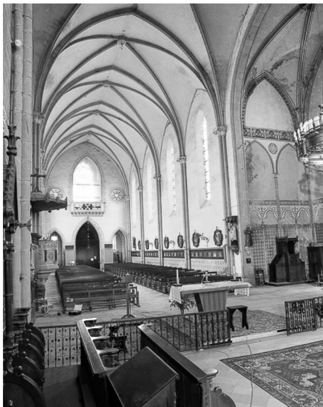
Extérieur : nef, élévation gauche vue du chœur.