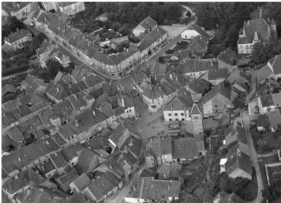
Vue aérienne du centre du village en 1956.