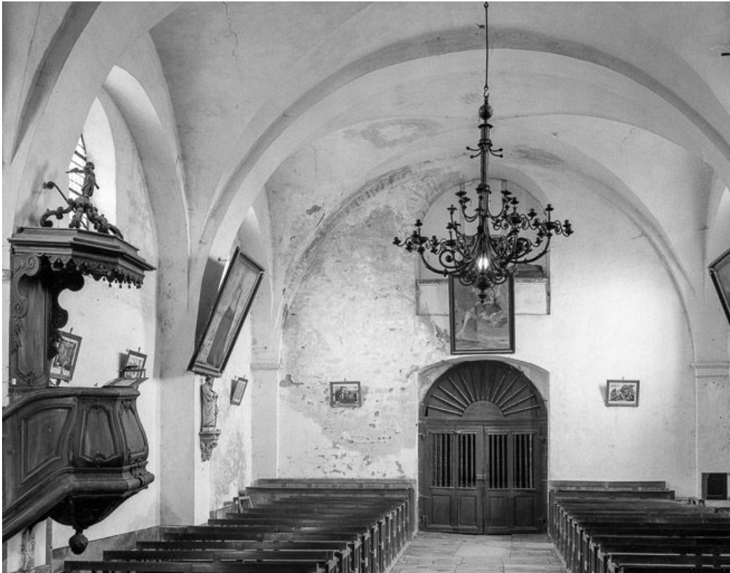
Intérieur : nef vue du chœur.