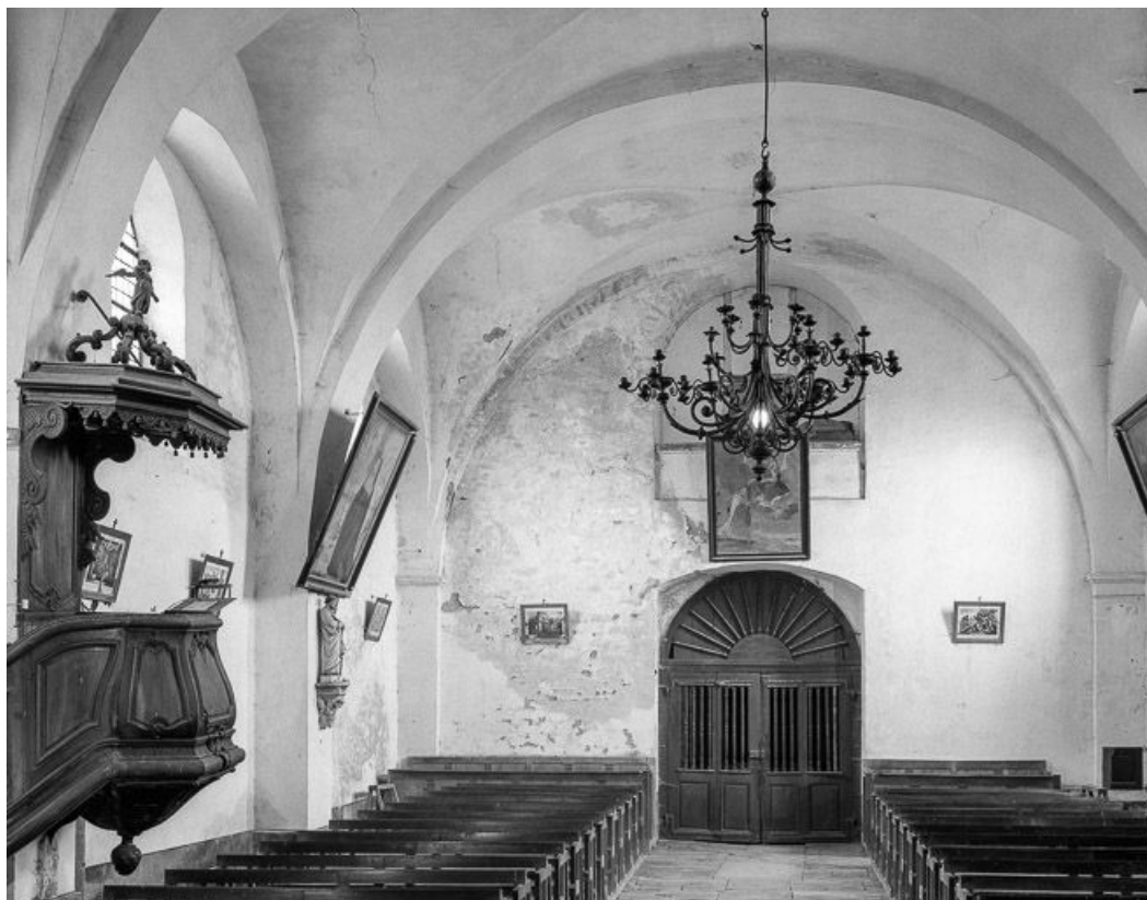
Intérieur : nef vue du chœur.