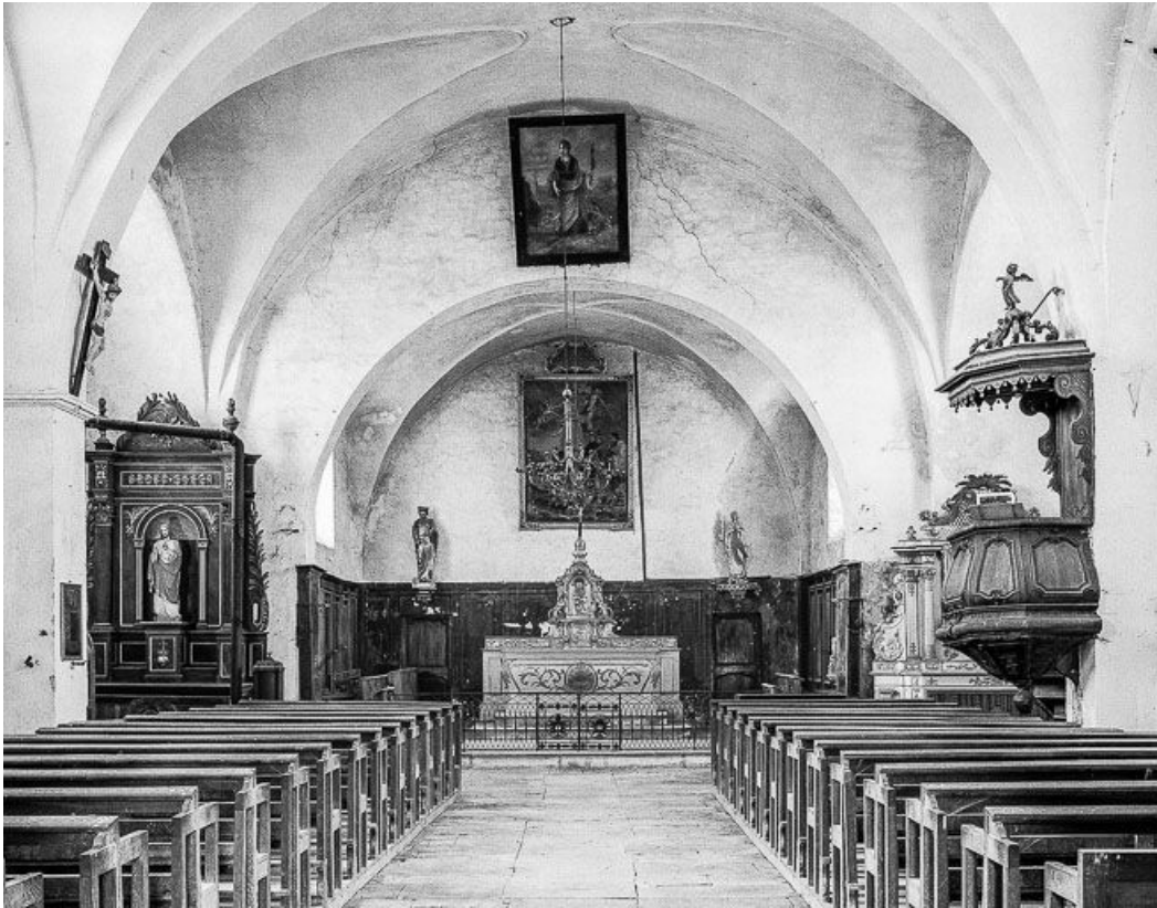
Intérieur : nef et chœur.