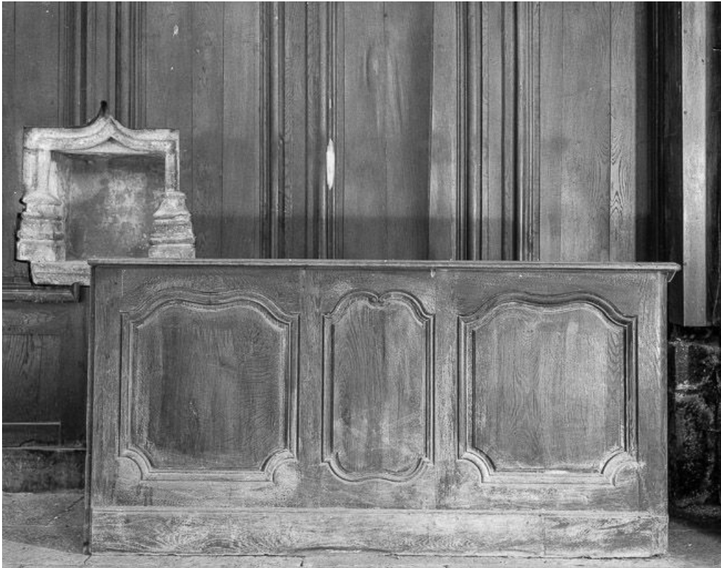
Intérieur : stalles du chœur.