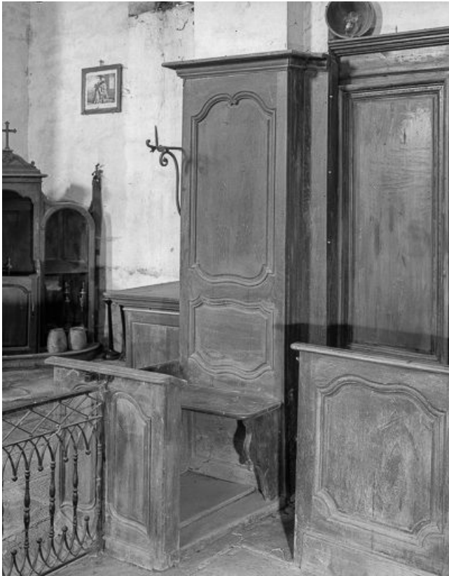
Intérieur : lambris du chœur.