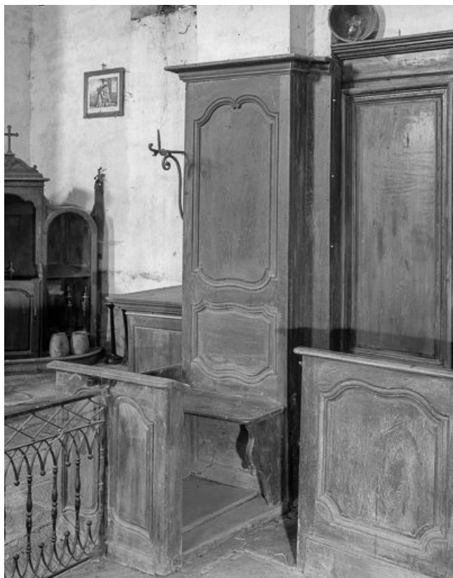
Intérieur : lambris du choeur.