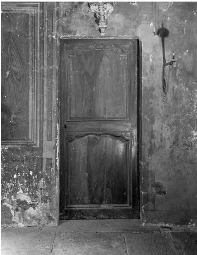
Intérieur : chœur : porte de la sacristie.