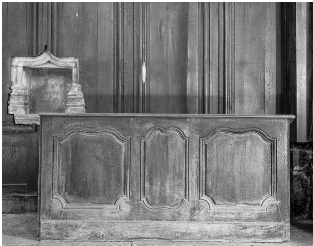
Intérieur : stalles du choeur.