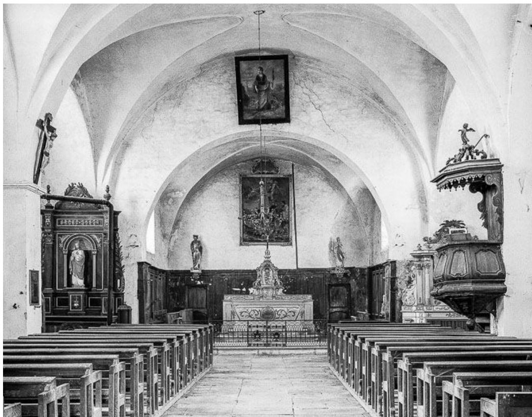
Intérieur : nef et chœur.