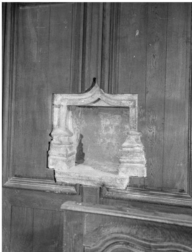
Intérieur : niche du choeur.