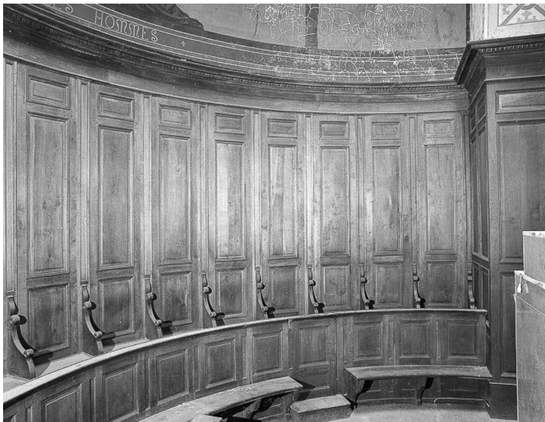
Intérieur : lambris et stalles de l'abside.