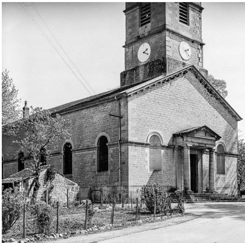
Façade antérieure et face gauche.