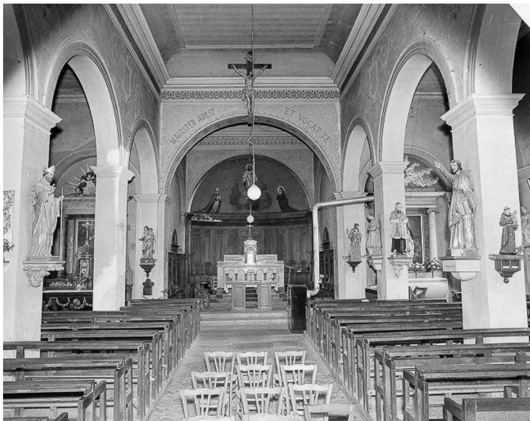
Intérieur : nef et chœur.