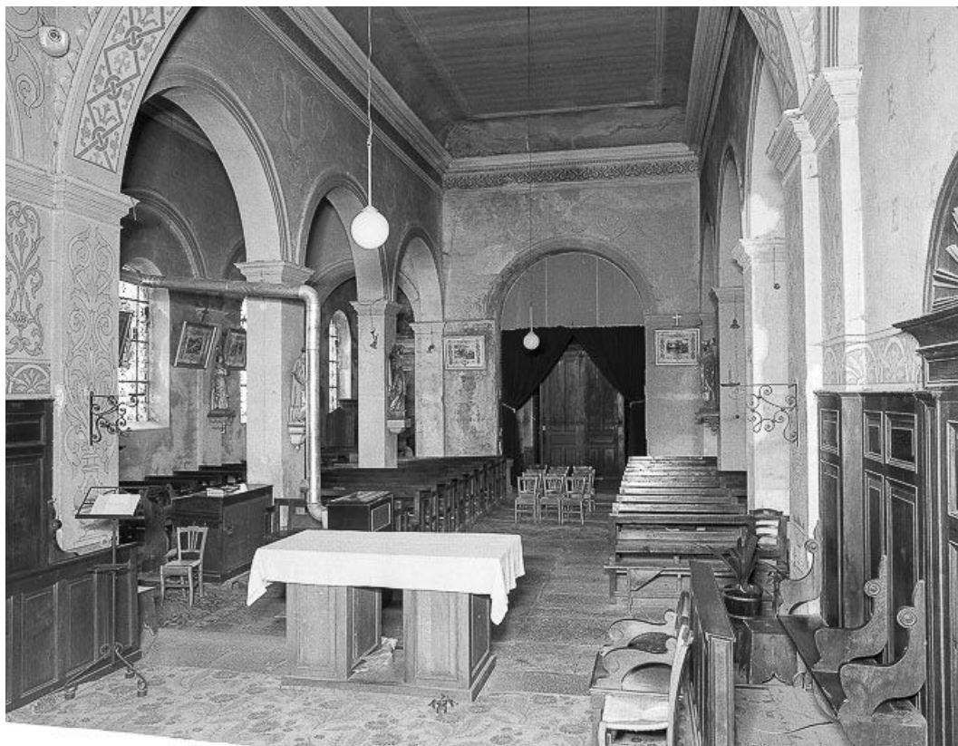
Intérieur : nef vue du chœur.