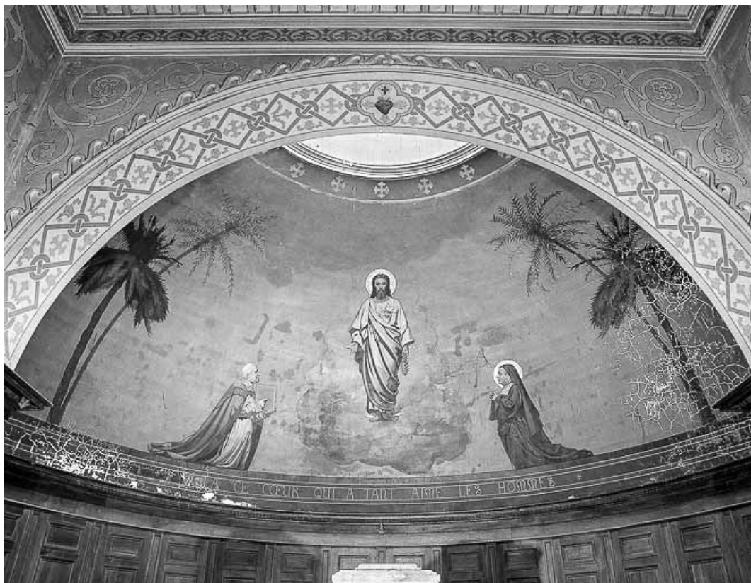
Intérieur : cul-de-four de l'abside.