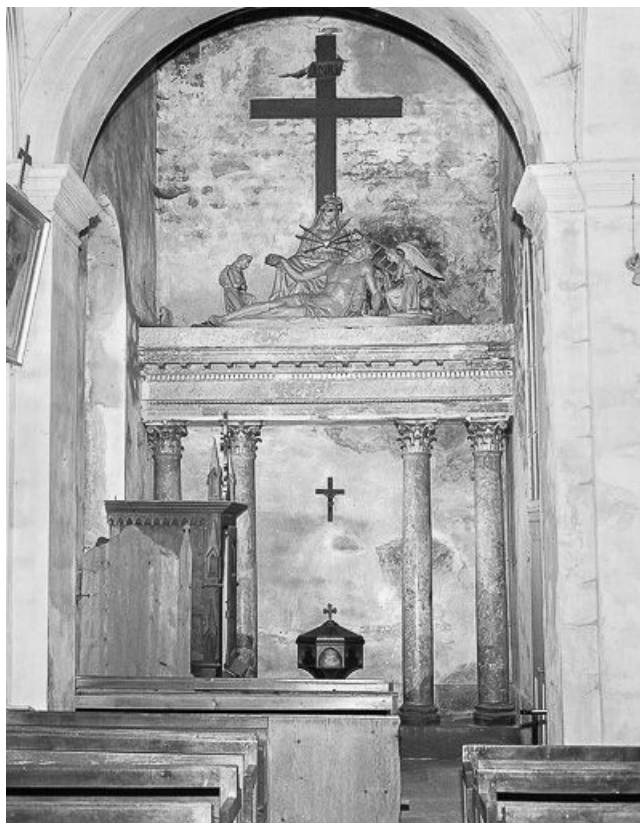
Intérieur : chapelle des fonts-baptismaux.