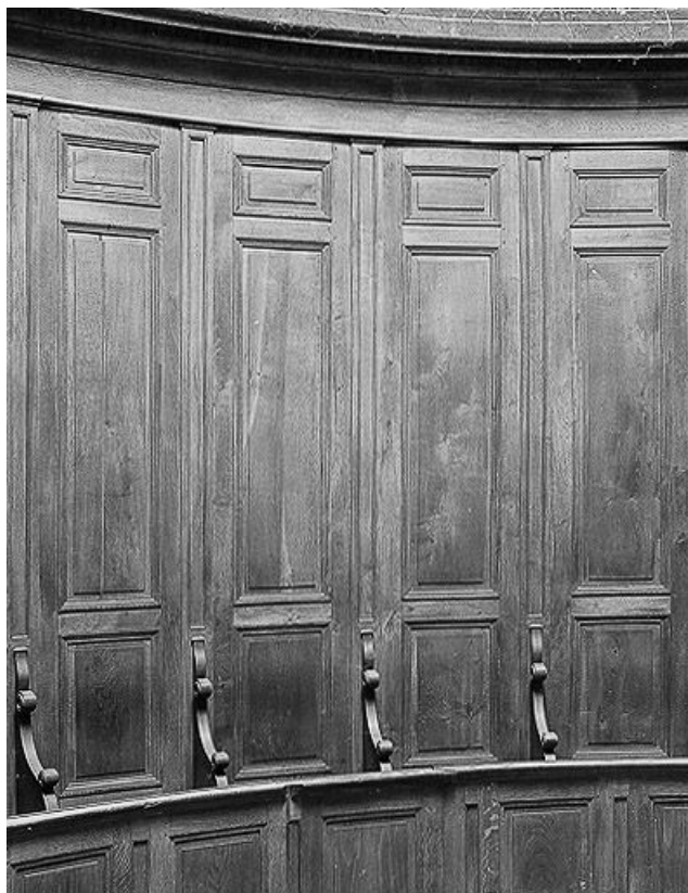
Intérieur : lambris et stalles de l'abside, détail.