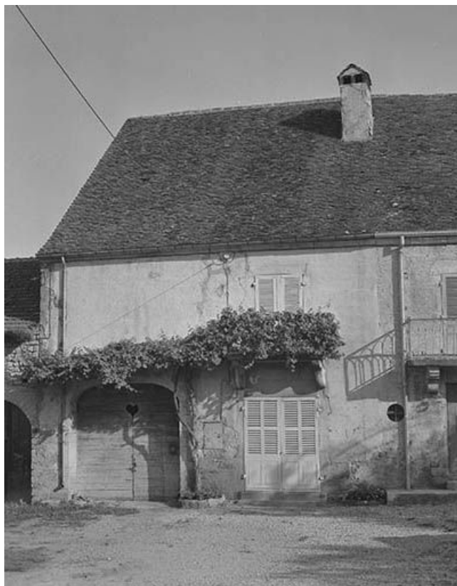
Façade antérieure, partie gauche