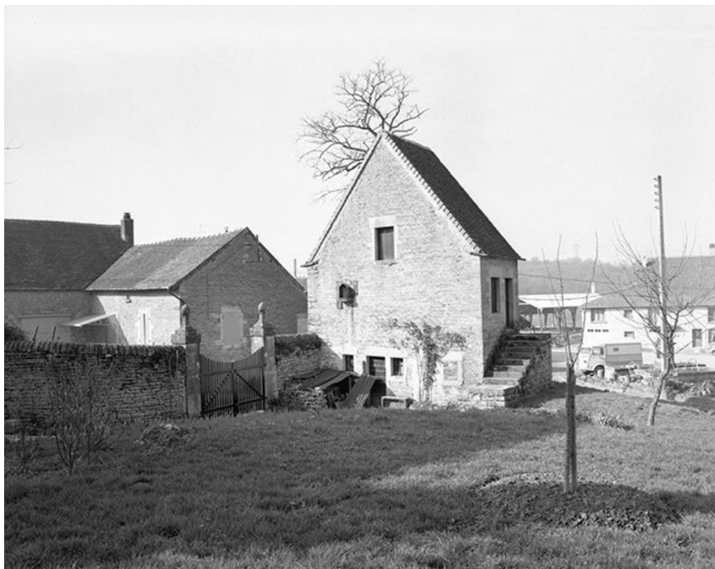
Ferme cadastrée 1959 AI 203 : façades antérieure et latérale gauche du bâtiment d'entrée. 39, Mantry