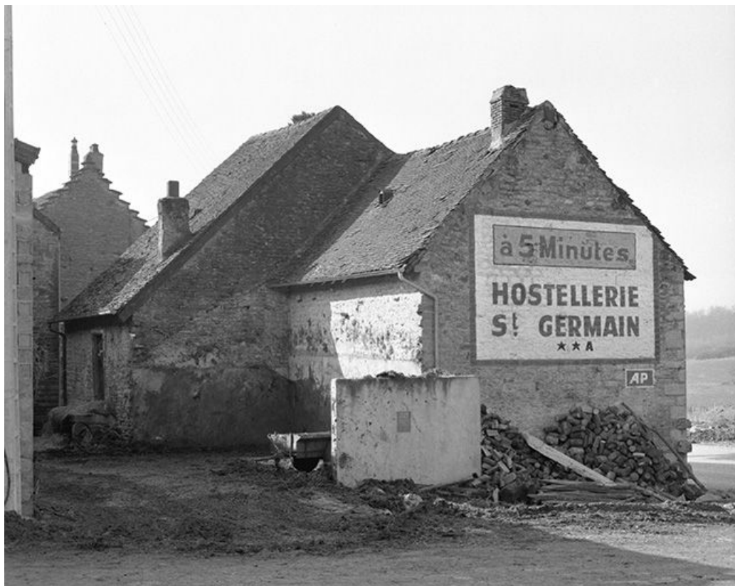
Ferme cadastrée 1959 AI 92 : façade postérieure (?). 39, Mantry