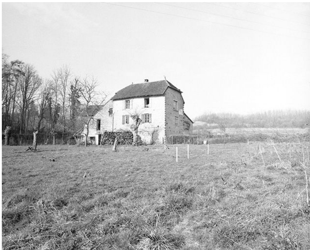
Ferme située au lieudit Montchauvrot, cadastrée 1959 AC 58 : vue d'ensemble. 39, Mantry