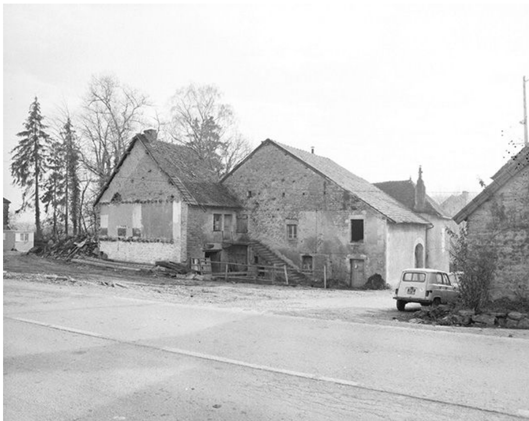
Ferme située au lieudit Montchauvrot, cadastrée 1959 AC 94 : vue de trois quarts droit, prise au cours des travaux routiers de l'hiver 1974-1975.