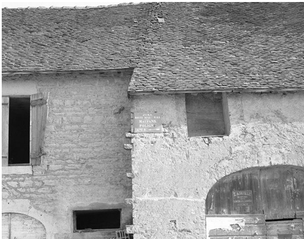
Ferme cadastrée 1959 AI 92 : détail de la façade antérieure. 39, Mantry