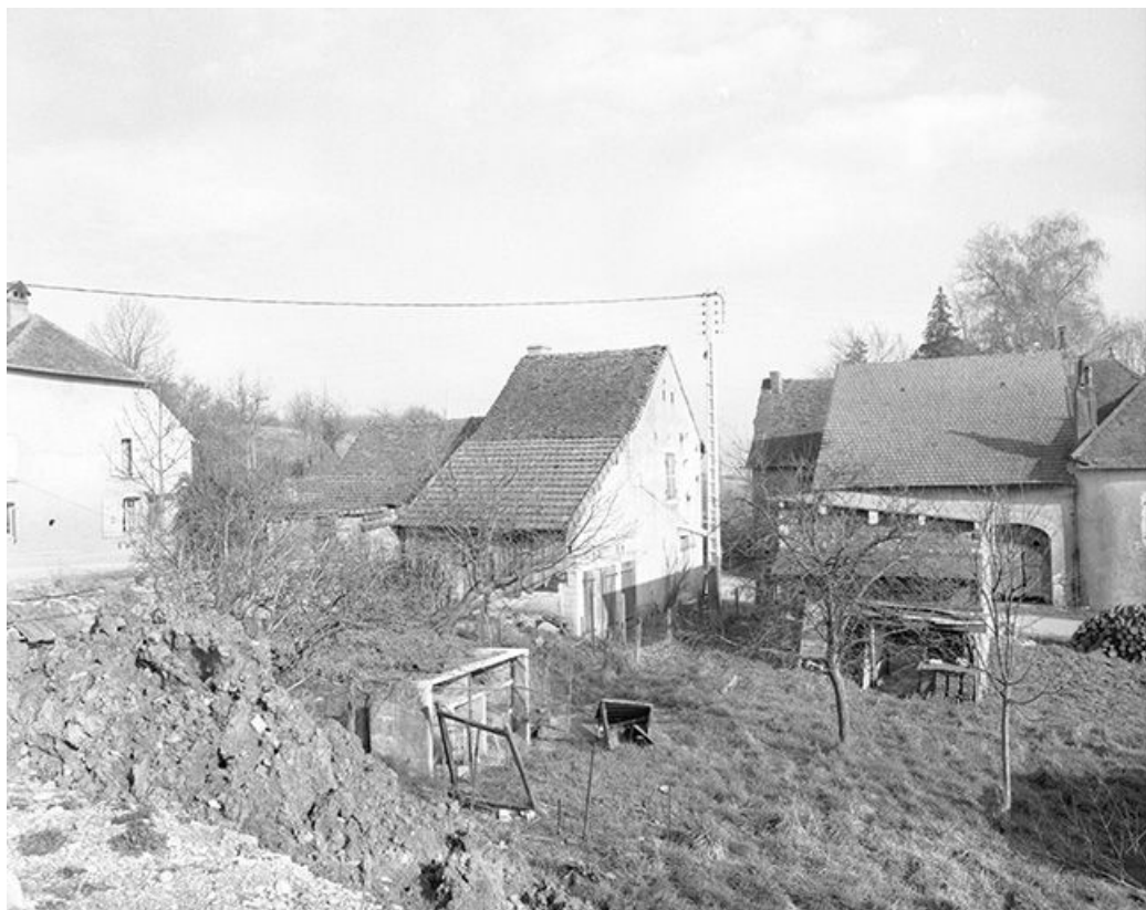
Ferme située au lieudit Montchauvrot, cadastrée 1959 AC 140-141 : façade postérieure. 39, Mantry