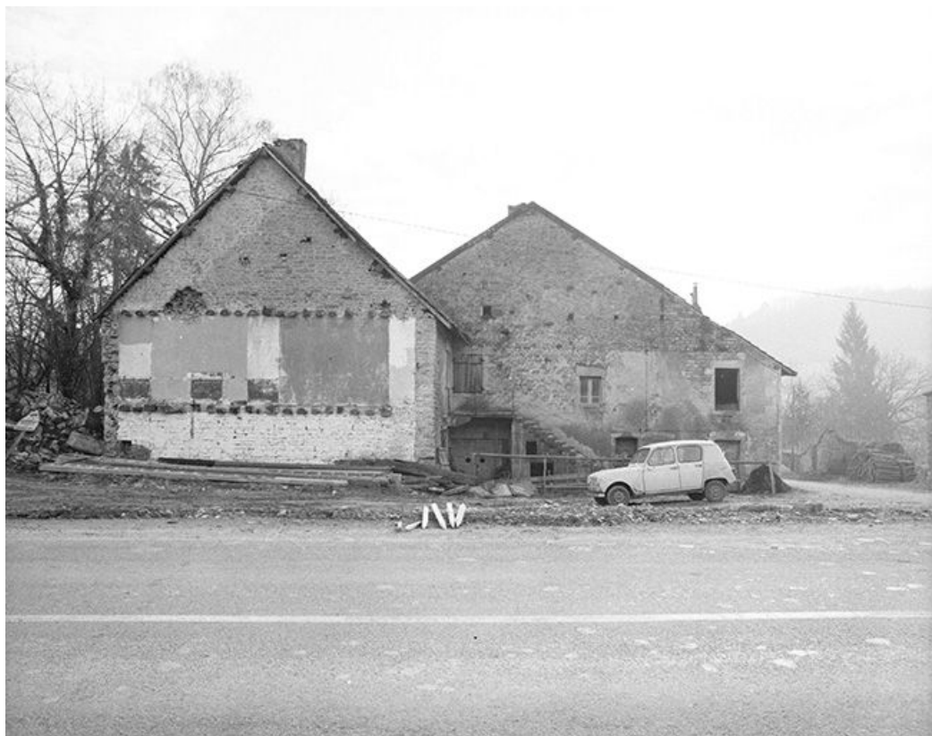
Ferme située au lieudit Montchauvrot, cadastrée 1959 AC 94 : façade sur rue prise au cours des travaux routiers de l'hiver 1974-1975.