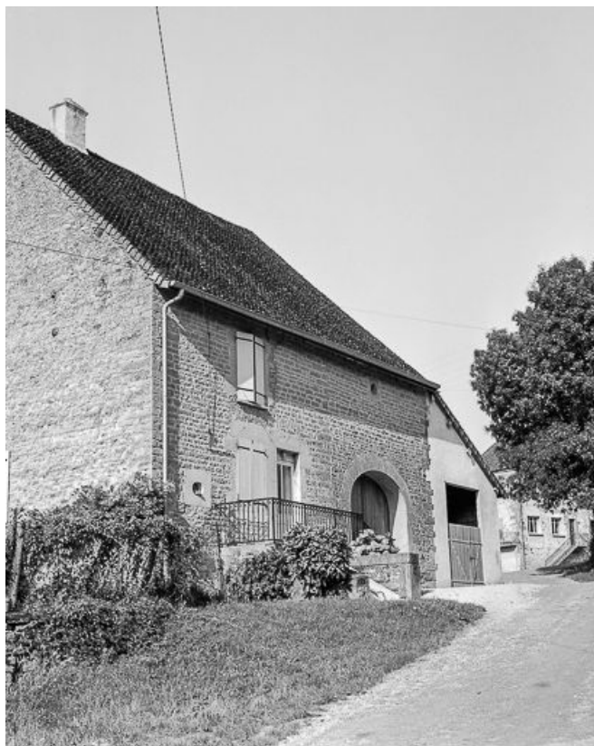
Ferme cadastrée 1959 AE 289, située rue du Bas du Village : vue de trois quarts gauche. 39, Mantry