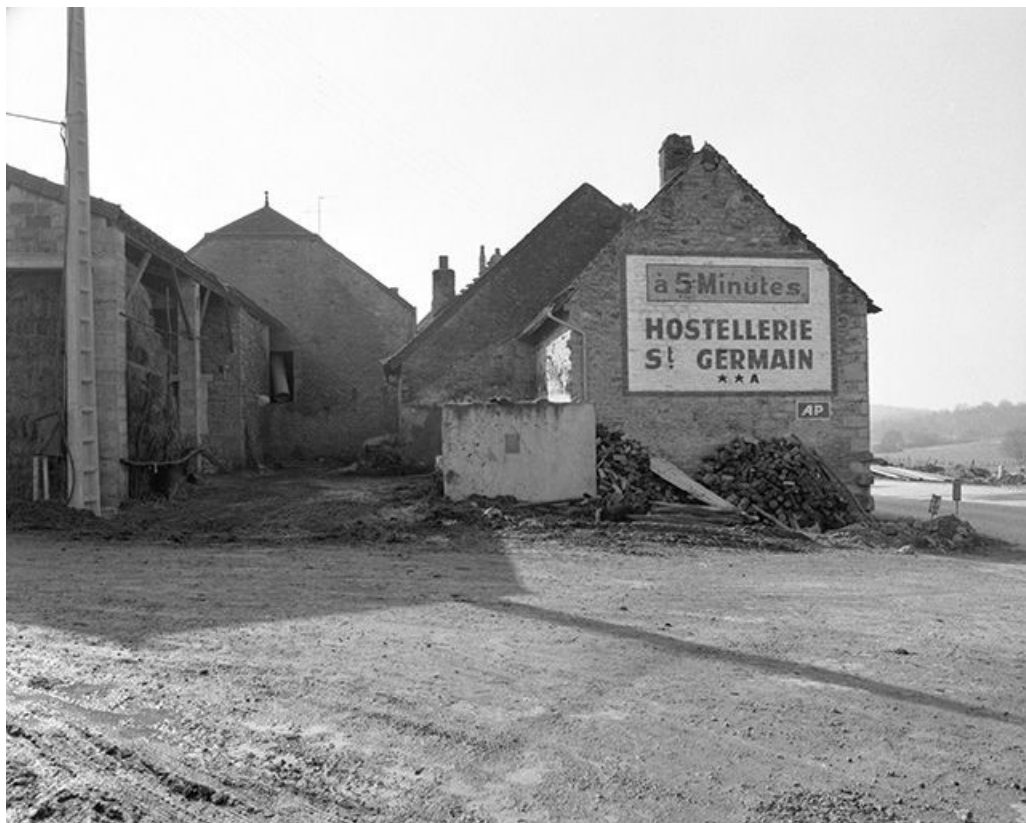
Ferme cadastrée 1959 AI 92 : façade postérieure (?). 39, Mantry