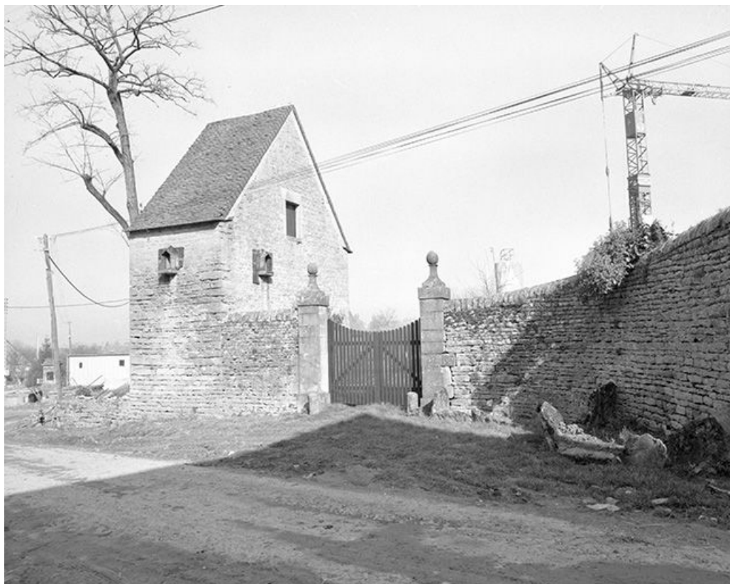
Ferme cadastrée 1959 AI 203 : portail et bâtiment d'entrée. 39, Mantry