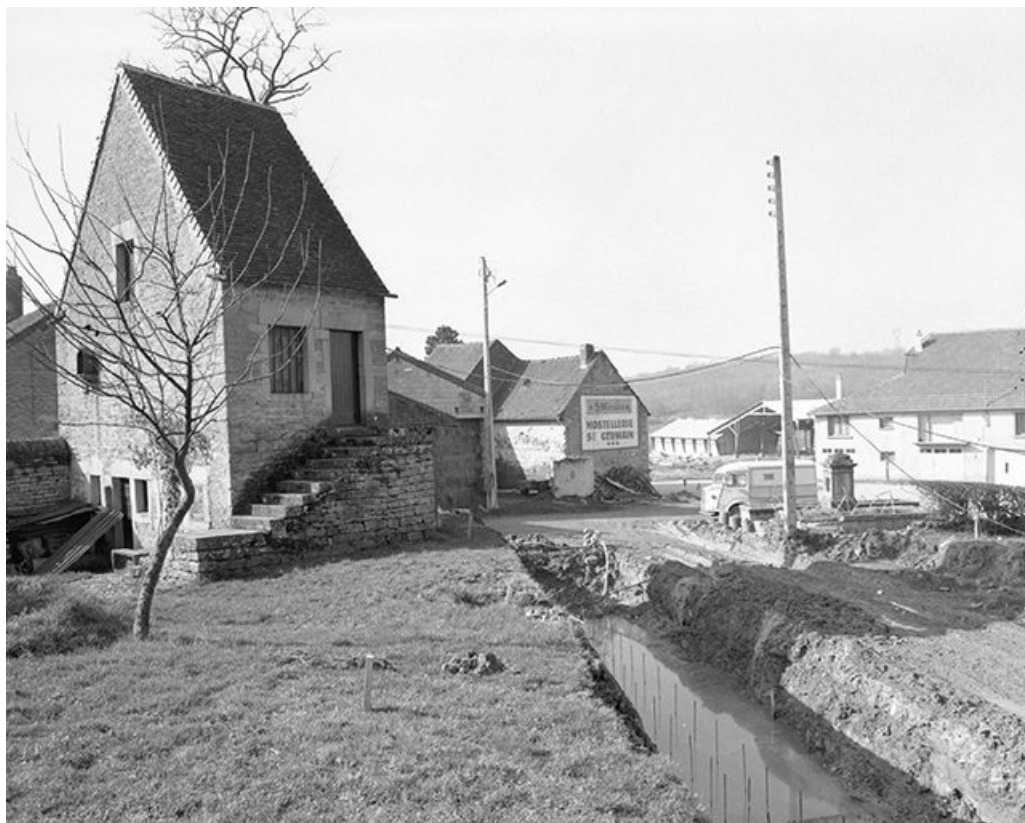
Ferme cadastrée 1959 AI 203 : bâtiment d'entrée vu de trois quarts gauche. 39, Mantry