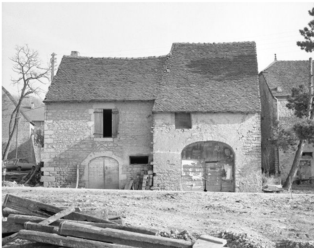
Ferme cadastrée 1959 AI 92 : façade antérieure. 39, Mantry