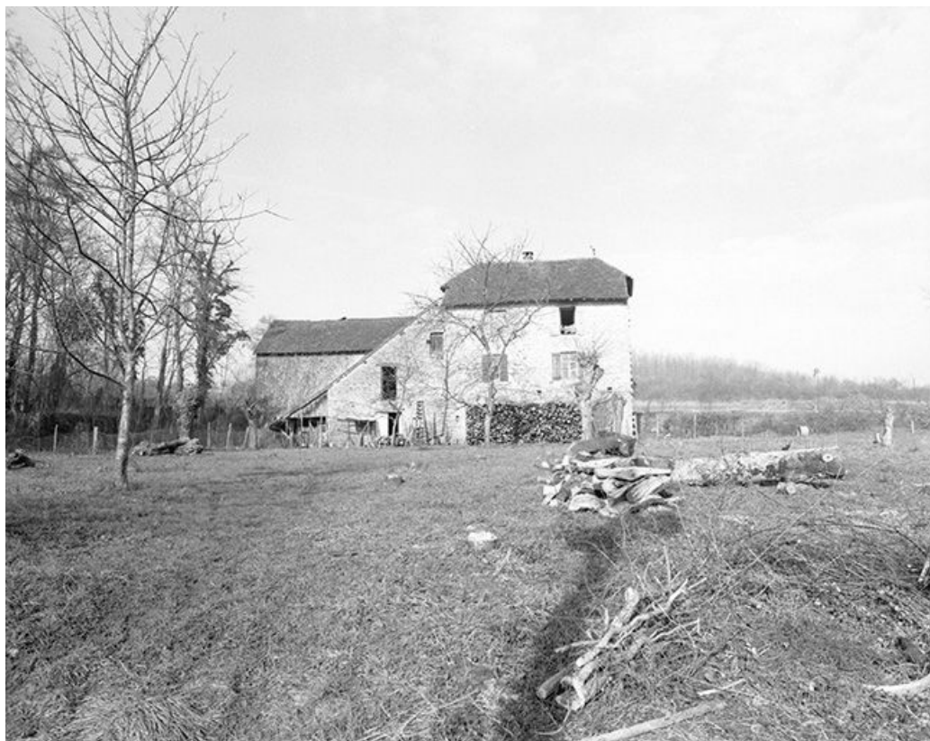
Ferme située au lieudit Montchauvrot, cadastrée 1959 AC 58 : vue d'ensemble. 39, Mantry