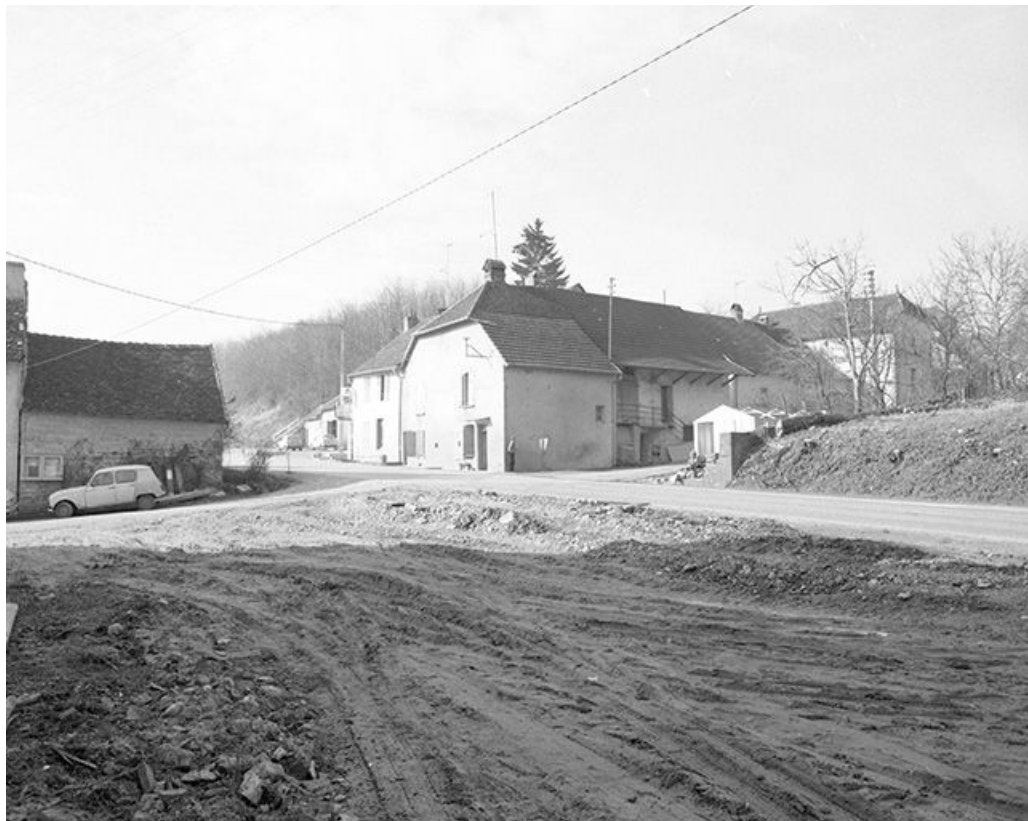
Lieudit Montchauvrot : vue prise au cours des travaux routiers de l'hiver 1974-1975. 39, Mantry