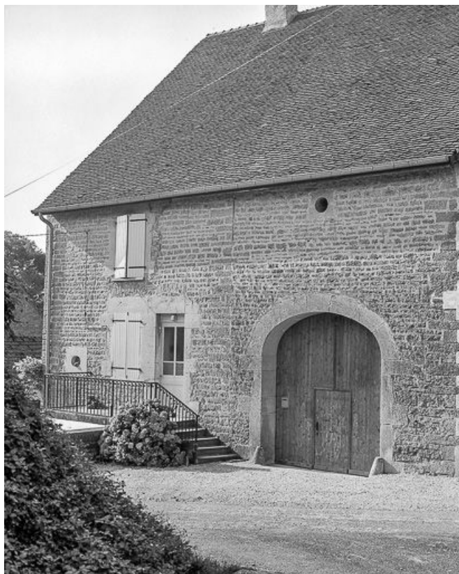
Ferme cadastrée 1959 AE 289, située rue du Bas du Village : vue de trois quarts droit. 39, Mantry