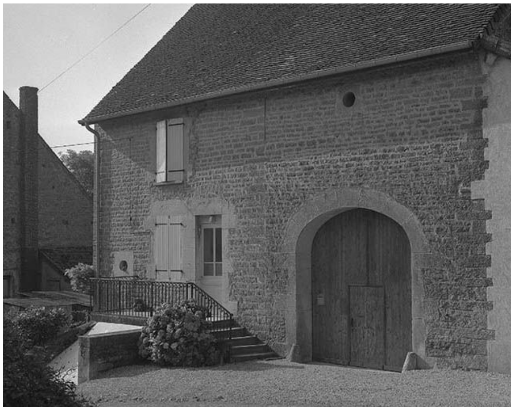
Ferme cadastrée 1959 AE 289, située rue du Bas du Village : façade antérieure. 39, Mantry