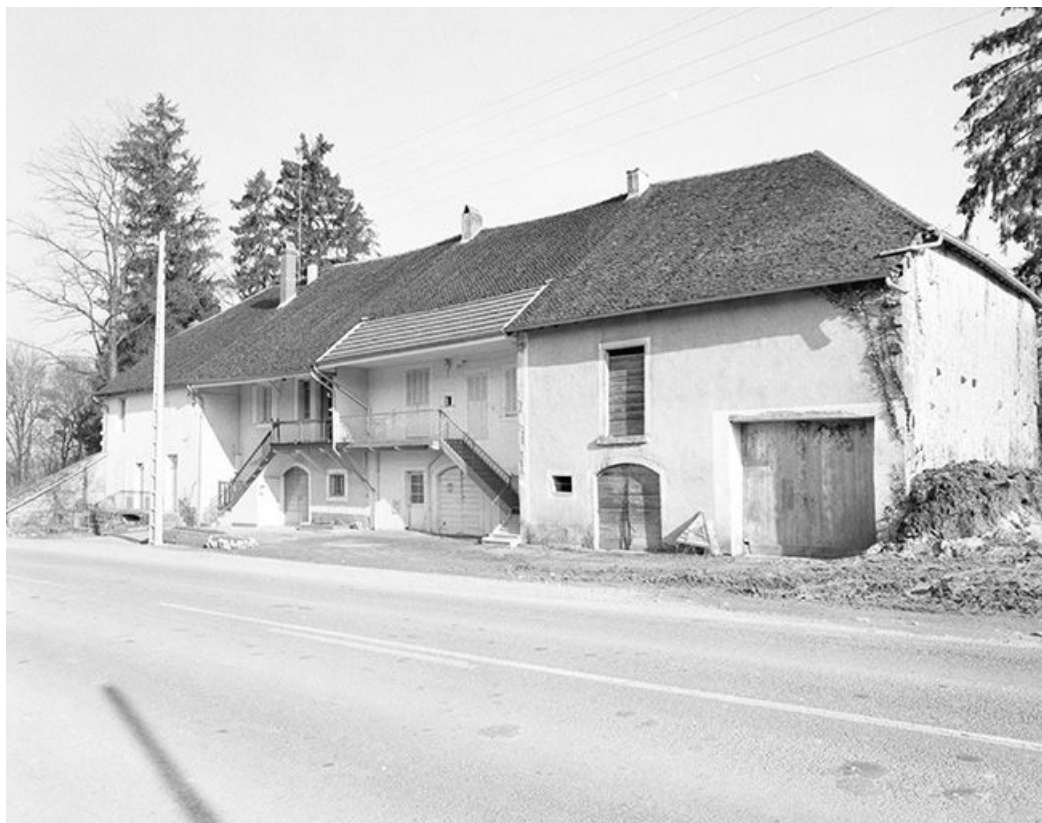
Ferme situées au lieudit Montchauvrot, cadastrée 1959 AC 58 : vue d'ensemble. 39, Mantry