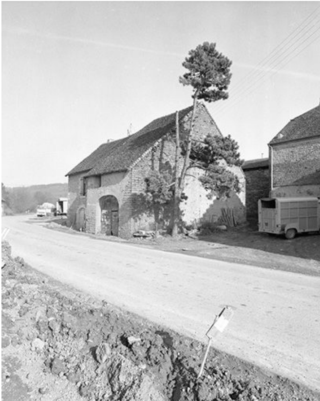
Ferme cadastrée 1959 AI 92 : vue de trois quarts droit. 39, Mantry