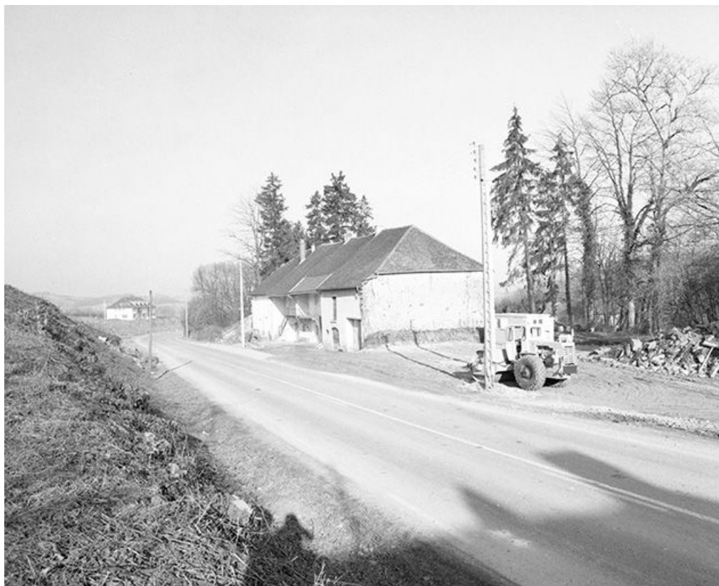
Ferme situées au lieudit Montchauvrot, cadastrée 1959 AC 86, 87, 88 et 90 : vue de trois quarts droit. 39, Mantry