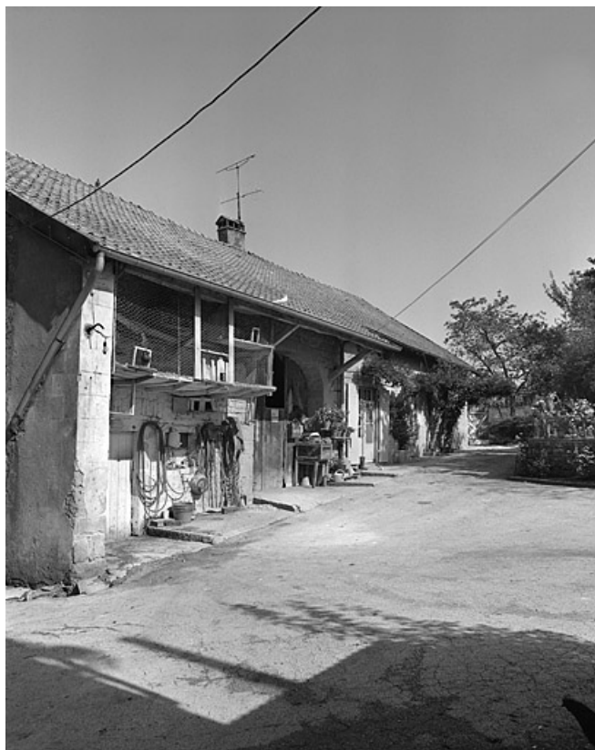
Façade extérieure vue de trois quarts. 39, Darbonnay