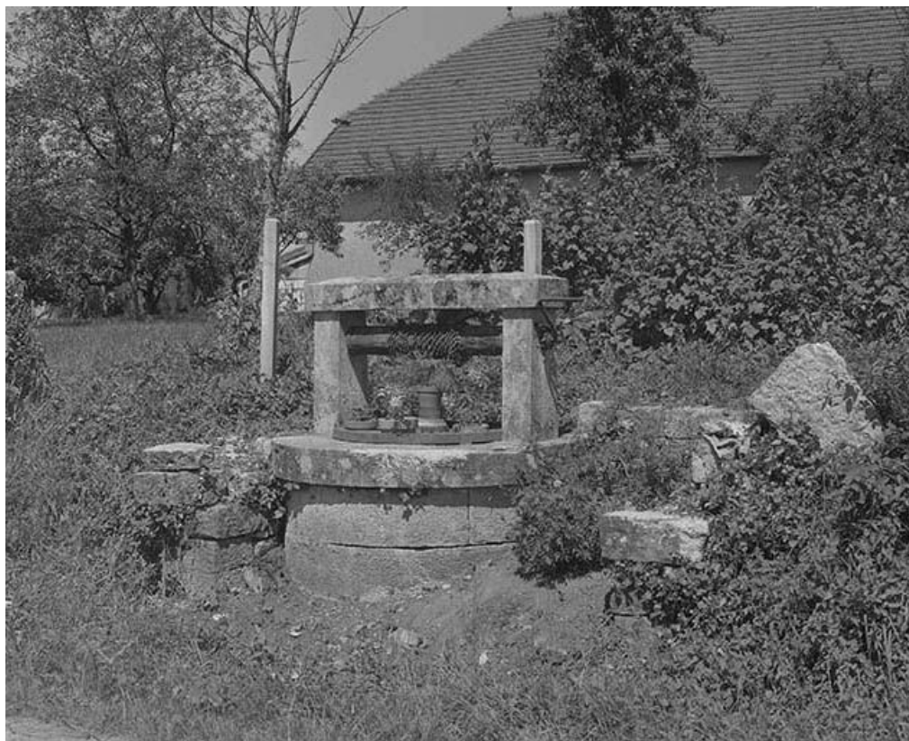
Puits sur le chemin de Darbonnay à Boujon.