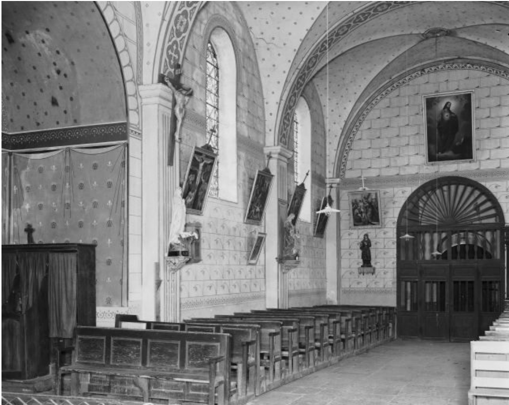
Vue de la nef depuis le chœur.