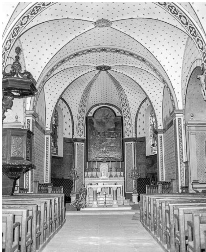
Choeur vu depuis la nef.