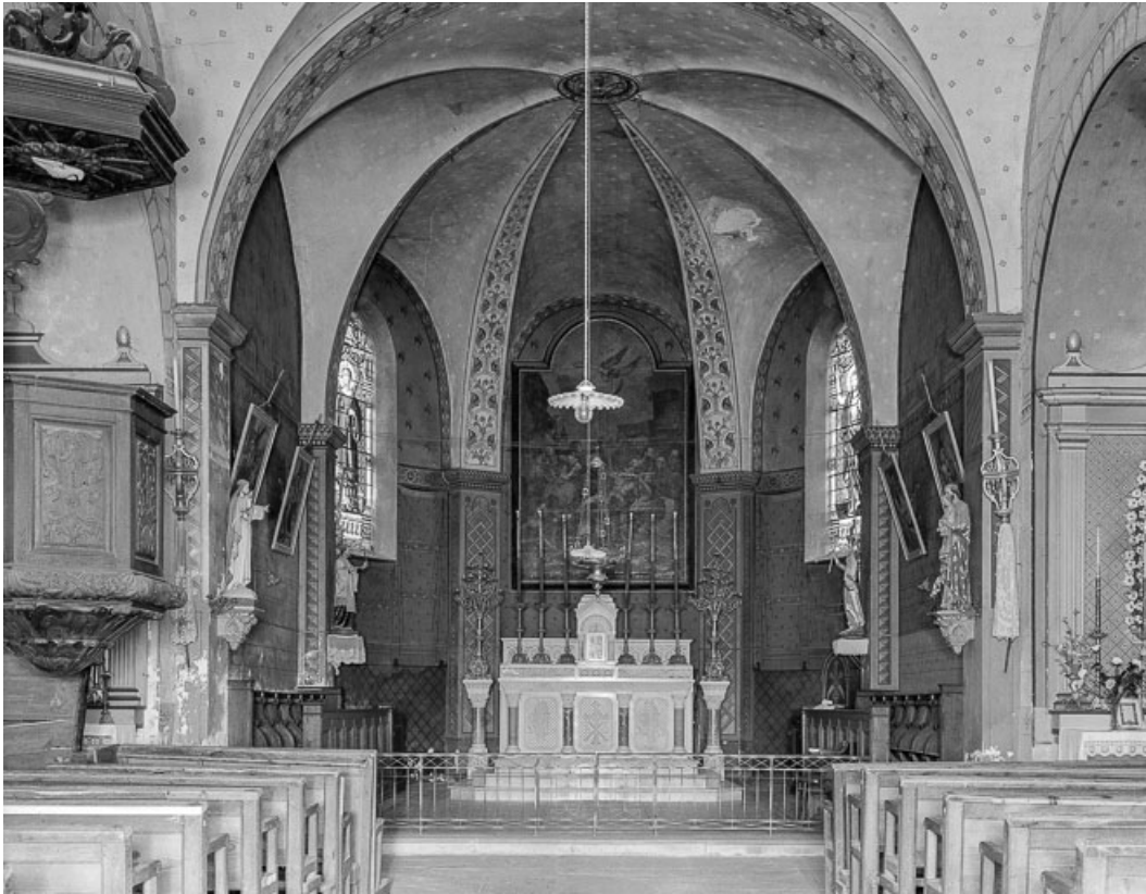
Vue du chœur.