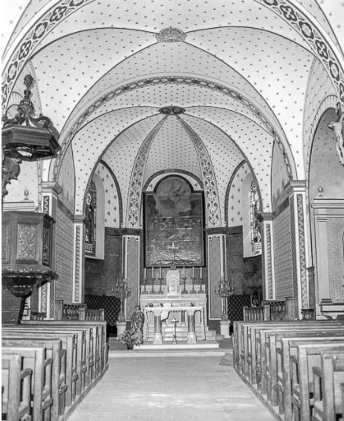
Choeur vu depuis la nef.