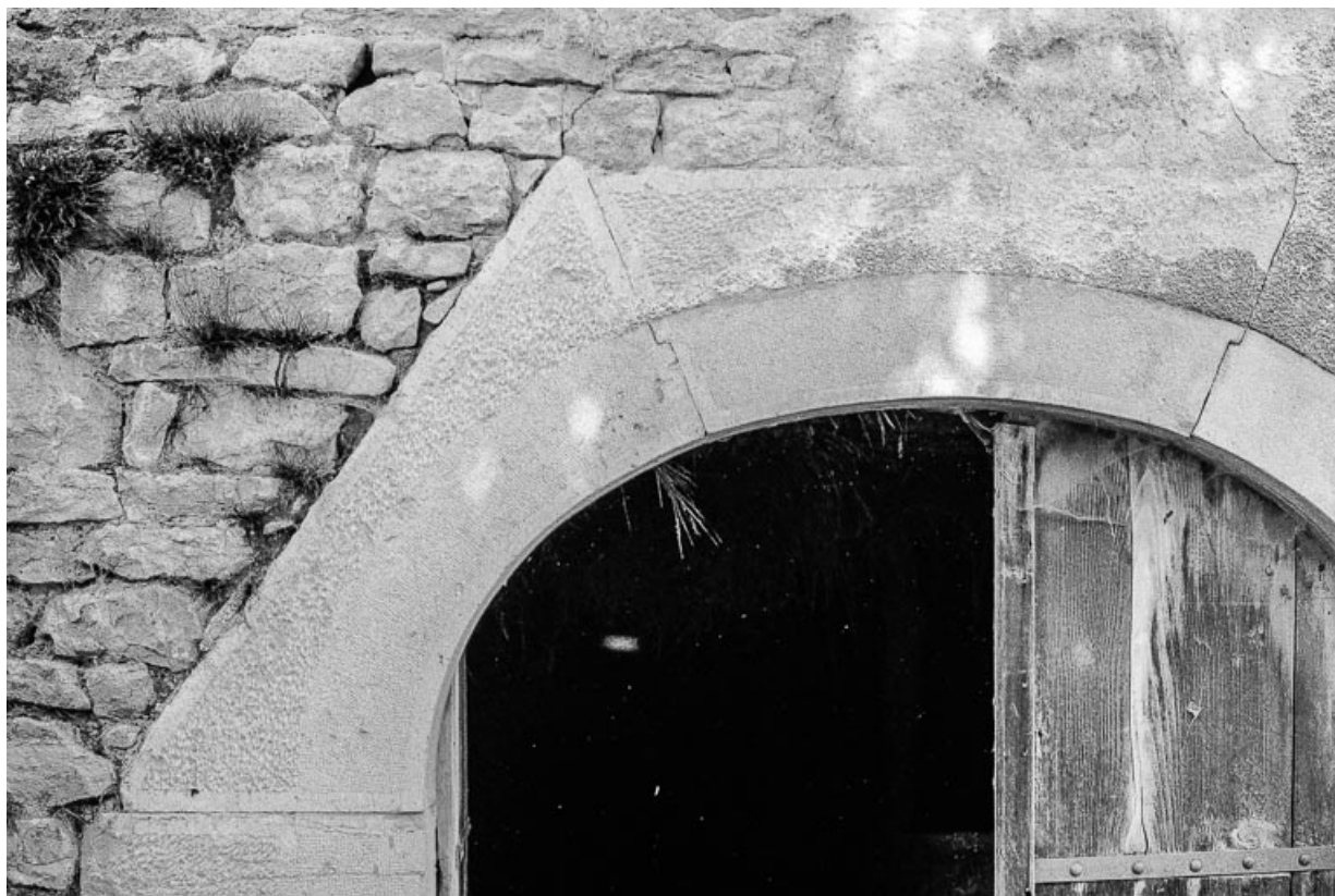
Détail : départ de l'arc de la porte de l'étable.