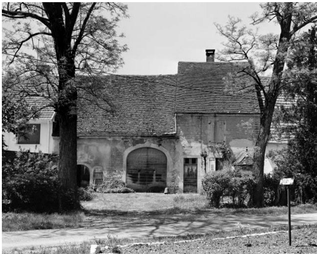
Façade antérieure en 1979.