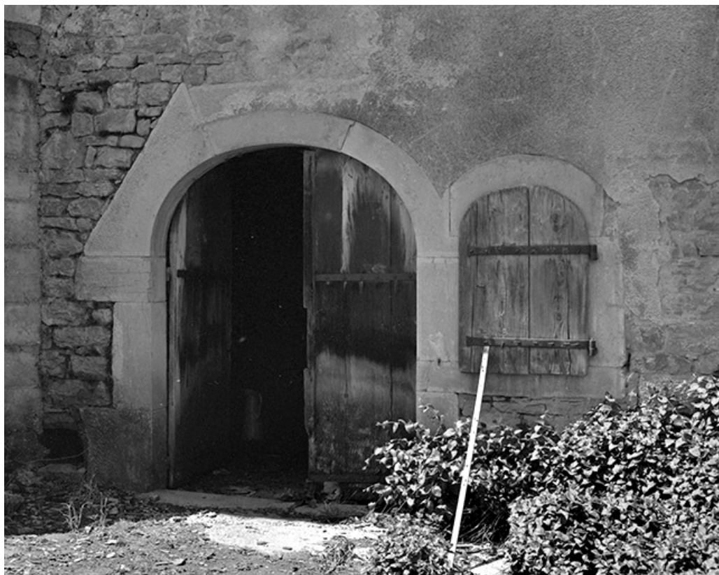
Détail : porte et fenêtre de l'étable.