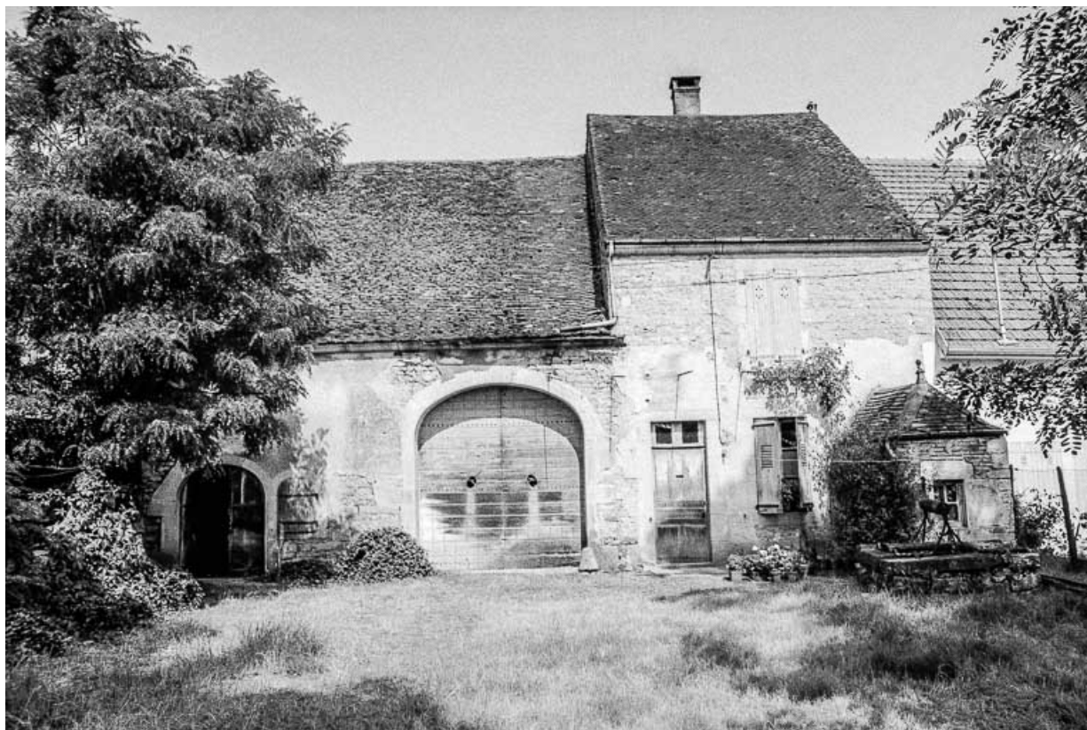
Façade antérieure en 1975.