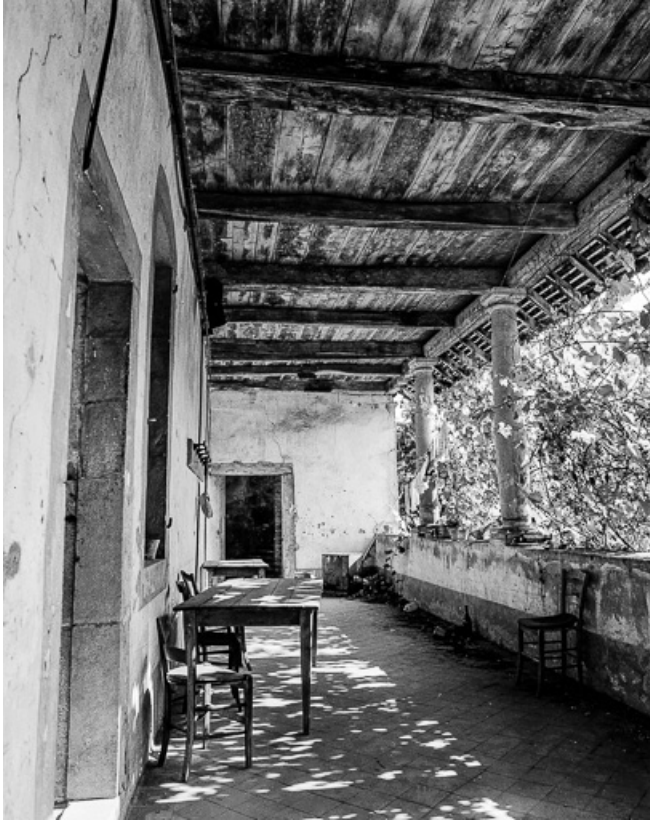
Corps de logis, étage de la galerie. 39, Quintigny