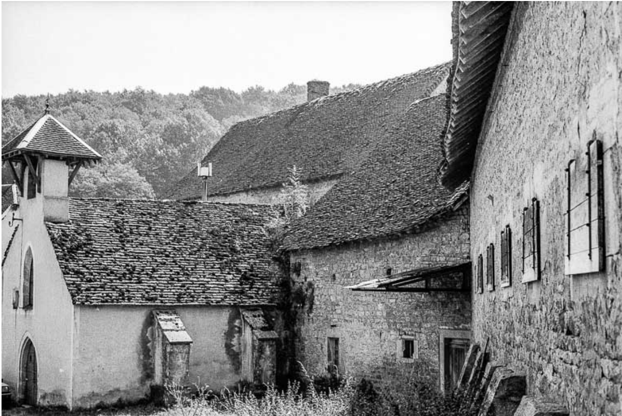
Chapelle. 39, Quintigny