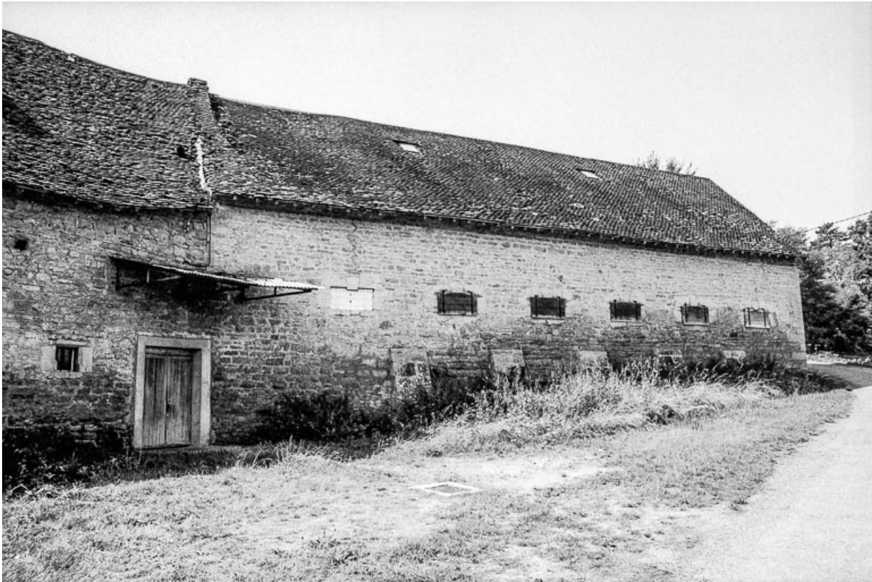
Parties agricoles : façade sur rue. 39, Quintigny