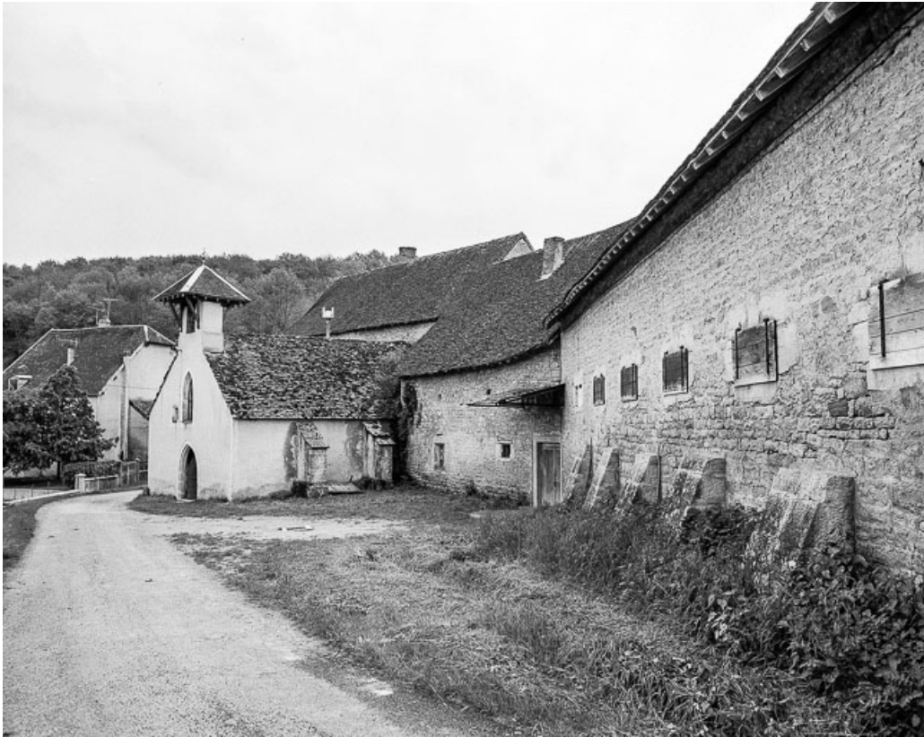
Chapelle et partie agricole, élévation sur l'extérieur.