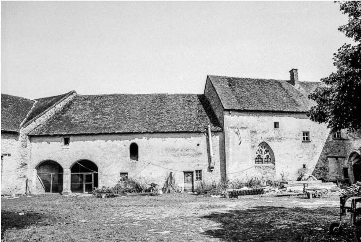
Parties agricoles et partie comprenant une chapelle. 39, Quintigny