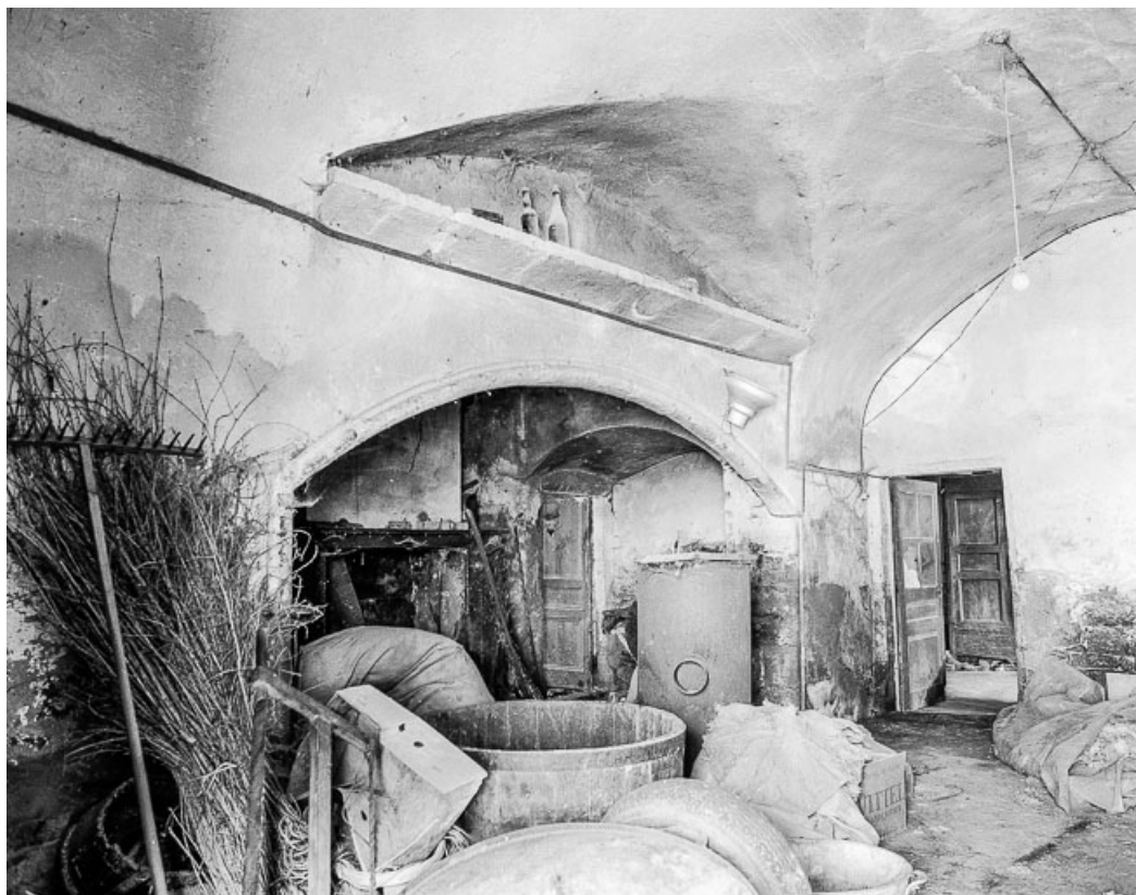
La cuisine. 39, Quintigny