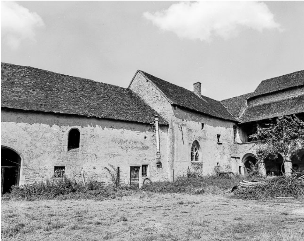
Chapelle, élévation sur cour.