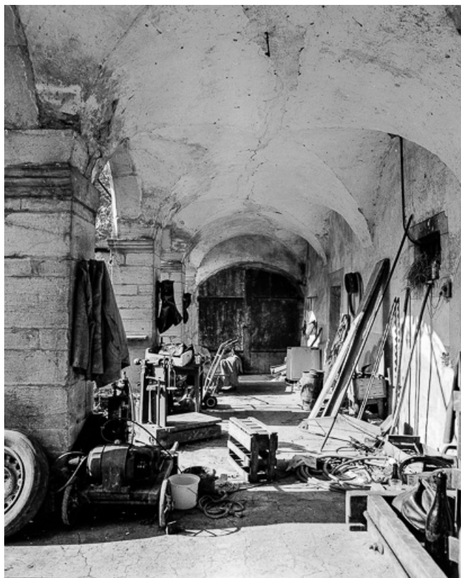
Corps de logis, rez-de-chaussée de la galerie. 39, Quintigny