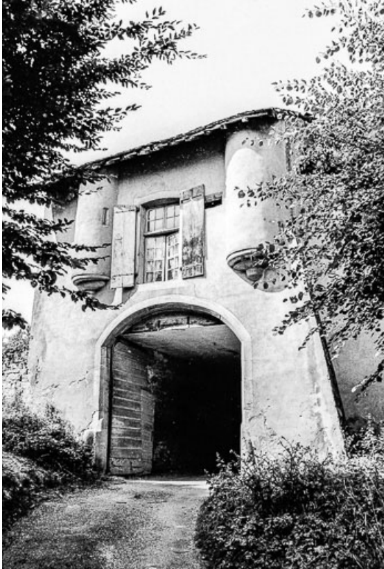
Entrée. 39, Quintigny