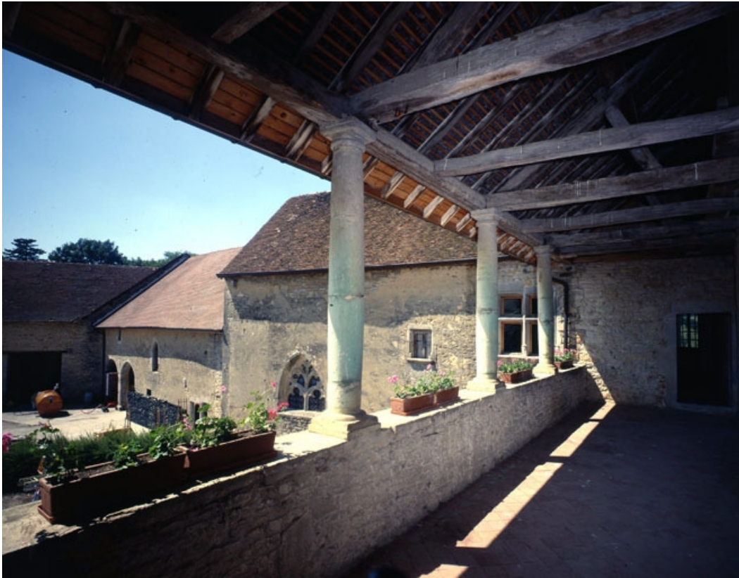
Galerie ouverte du premier étage.