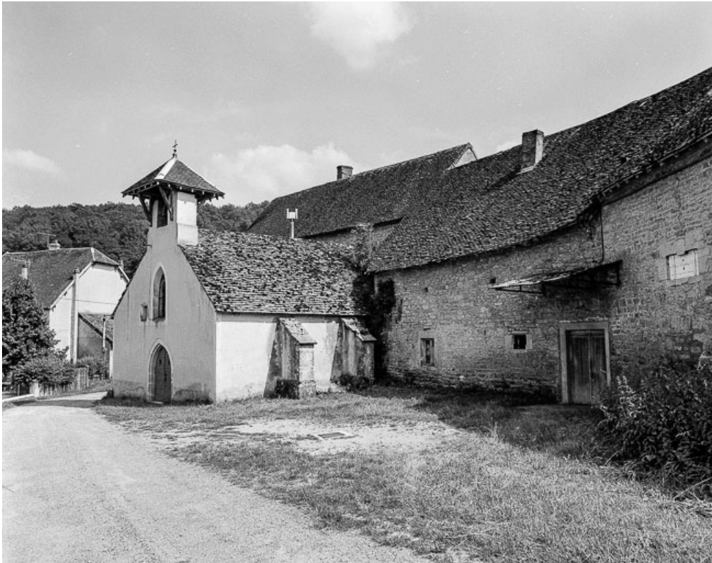
Vue de la chapelle et de la grange. 39, Quintigny