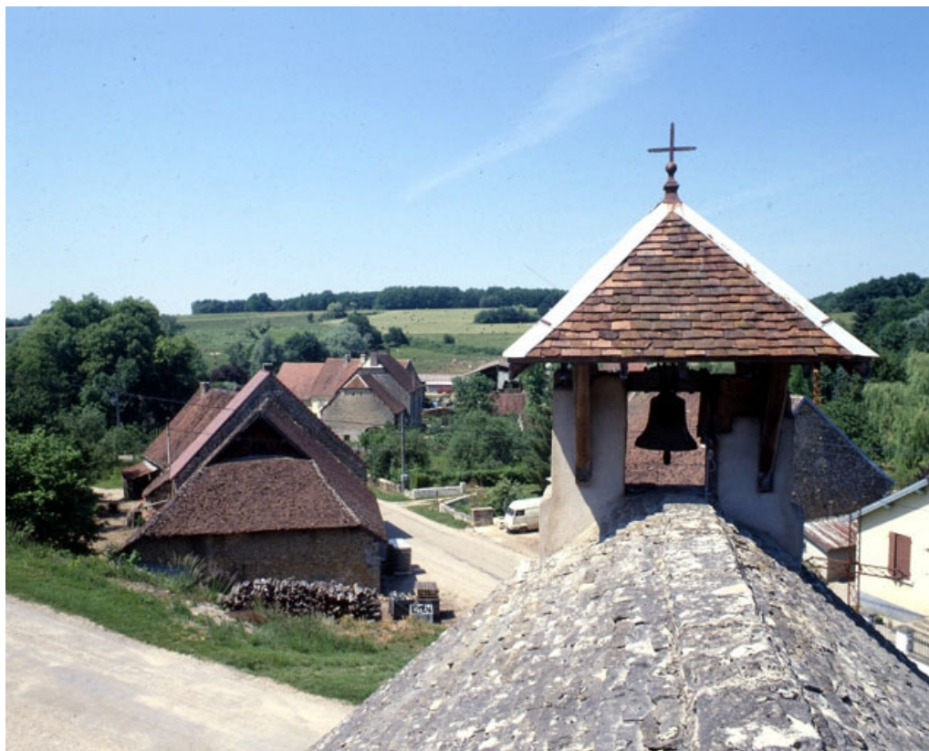
Clocher et toit en lave de la chapelle.