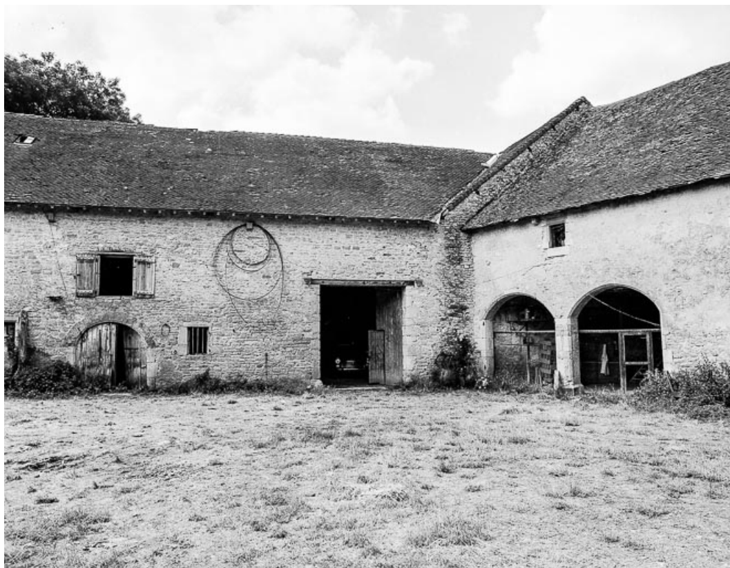
Bâtiments agricoles, élévation sur cour, détail. 39, Quintigny