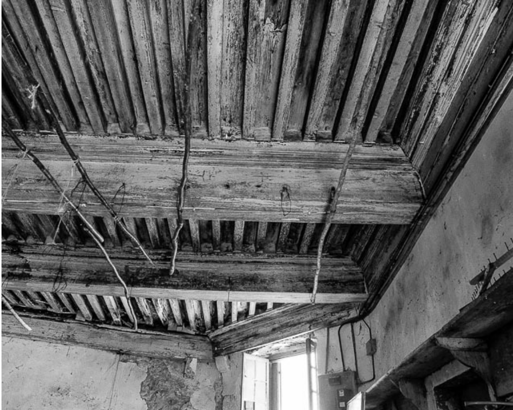
Corps de logis, plafond de la grande salle. 39, Quintigny