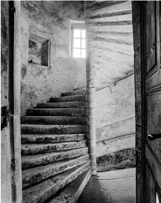
Corps de logis, l'escalier.