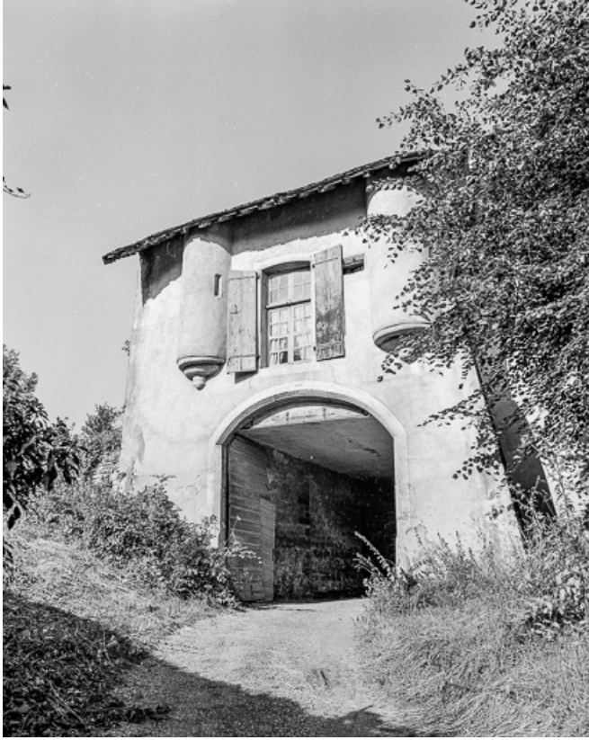
Le porche d'entrée, élévation du côté de l'extérieur. 39, Quintigny