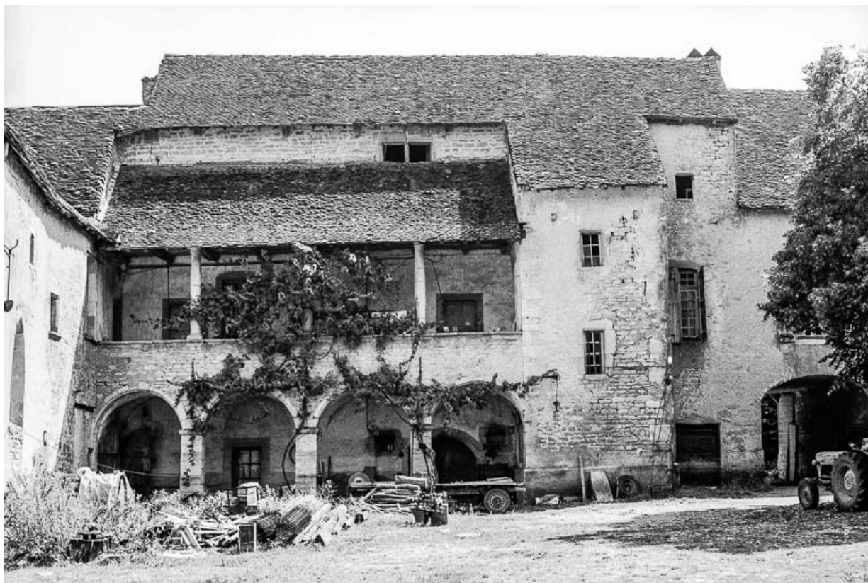
Corps de logis : la galerie. 39, Quintigny