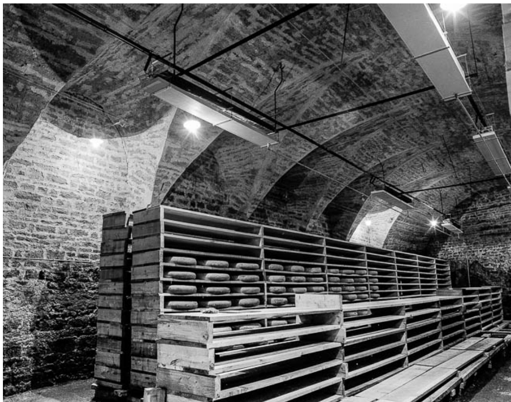
Partie agricole : cave, mur gauche. 39, Quintigny