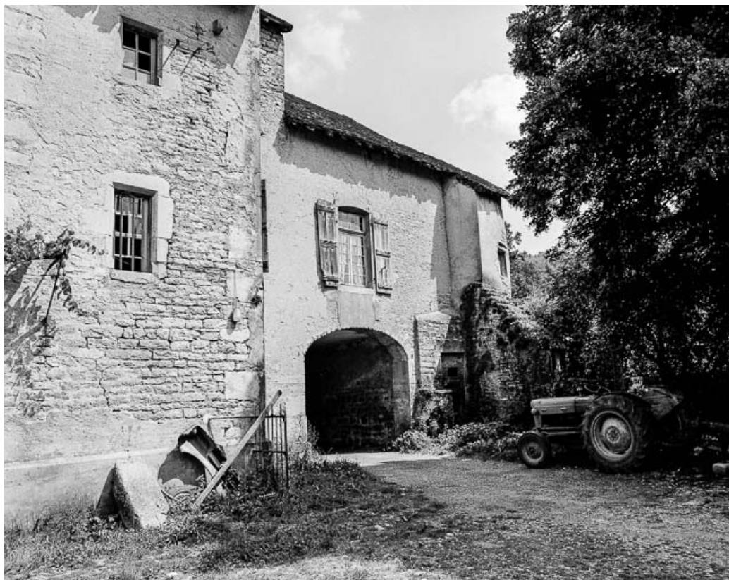
Porche d'entrée, élévation sur la cour. 39, Quintigny