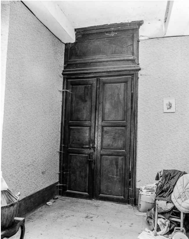
Corps de logis, détail d'une porte intérieure. 39, Quintigny