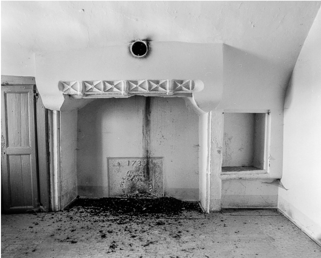
Corps de logis, cheminée.