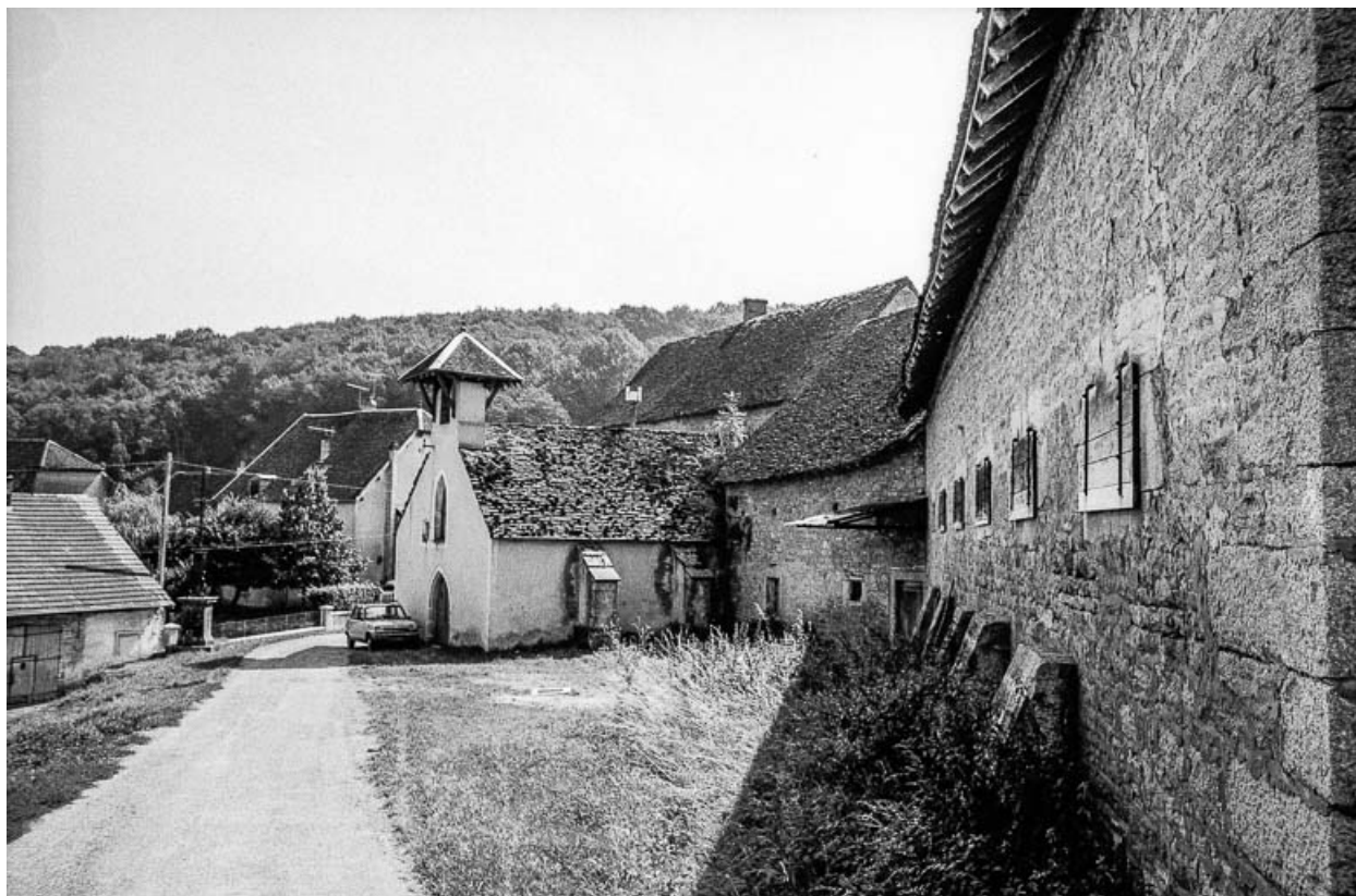
Chapelle et parties agricoles : façades sur rue. 39, Quintigny