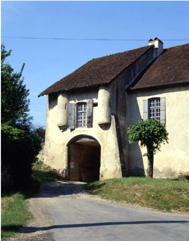
Bâtiment d'entrée : porche.