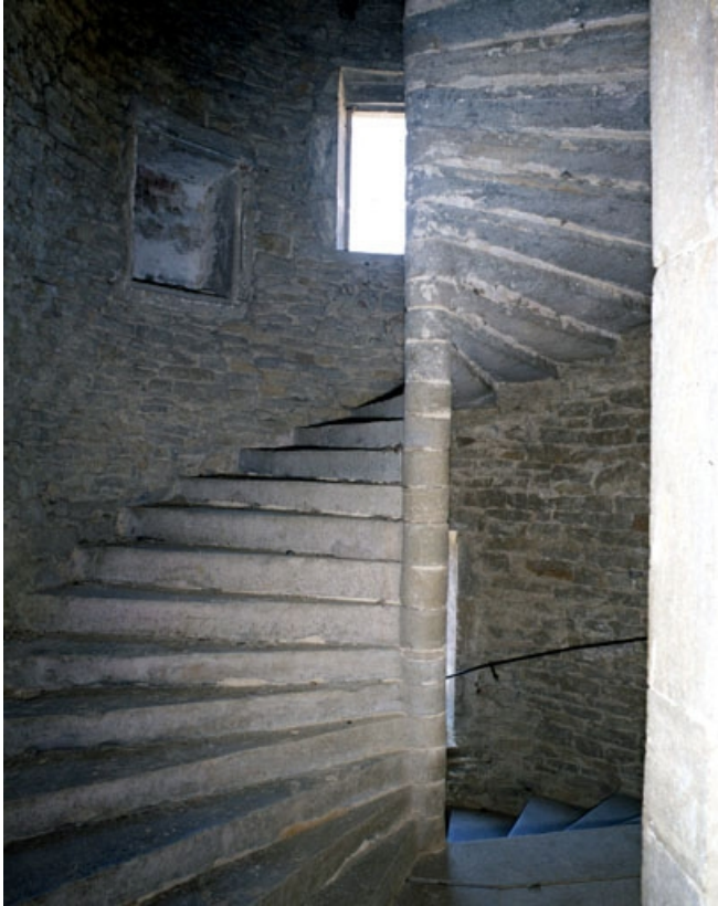
Escalier en vis de la tourelle.