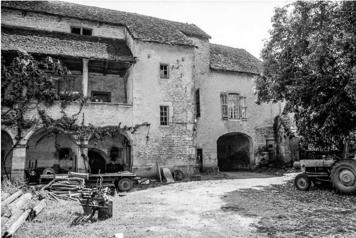
Façade sur cour avec la galerie. 39, Quintigny