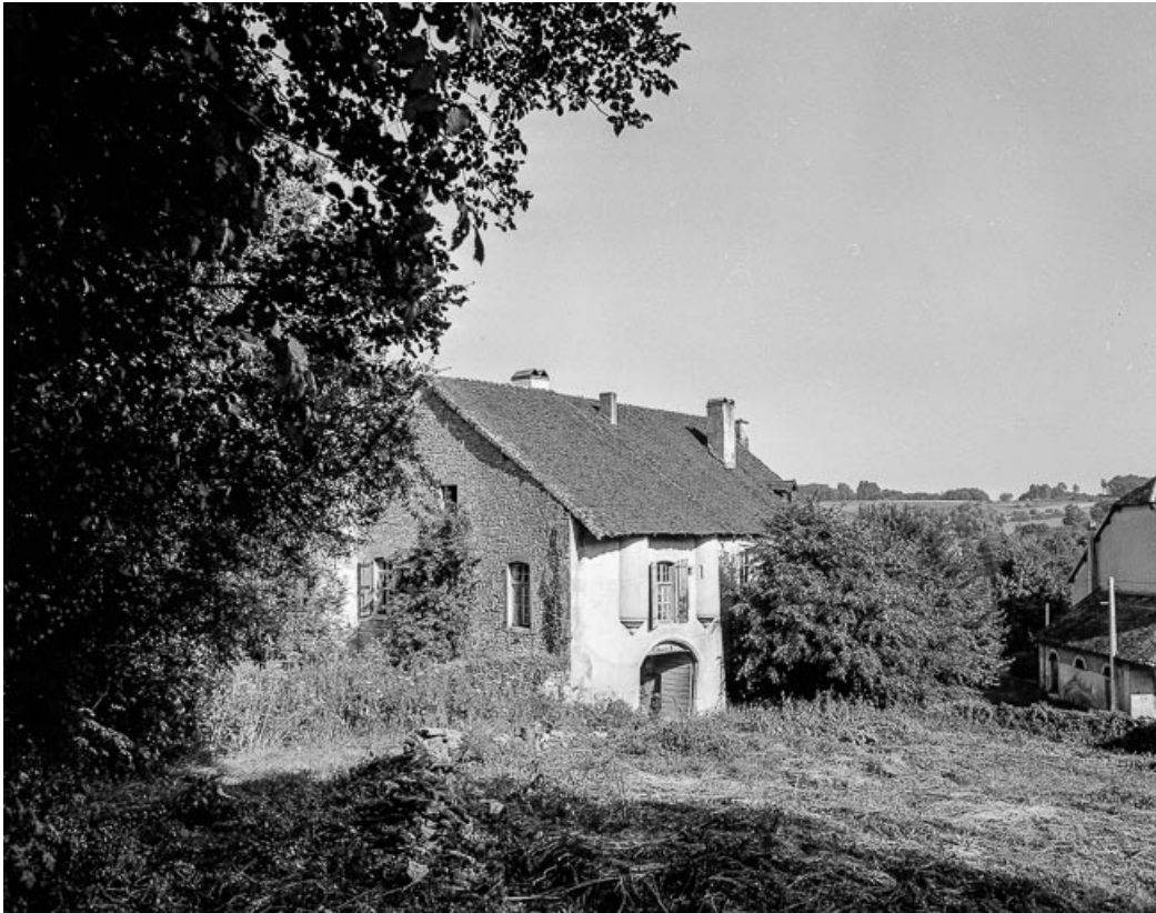
Porche d'entrée et corps de logis, élévation du côté de l'extérieur. 39, Quintigny