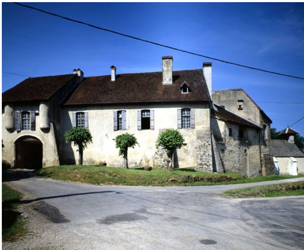
Façade antérieure. 39, Quintigny