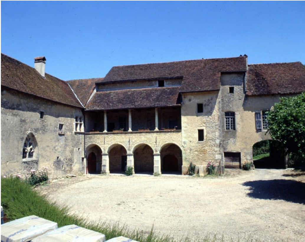
Galleries de la cour intérieure.