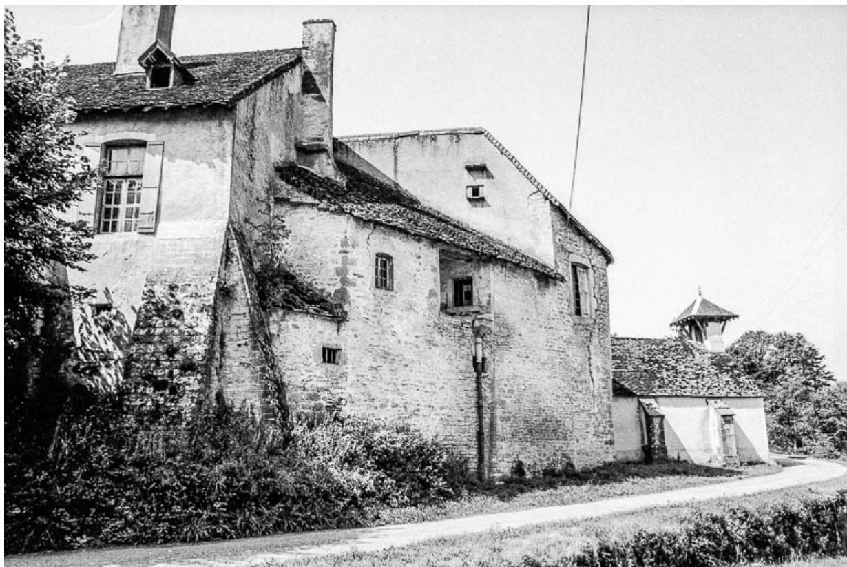
Corps de logis : façade sur rue et chapelle. 39, Quintigny