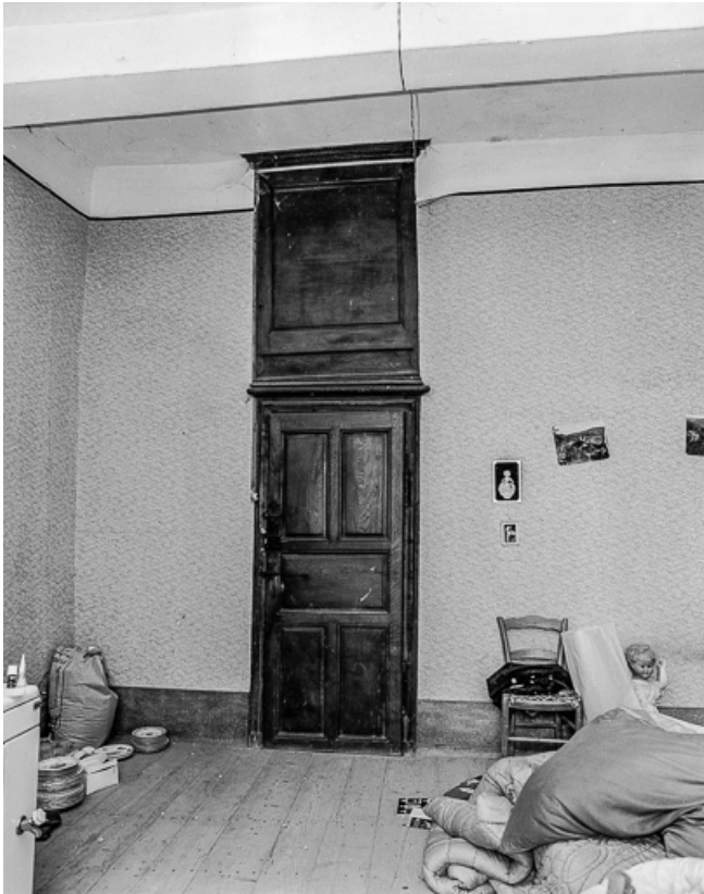
Corps de logis, détail d'une porte intérieure. 39, Quintigny