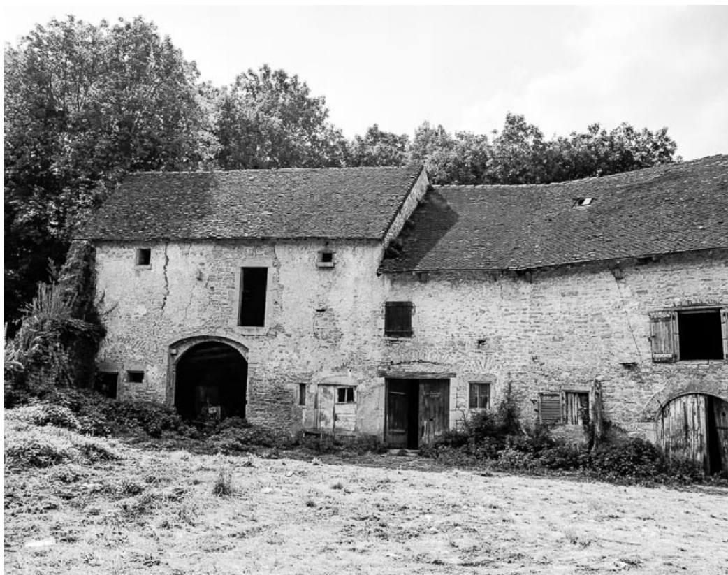
Bâtiments agricoles, élévation sur cour. 39, Quintigny