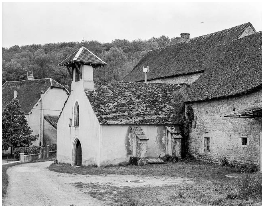
La chapelle, façade antérieure et face droite. 39, Quintigny