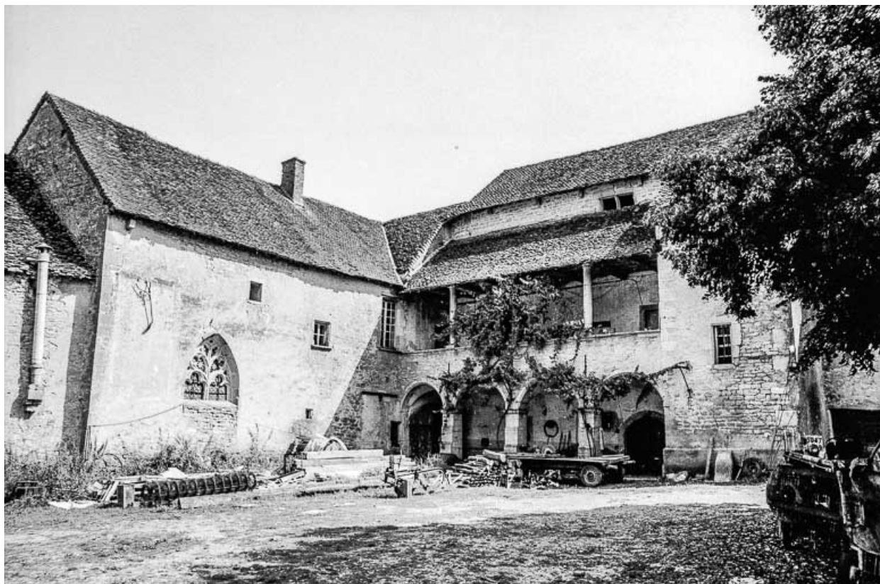
Galerie du corps de logis et partie comprenant une chapelle. 39, Quintigny