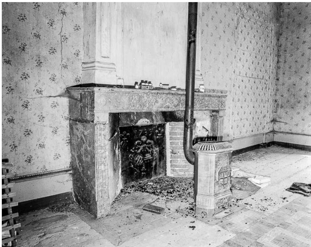
Corps de logis, cheminée. 39, Quintigny