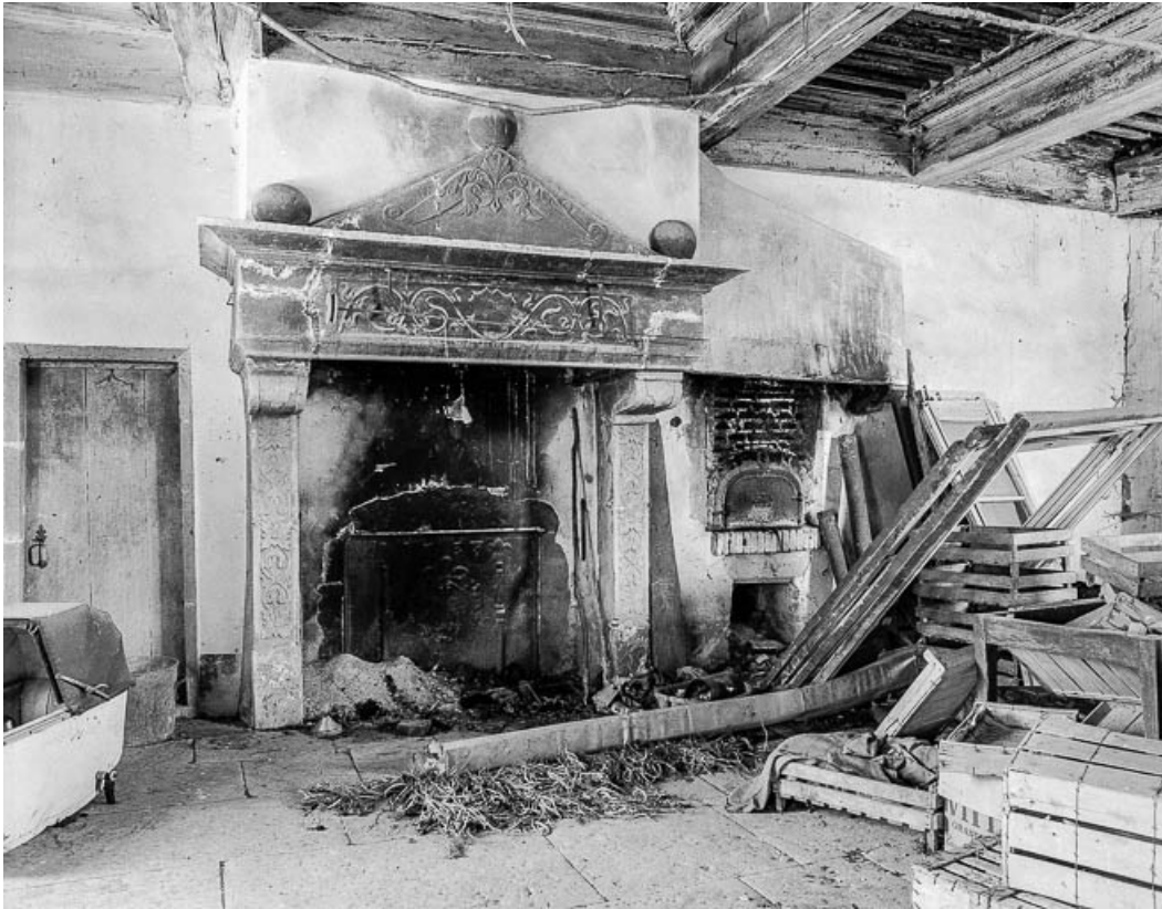
Corps de logis, cheminée de la grande salle. 39, Quintigny