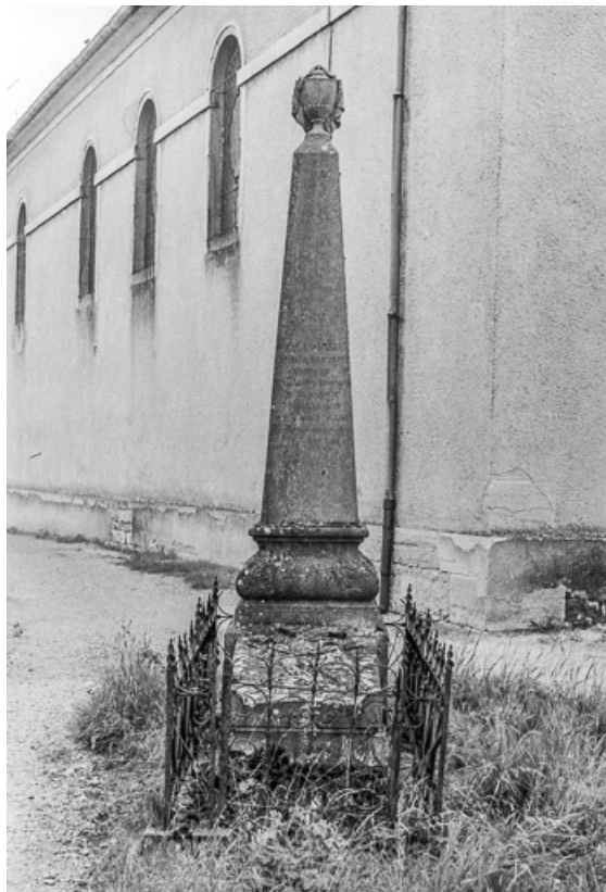
Monument sépulcral daté de 1864, devant l'église : face antérieure.