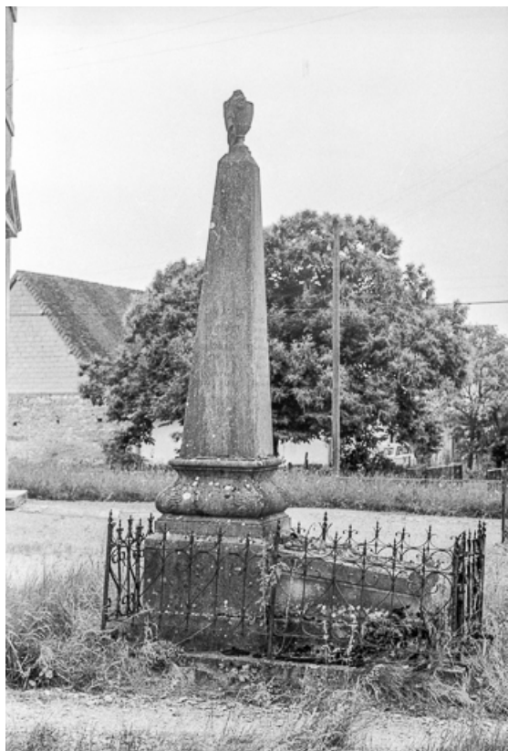
Monument sépulcral daté de 1864, devant l'église : face latérale.