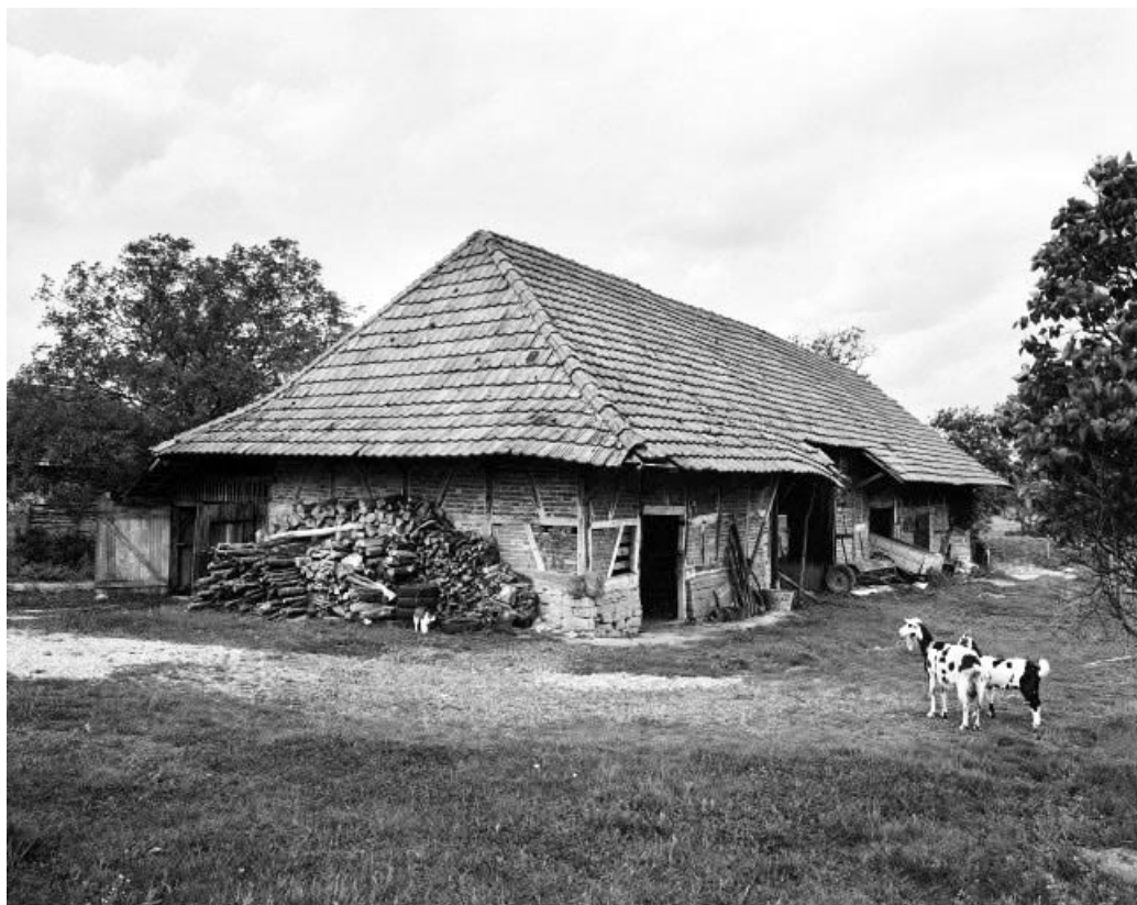
Bâtiment d'exploitation : façades antérieure et latérale gauche.

39, Cosges rue du Cordeau, lieudit : Sottessard