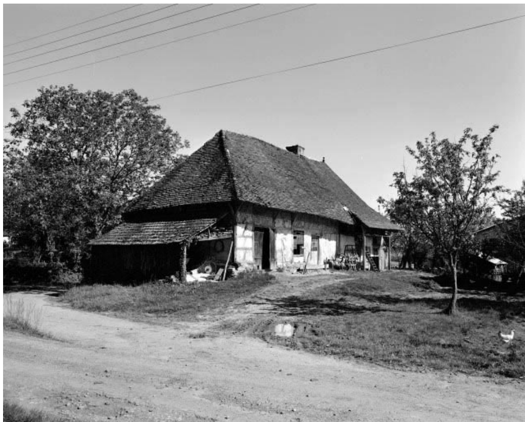
Façades antérieure et latérale gauche en 1979.

39, Cosges rue du Moulin de Jousseau, lieudit : Jousseau