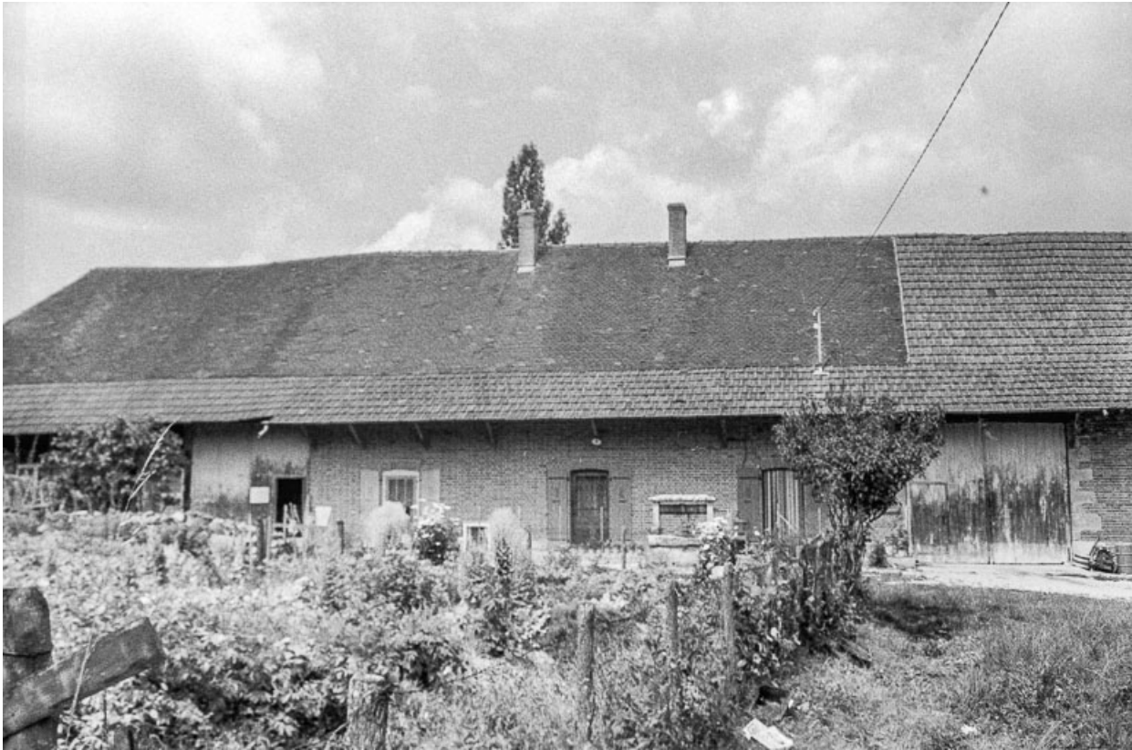
Ferme et son jardin.