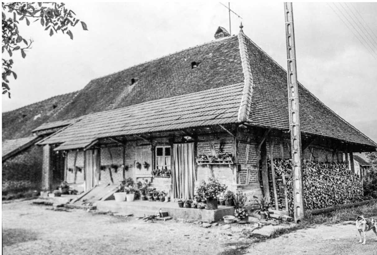
Ferme cadastrée 1811 B 5, située au lieu-dit Jousseau, partie habitation : façade antérieure. 39, Cosges