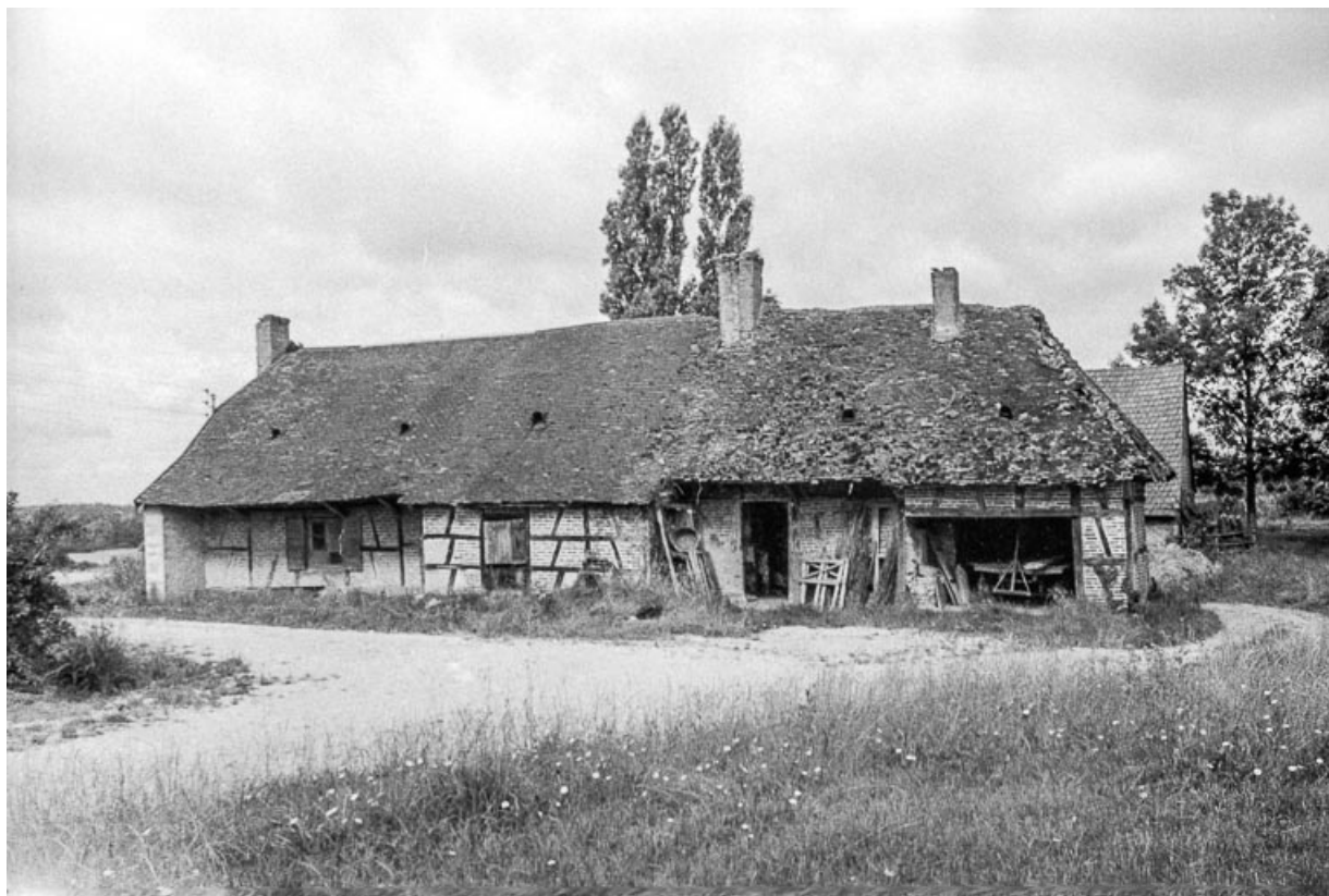
Ferme cadastrée 1811 B 5, située au lieu-dit Jousseau : vue générale. 39, Cosges