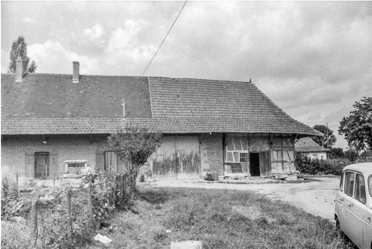
Ferme et son jardin : partie droite.