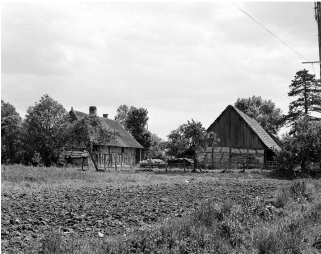
Vue d'ensemble avec le bâtiment agricole en 1979.

39, Cosges, 57 rue de Bourgogne, lieudit : Sottessard