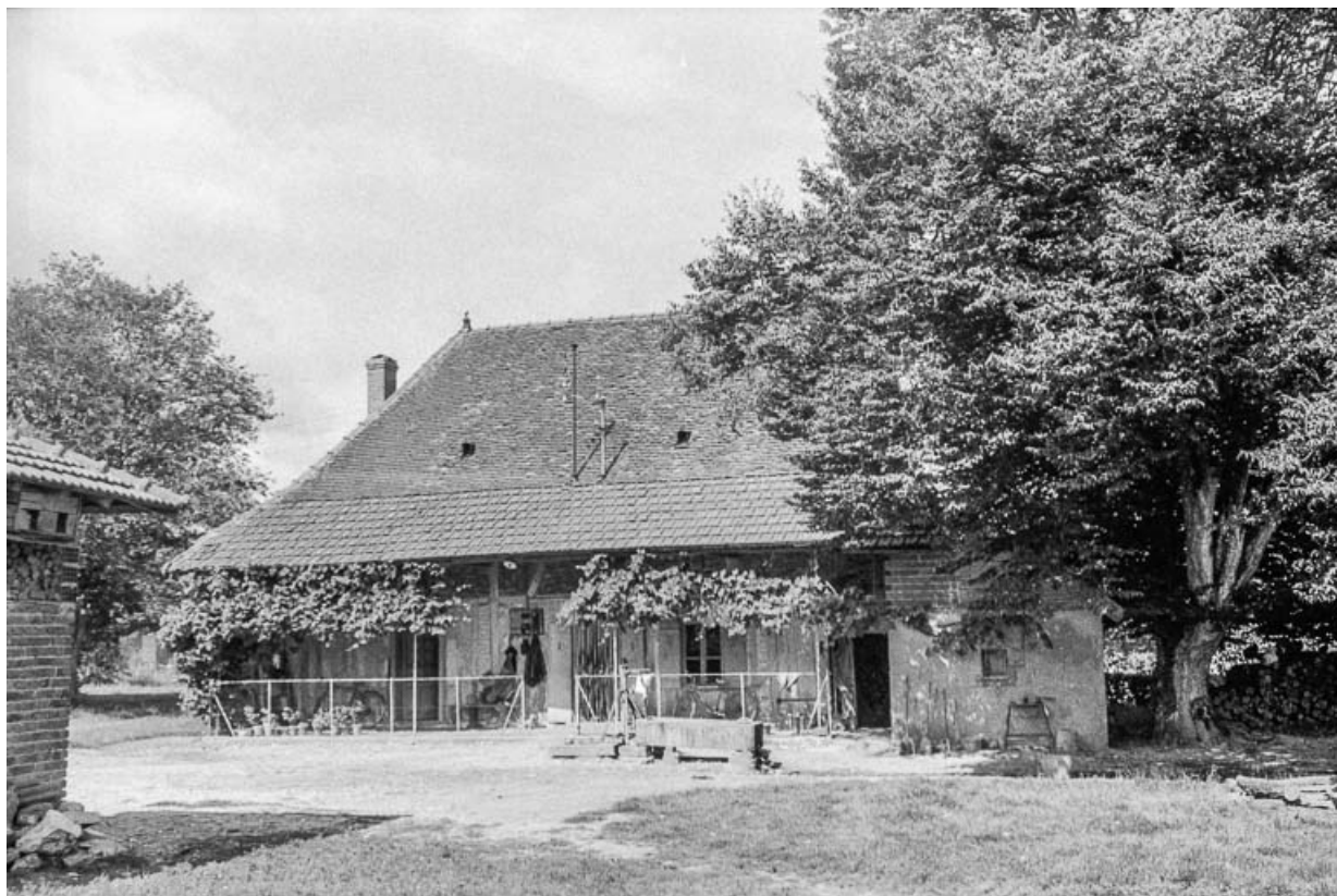
Ferme cadastrée 1811 B 1, située au lieu-dit Vizent : vue générale. 39, Cosges