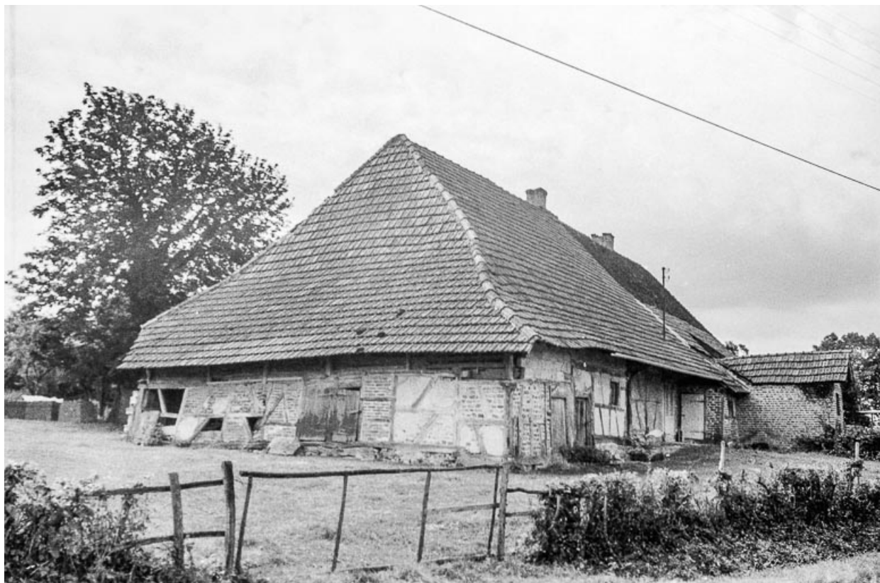
Ferme cadastrée 1811 B 5, située au lieu-dit Jousseau : vue générale. 39, Cosges