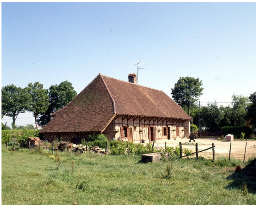
Ferme située au lieu-dit Sottessard : vue de trois-quarts gauche. 39, Cosges