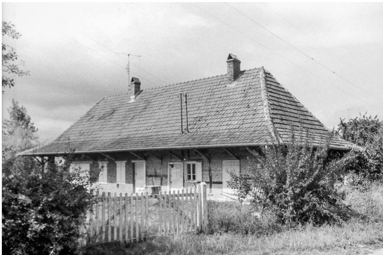
Ferme cadastrée 1811 B 1, située au lieu-dit Vizent : vue générale. 39, Cosges