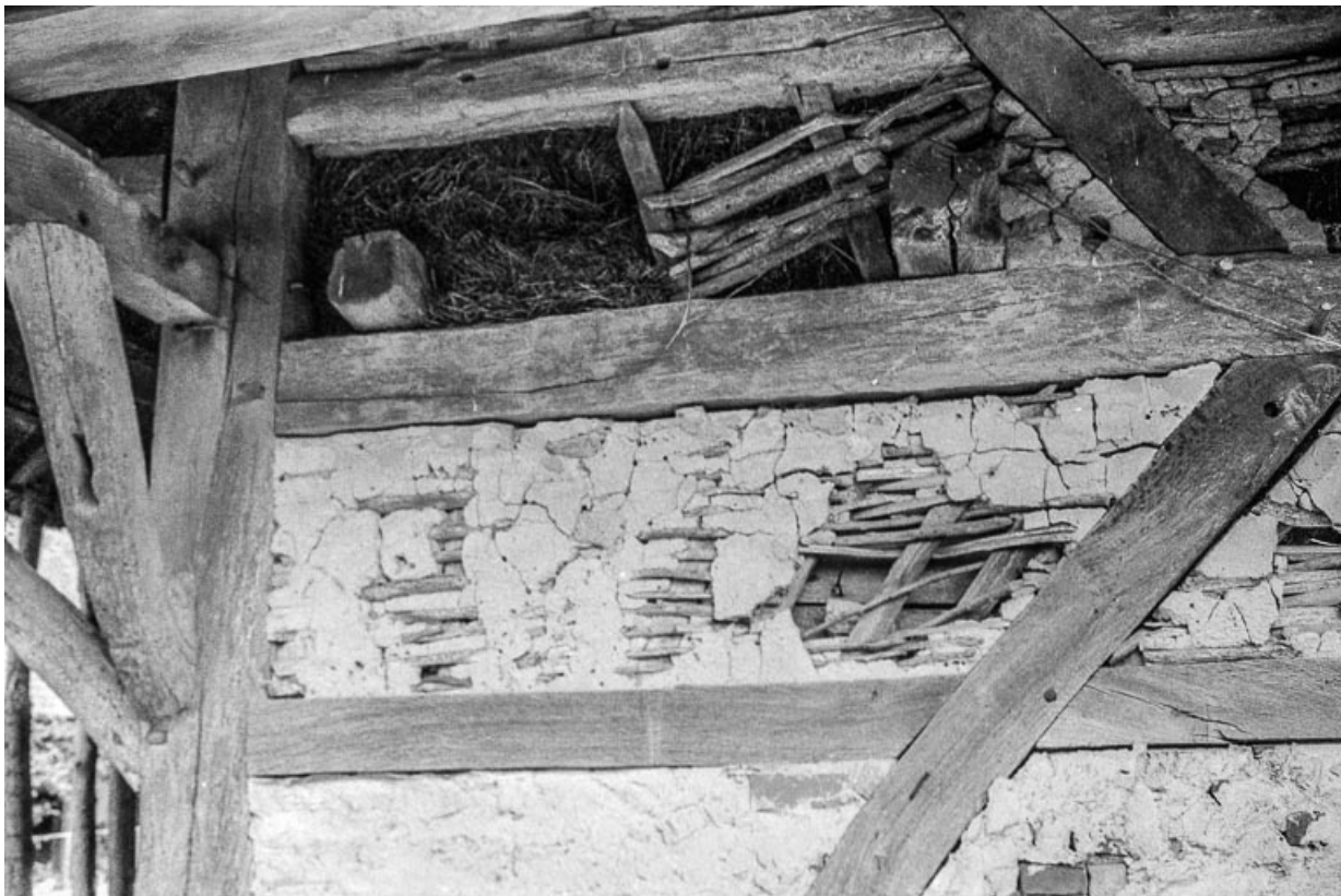
Ferme cadastrée 1811 B 1, située au lieu-dit Vizent : détail du mur. 39, Cosges