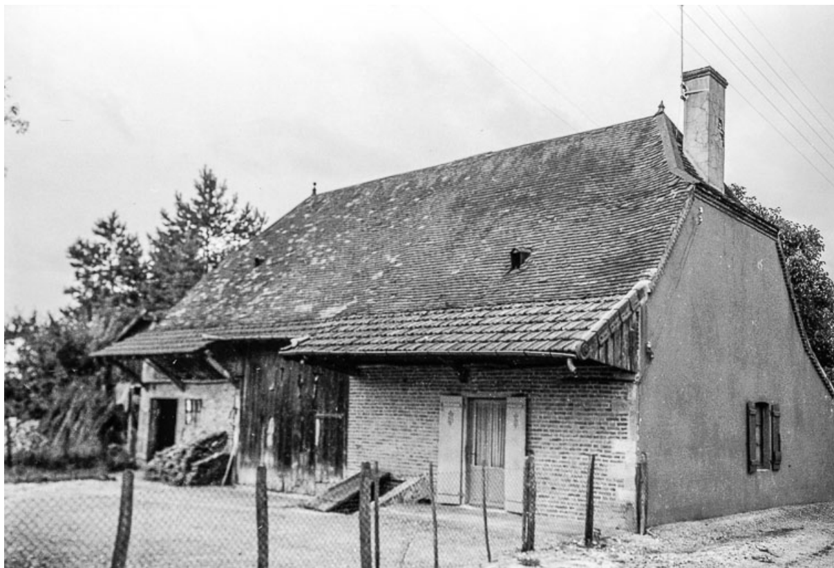
ferme cadastrée 1811 B 5, située au lieu-dit Jousseau : vue générale. 39, Cosges