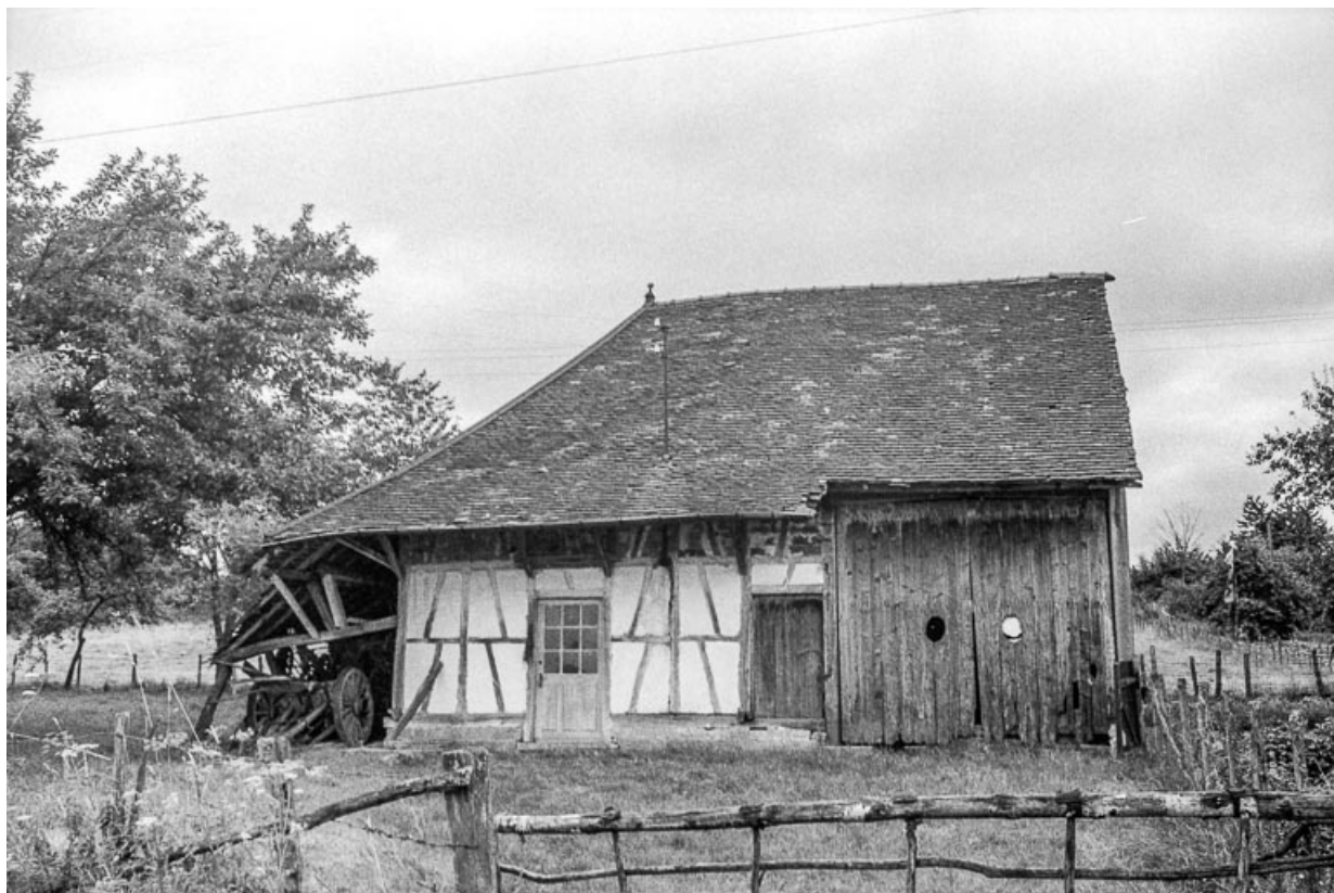
ferme cadastrée 1811 B 4 : vue générale. 39, Cosges