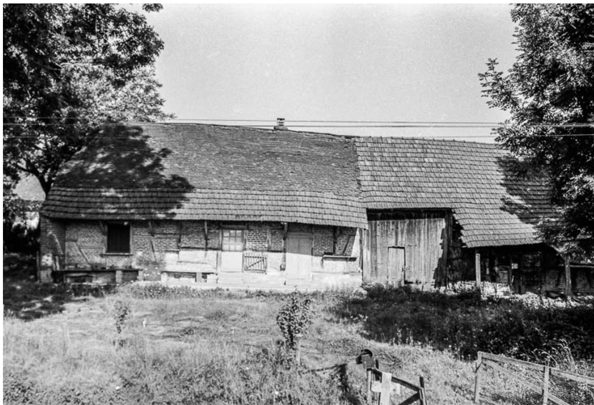
Ferme cadastrée 1811 B 1, située au lieu-dit Vizent : vue générale. 39, Cosges