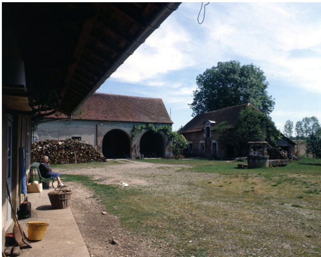
Façade antérieure du bâtiment d'habitation et bâtiments d'exploitation autour de la cour. 39, Chapelle-Voland