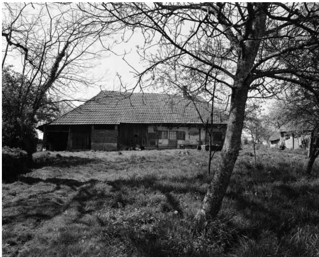
Façade antérieure. 39, Chapelle-Voland