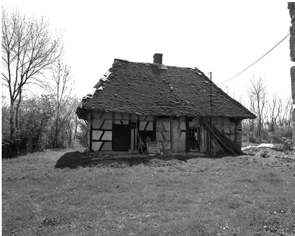
Ferme cadastrée 1969 AL 137 : vue d'ensemble. 39, Chapelle-Voland