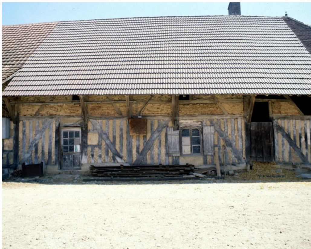
Bâtiment d'habitation : façade antérieure.