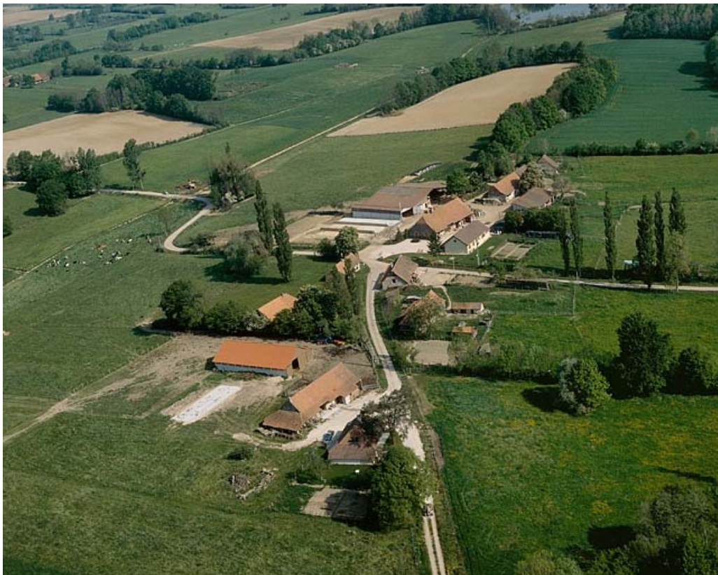
Vue aérienne du village.