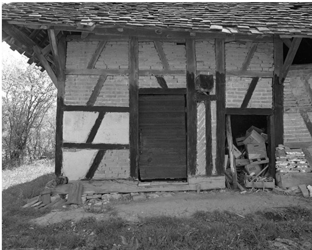
Ferme cadastrée 1969 AL 137 : vue du colombage. 39, Chapelle-Voland