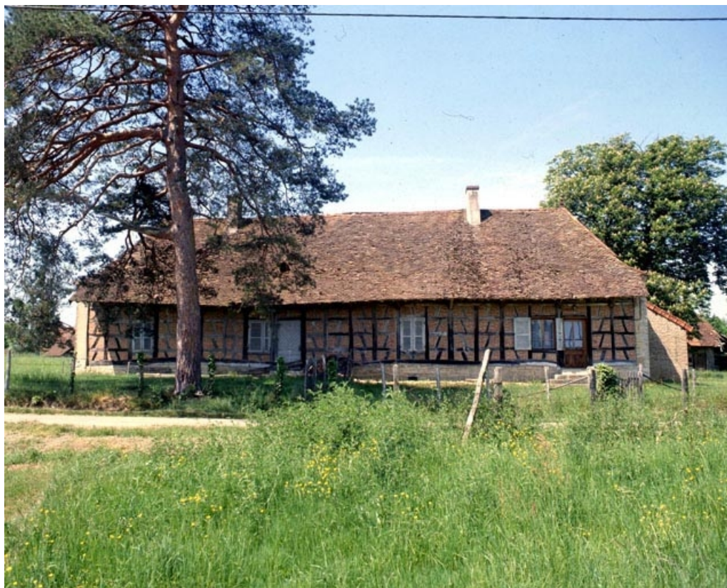
Bâtiment d'habitation vu de face en 1990.

39, Chapelle-Voland 1ère ferme, lieudit : les Piotelats