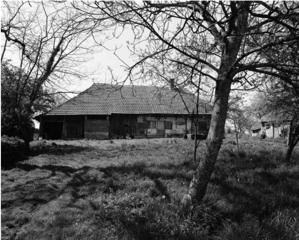
Façade antérieure. 39, Chapelle-Voland