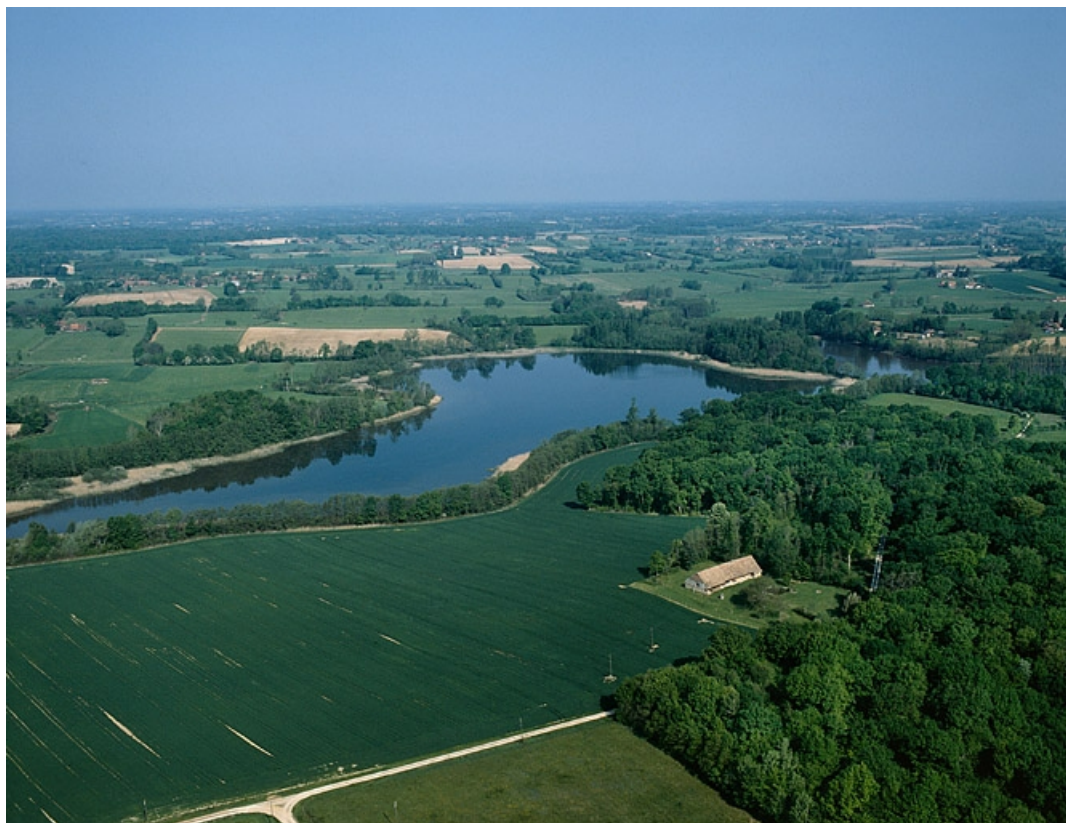
Vue aérienne de l'étang Vaillant et d'une ferme.