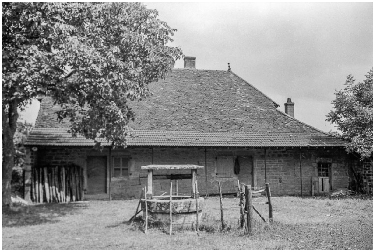
Bâtiment d'habitation : façade antérieure.