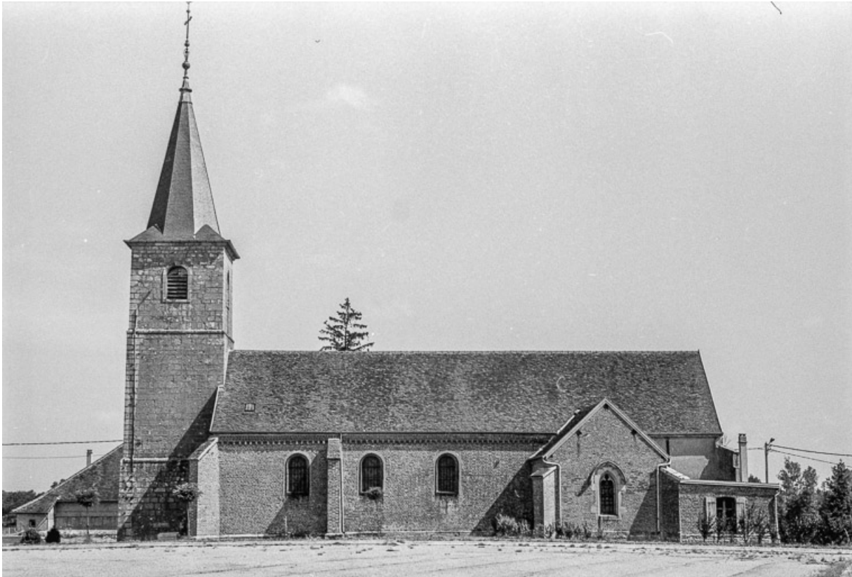
Façade latérale droite.