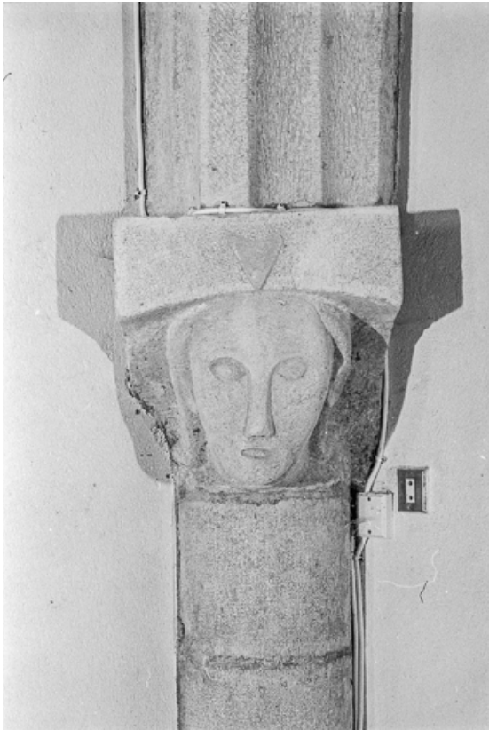
Intérieur : culot sculpté (tête).