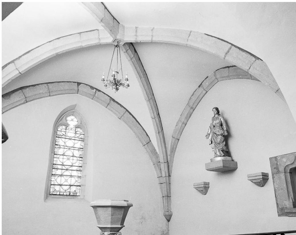
Voûte de la chapelle à gauche du chœur.