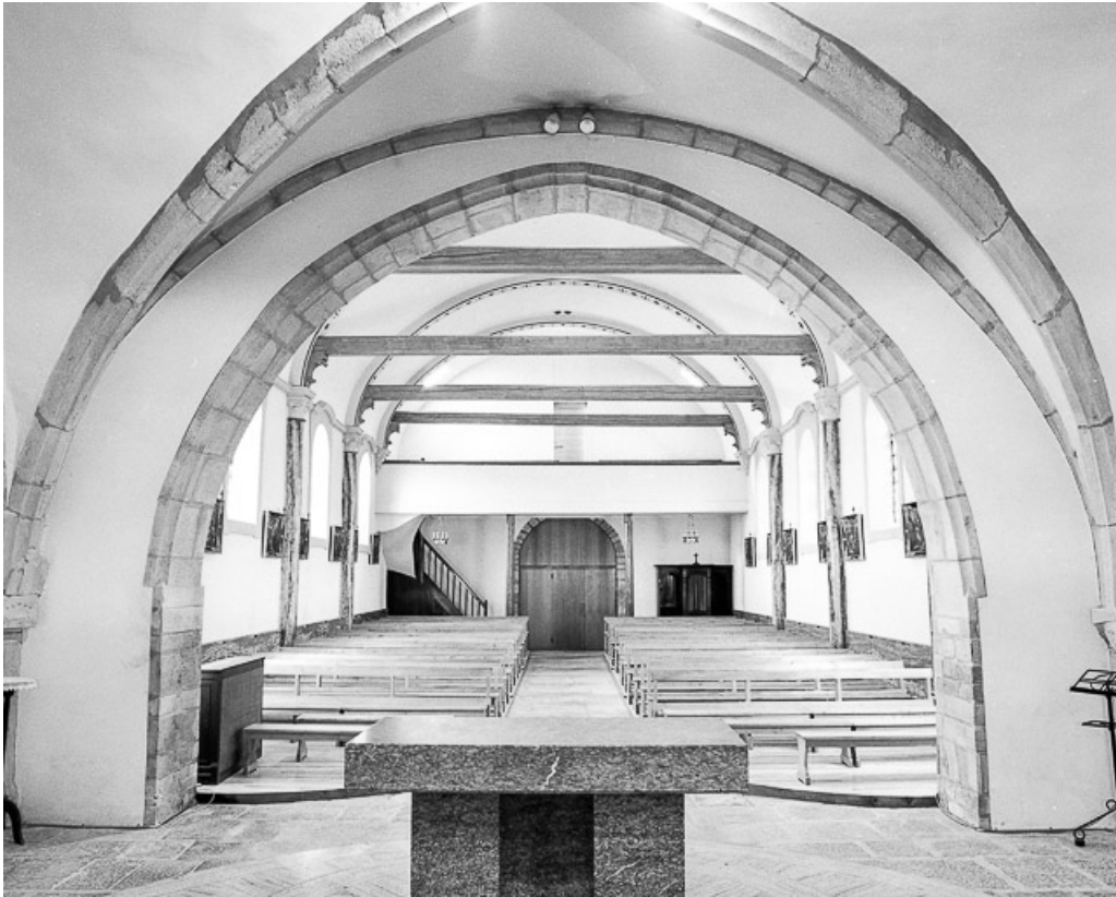
Nef vue du chœur.