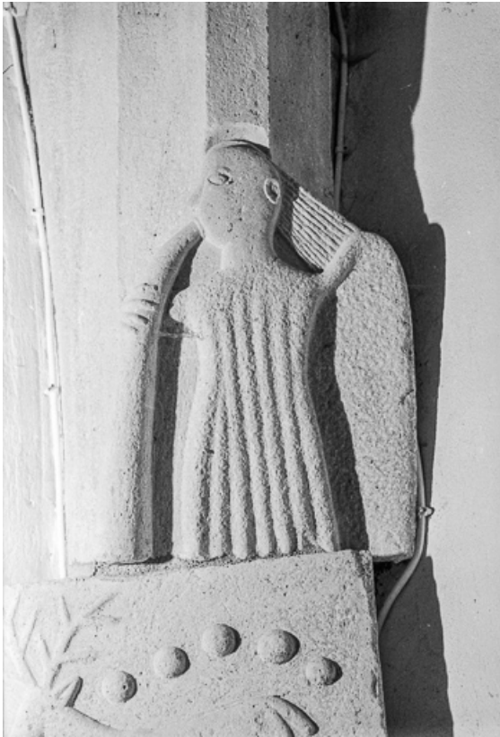
Intérieur : culot sculpté représentant un personnage jouant d'un instrument.