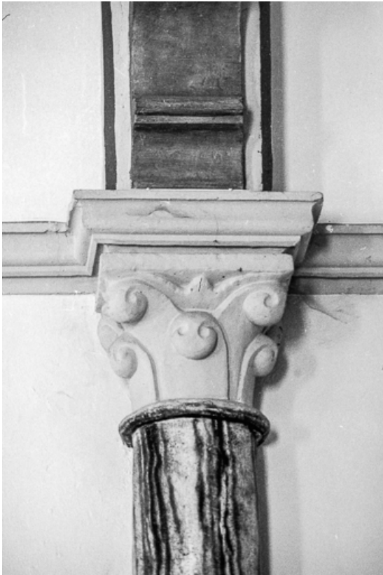
Intérieur : chapiteau.