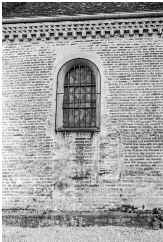
Extérieur : baie latérale.