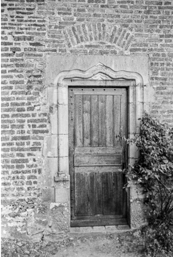
Extérieur : porte latérale.