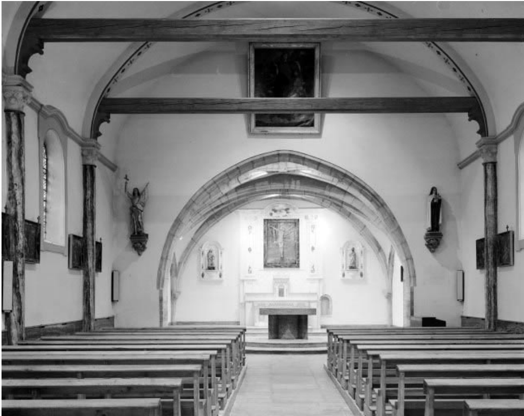
Nef et chœur vus depuis l'entrée.