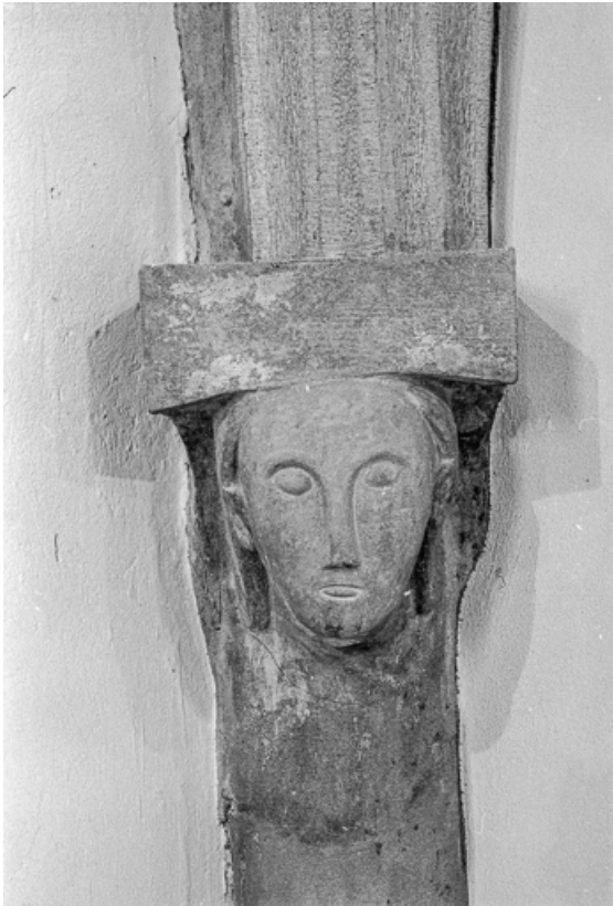
Intérieur : culot sculpté (tête).