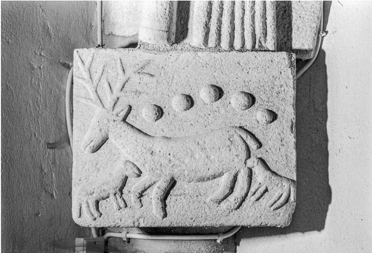
Intérieur : culot sculpté représentant un cerf attaqué par deux loups.