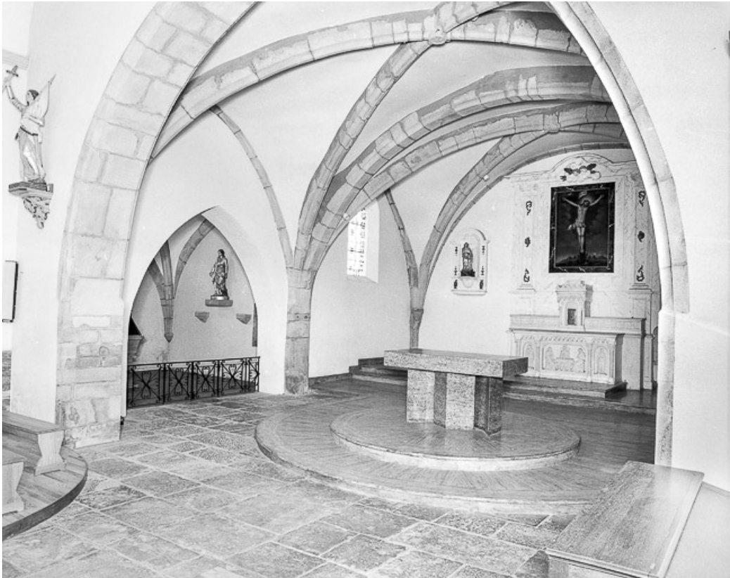
Choeur : élévation gauche.