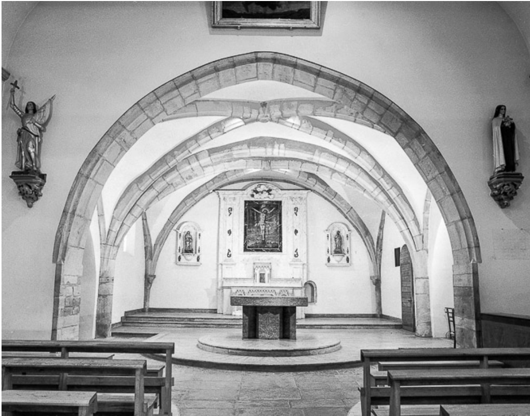
Choeur vu de la nef.