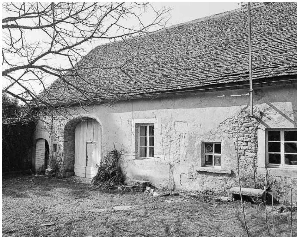
Façade antérieure : partie gauche.