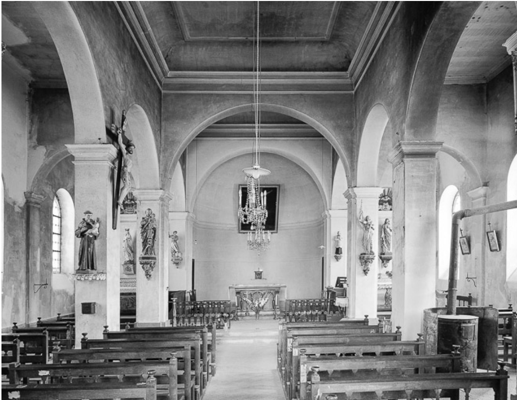
Intérieur : nef et chœur vus depuis l'entrée.