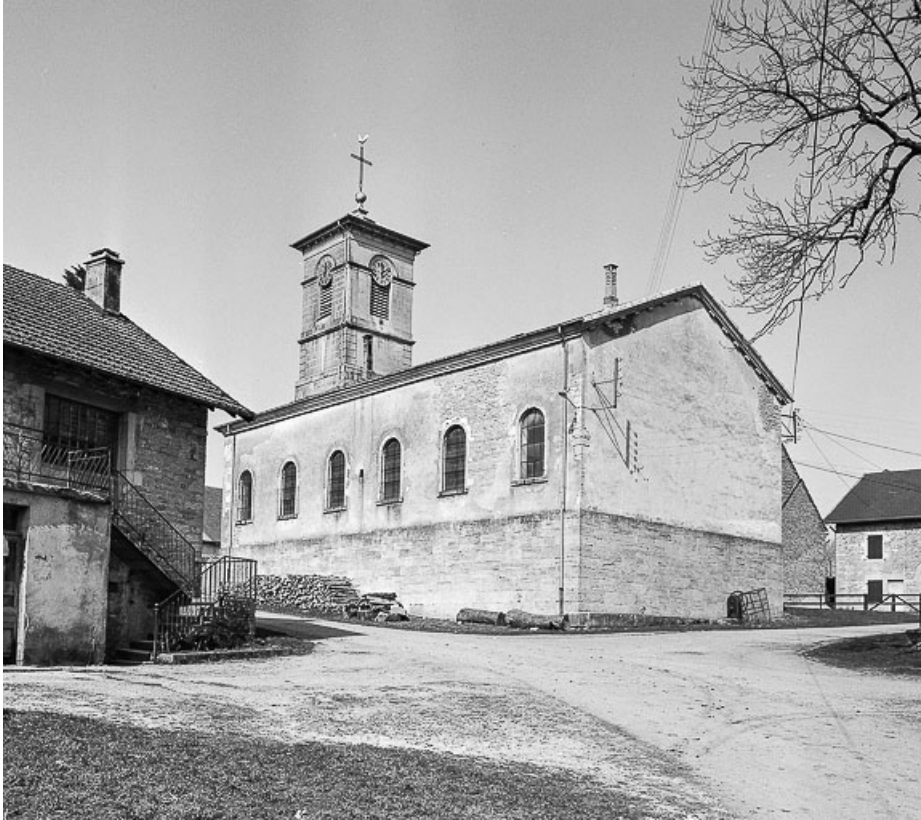
Extérieur : face latérale droite et chevet.