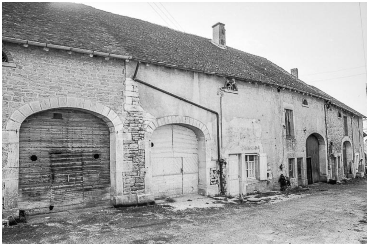
Porte de grange et fermes voisines.