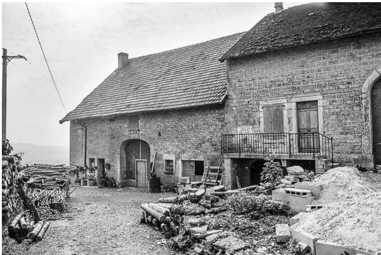
Ferme cadastrée D2 284 : façade antérieure. 39, Saint-Maur