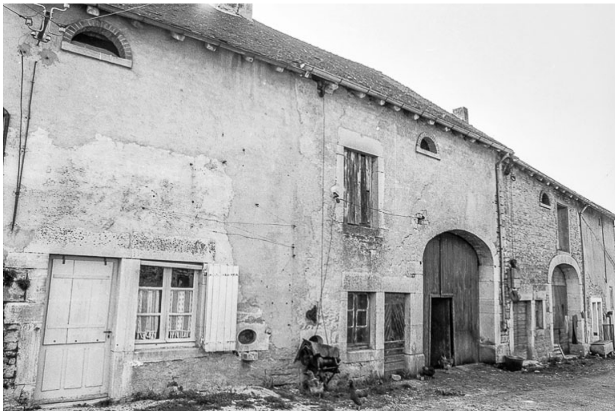
Ferme cadastrée D2 292 : façade antérieure. 39, Saint-Maur