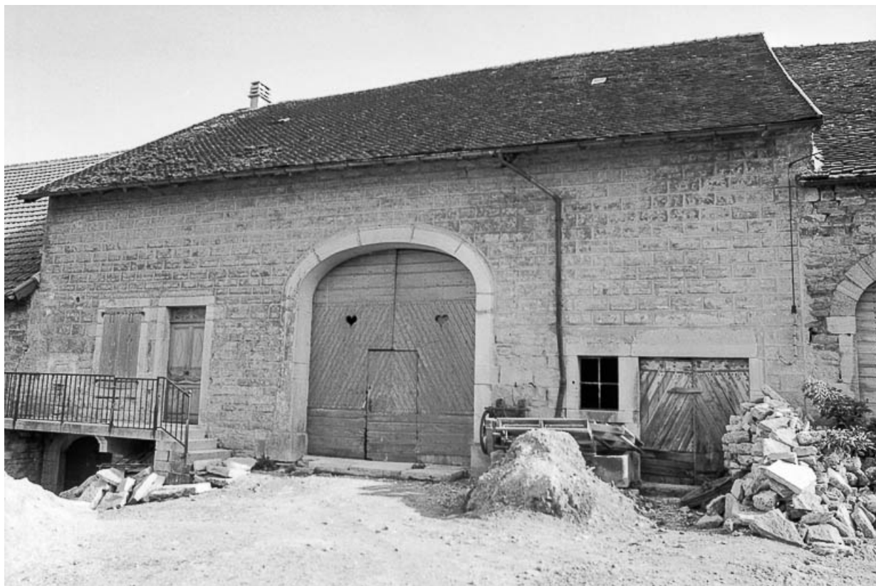
Ferme cadastrée D2 283 : façade antérieure. 39, Saint-Maur