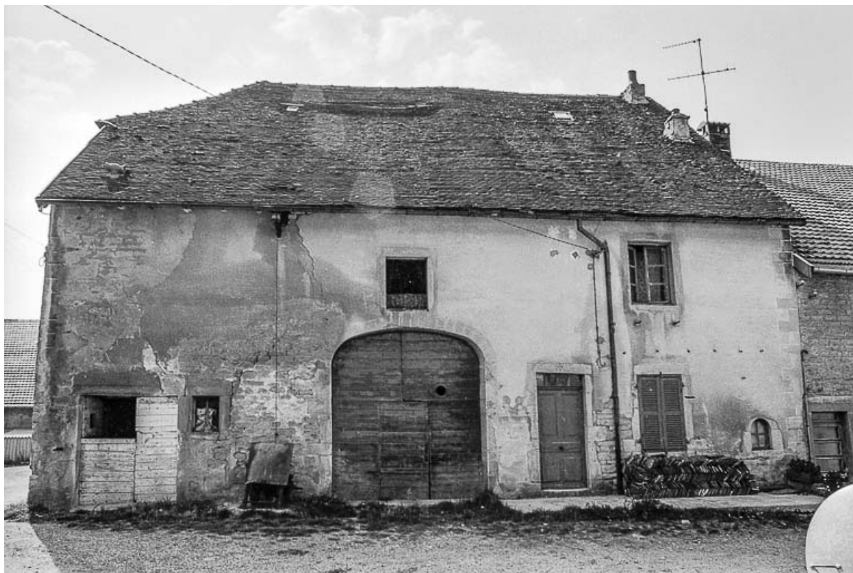
Façade antérieure en 1976.