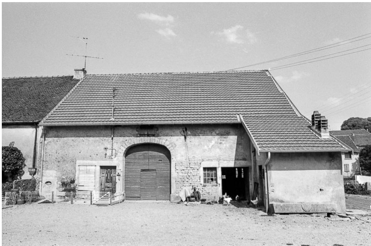
Ferme cadastrée D2 214 : façade antérieure.