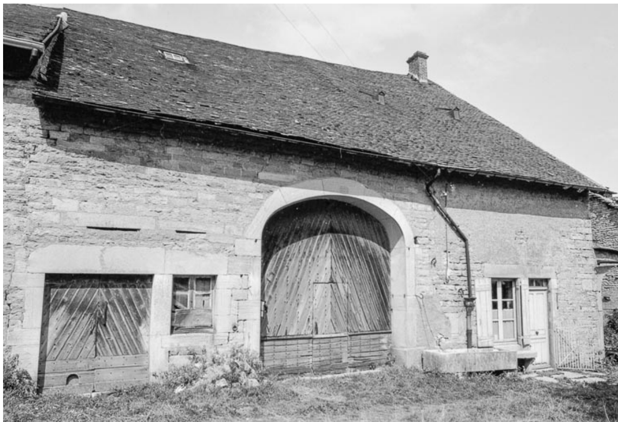
Ferme cadastrée D2 259 : façade antérieure. 39, Saint-Maur