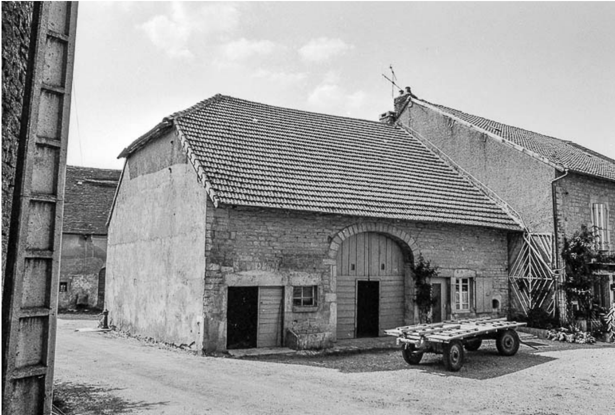
Ferme cadastrée D2 204 : façade antérieure. 39, Saint-Maur