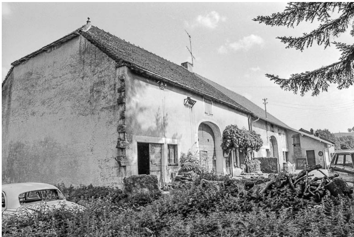
Ferme cadastrée D2 214-215 : vue de trois quarts gauche. 39, Saint-Maur