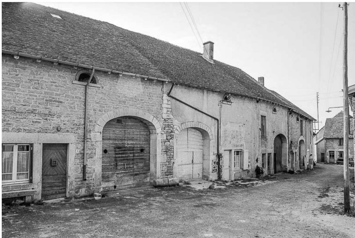
Façades sur rue.