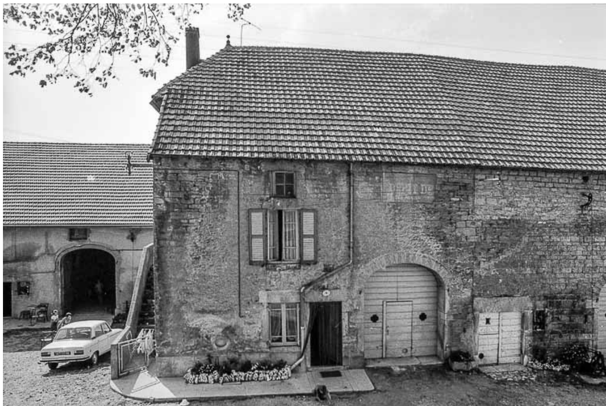
Ferme cadastrée D2 193 : façade antérieure. 39, Saint-Maur