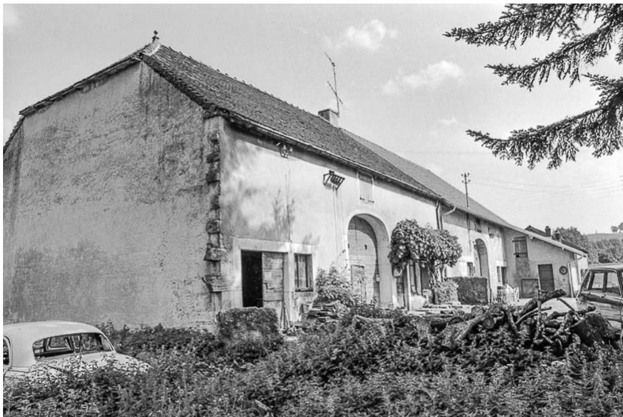
Ferme cadastrée D2 214-215 : vue de trois quarts gauche. 39, Saint-Maur