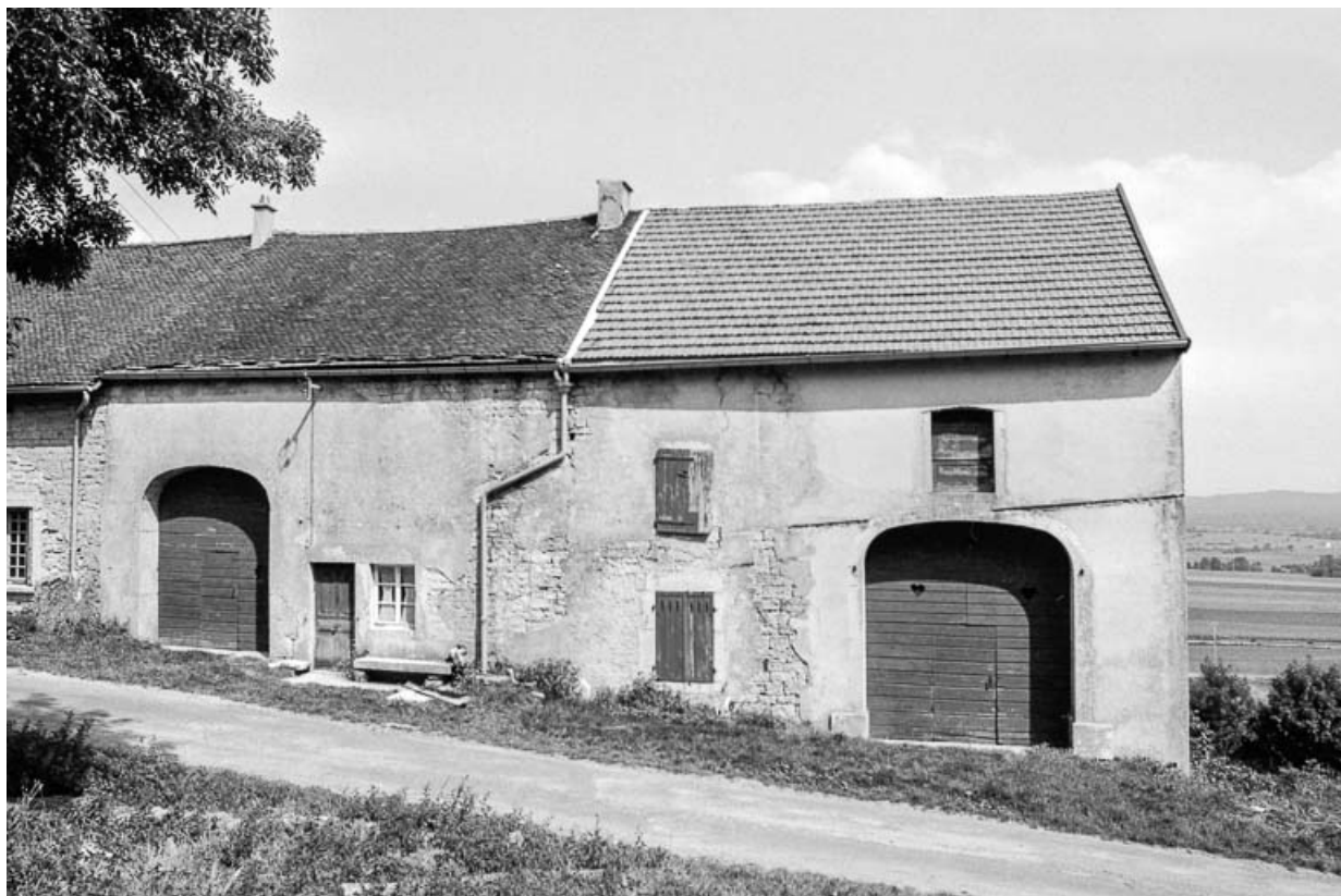
Ferme cadastrée section A : façades sur rue. 39, Saint-Maur