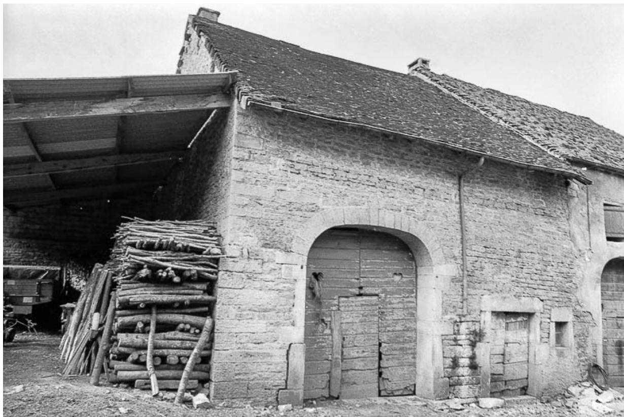
Ferme cadastrée D2 168 : façade antérieure. 39, Saint-Maur