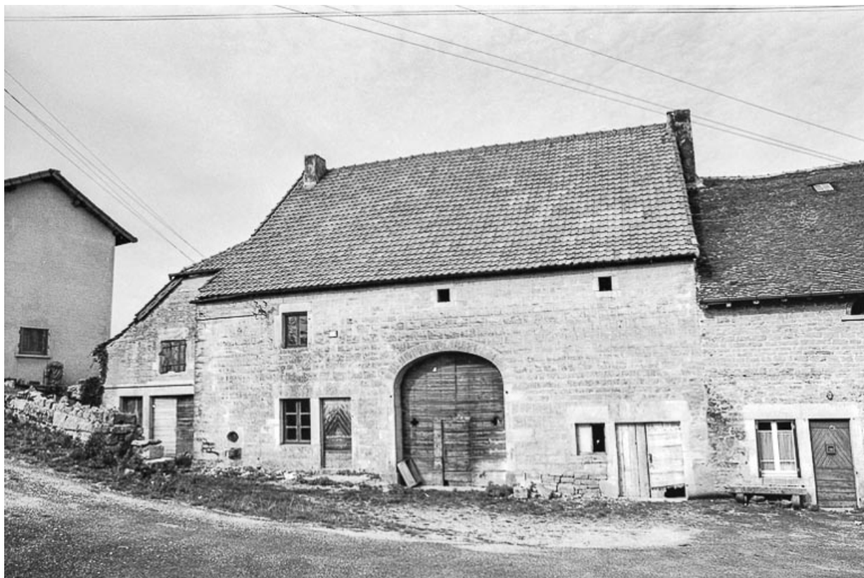
Ferme cadastrée D2 295 : façade antérieure. 39, Saint-Maur