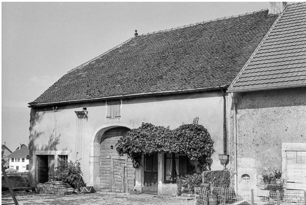
Ferme cadastrée D2 215 : façade antérieure. 39, Saint-Maur