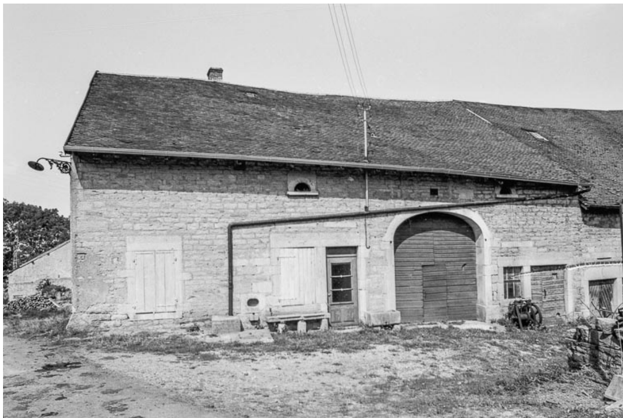
Ferme cadastrée D2 247 : façade antérieure. 39, Saint-Maur