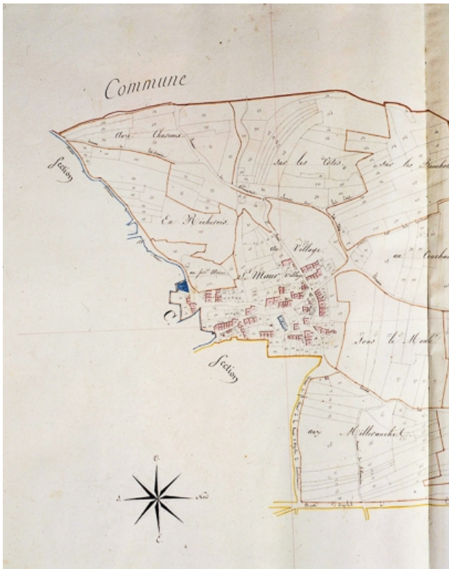
Plan cadastral. 39, Saint-Maur