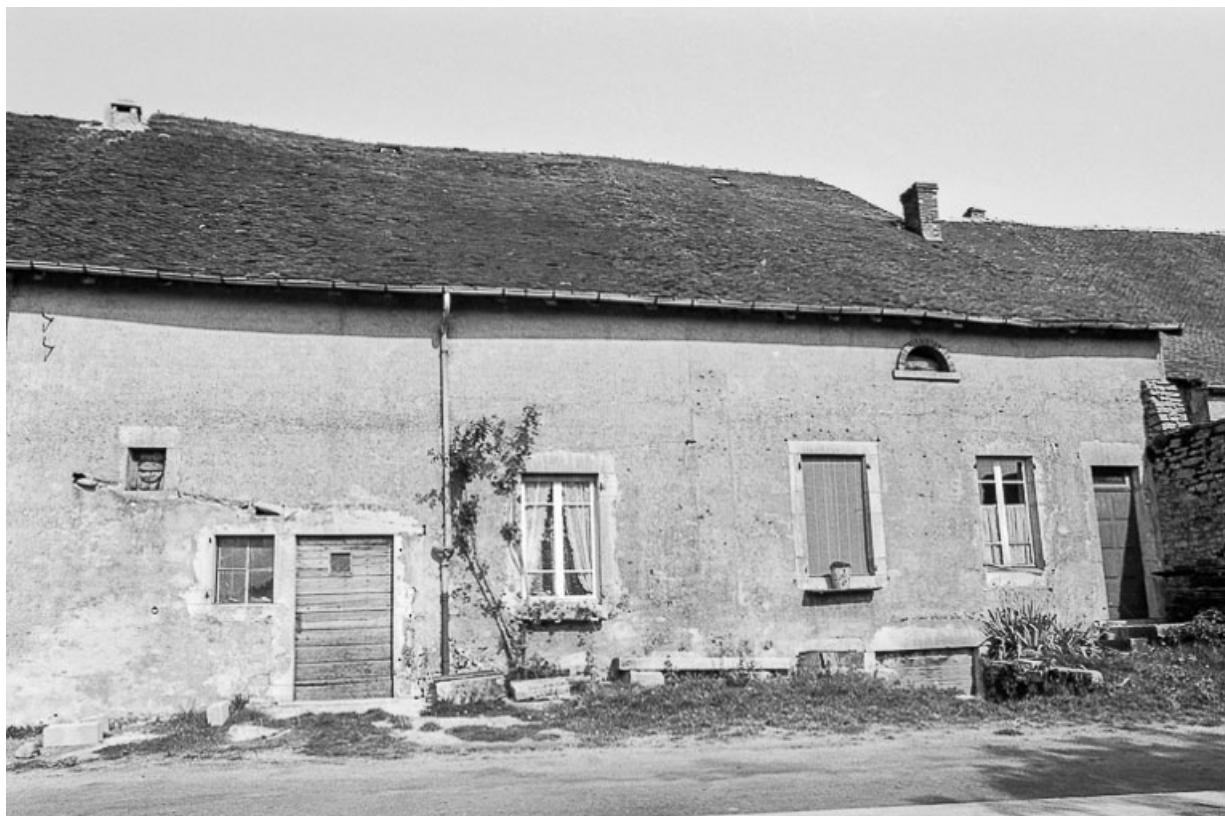
Ferme cadastrée D2 291 : façade postérieure. 39, Saint-Maur