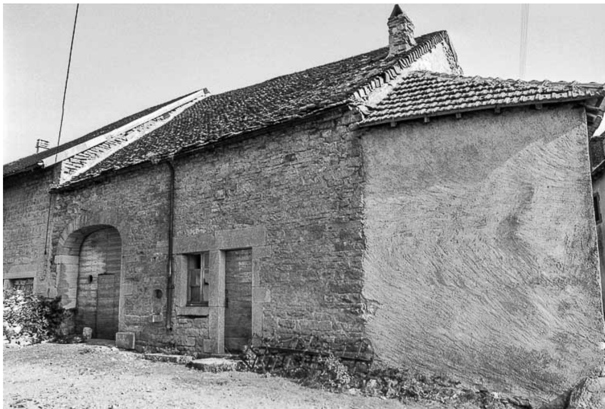
Ferme cadastrée D2 282 : façade antérieure vue de trois quarts droit. 39, Saint-Maur