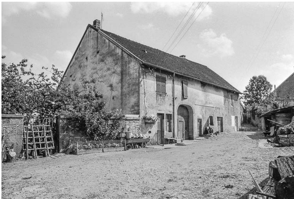
Ferme cadastrée D2 262 et 266 : façade antérieure. 39, Saint-Maur