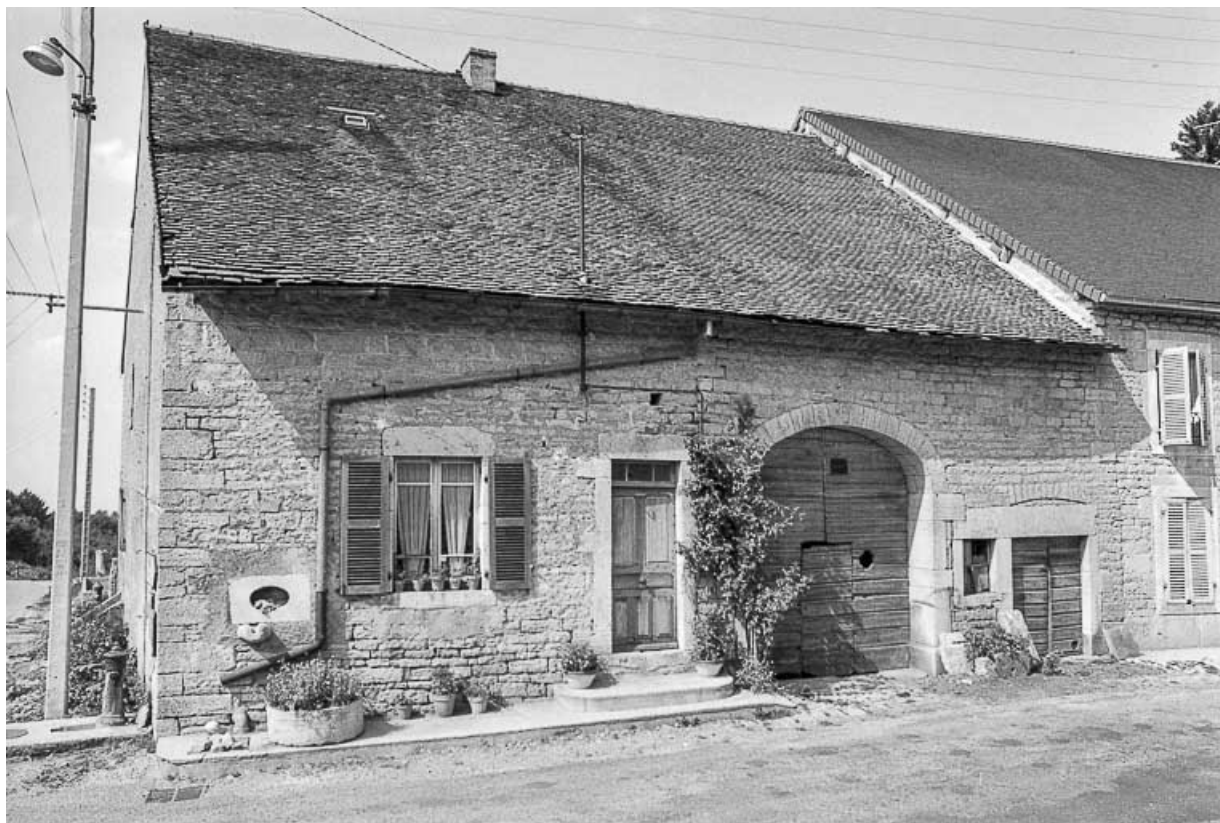
Ferme cadastrée D2 230 : façade antérieure 39, Saint-Maur