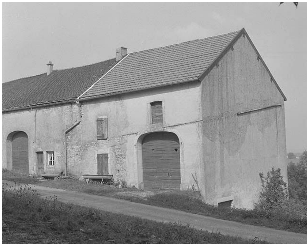
Façade antérieure et face droite.