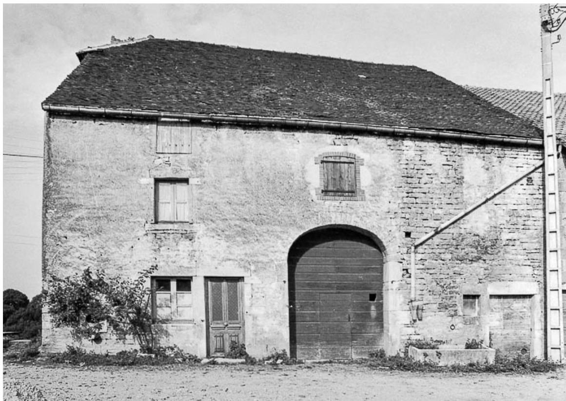
Ferme cadastrée D2 275 : façade antérieure. 39, Saint-Maur