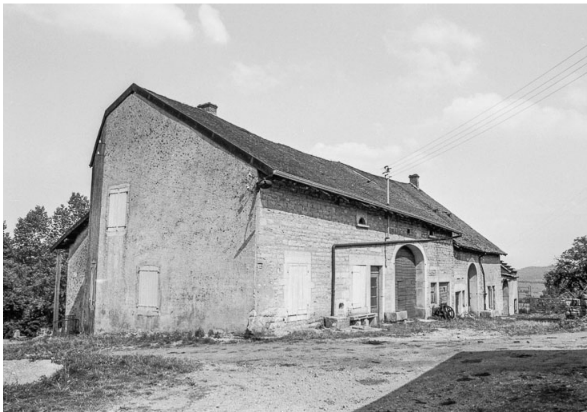
Ferme cadastrées D2 257, 259, 260 : vue d'ensemble. 39, Saint-Maur