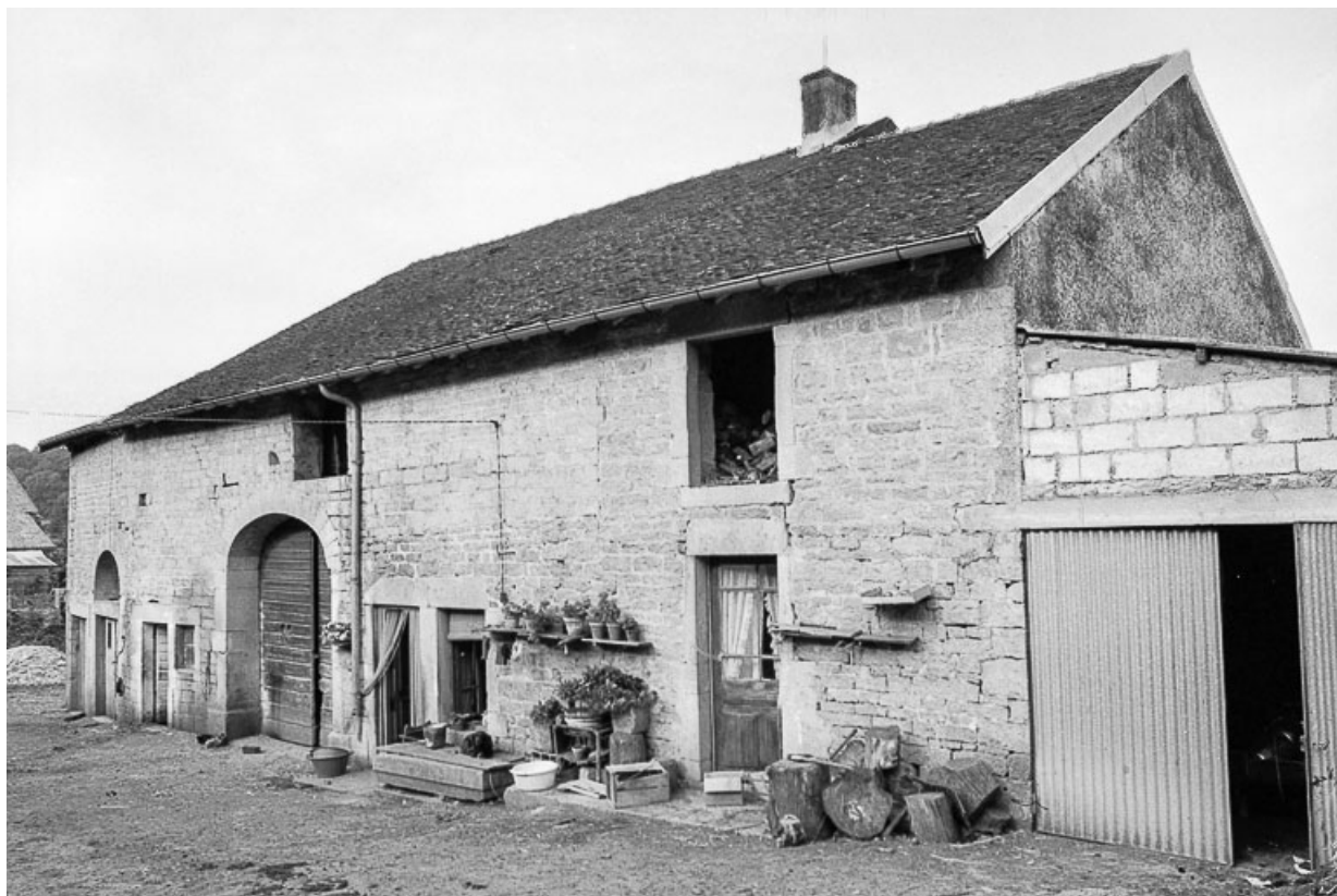
Ferme cadastrée D2 72 : : façade antérieure vue de trois quarts droit. 39, Saint-Maur