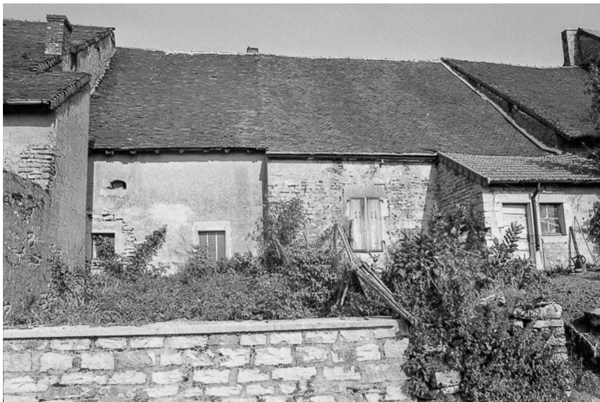
Ferme cadastrées D2 293 et 294 : façades postérieures. 39, Saint-Maur