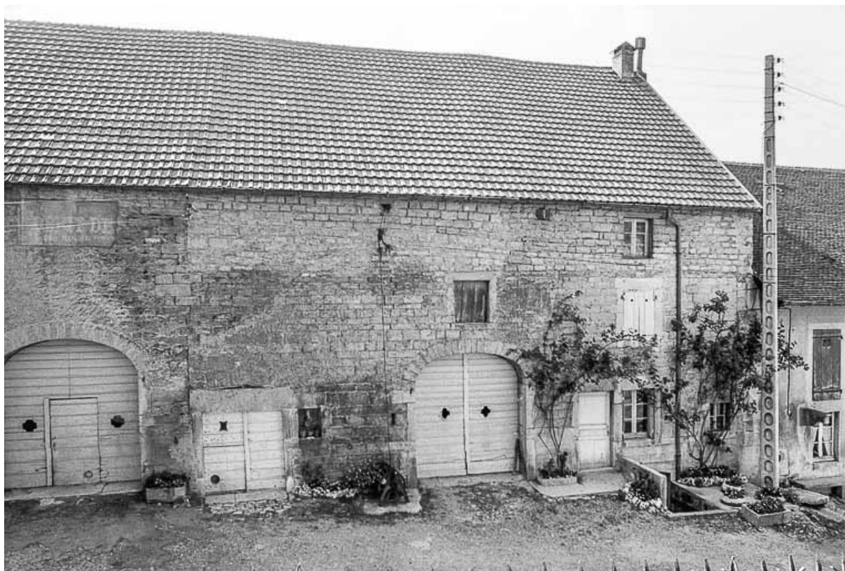
Ferme cadastrée D2 194 : façade antérieure. 39, Saint-Maur