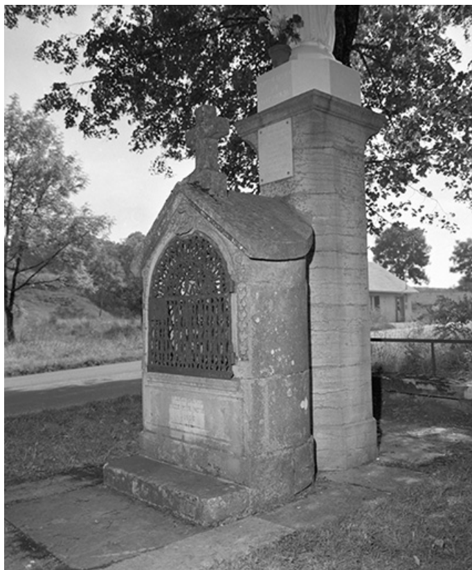
Socle : vue de trois quarts droit.