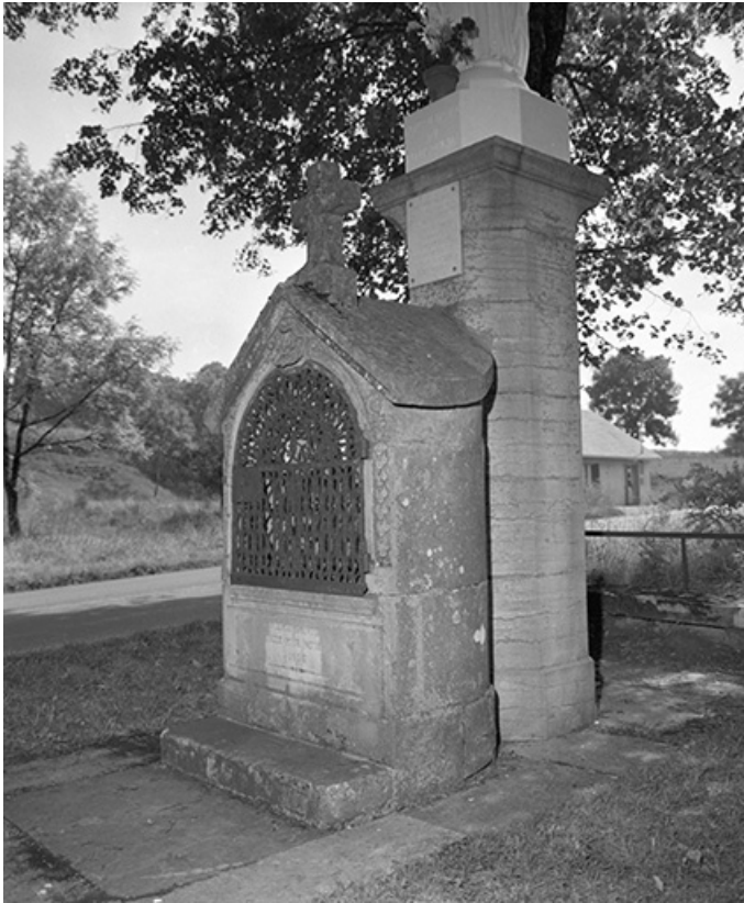
Socle : vue de trois quarts droit.