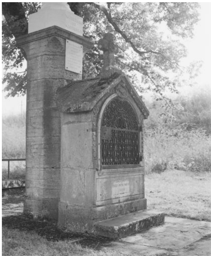
Socle : vue de trois quarts gauche.