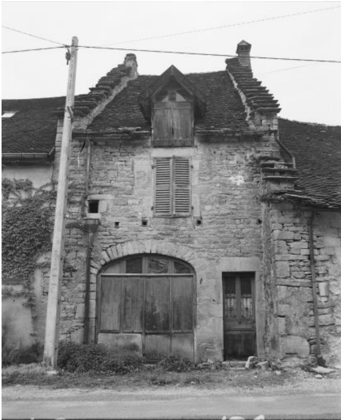
Façade antérieure de face.