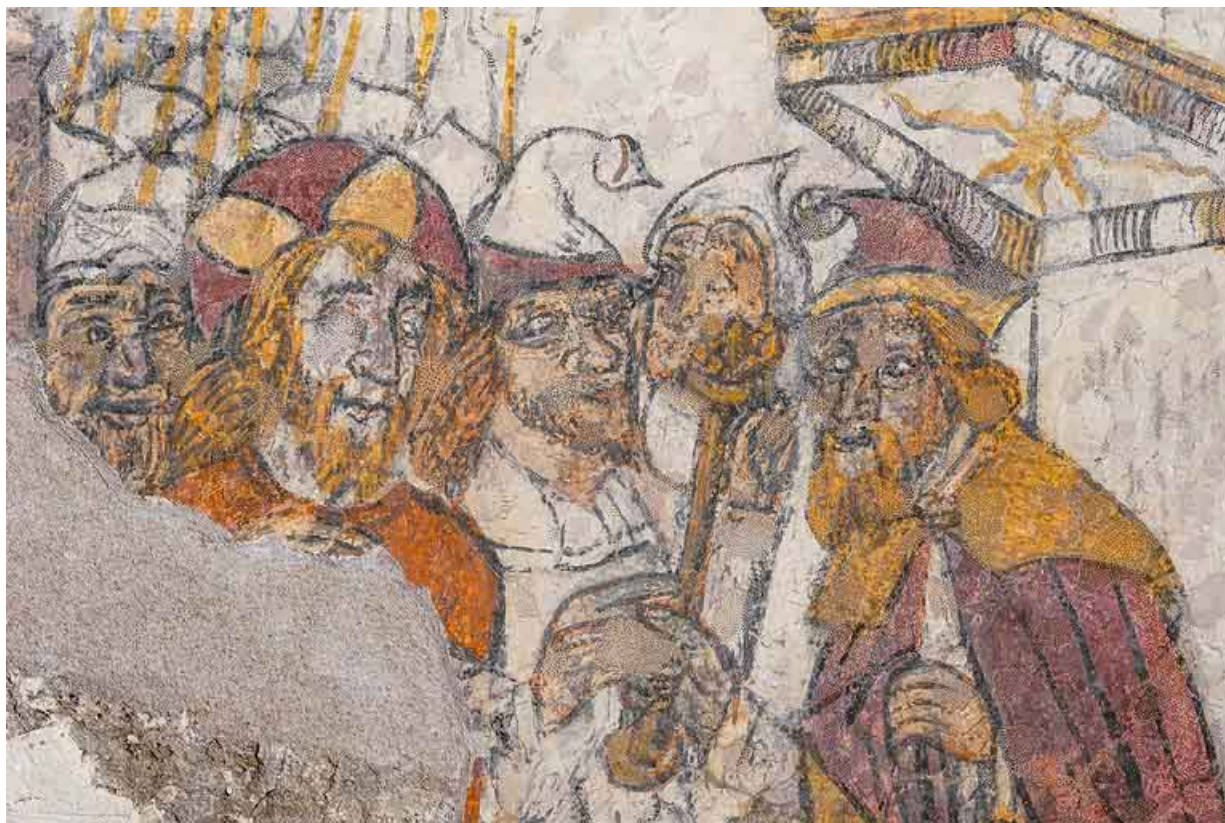
Peintures murales en 2021.