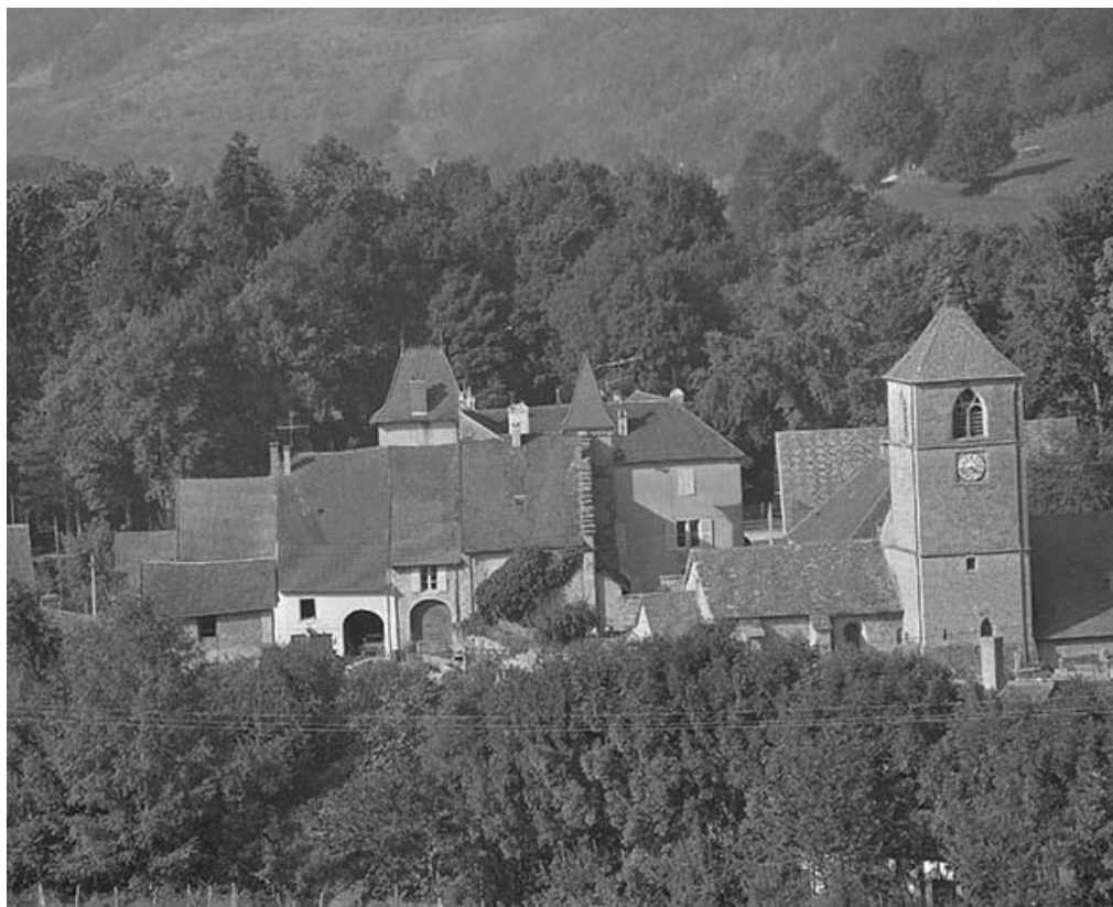
Extérieur : façade latérale droite.