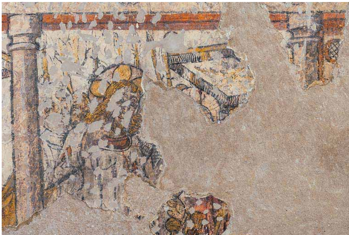
Peintures murales en 2021.