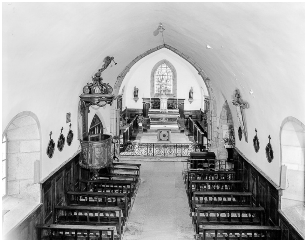
Intérieur : nef et choeur vus depuis la tribune. 39, Revigny