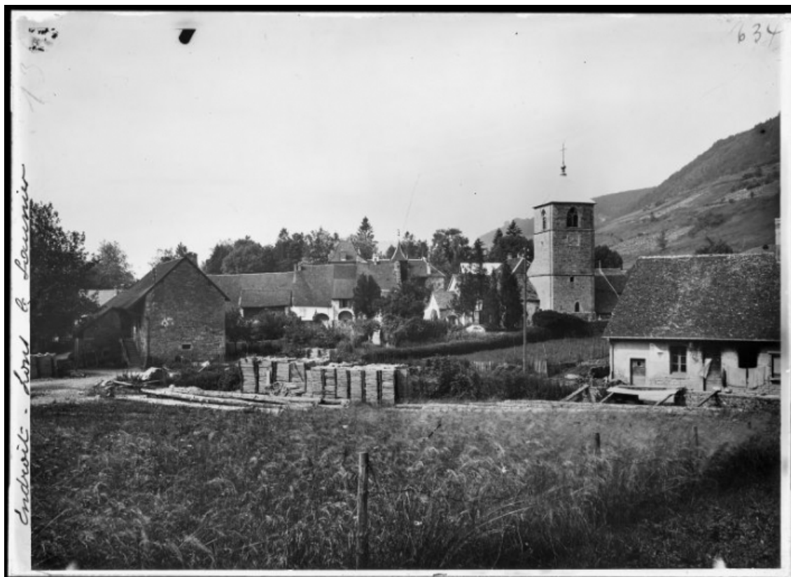
Vue de situation [1e moitié du 20e siècle]. 39, Revigny