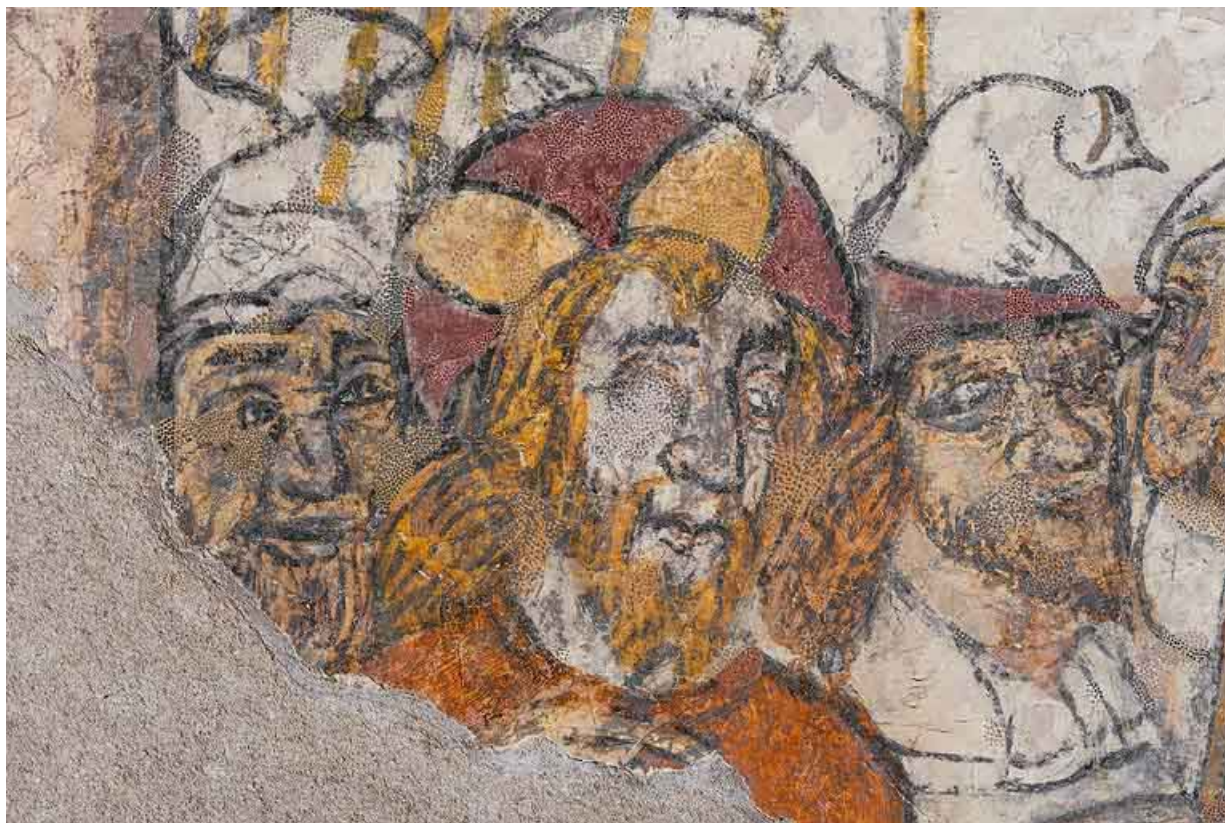
Peintures murales en 2021.