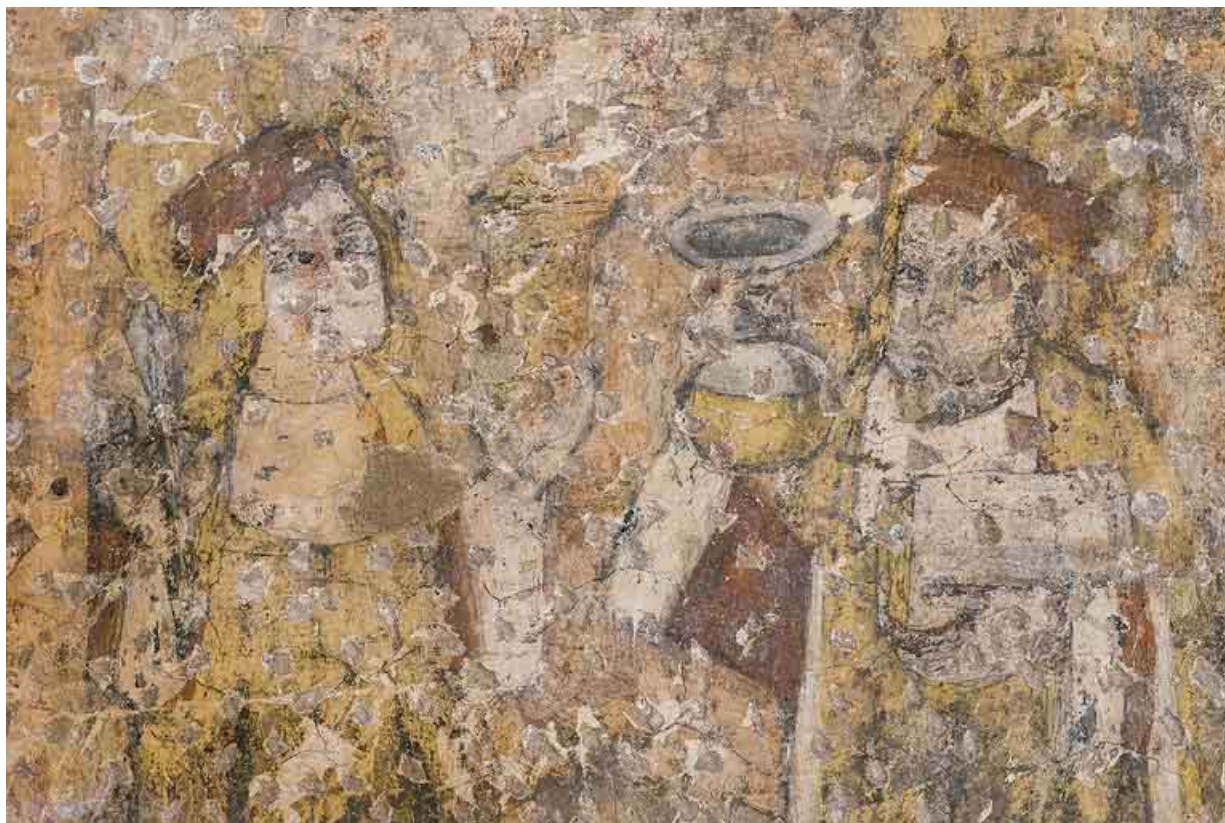
Peintures murales en 2021.