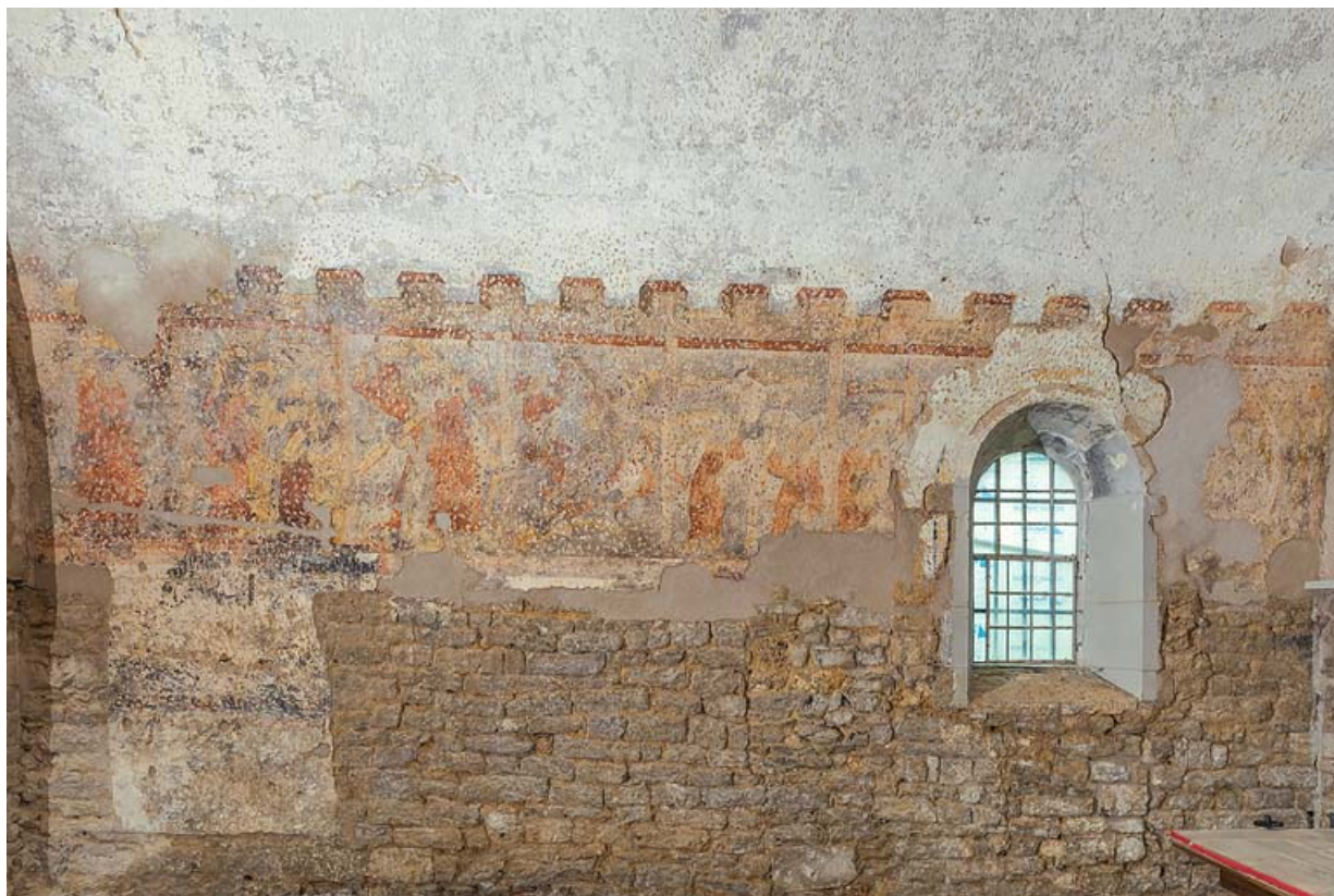
Peintures murales en 2021.