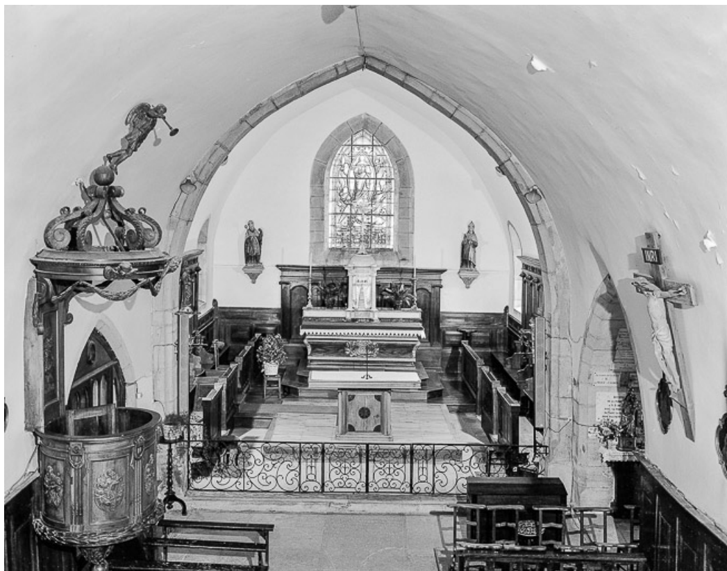
Intérieur : chœur vu depuis la tribune. 39, Revigny