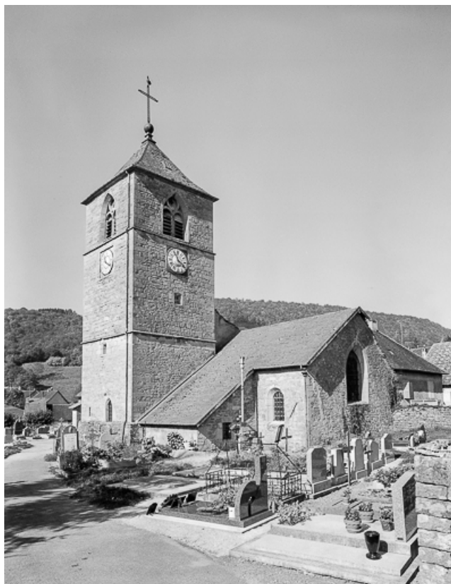
Extérieur : façade latérale droite et chevet.