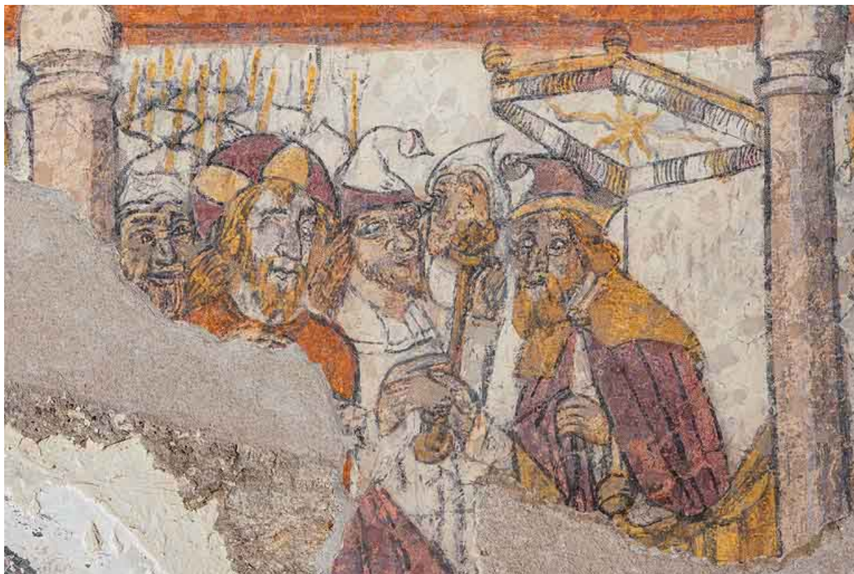
Peintures murales en 2021.