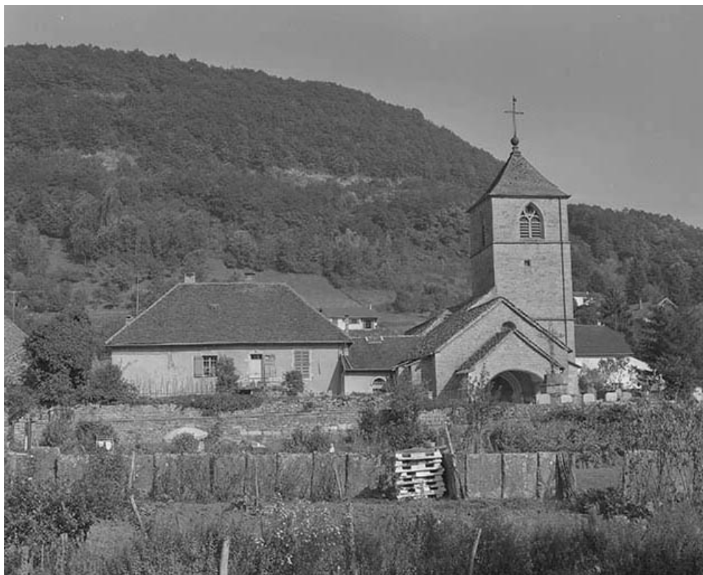
Extérieur : façade antérieure.