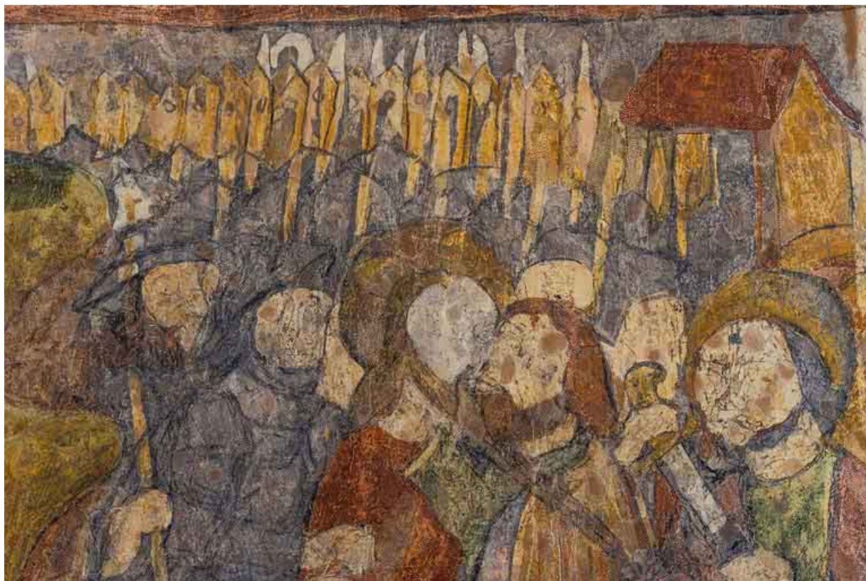
Peintures murales en 2021.