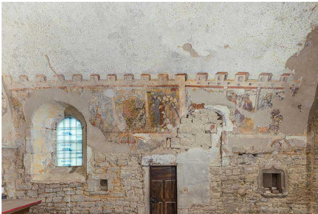
Peintures murales en 2021.