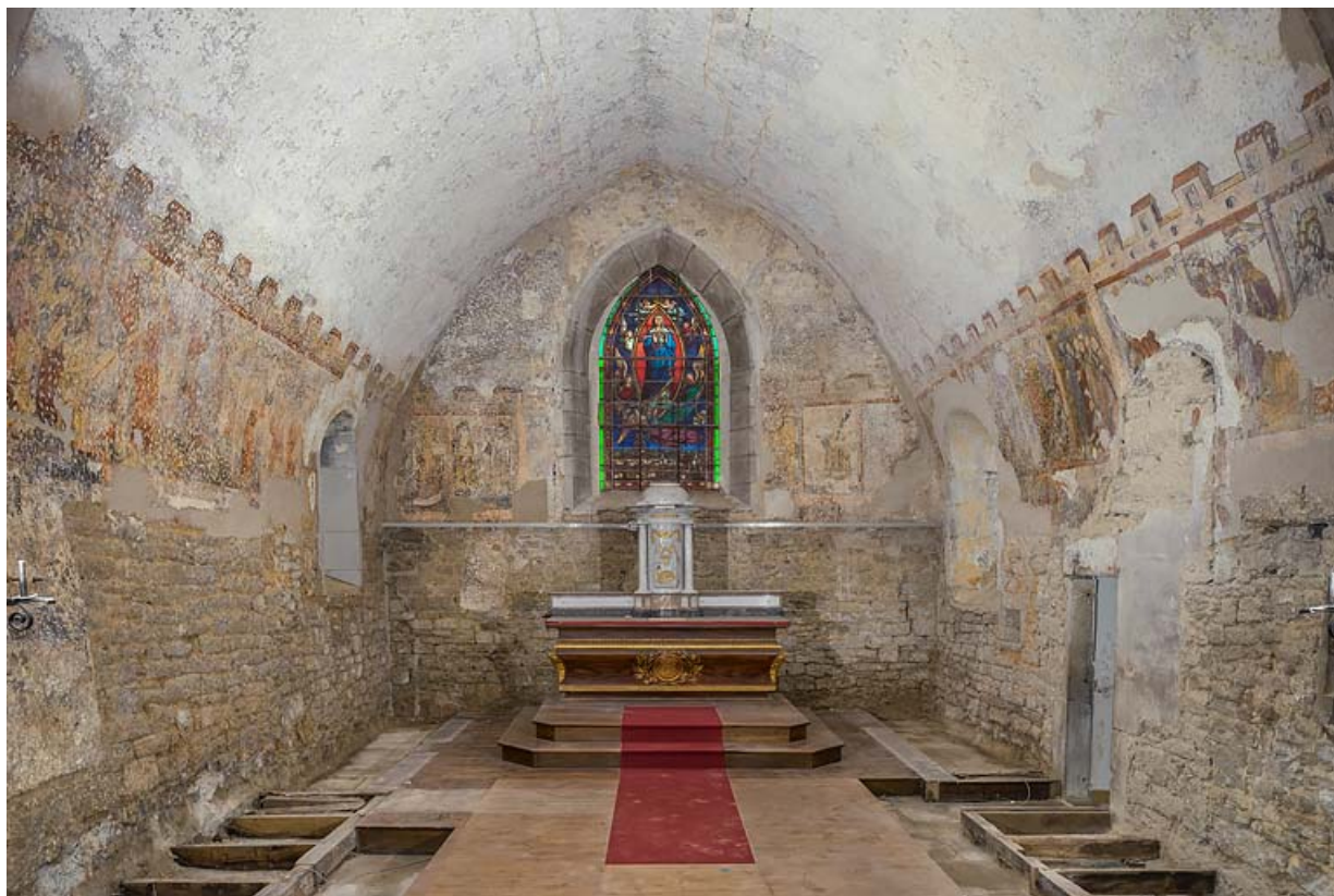
Le chœur en 2021.