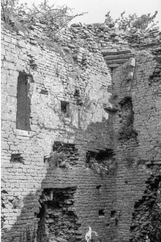
Vue intérieure du donjon : détail.