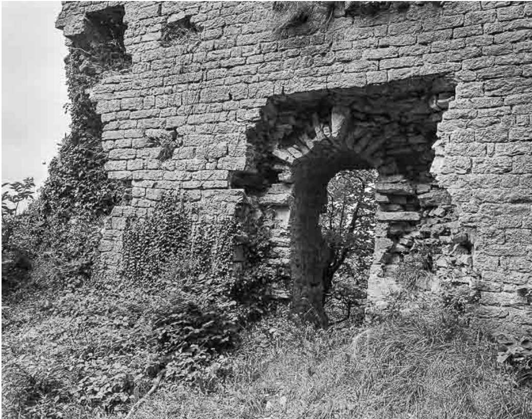
Vue extérieure du donjon : détail d'une porte.