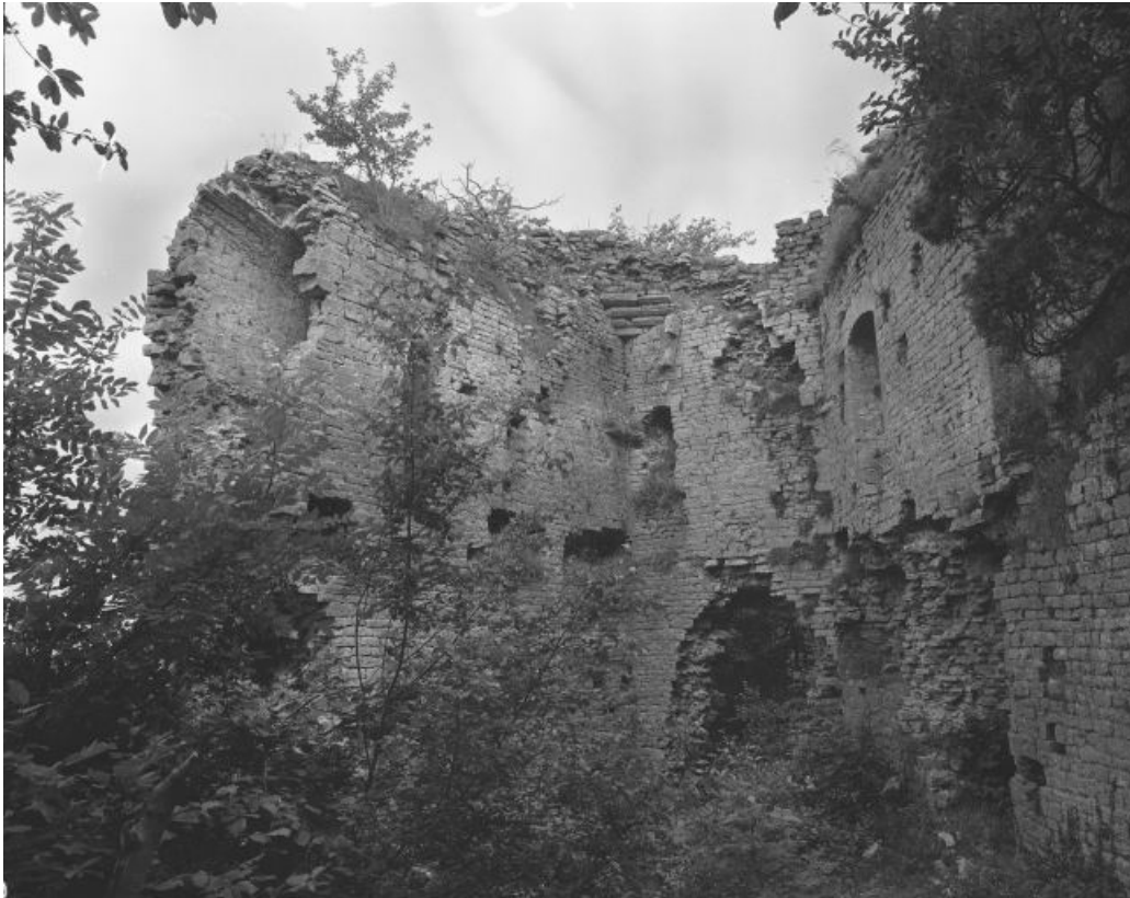
Vue intérieure du donjon montrant le passage à l'intérieur du mur.