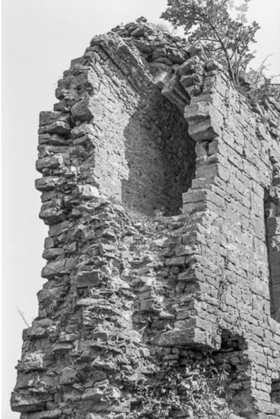
Vue intérieure du donjon montrant le passage à l'intérieur du mur.