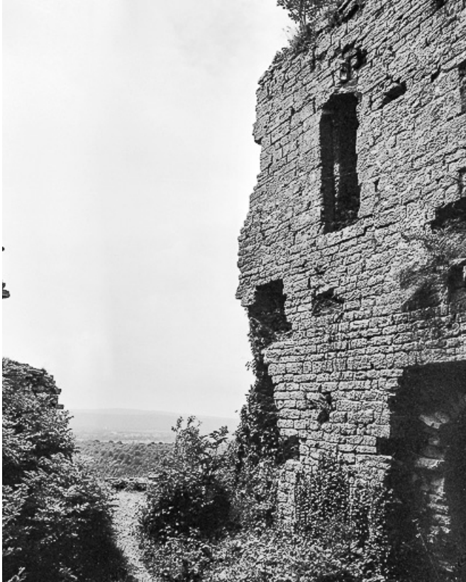
Vue extérieure du donjon et panorama.