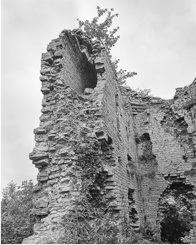
Vue intérieure du donjon montrant le passage à l'intérieur du mur.