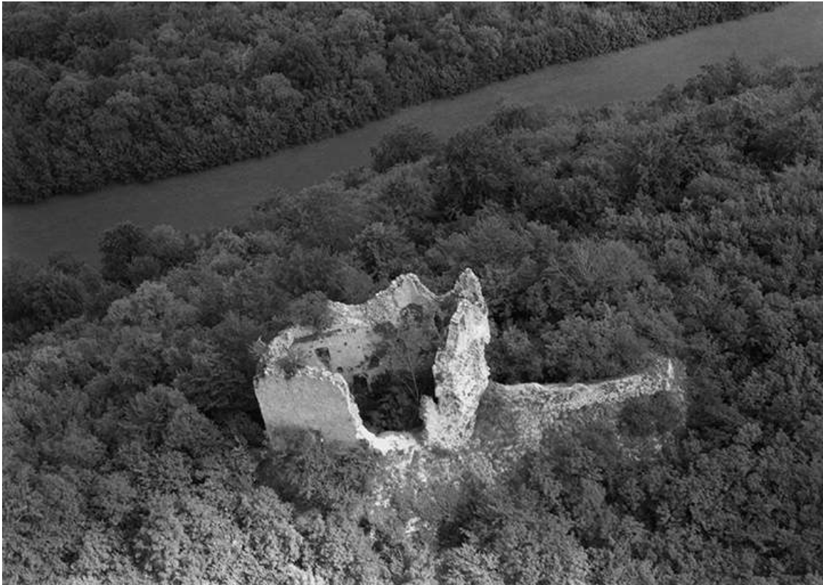
Vue aérienne en 1956.