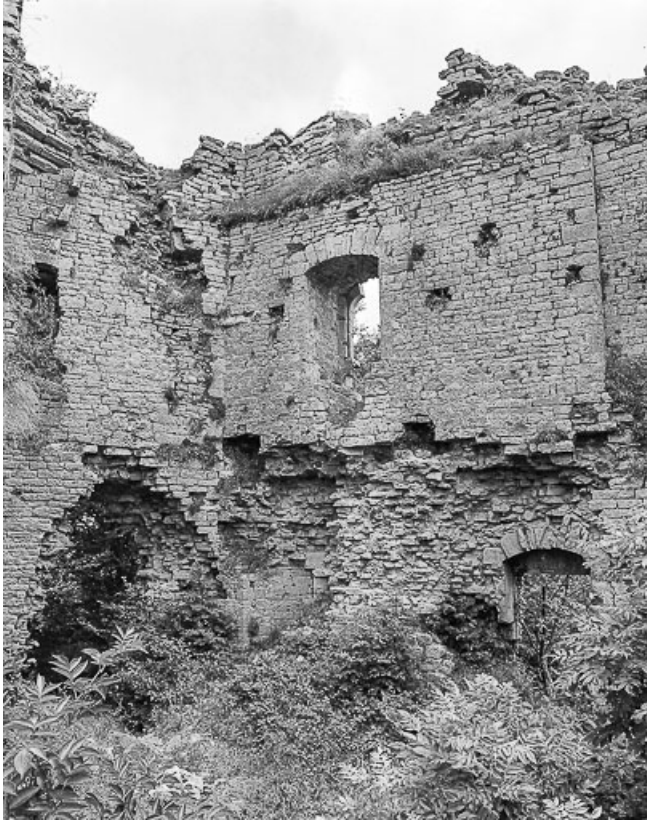
Vue intérieure du donjon : détail.