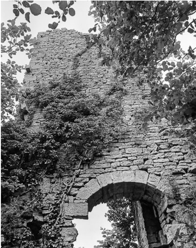
Vue extérieure du donjon.