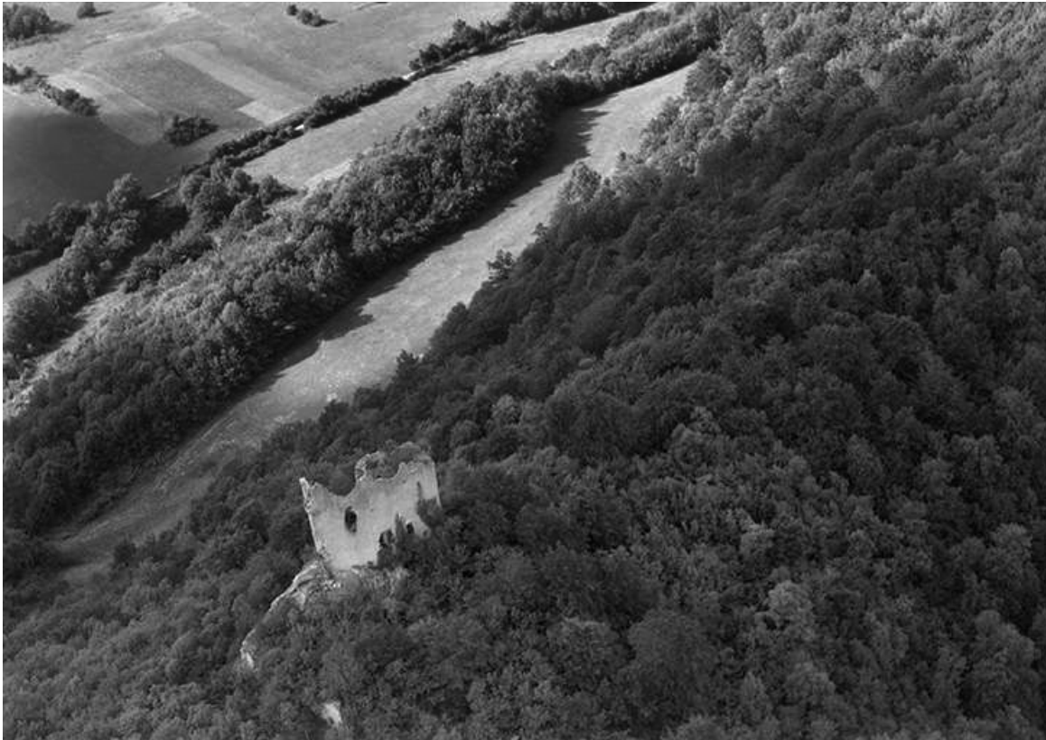
Vue aérienne en 1956.