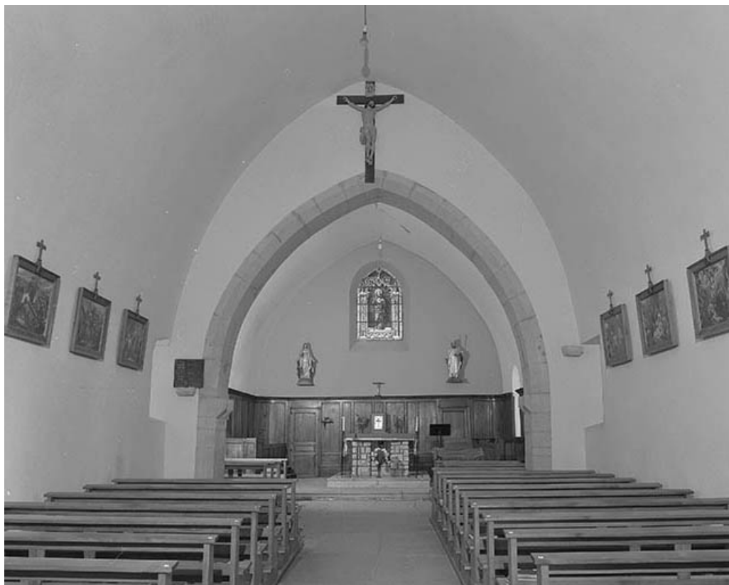
Intérieur : nef et chœur vus depuis l'entrée.