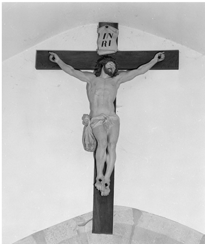
Statue : Christ en croix.