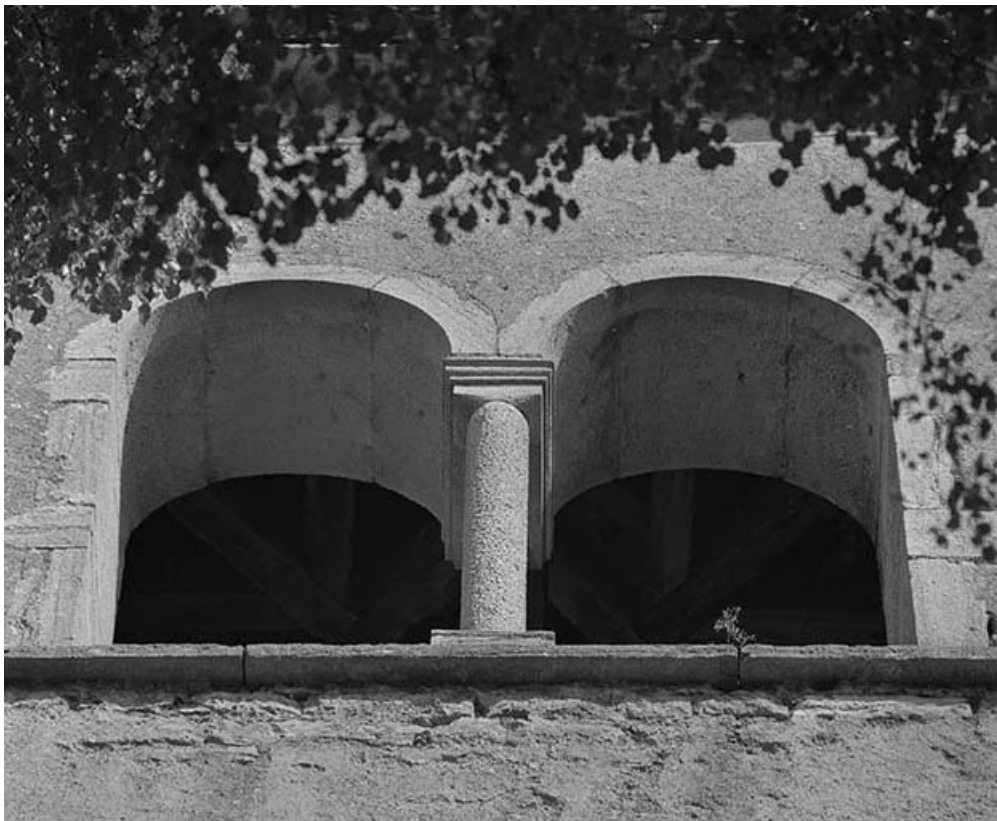
Extérieur : détail, baies du clocher, face antérieure.