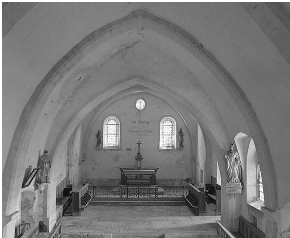
Intérieur : nef et chœur vus depuis la vitrine.