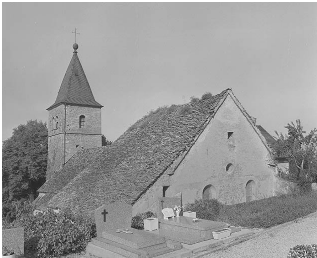
Façade latérale droite et chevet.