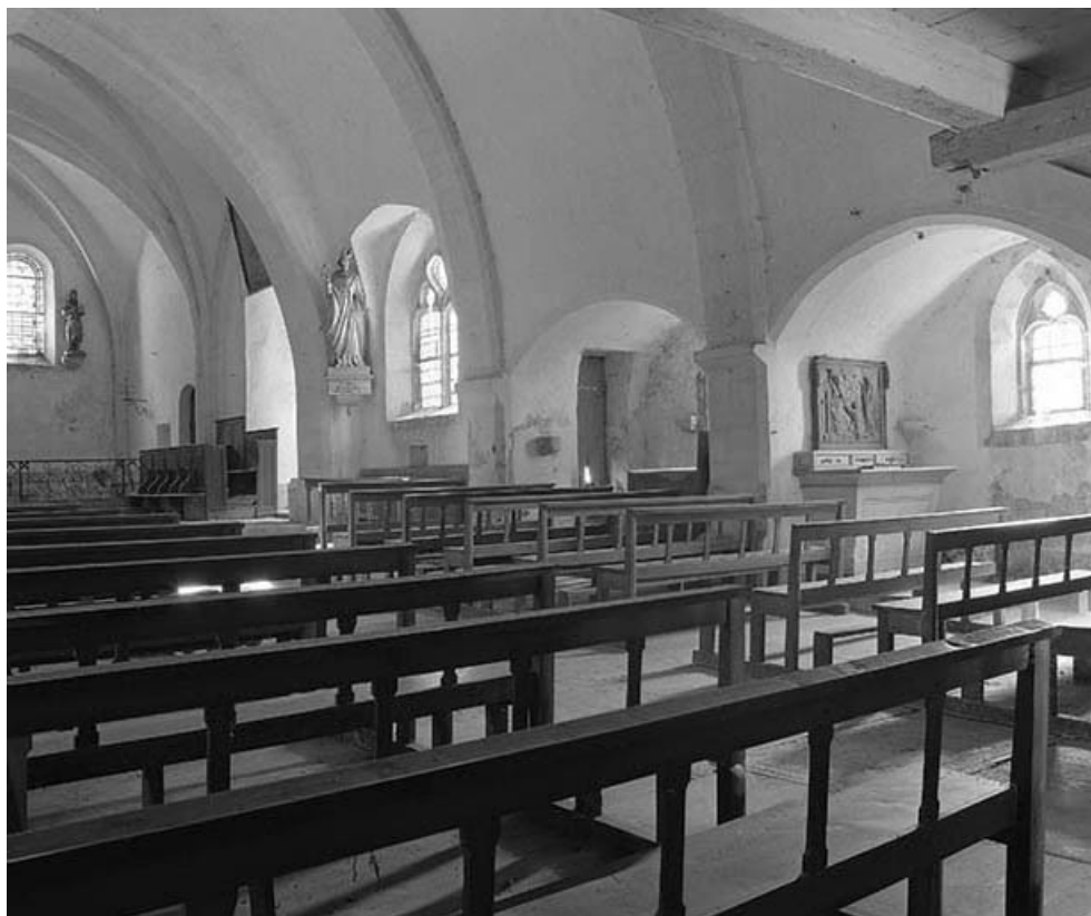
Intérieur : élévation droite vue depuis l'entrée.