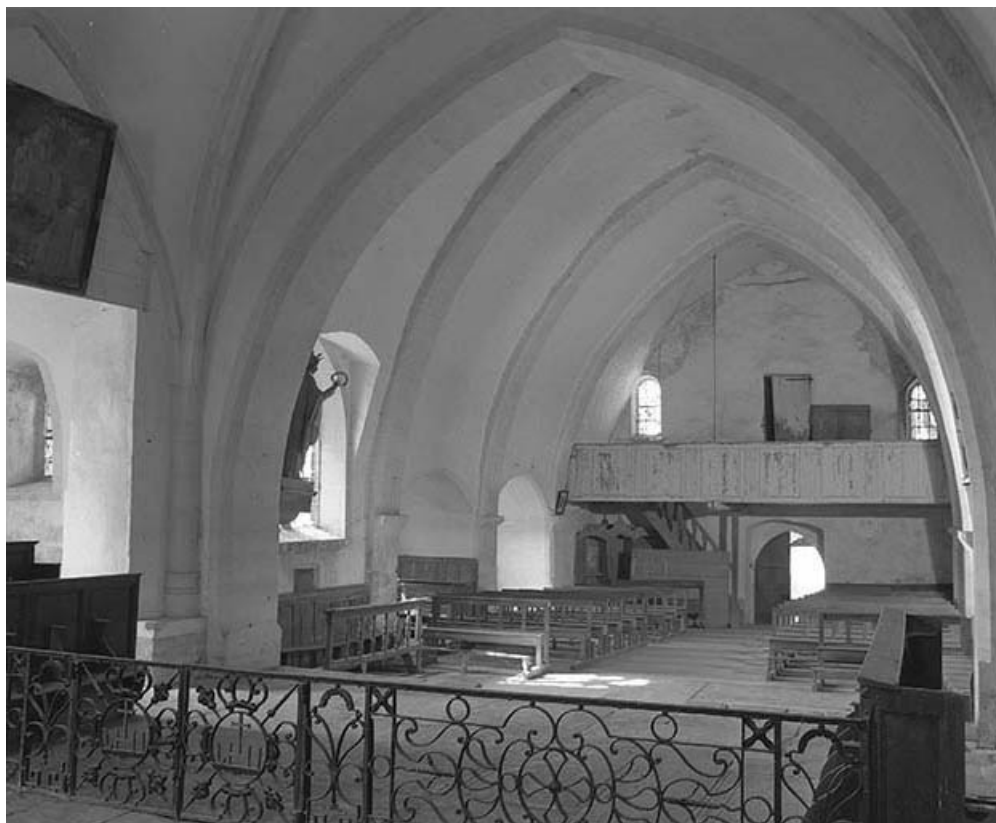
Intérieur : élévation droite vue depuis le chœur.