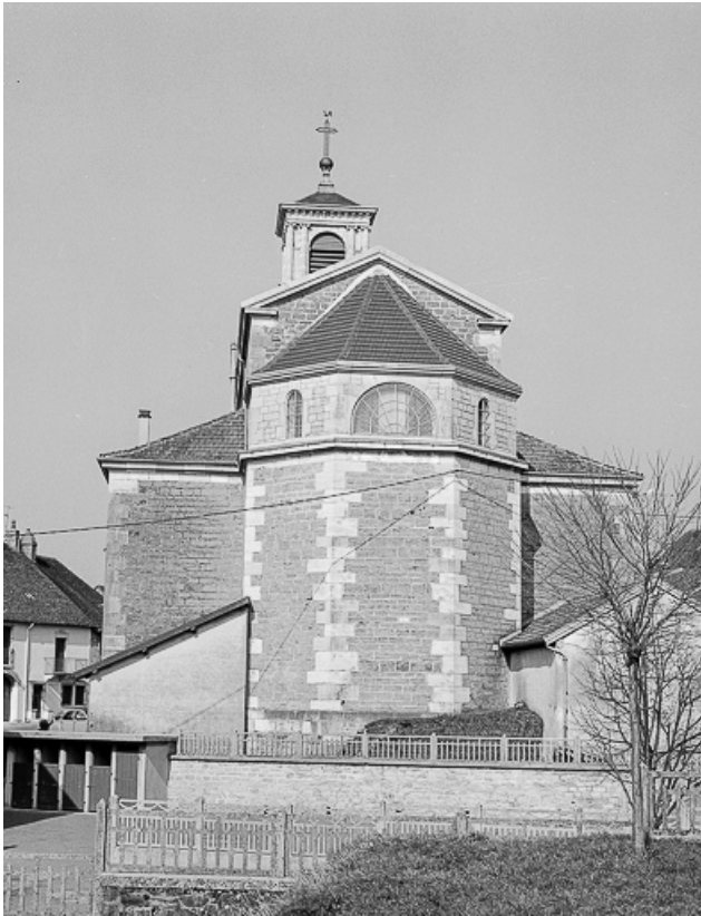
Extérieur : abside vue de face.