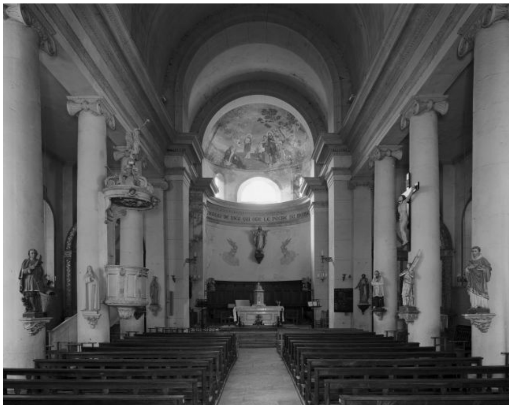
La nef et le chœur vus depuis l'entrée.