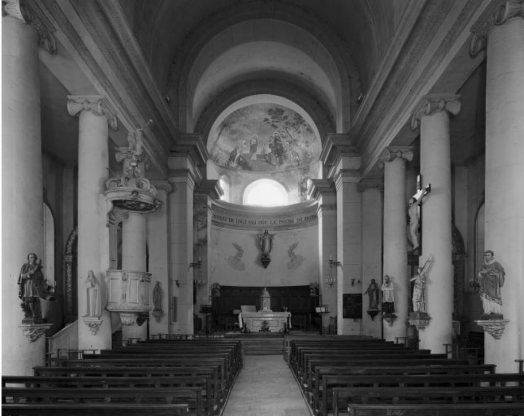
La nef et le chœur vus depuis l'entrée.