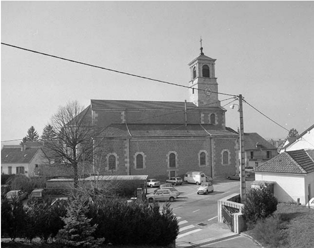
Extérieur : face latérale gauche.