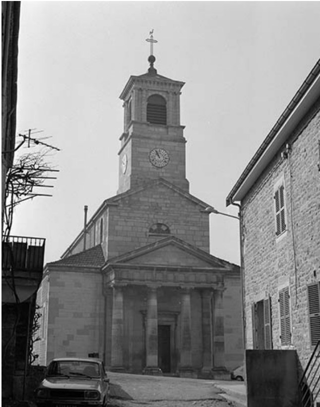
Extérieur : façade antérieure.