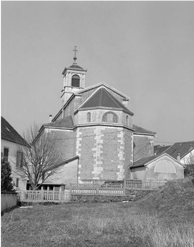
Extérieur : abside vue de trois quarts.