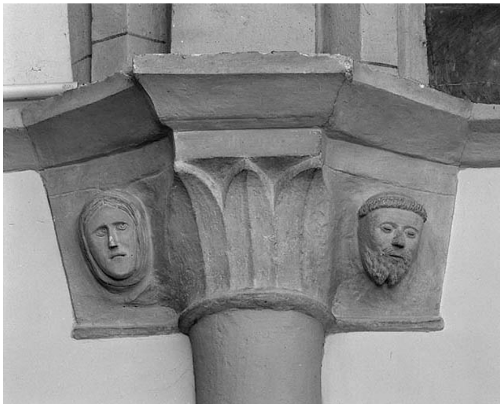
Intérieur : nef, 2e chapiteau droit.