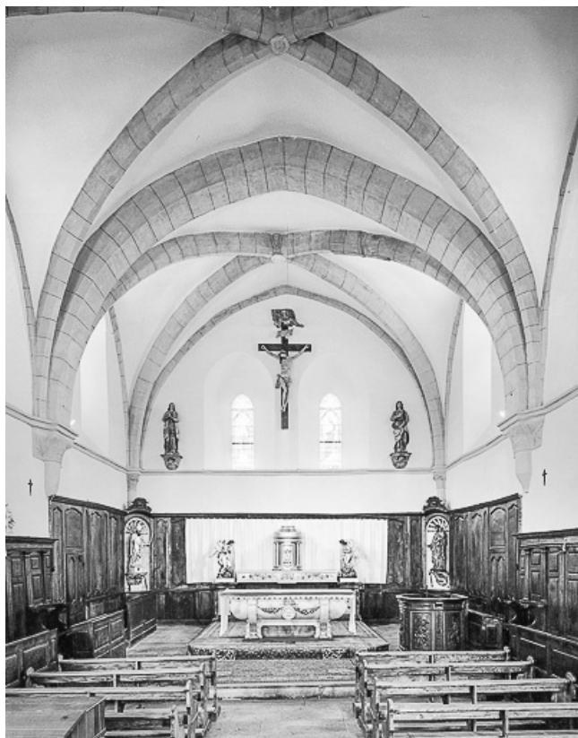
Intérieur : chœur vu depuis la nef.