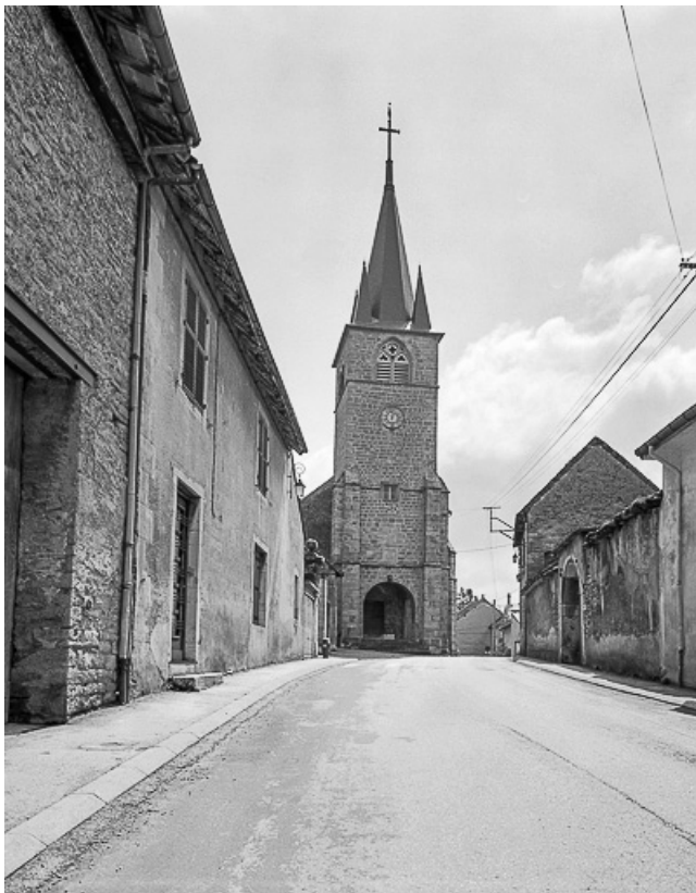
Extérieur : façade antérieure.