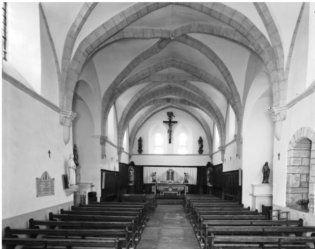
La nef et le chœur vus depuis l'entrée.