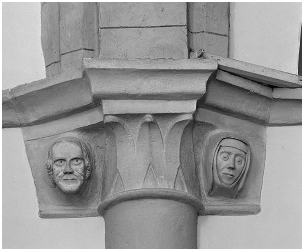
Intérieur : nef, 3e chapiteau gauche.