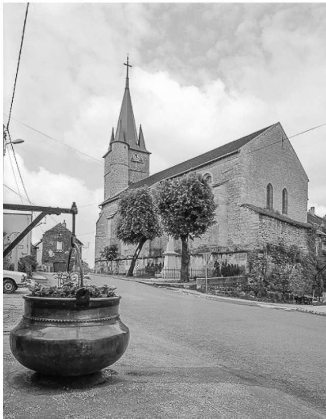
Extérieur : façade latérale droite et chevet.