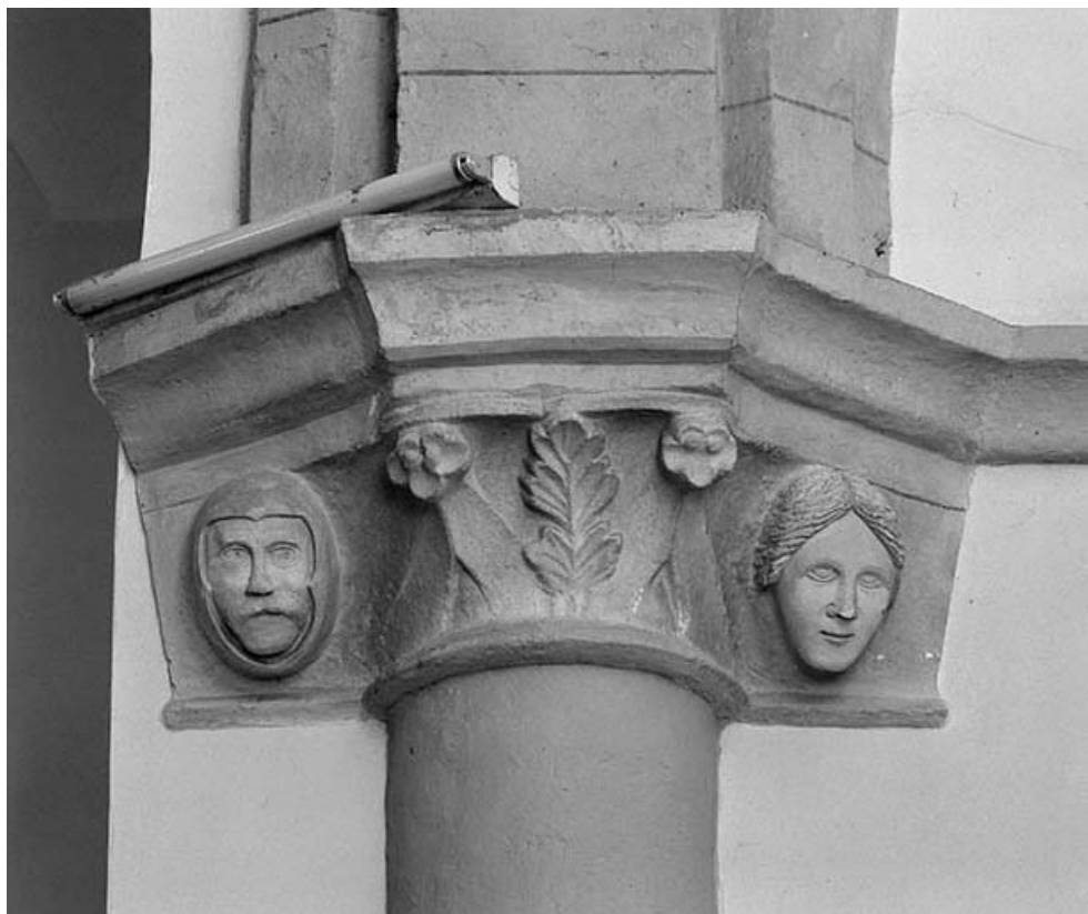
Intérieur : nef, 1er chapiteau droit.