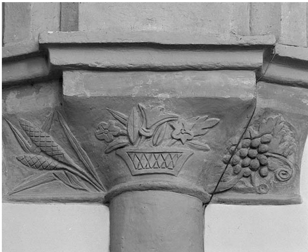
Intérieur : chœur, 2er chapiteau gauche.