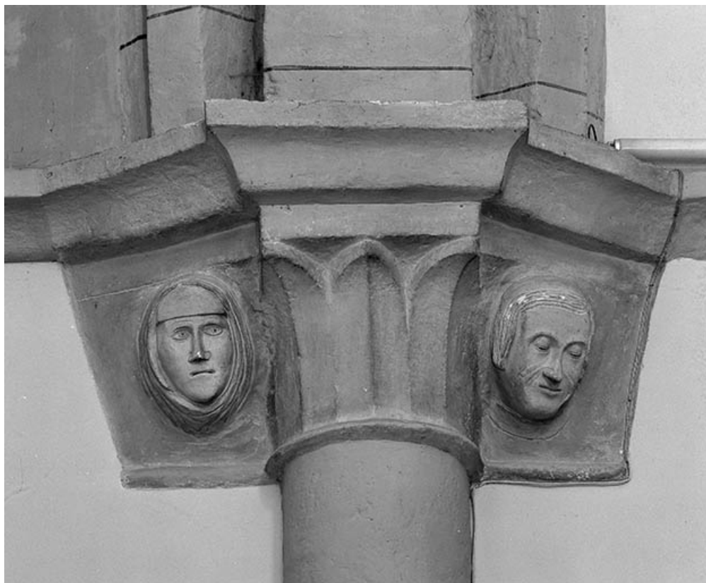
Intérieur : nef, 2e chapiteau gauche.