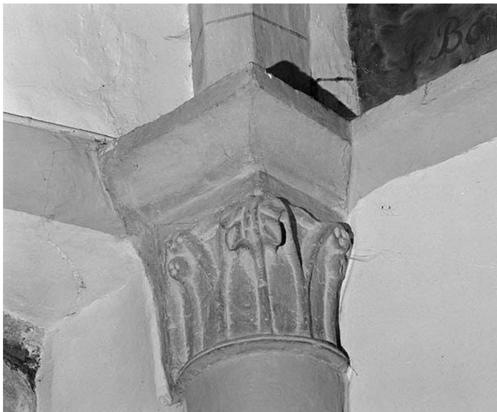
Intérieur : nef, 1er chapiteau gauche. 02, Montaigu place de Verdun