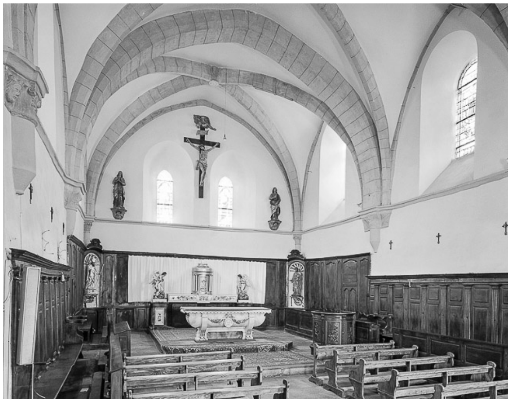
Intérieur : chœur, élévation droite.