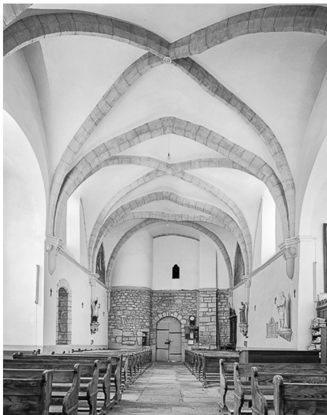
Intérieur : nef vue depuis le chœur.