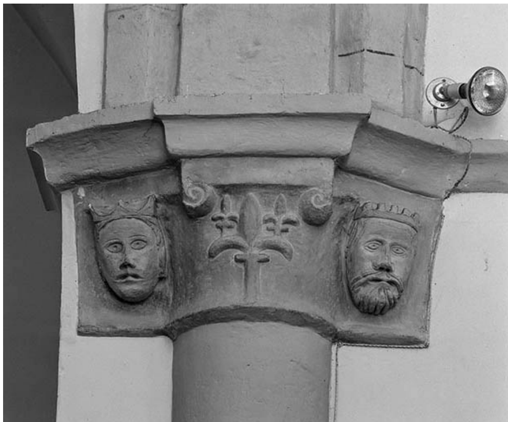
Intérieur : chœur, 1er chapiteau gauche.