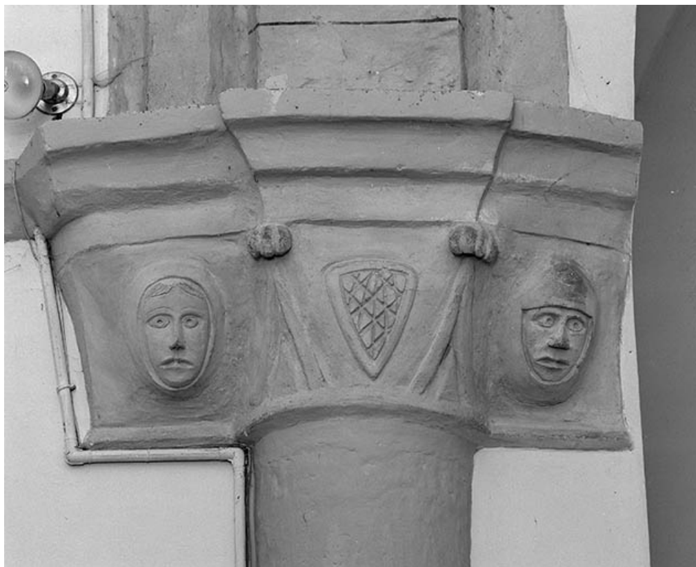
Intérieur : chœur, 2e chapiteau droit. 02, Montaigu place de Verdun