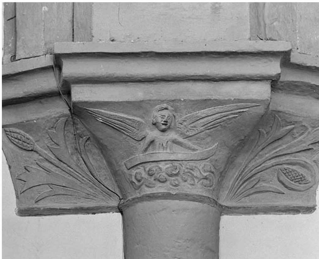
Intérieur : nef, 3e chapiteau droit.