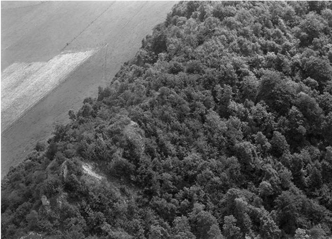
Vue aérienne du site du château fort en 1956.