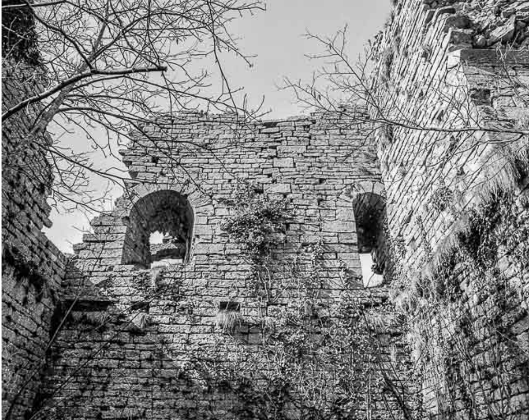
Vue générale des ruines du donjon depuis l'intérieur.