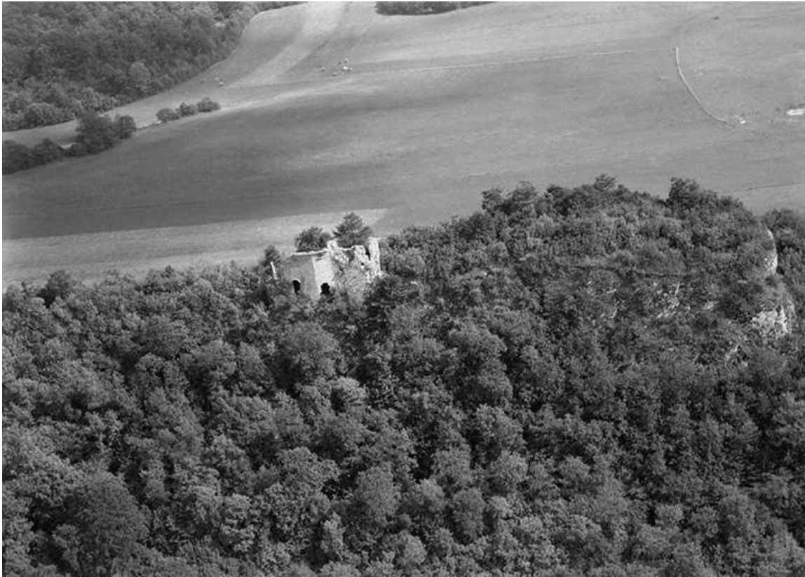
Vue aérienne en 1956.