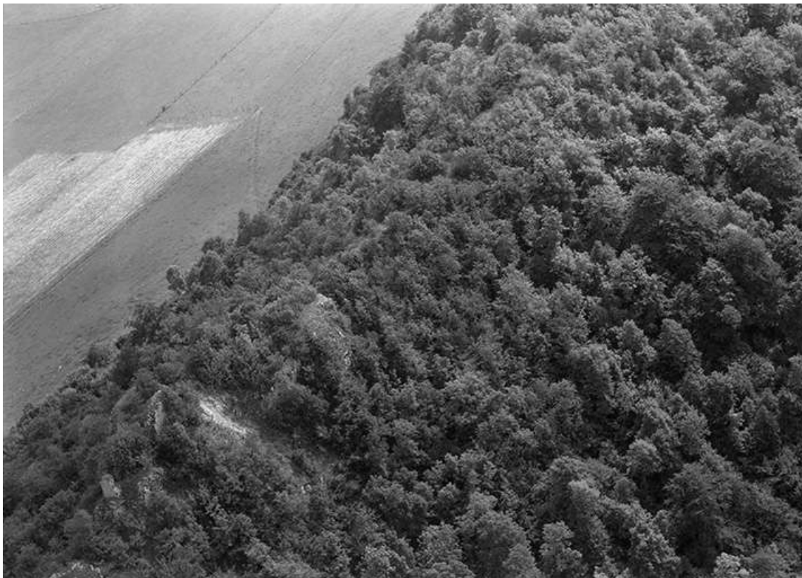
Vue aérienne du site du château fort en 1956.