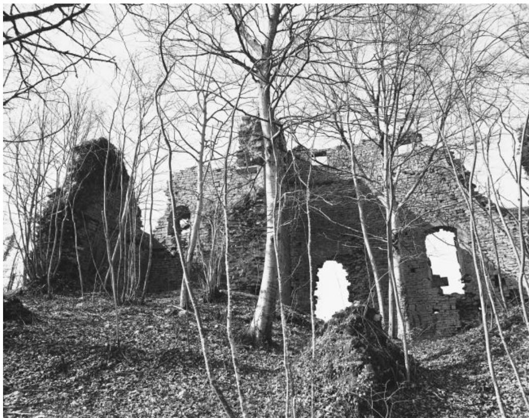
Vue générale des ruines du donjon.