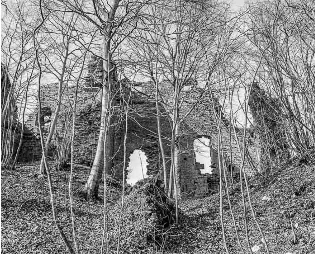
Vue générale des ruines du donjon.