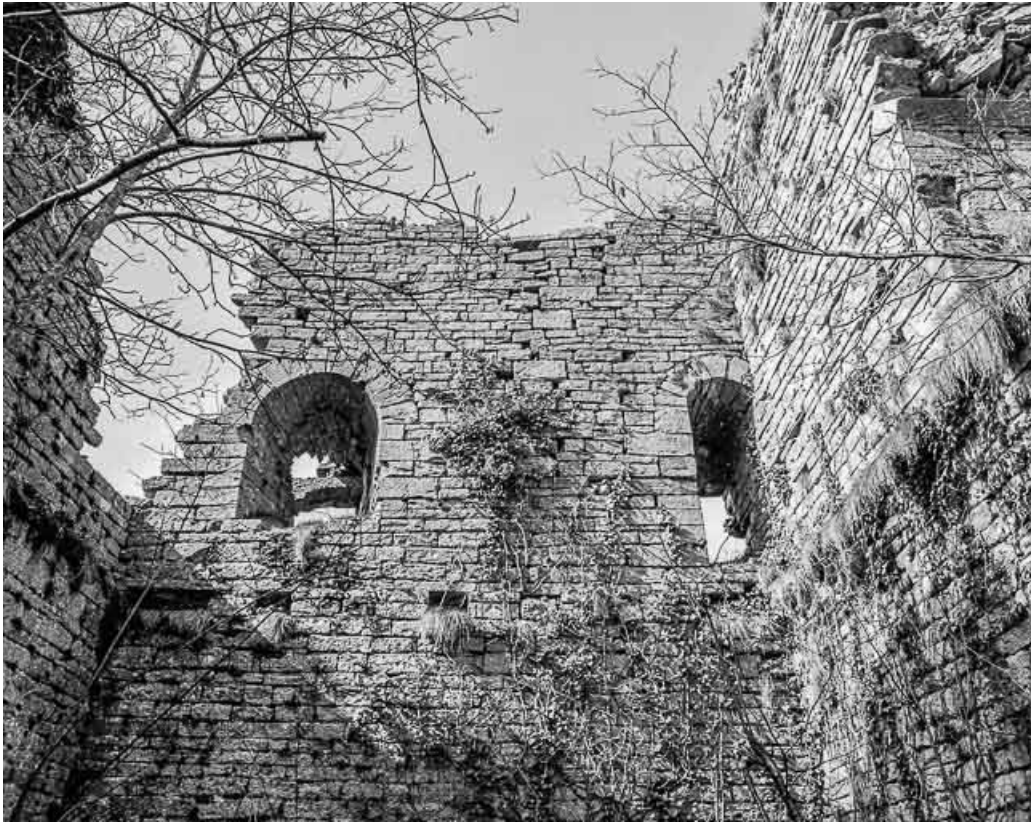
Vue générale des ruines du donjon depuis l'intérieur.