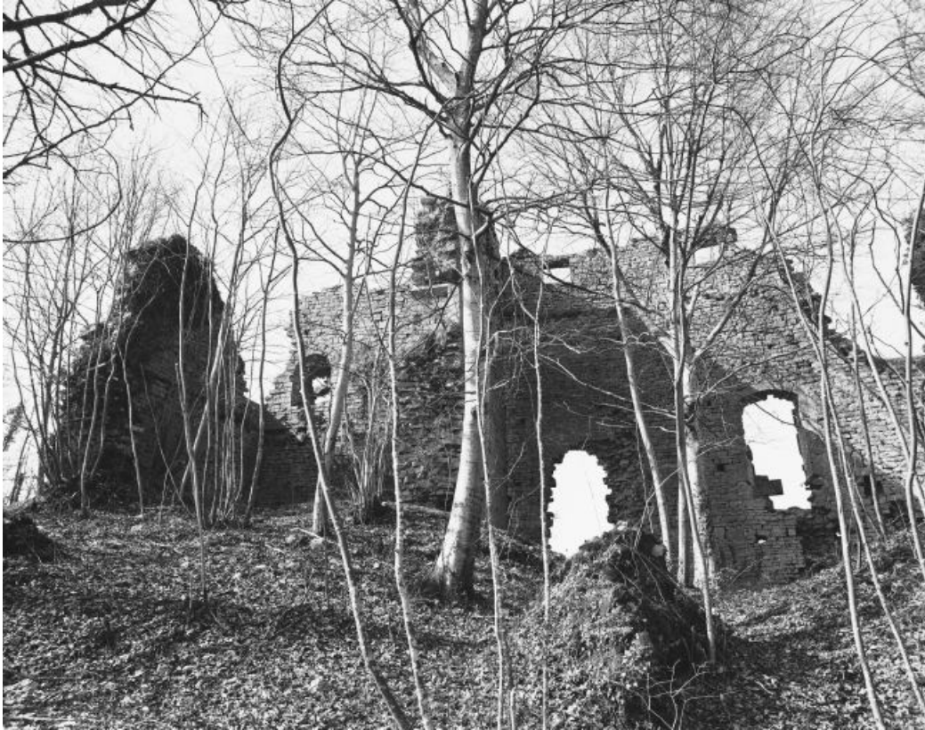
Vue générale des ruines du donjon.