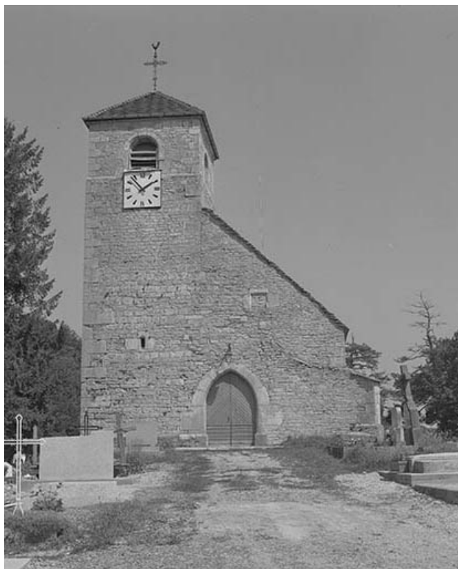
Façade antérieure vue de face.