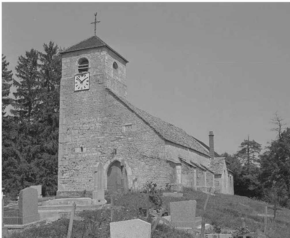
Vue générale de trois quarts droit.