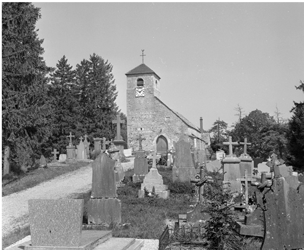
Façade antérieure et cimetière.