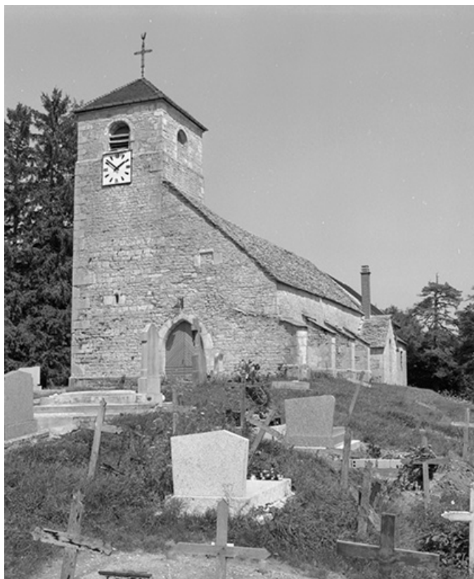
Façade antérieure : vue rapprochée.