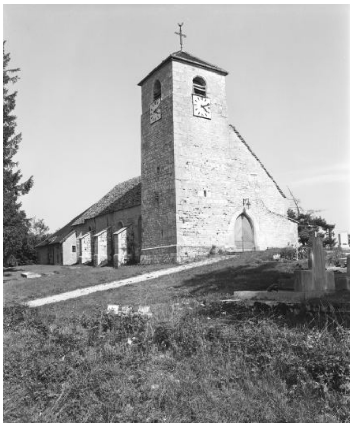
Vue générale de trois quarts gauche.