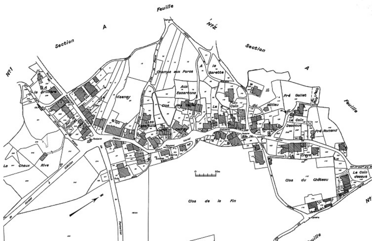
Plan avec la position des fermes repérées et sélectionnées. 39, Mirebel