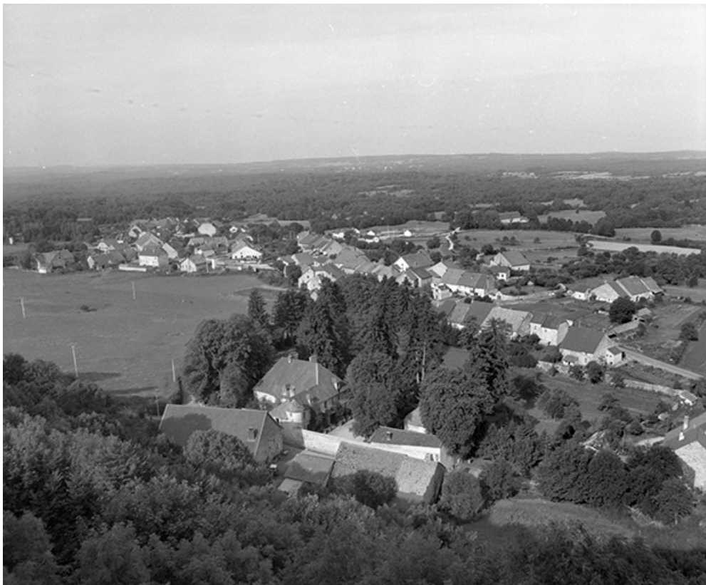
Village : vue générale avec le château au premier plan.