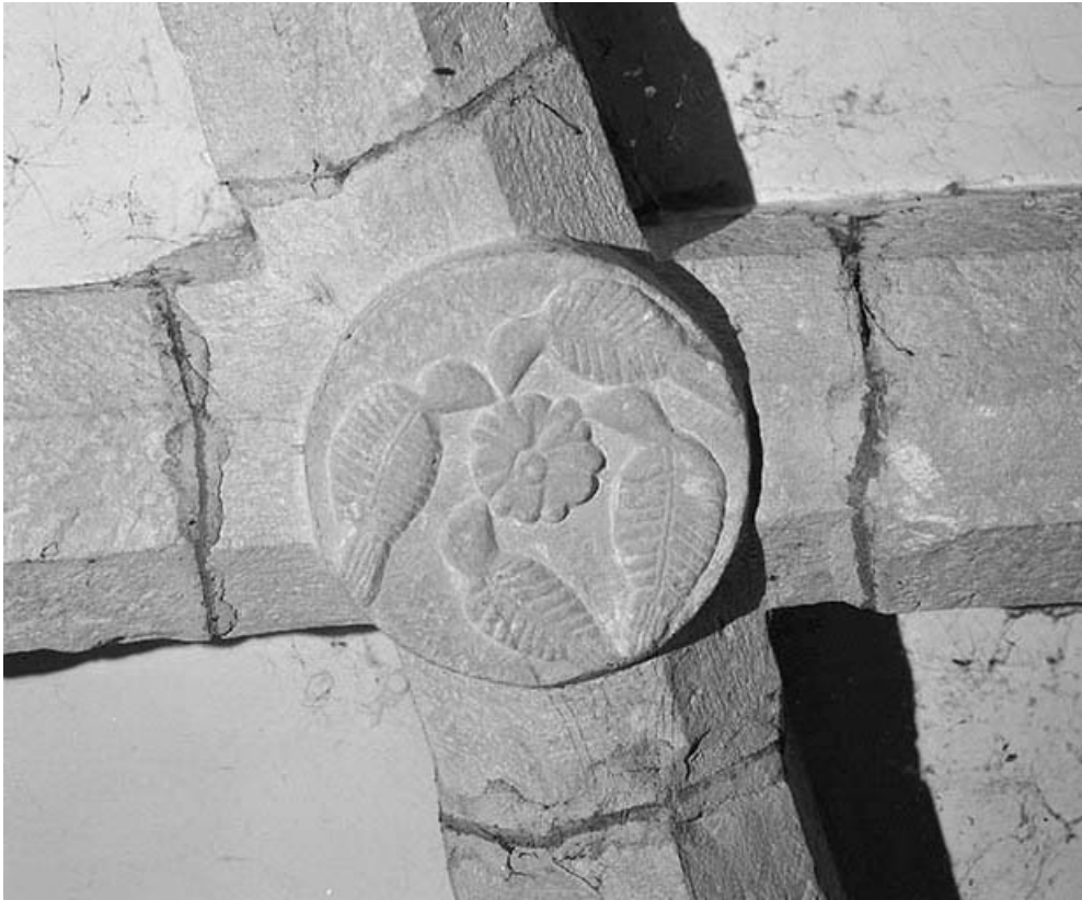
Intérieur : clé de voûte du chœur.