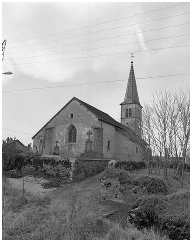
Extérieur : chevet.