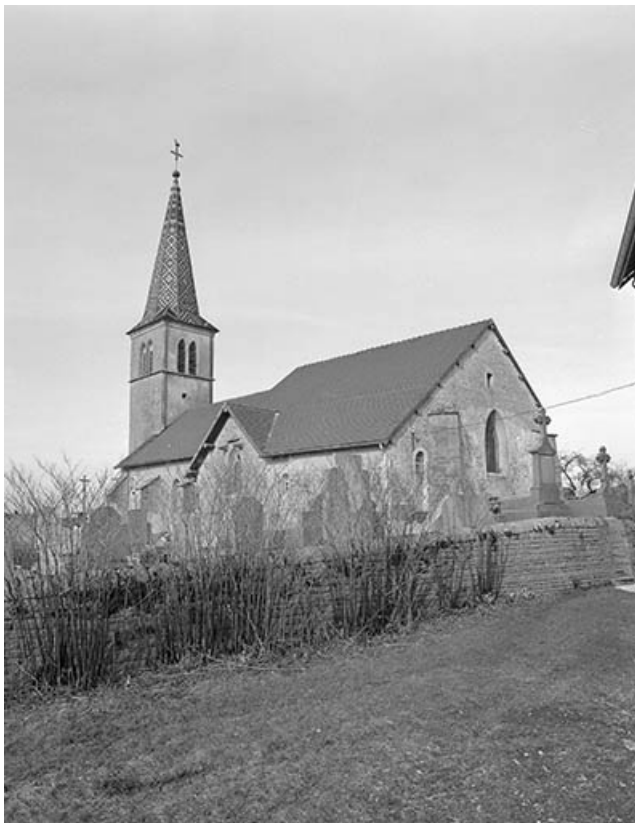
Extérieur : face latérale droite et chevet.