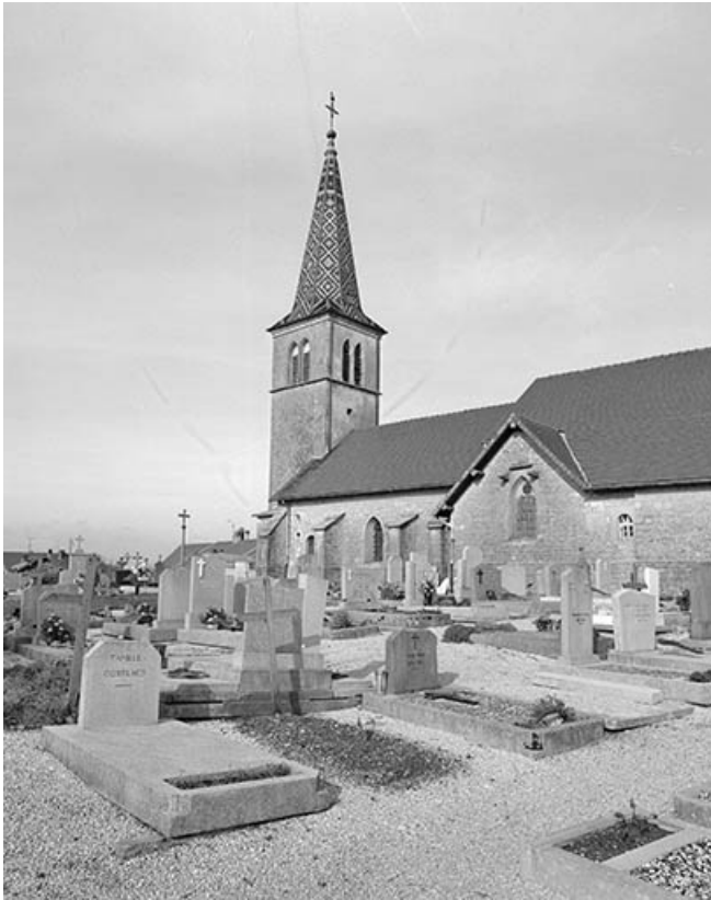
Extérieur : face latérale droite, partie gauche.