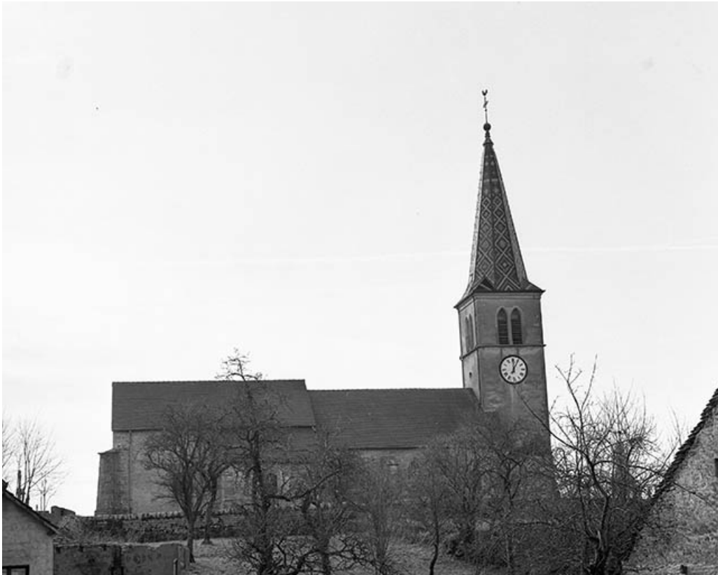
Extérieur : face latérale gauche.