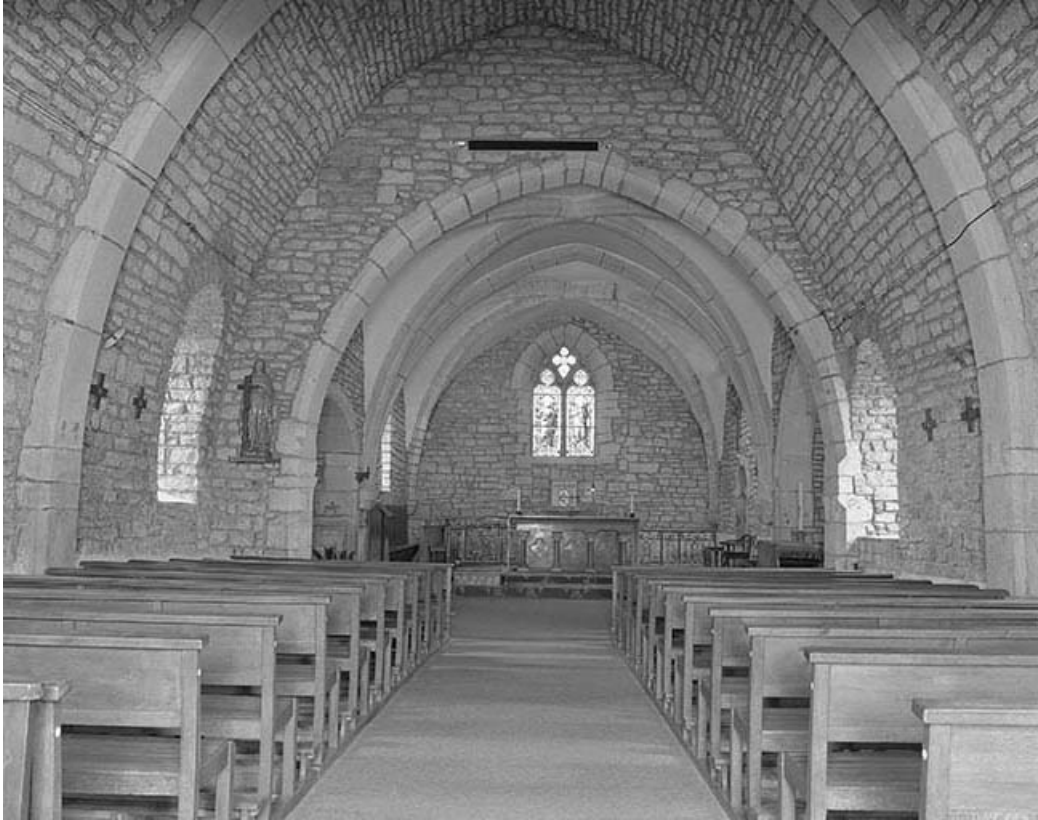
Intérieur : nef et chœur vus depuis l'entrée.