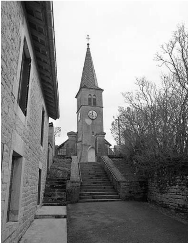
Extérieur : façade antérieure.