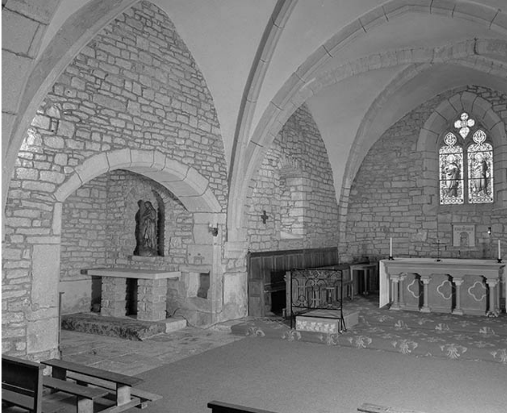
Intérieur : chœur, élévation gauche.