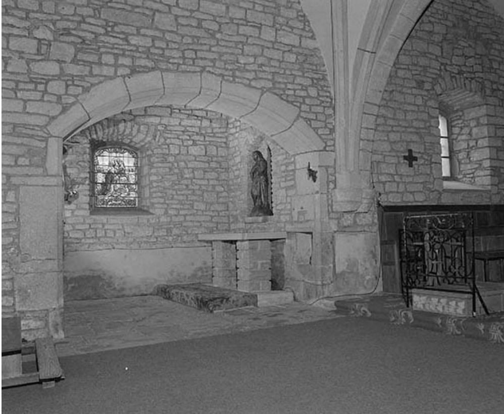
Intérieur : chapelle gauche.