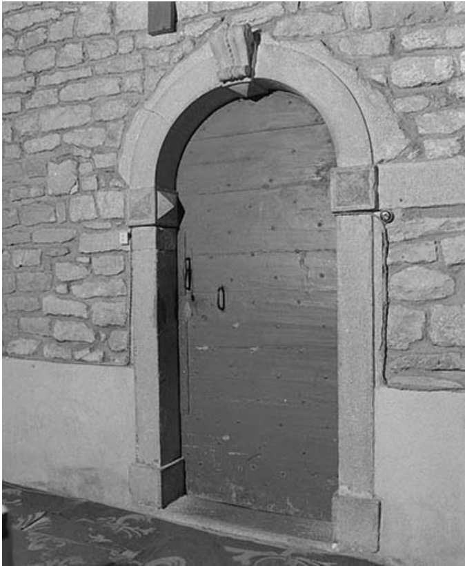
Intérieur : porte de la sacristie.