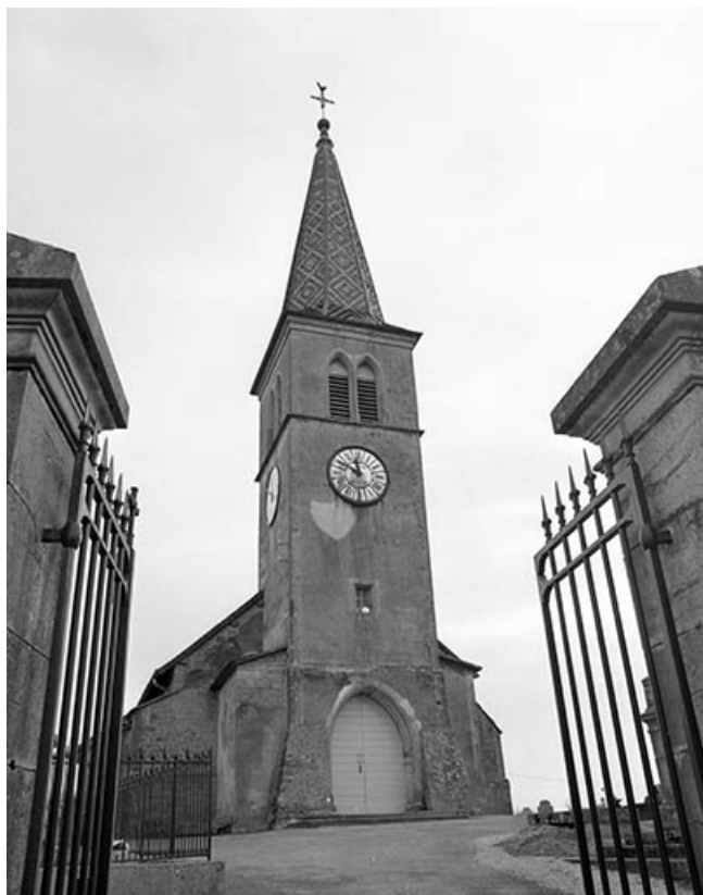
Extérieur : façade antérieure.