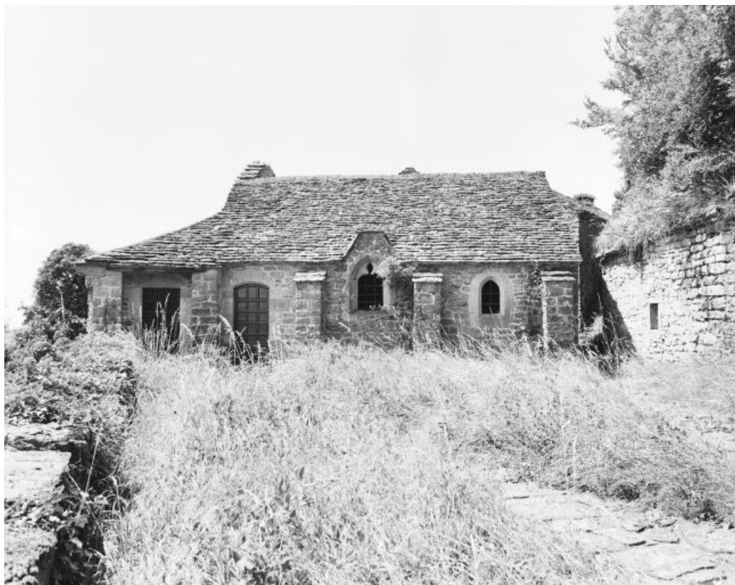
Façade latérale gauche de la chapelle.