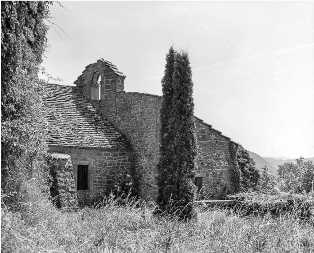
Face ouest, partie droite.