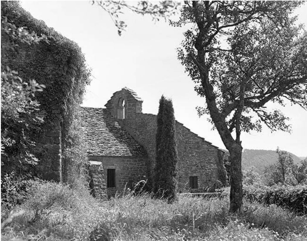
Face ouest, partie droite.