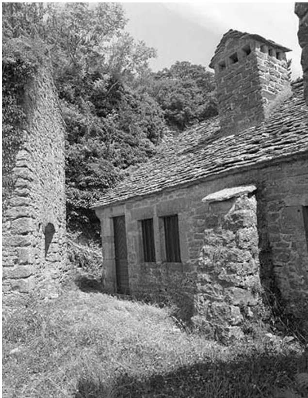
Face ouest, partie gauche.