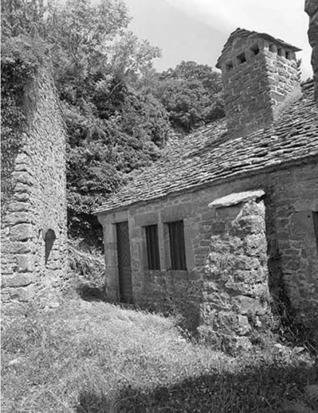
Face ouest, partie gauche.