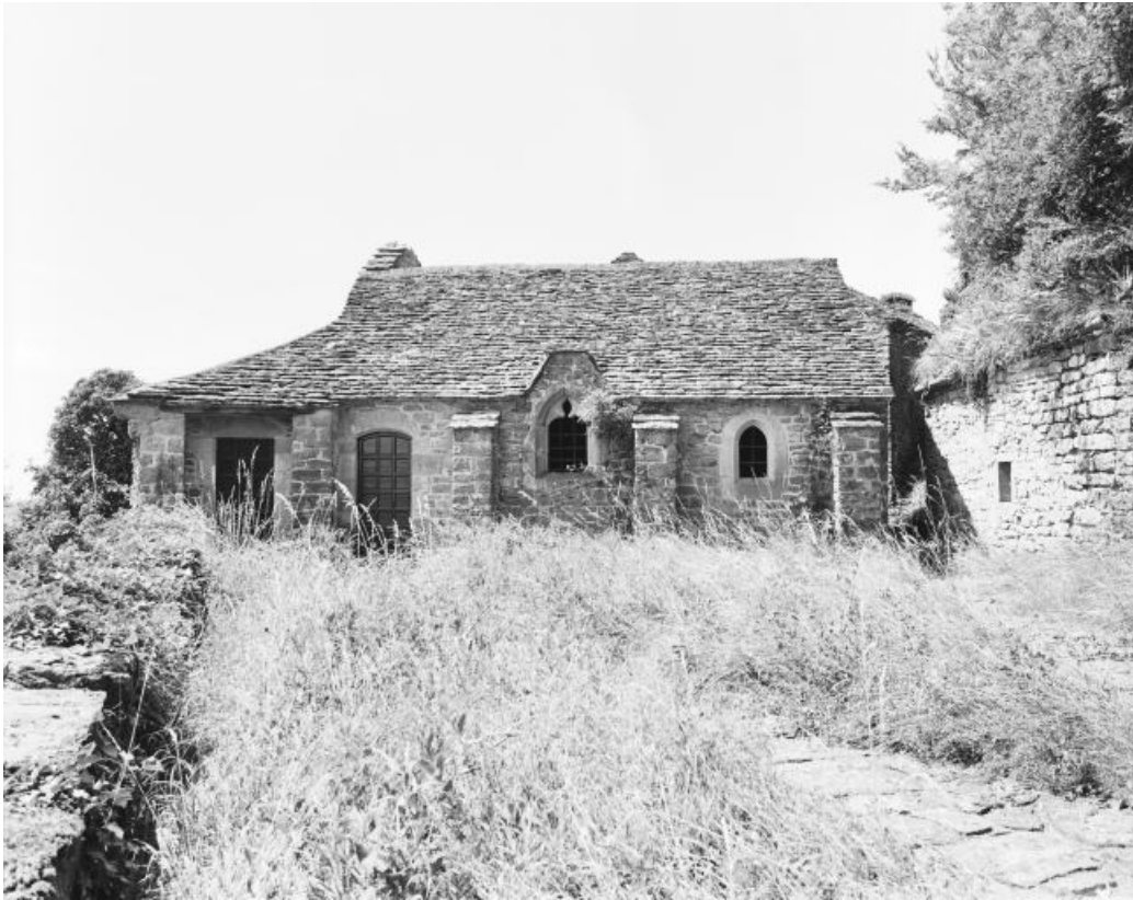
Façade latérale gauche de la chapelle.