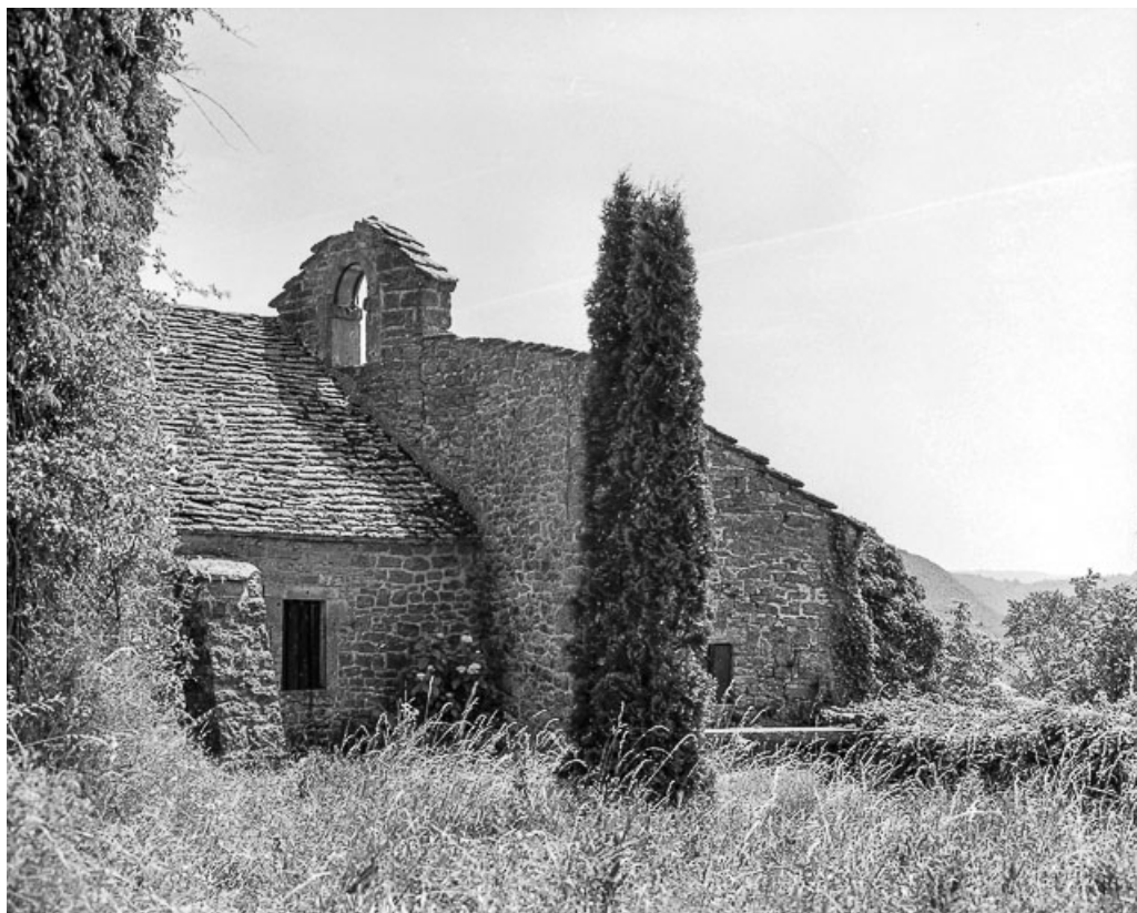
Face ouest, partie droite.