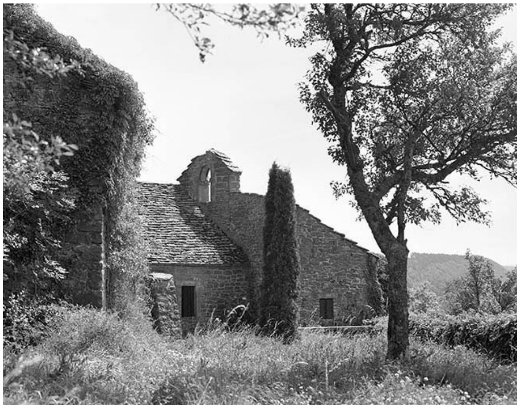
Face ouest, partie droite.