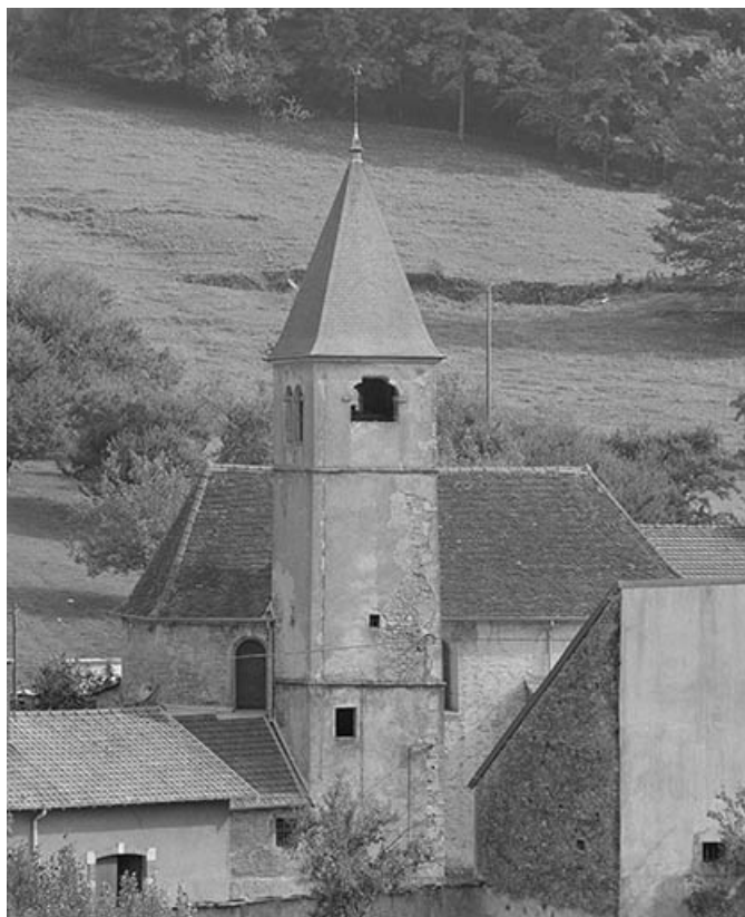
Extérieur : face latérale gauche.