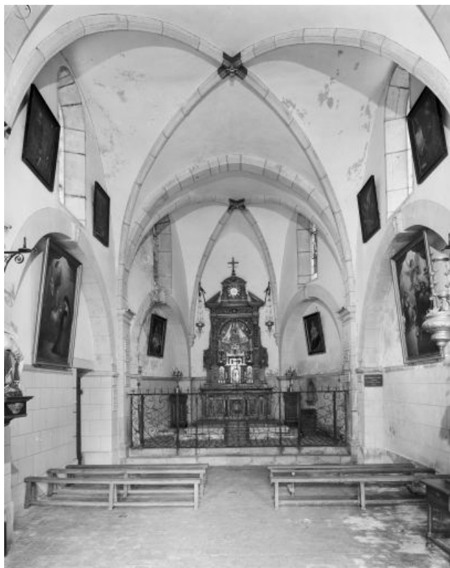
Vue de la nef et du chœur depuis l'entrée.