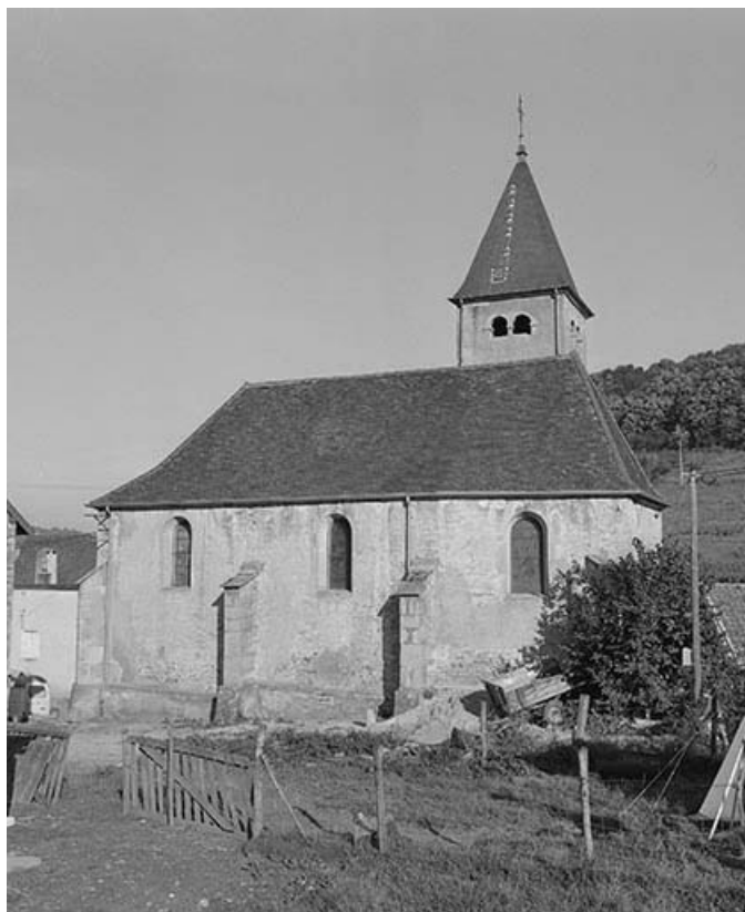
Extérieur : face latérale droite.