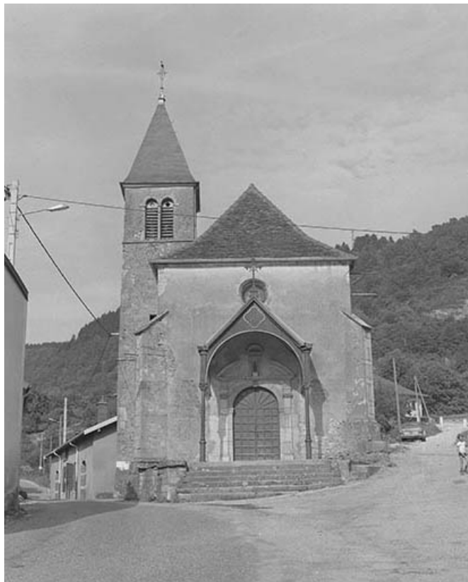
Extérieur : façade antérieure.