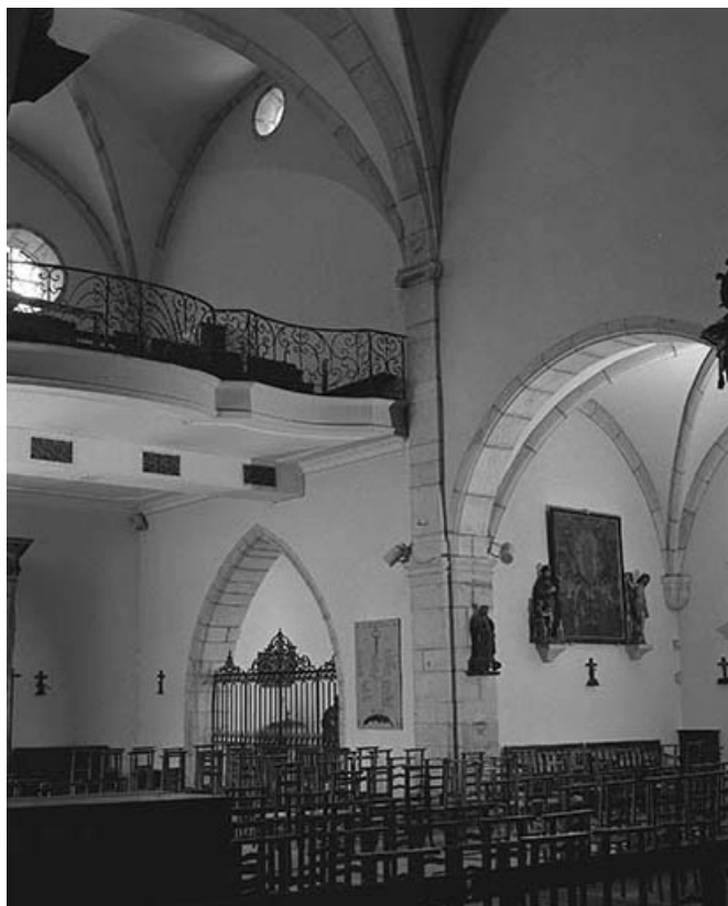
Intérieur : élévation gauche de la première travée de la nef . 39, Conliège Eglise