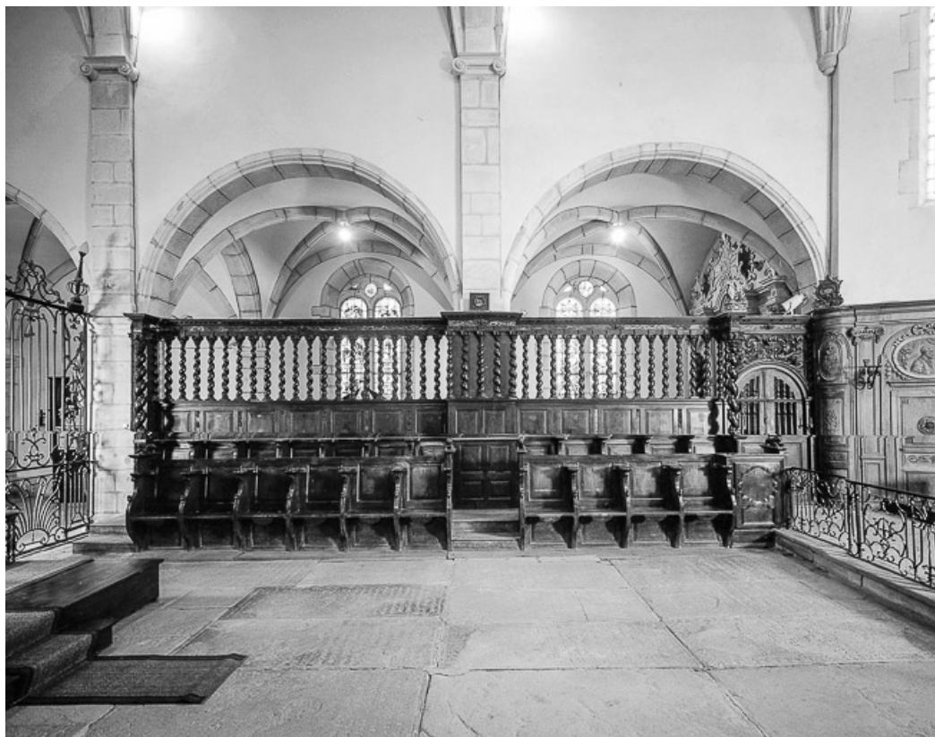
Intérieur : avant-choeur élévation gauche.