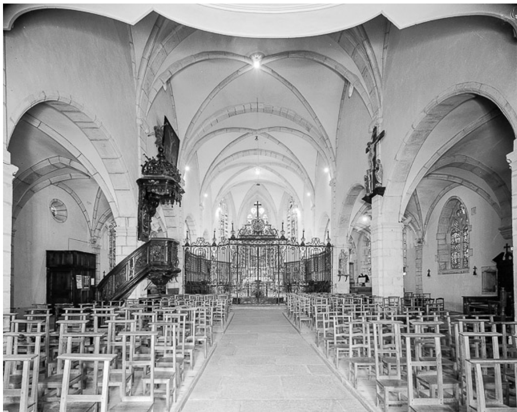
Intérieur : nef et chœur vus depuis l'entrée.