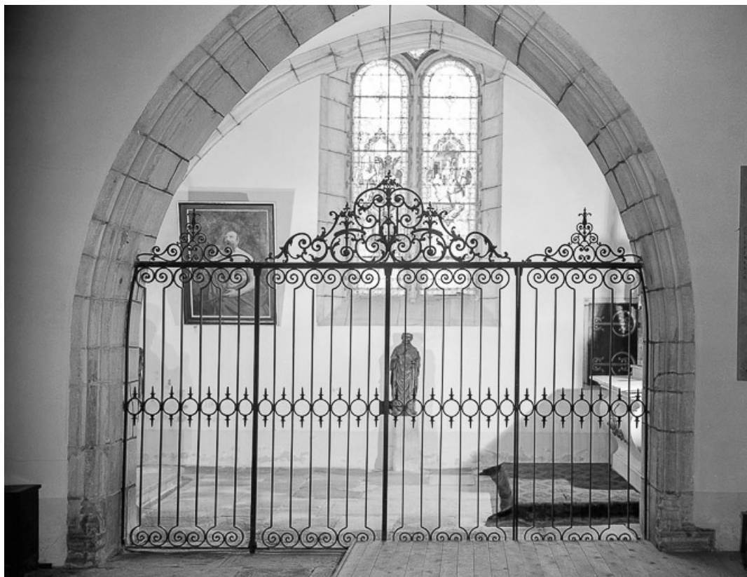
Intérieur : chapelle latérale gauche vue de la nef.