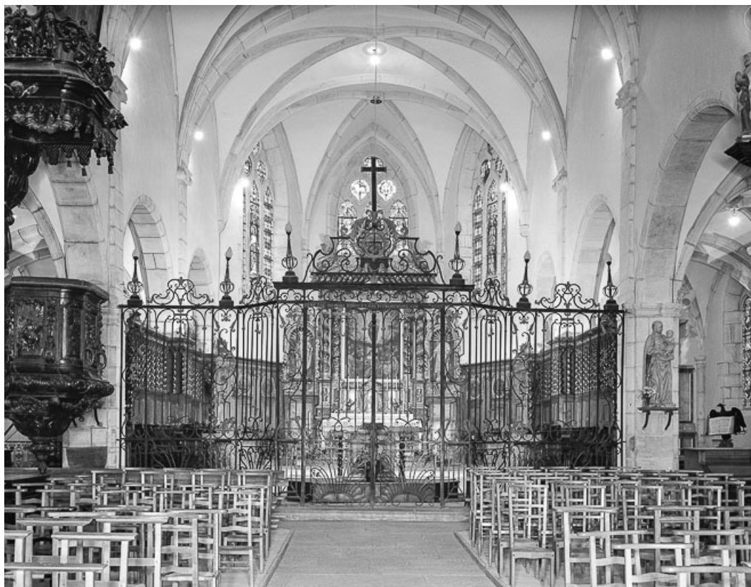
Intérieur : chœur vu de la nef.