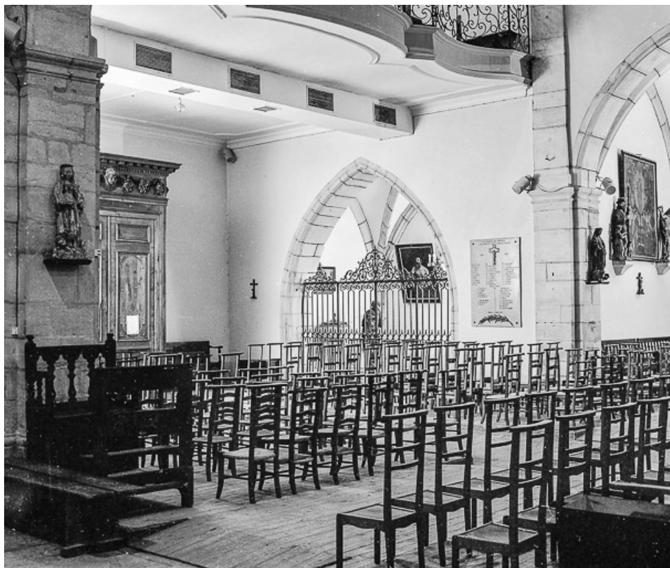
Intérieur : chapelle latérale gauche au fond de la nef vue du collatéral droit. 39, Conliège Eglise