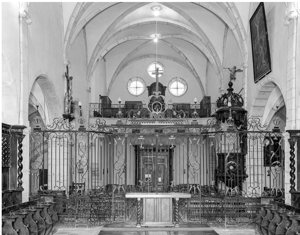
Intérieur : nef vue depuis l'avant-choeur . 39, Conliège Eglise