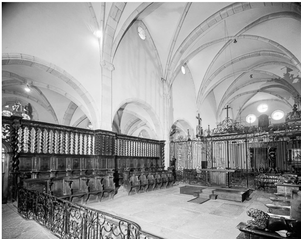
Intérieur : nef et avant-choeur, élévation droite vue depuis le choeur . 39, Conliège Eglise