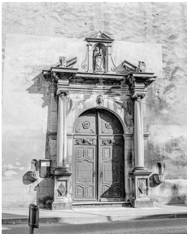
Portail de la façade antérieure : vue générale.