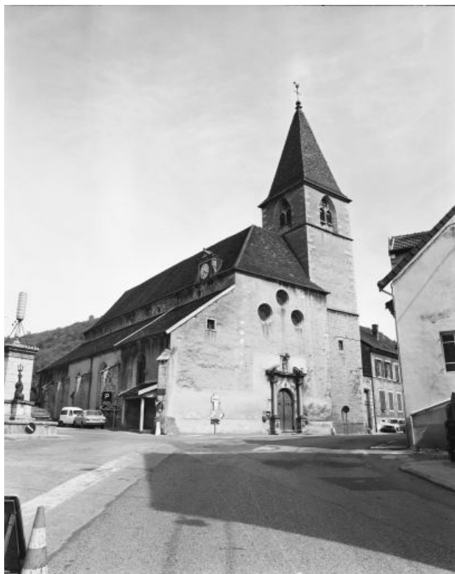
Vue d'ensemble de trois quarts gauche. 39, Conliège Eglise