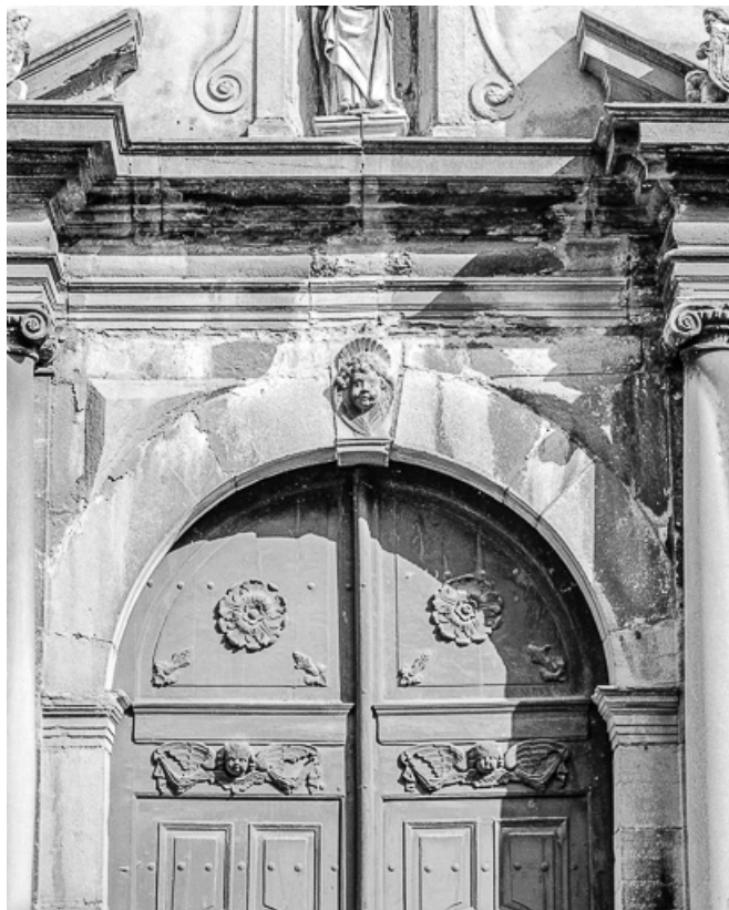
Portail de la façade antérieure : : partie supérieure.