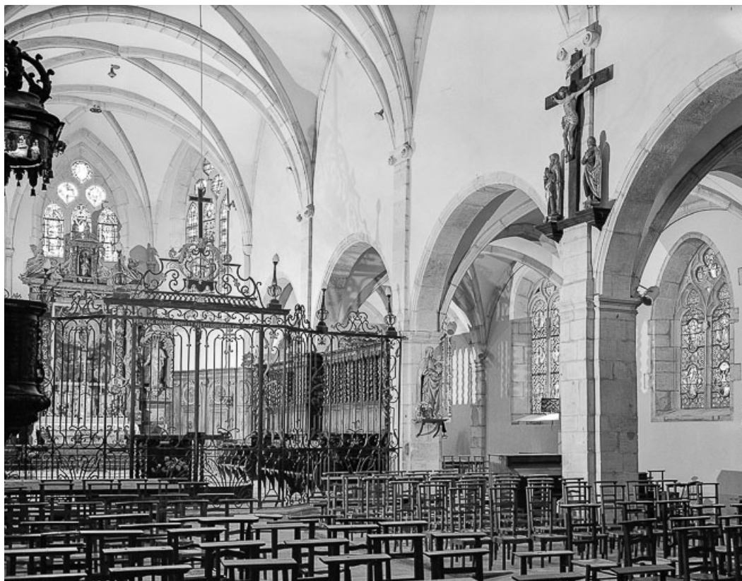
Intérieur : élévation droite vue depuis la nef . 39, Conliège Eglise