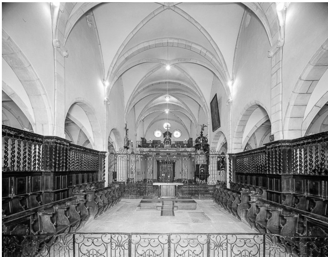
Intérieur : avant-choeur et nef vus depuis le chœur.