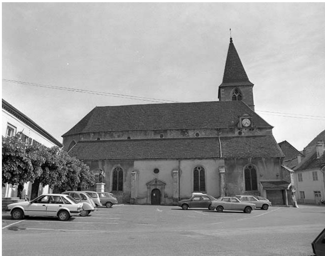
Extérieur : face latérale gauche.