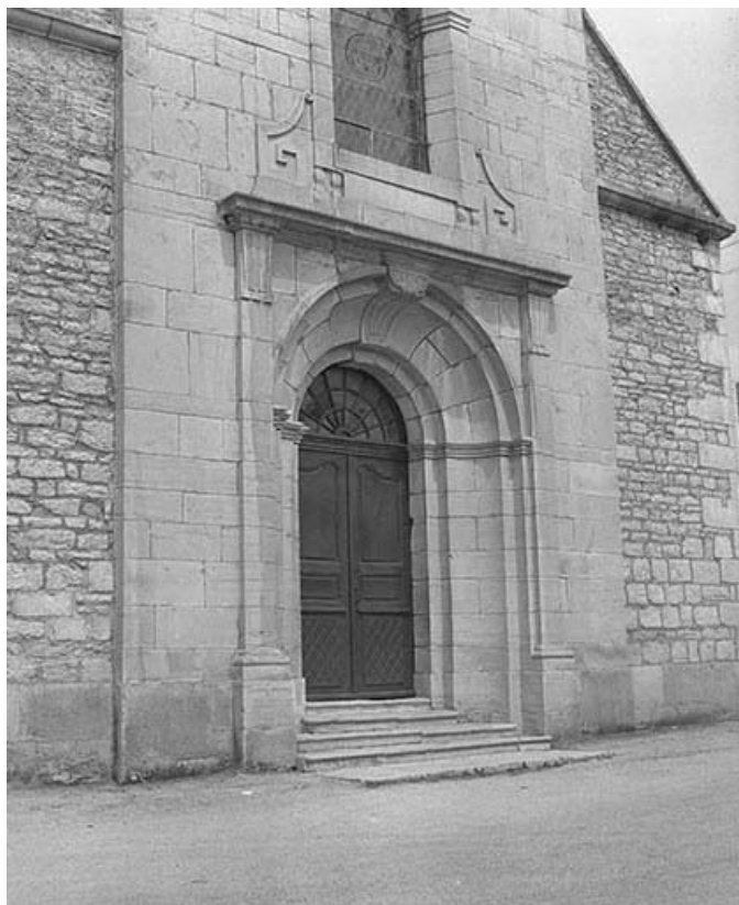
Extérieur : portail.