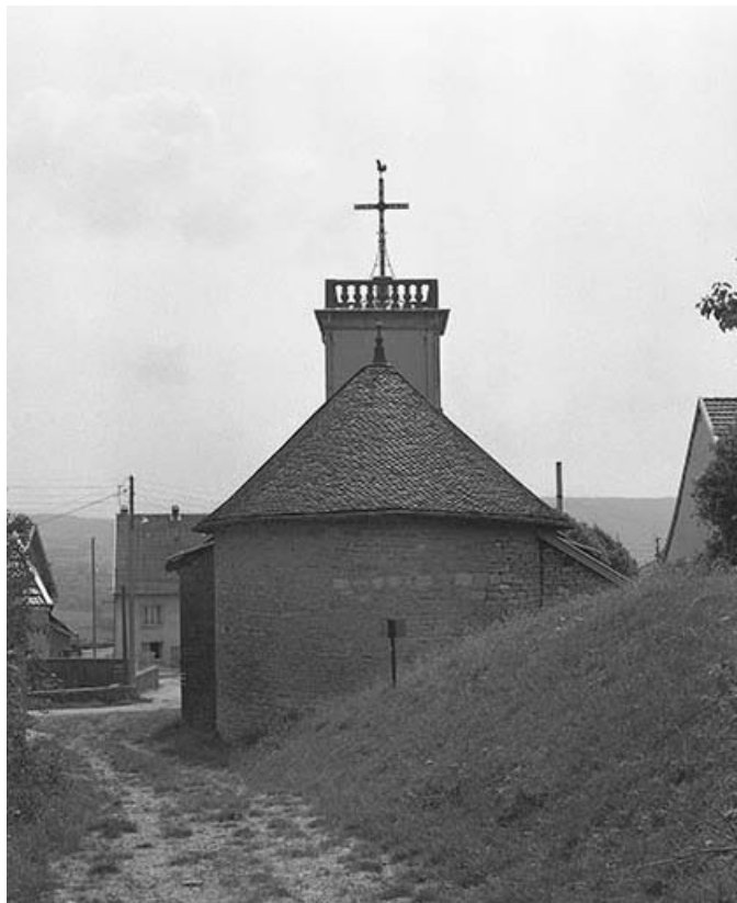
Extérieur : abside, vue de face.