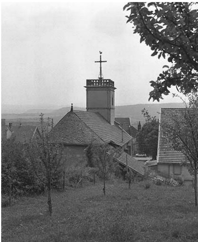
Extérieur : abside, vue de trois quarts.