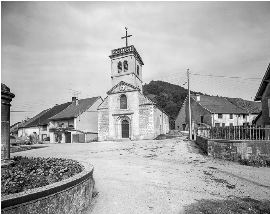
Extérieur : façade antérieure.