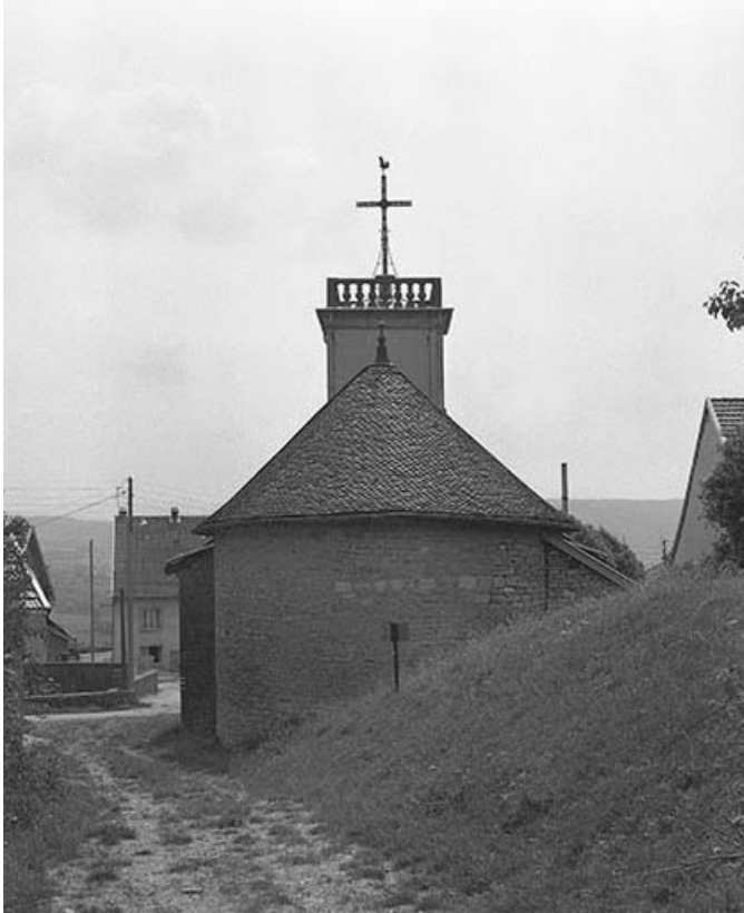
Extérieur : abside, vue de face.