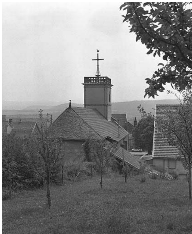
Extérieur : abside, vue de trois quarts.