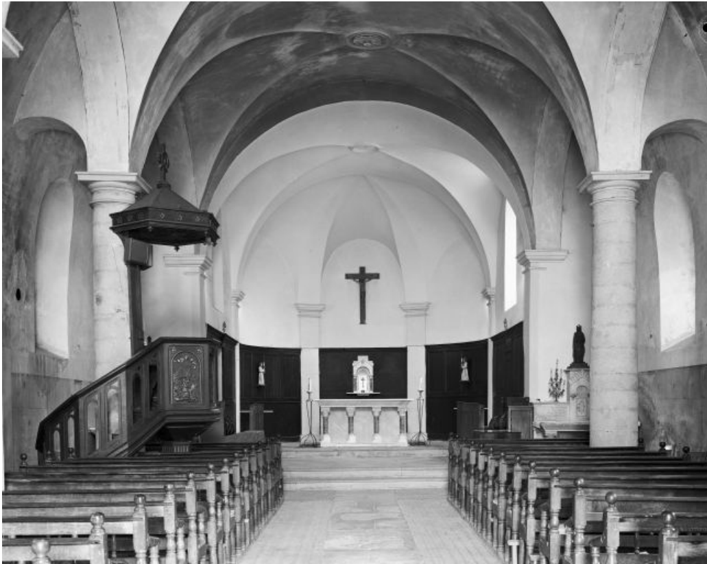
La nef et le chœur vus depuis l'entrée. 39, Châtillon