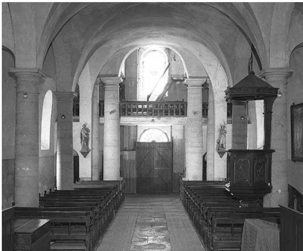
Intérieur : nef vue depuis le chœur.