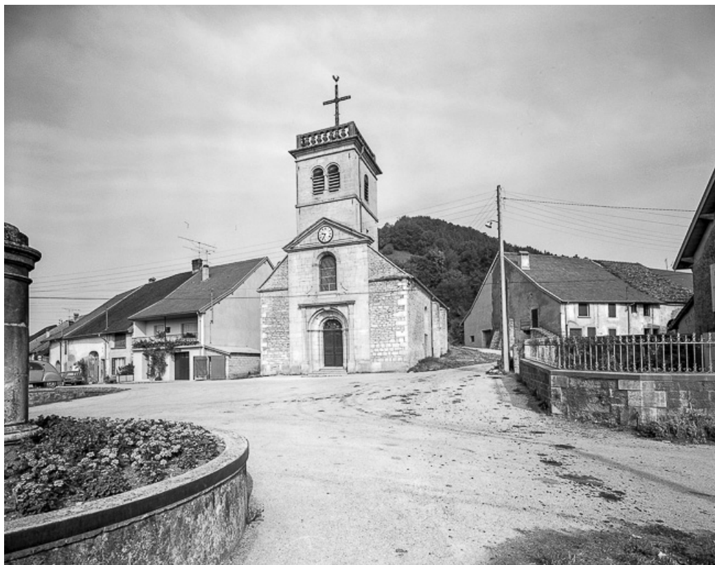
Extérieur : façade antérieure.