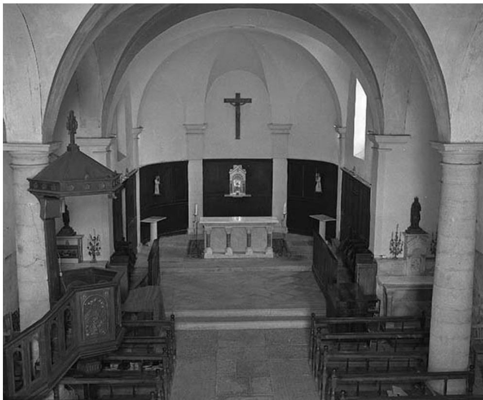
Intérieur : nef et chœur vus depuis la tribune.