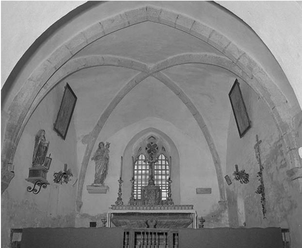
Intérieur : voûte du chœur.

39, Briod, lieudit : Saint-Etienne-de-Coldre