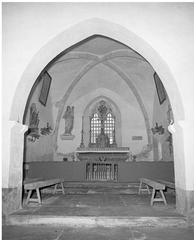
Intérieur : chœur vu depuis la nef.

39, Briod, lieudit : Saint-Etienne-de-Coldre