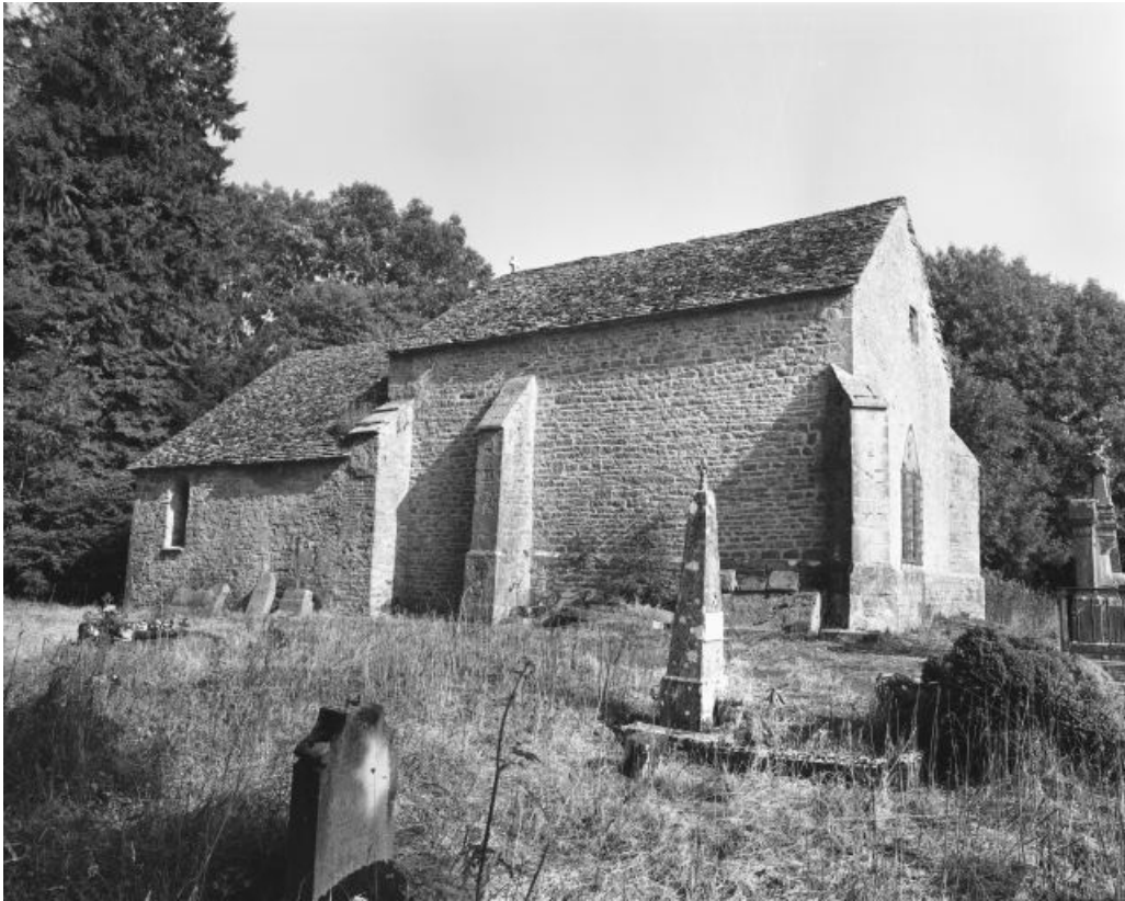
Extérieur : face droite.

39, Briod, lieudit : Saint-Etienne-de-Coldre