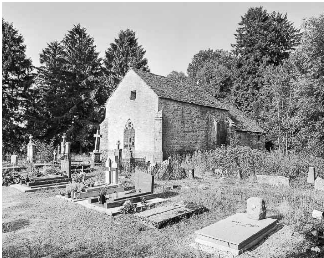
Extérieur : chevet et face gauche.

39, Briod, lieudit : Saint-Etienne-de-Coldre