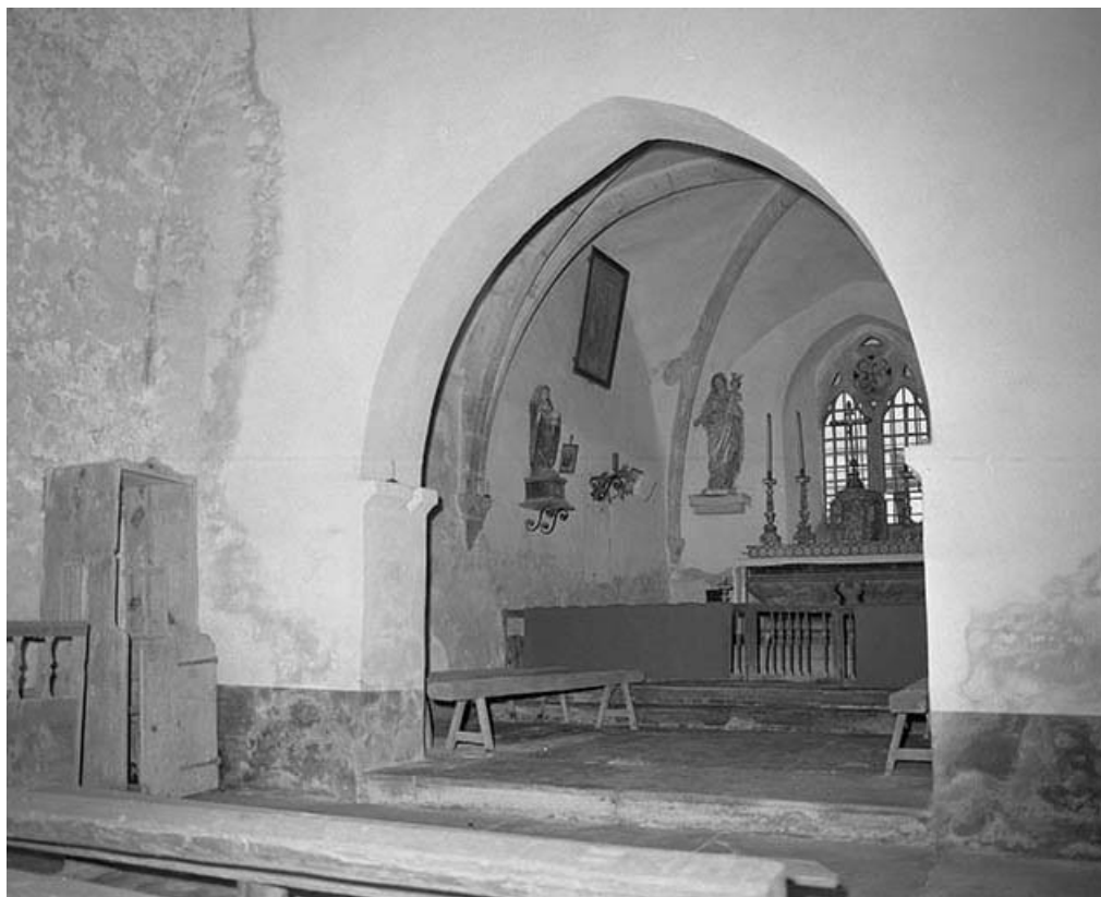
Intérieur : chœur, élévation gauche vue depuis la nef.

39, Briod, lieudit : Saint-Etienne-de-Coldre