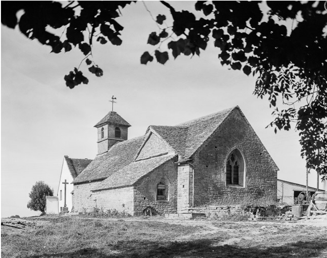
Extérieur : chevet et face droite.