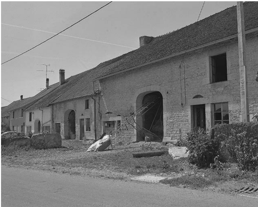
Façade antérieure vue de trois quarts droit.