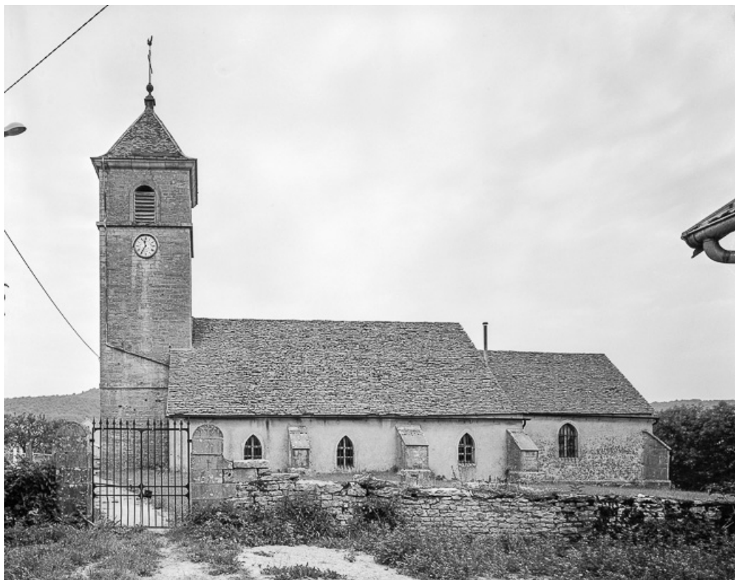
Extérieur : face droite