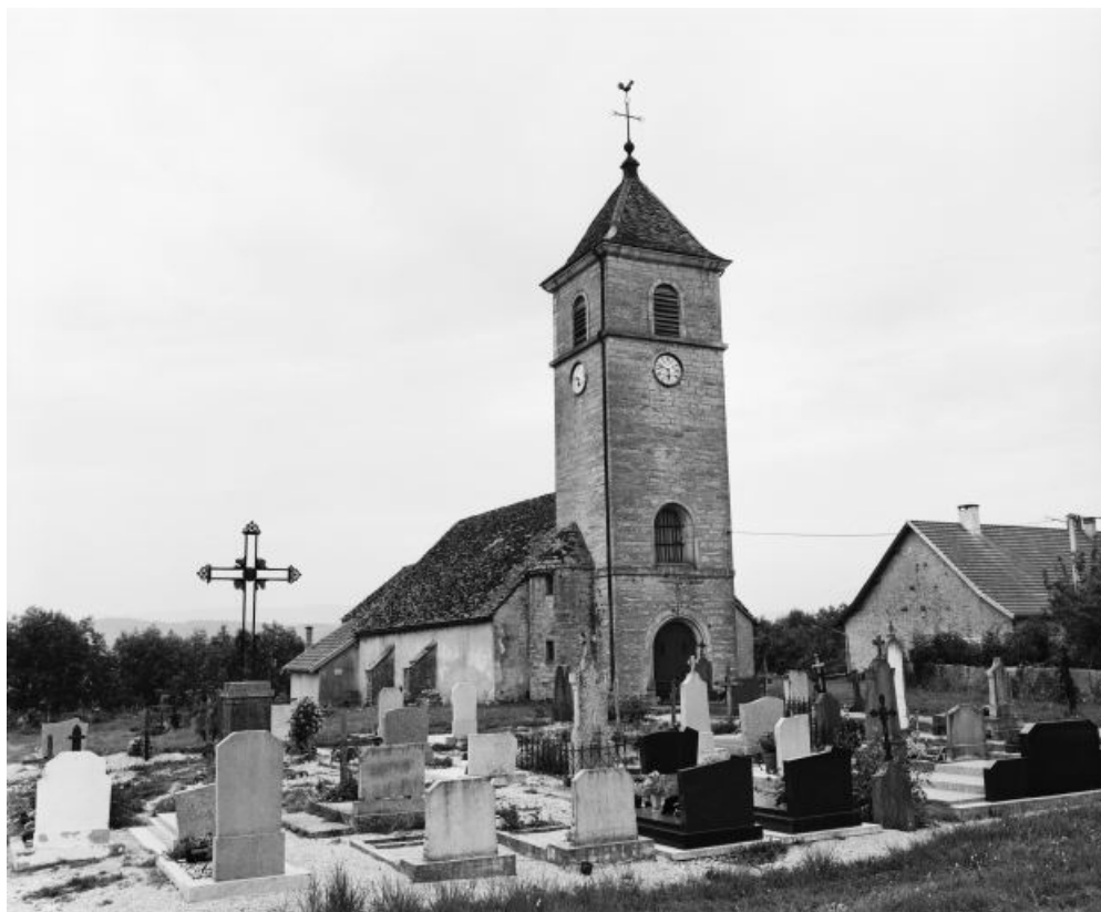
Façades antérieure et latérale gauche. 39, Blye