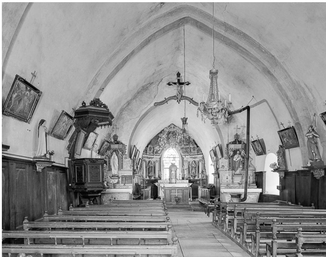
Intérieur : nef et choeur vus de l'entrée. 39, Blye