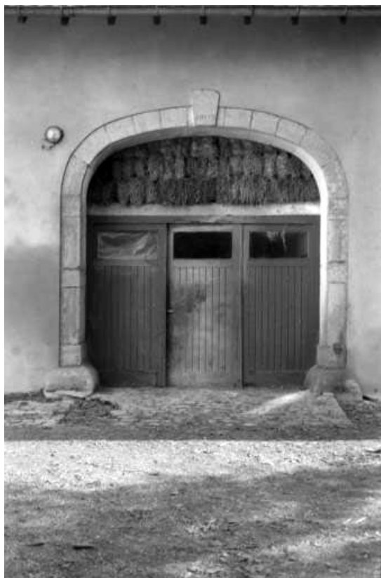
Partie agricole : porte de grange.