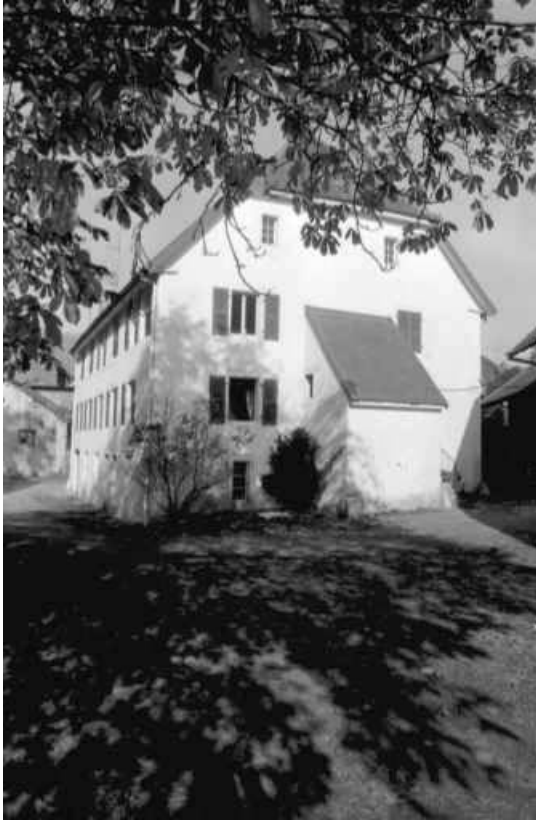
Pignon droit de l'habitation actuelle. 25, Dasle rue du Moulin