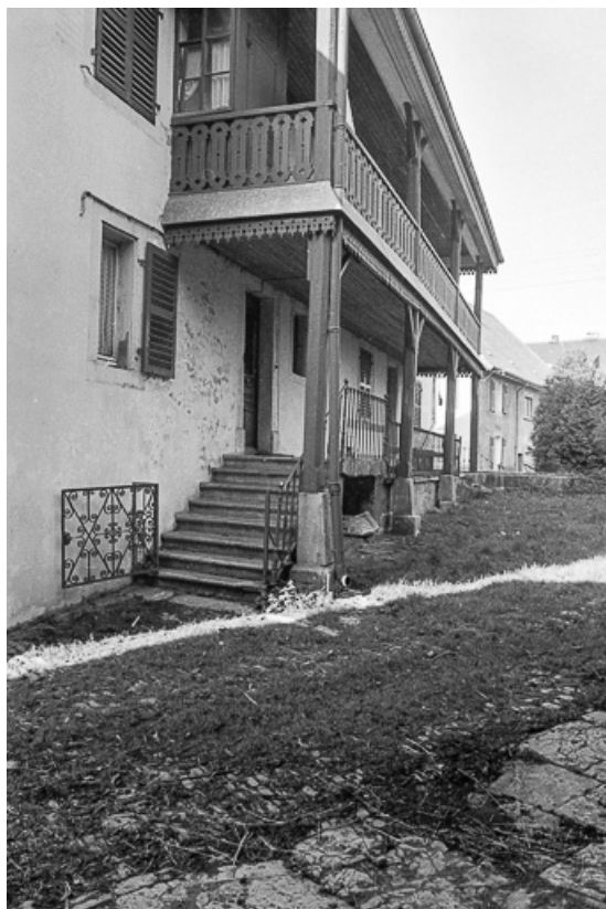
Façade postérieure de l'habitation : les galeries. 25, Dasle rue du Moulin