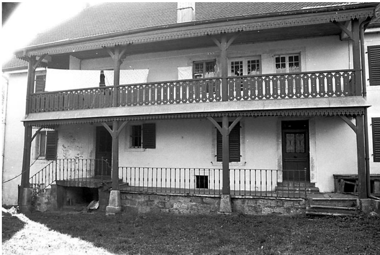
Façade postérieure de la meunerie-logis. 25, Dasle rue du Moulin