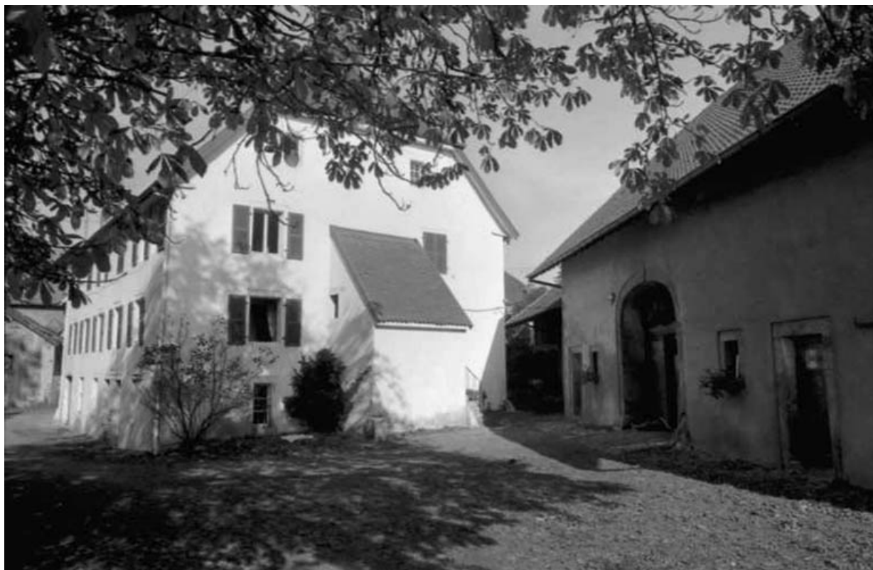
Pignon droit de l'habitation et partie agricole.