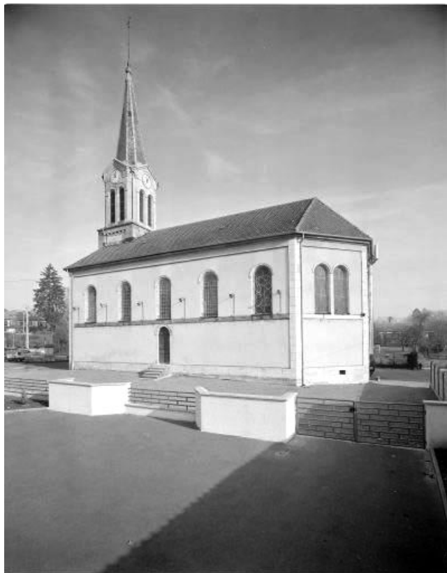
Vue de trois quarts droit.