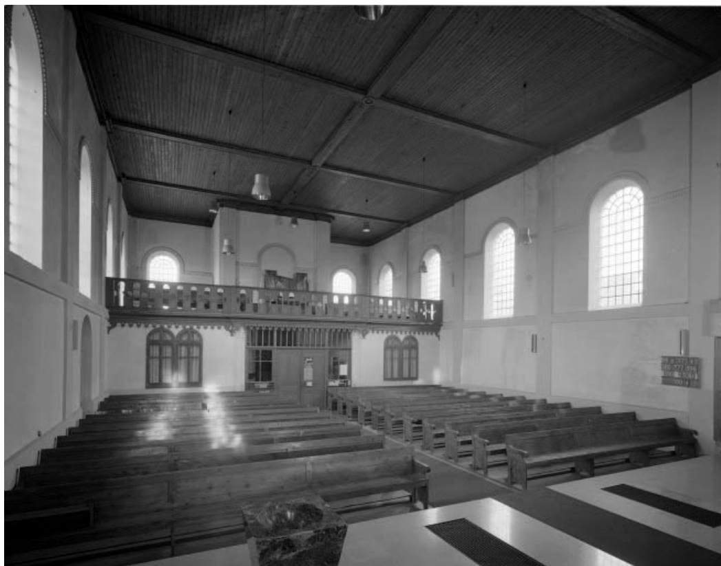
La nef vue depuis le chœur.