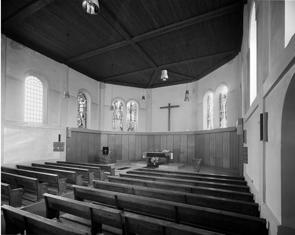
La nef vue depuis l'entrée.