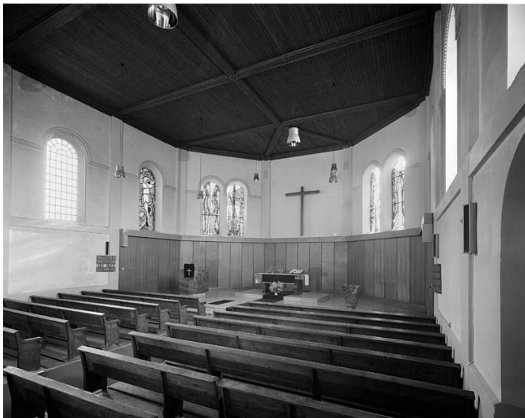
La nef vue depuis l'entrée.