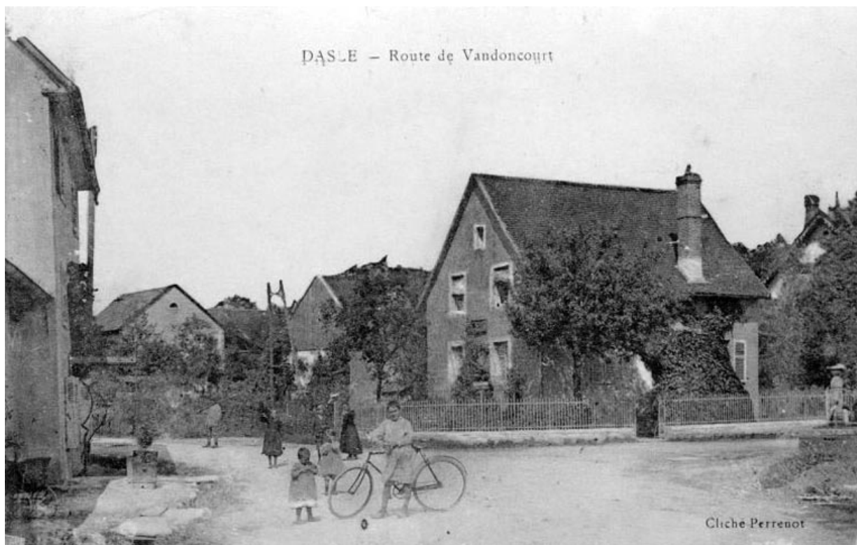
Route de Vandoncourt. 25, Dasle