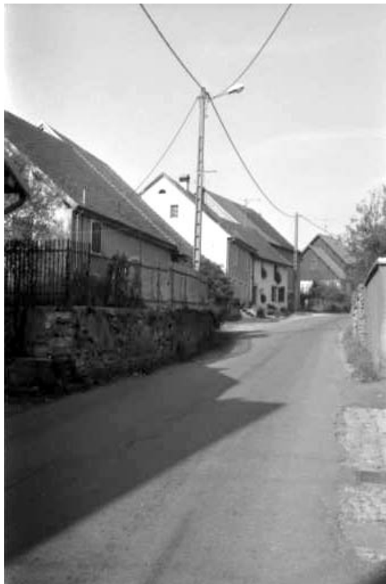
Ensemble de maisons.