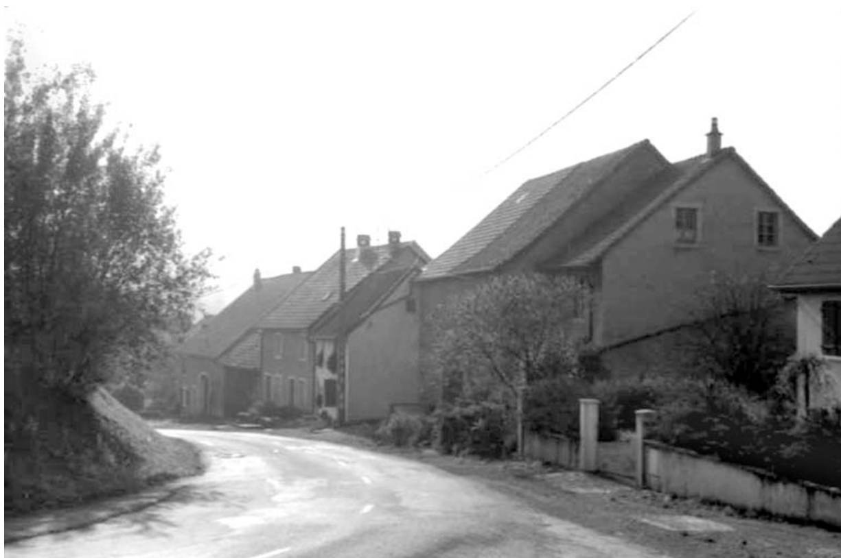
Alignement de maisons. Vue de trois quarts droit.