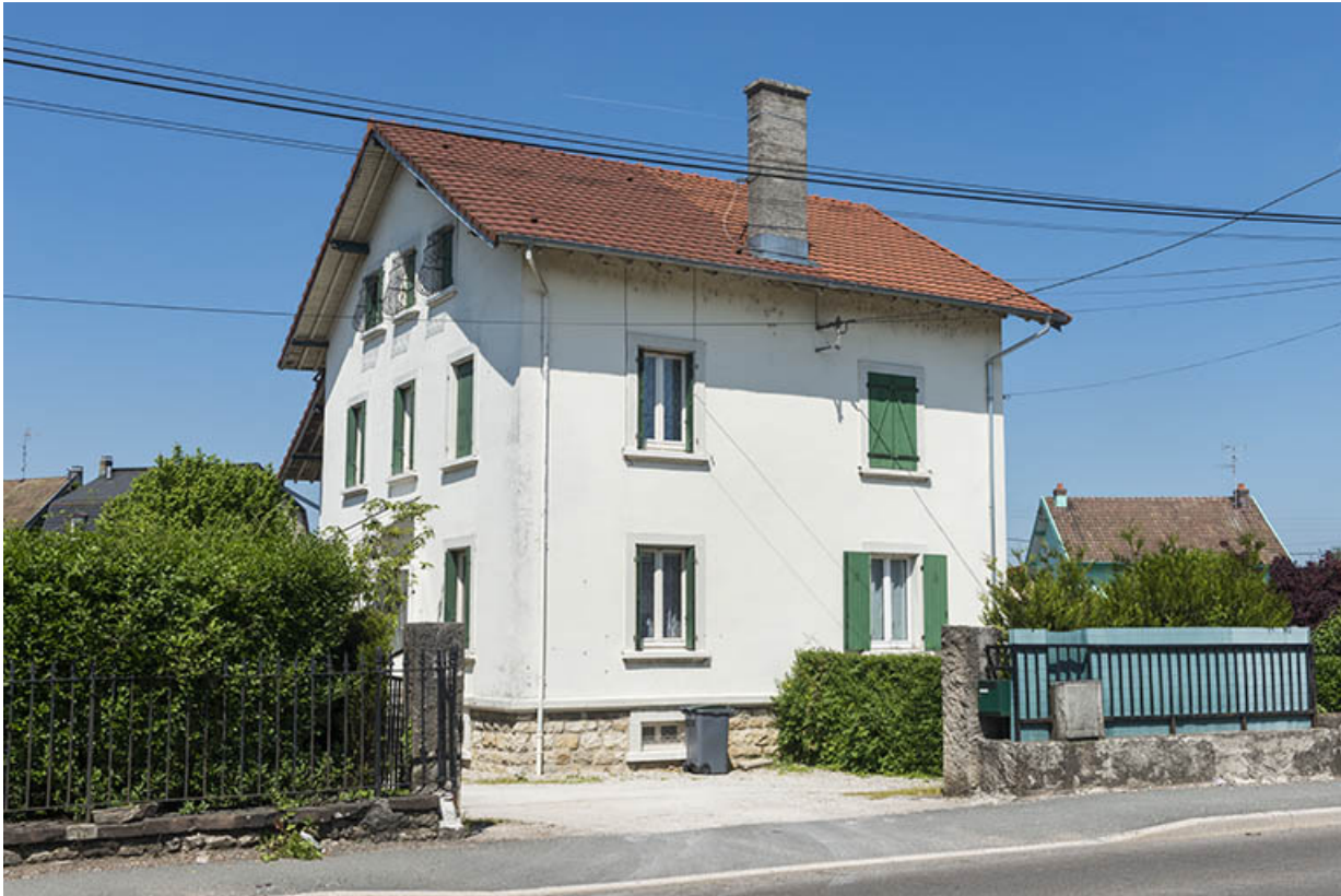
Maison de contremaître dite de type "basque".