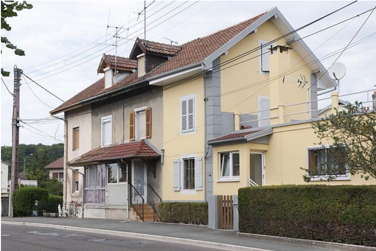
Habitation à 4 logements depuis l'avenue Jean Jaurès.