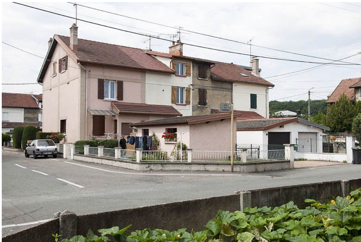
Habitation à 8 logements. Façade est. 25, Audincourt rue des Cités Es Combas