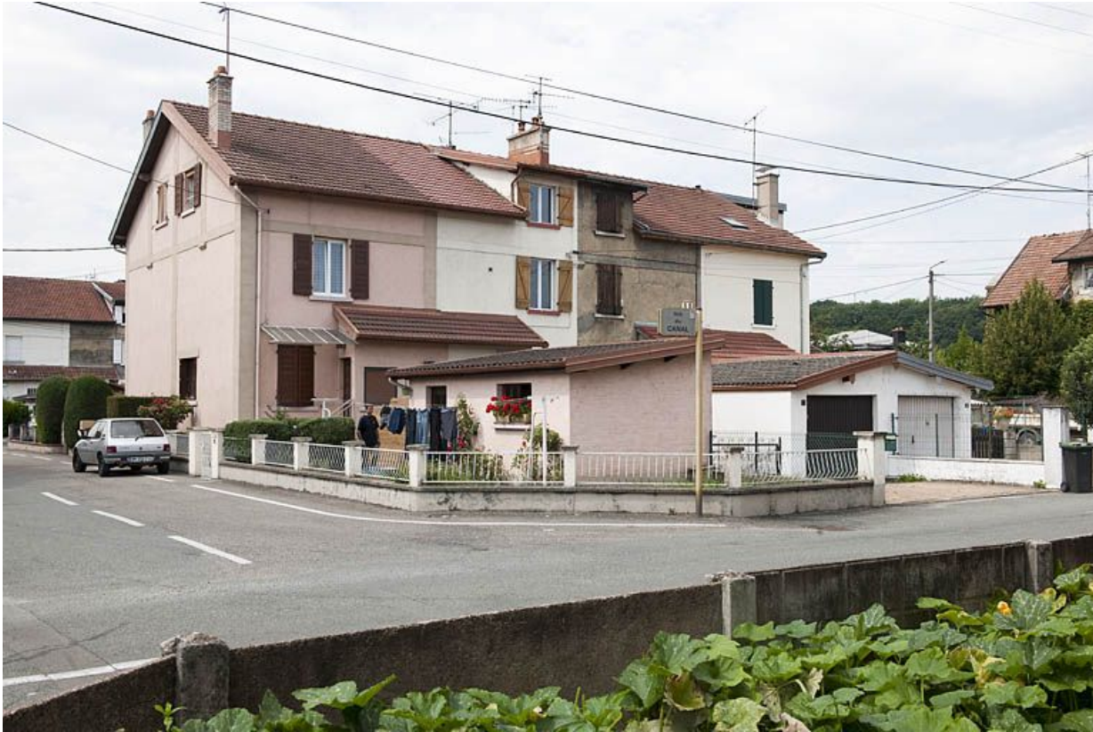
Habitation à 8 logements. Façade est.