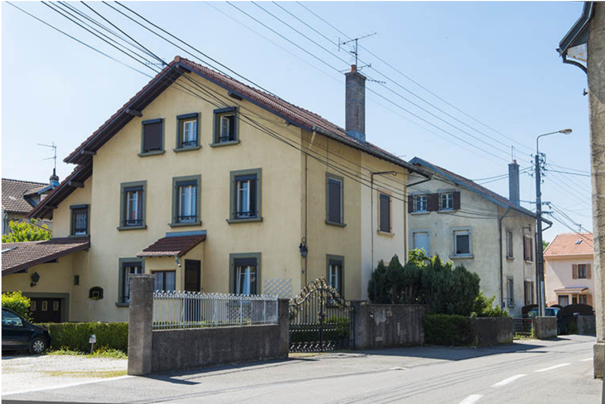
Groupe de 2 maisons de contremaître, dites "basques".