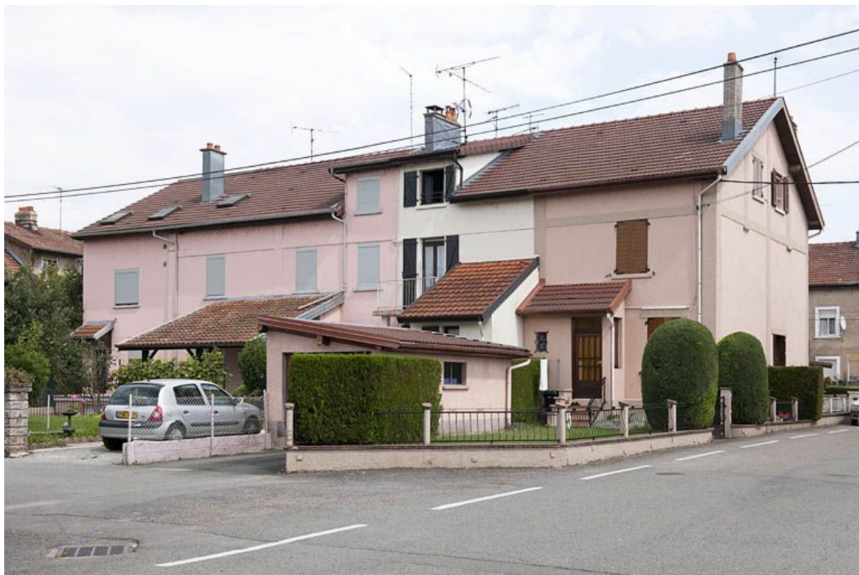
Habitation à 8 logements. Façade ouest. 25, Audincourt rue des Cités Es Combas