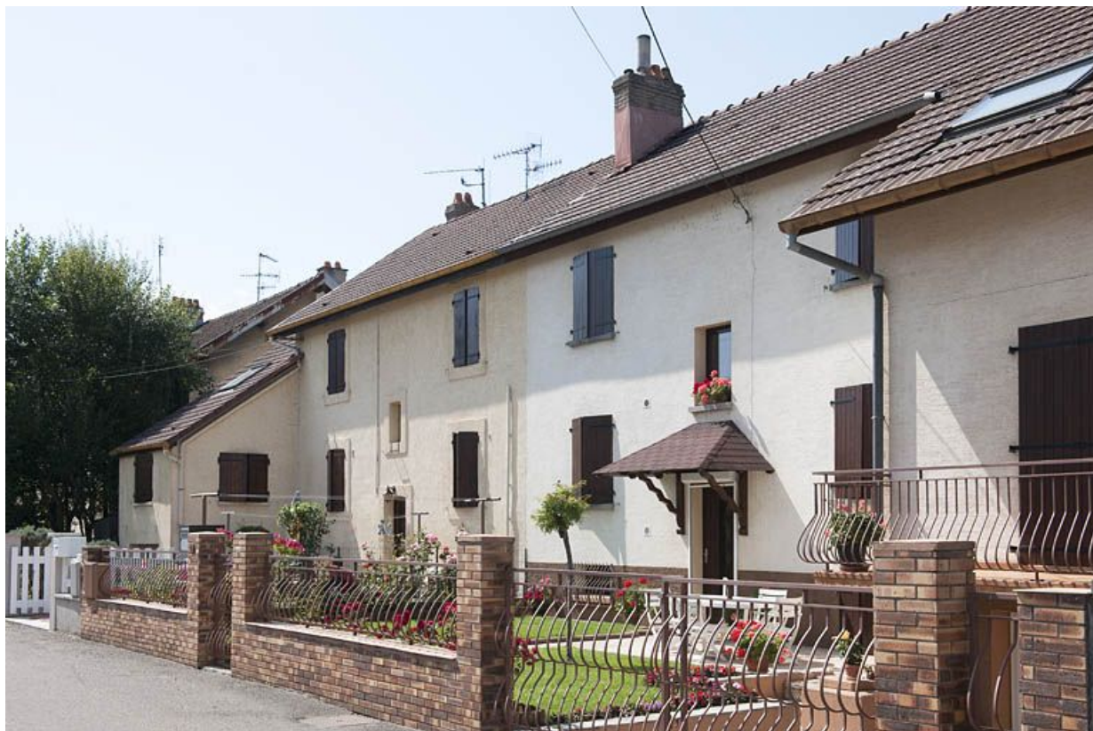
Habitation vue de trois quarts droite.