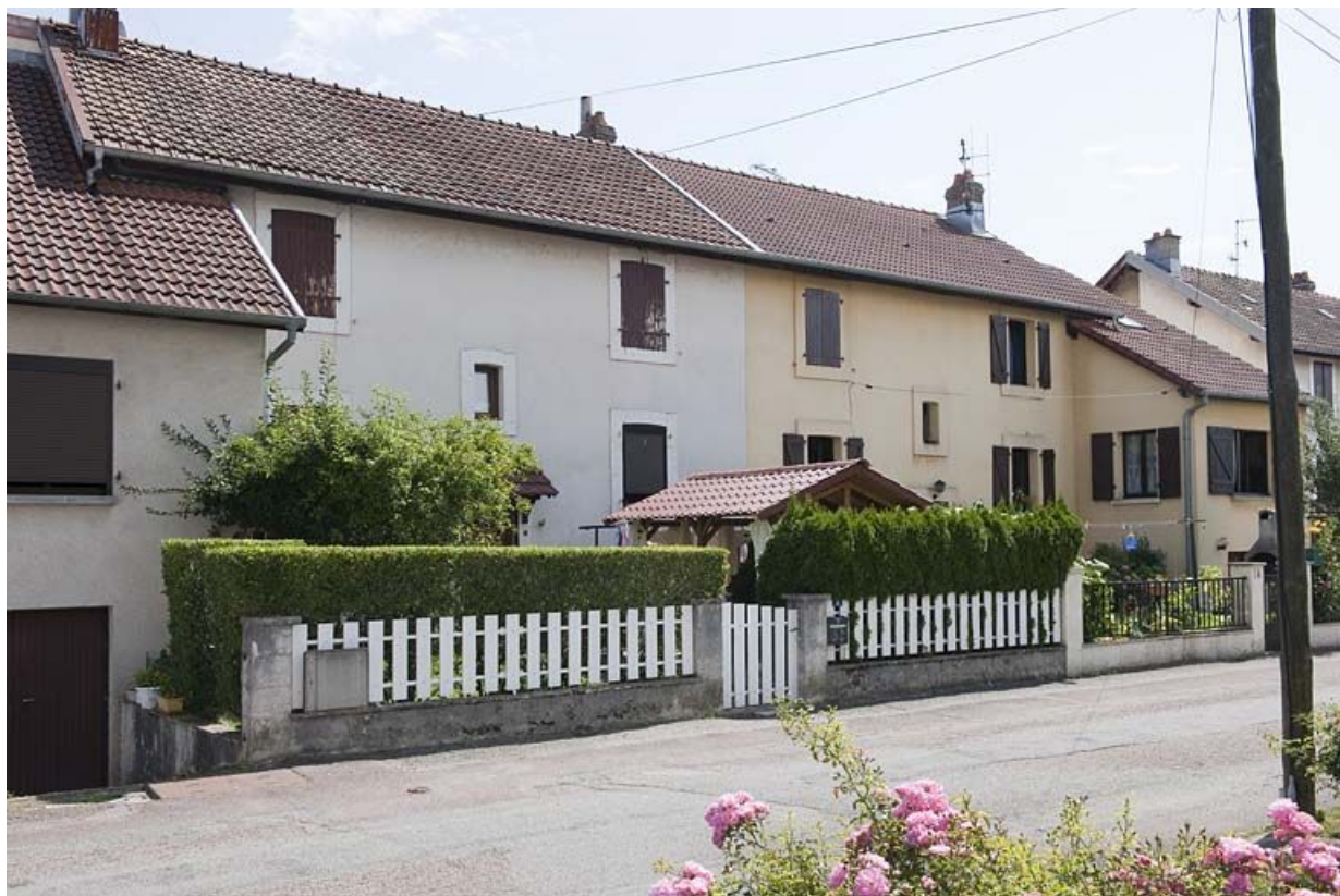
Habitation vue de trois quarts gauche.