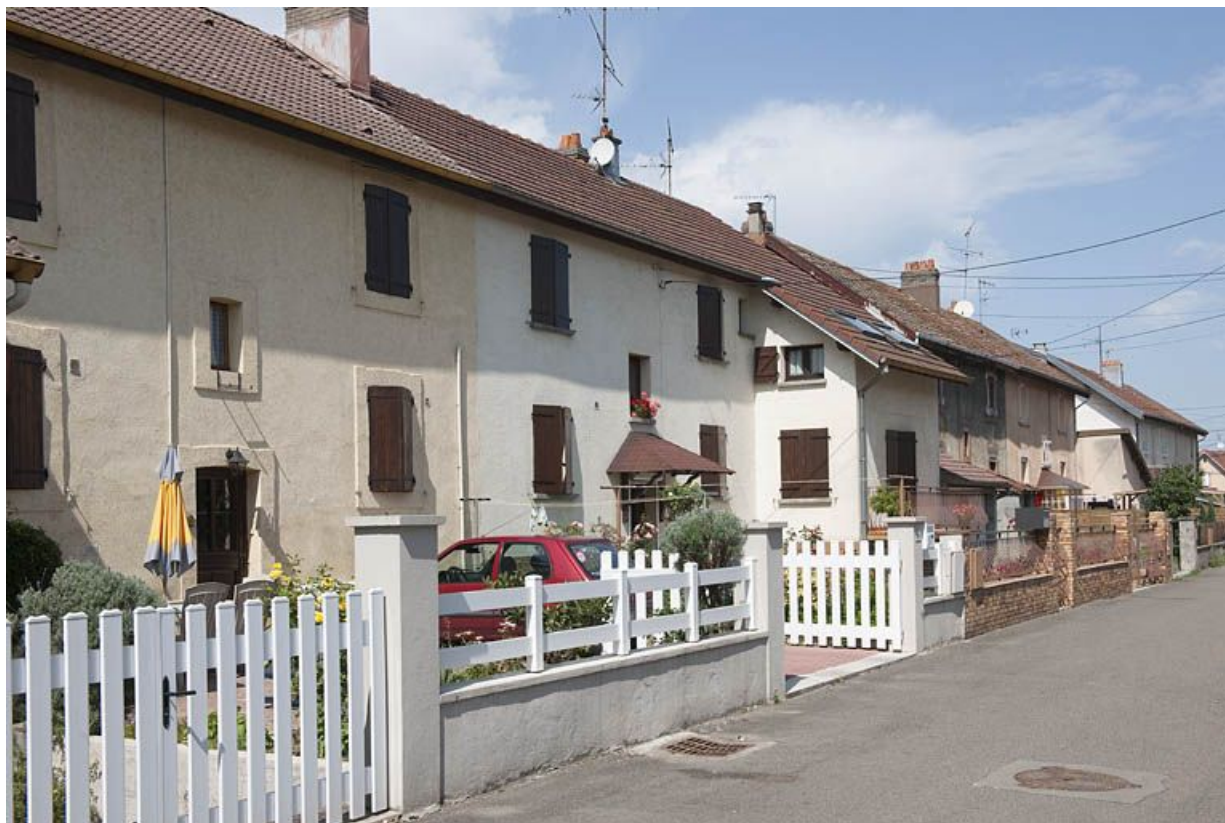
Alignements de maisons sur la rue.