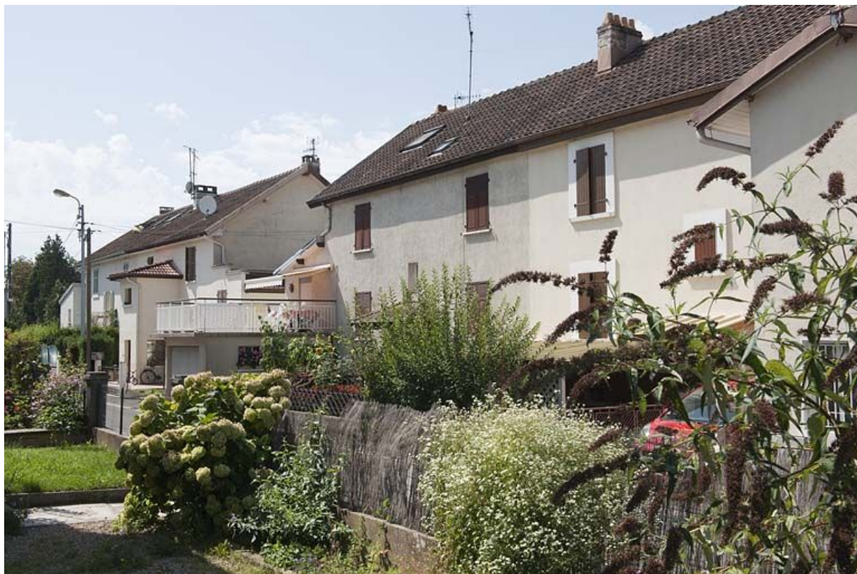
Façades postérieures vues de trois quarts.