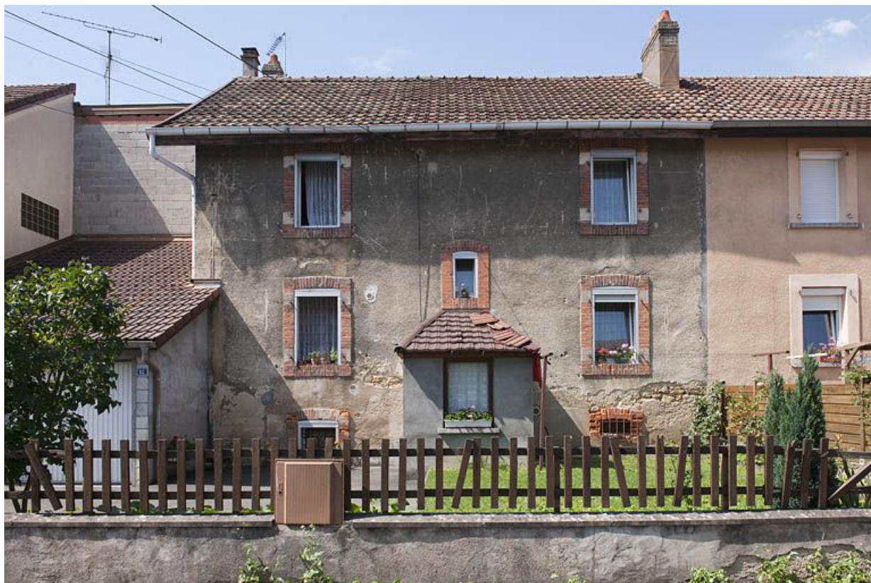
Façade antérieure vue de face.