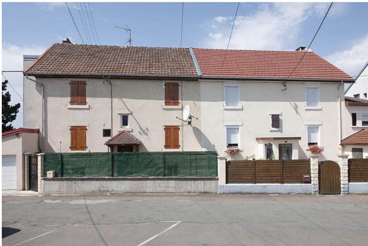
Habitation vue de face.