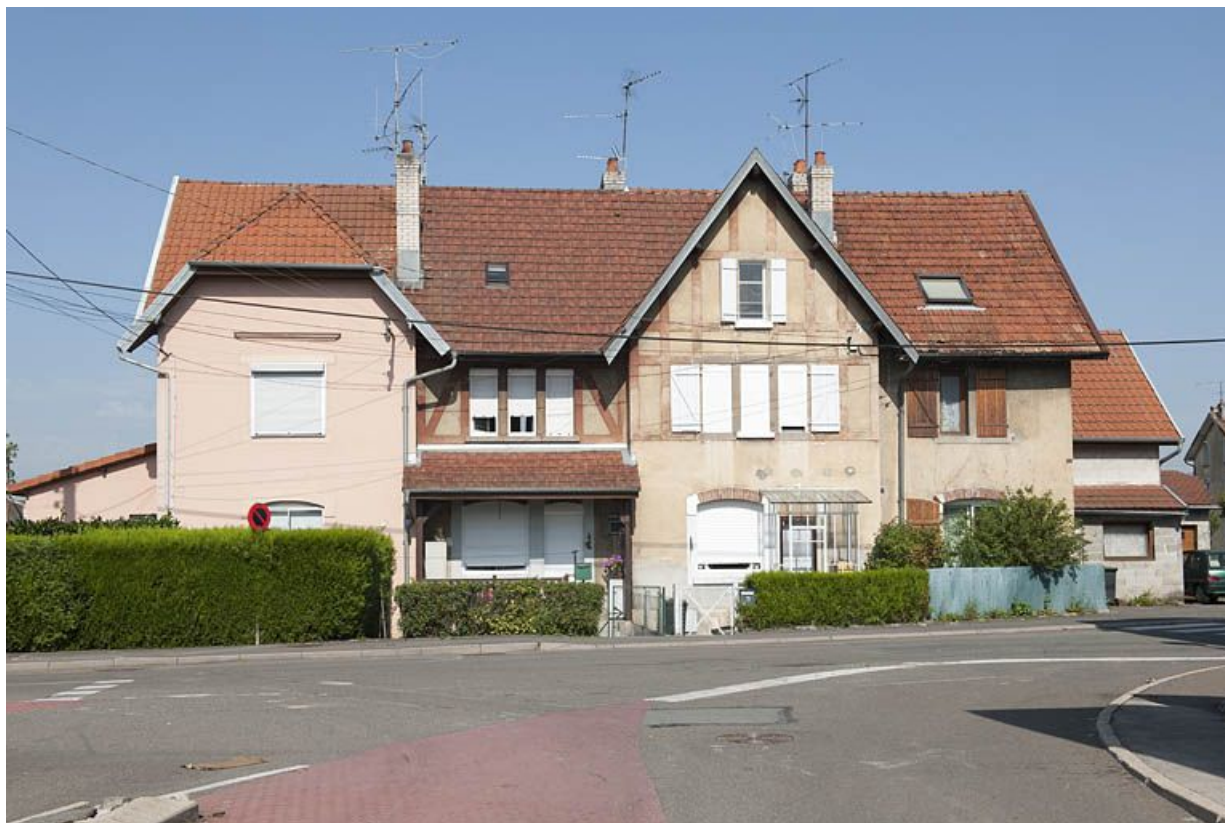
Habitation à quatre logements rue de Verdun. 25, Audincourt rue de Verdun