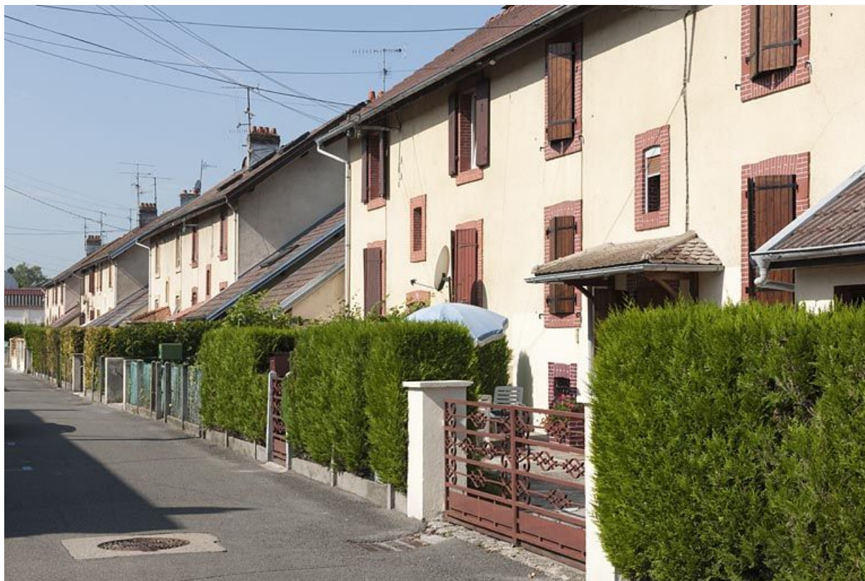
Rue de la Marne. Façades est. 25, Audincourt rue de Verdun