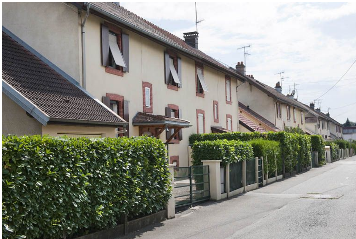
Vue de la rue de la Marne.