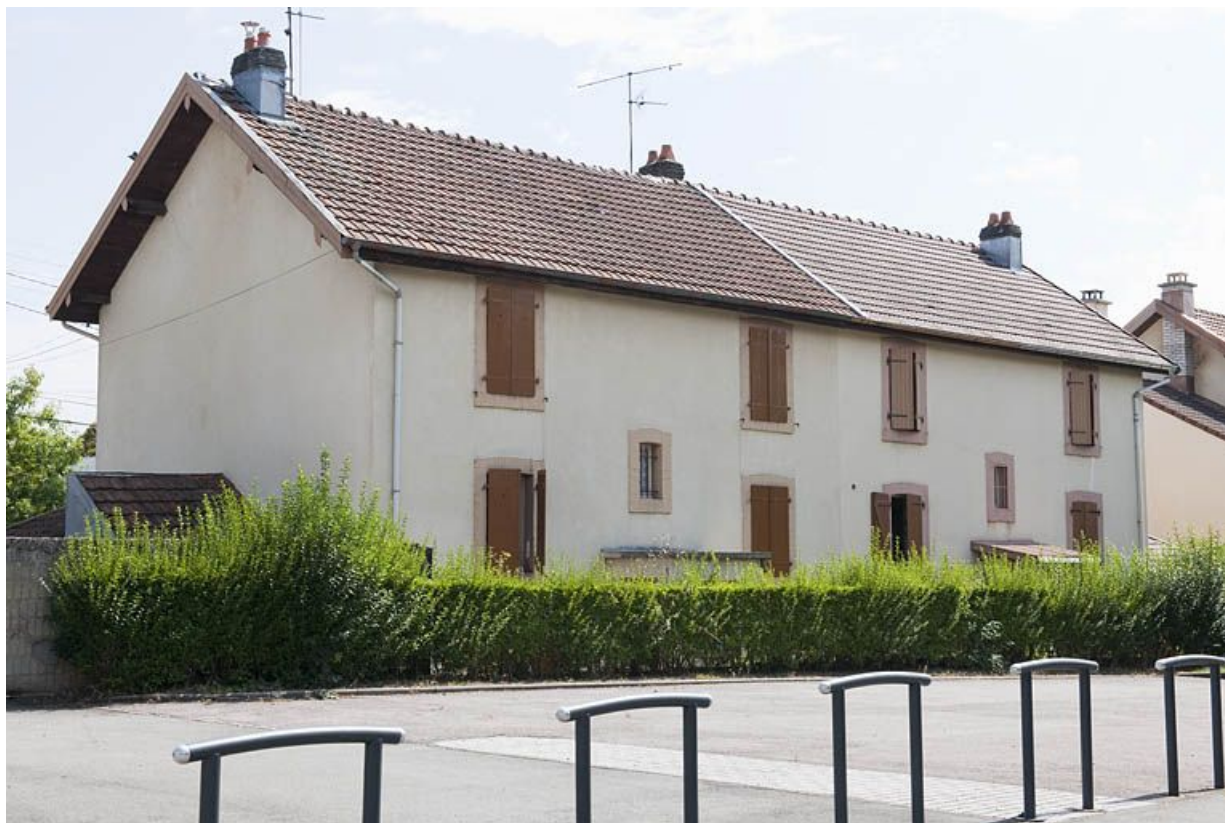
Rue de Verdun. Habitation vue de trois quarts arrière. 25, Audincourt rue de Verdun