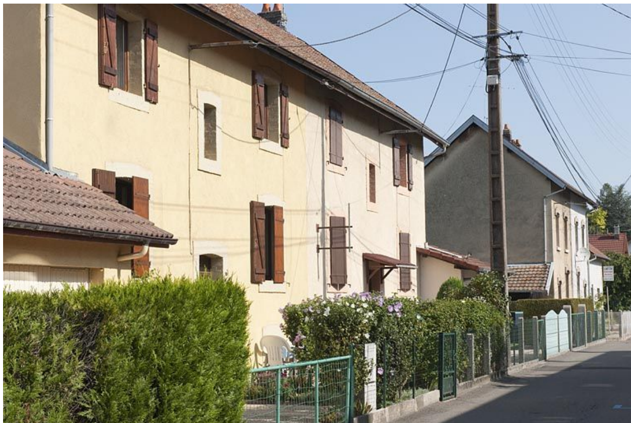
Habitations situées au nord de la rue de Verdun.