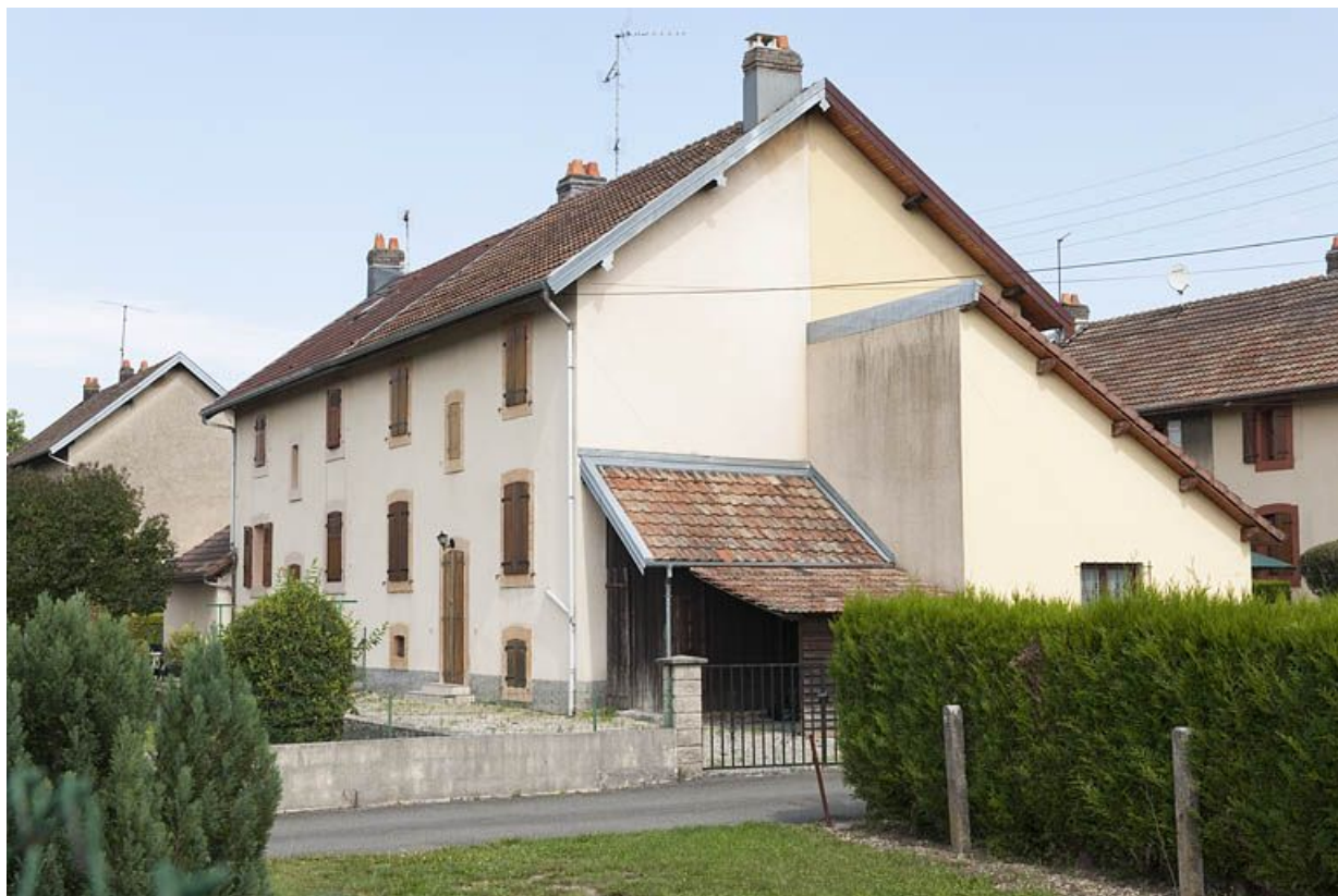
Habitation vue de trois quarts arrière.