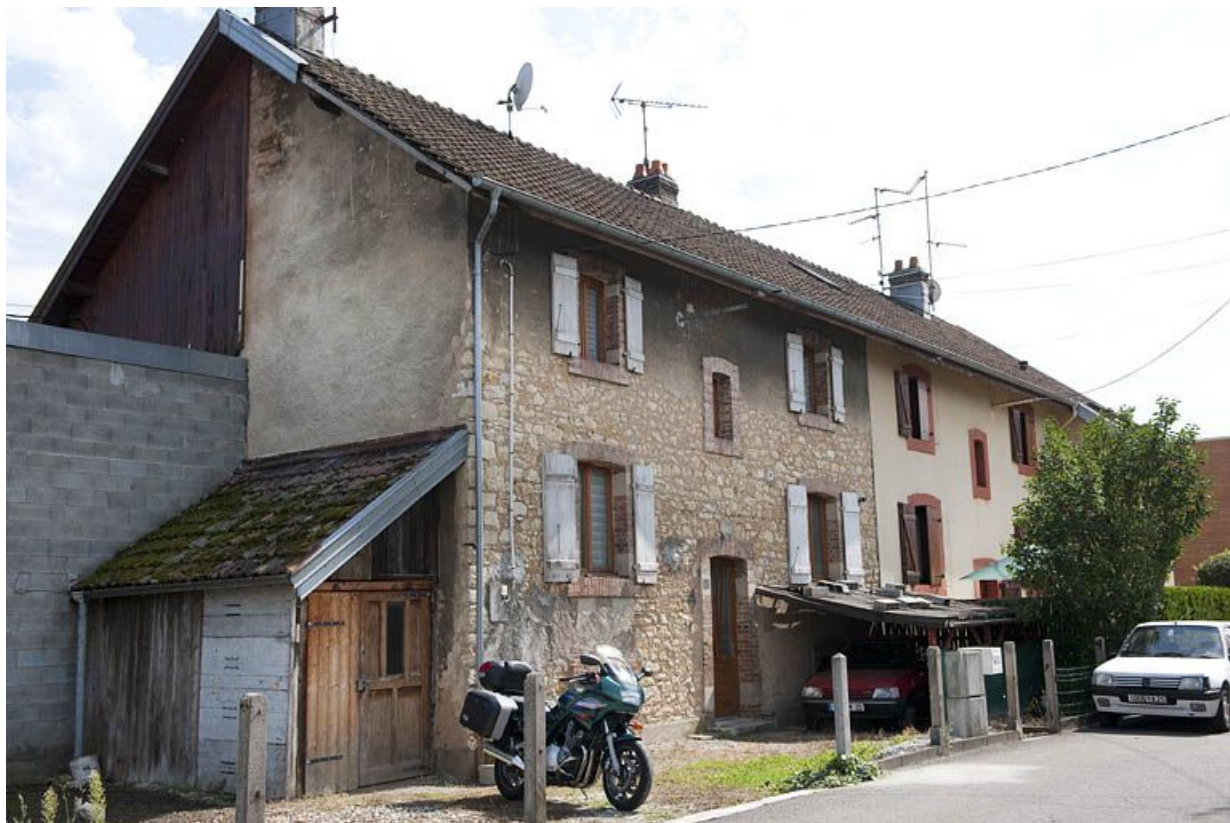
Rue de Verdun. Façade antérieure d'une habitation.