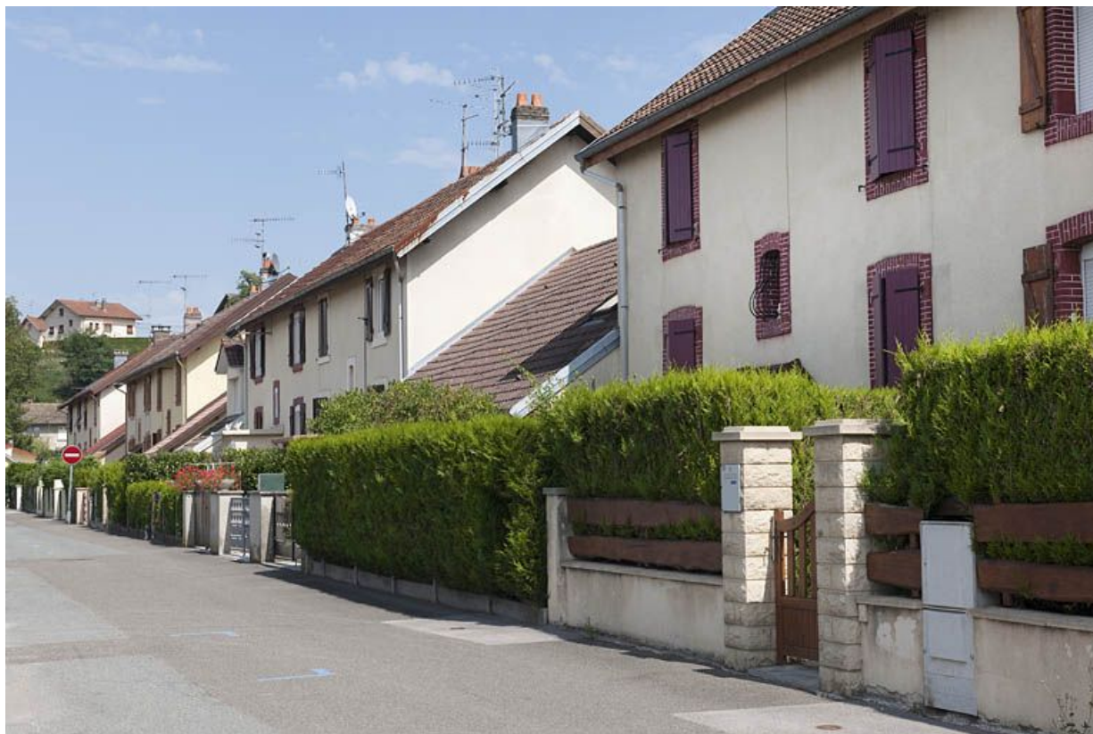
Rue d'Arras. Façades vues de trois quarts. 25, Audincourt rue de Verdun