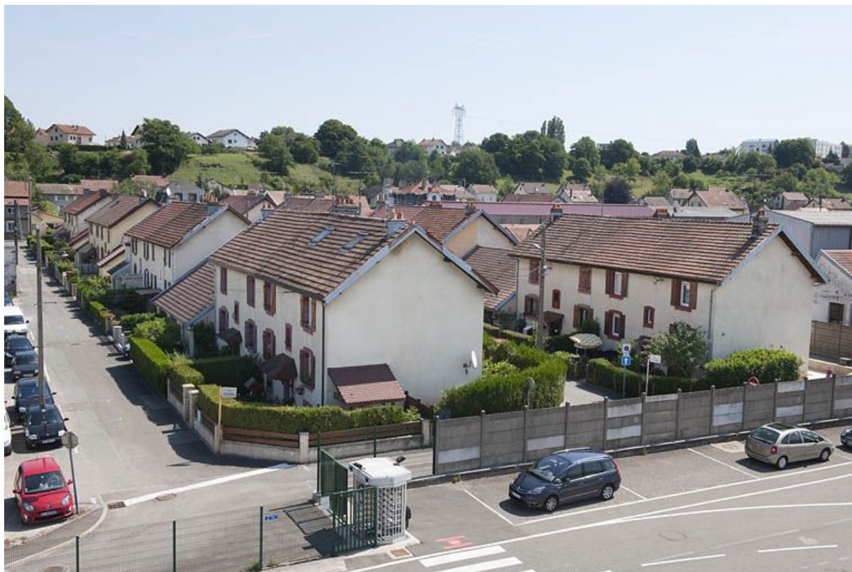
Vue plongeante depuis l'ouest. 25, Audincourt rue de Verdun