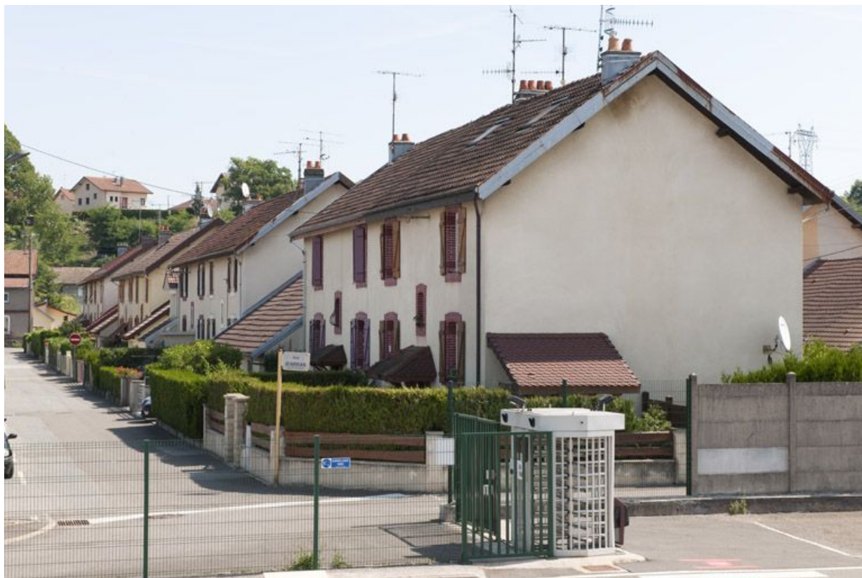
Vue d'ensemble de la rue d'Arras.