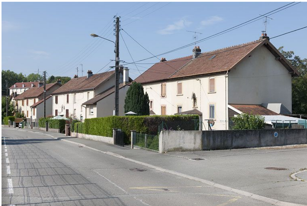
Vue d'ensemble des habitations situées au sud de la rue de Verdun. 25, Audincourt rue de Verdun