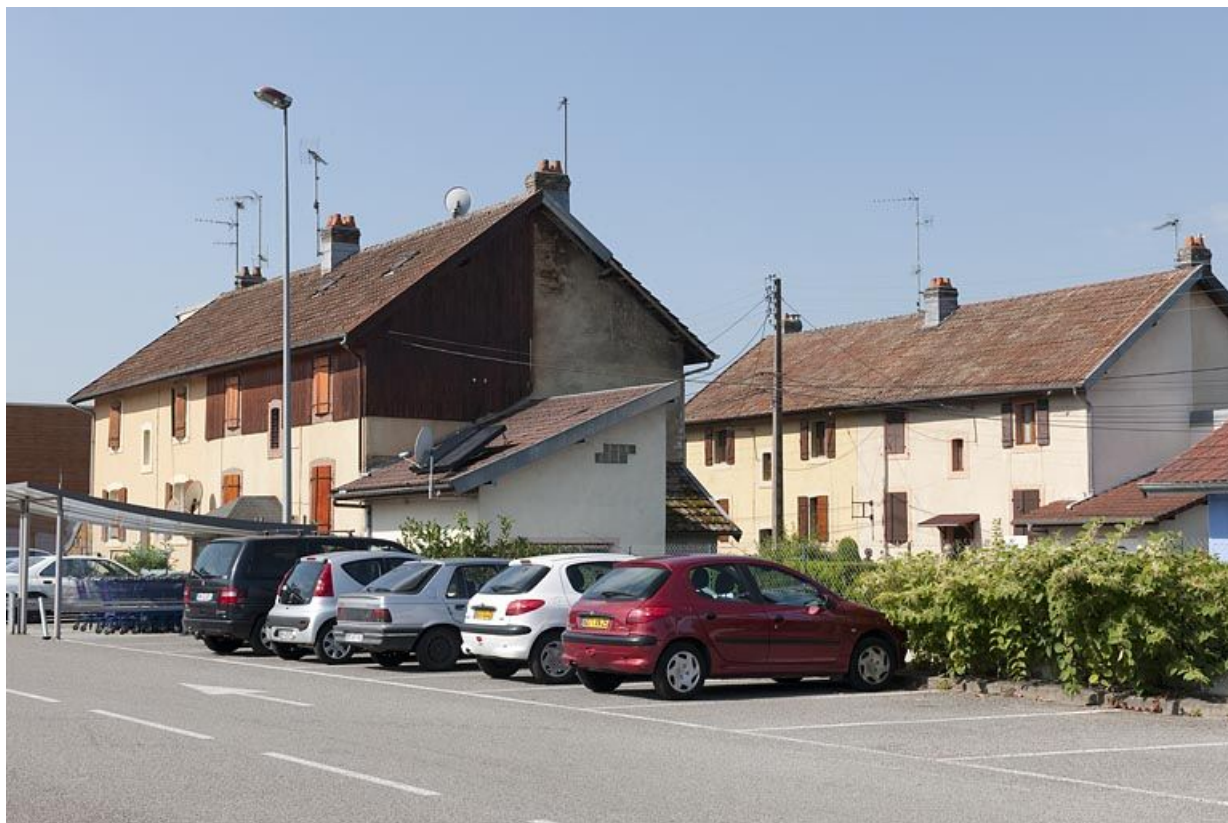
Habitations de la rue de Verdun vues depuis l'est.