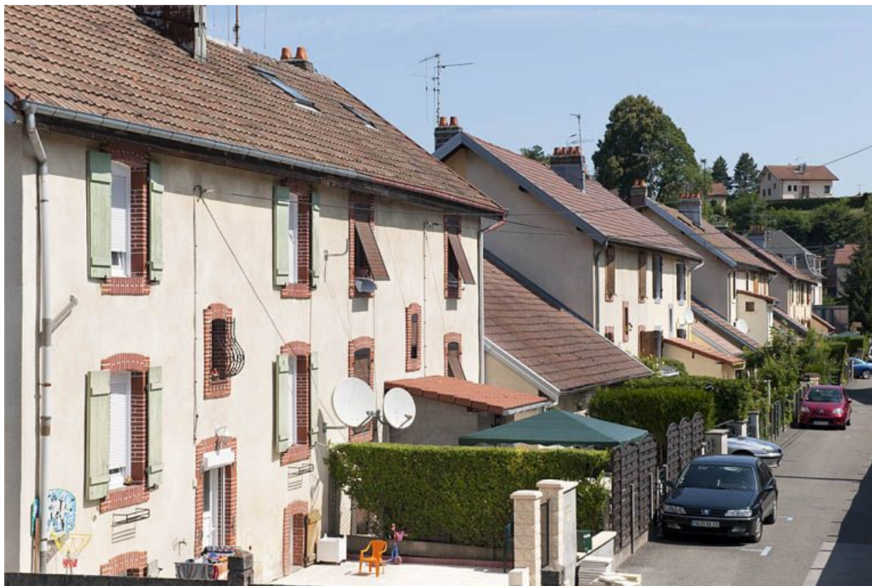
Vue d'ensemble des maisons rue de Reims. 25, Audincourt rue de Verdun