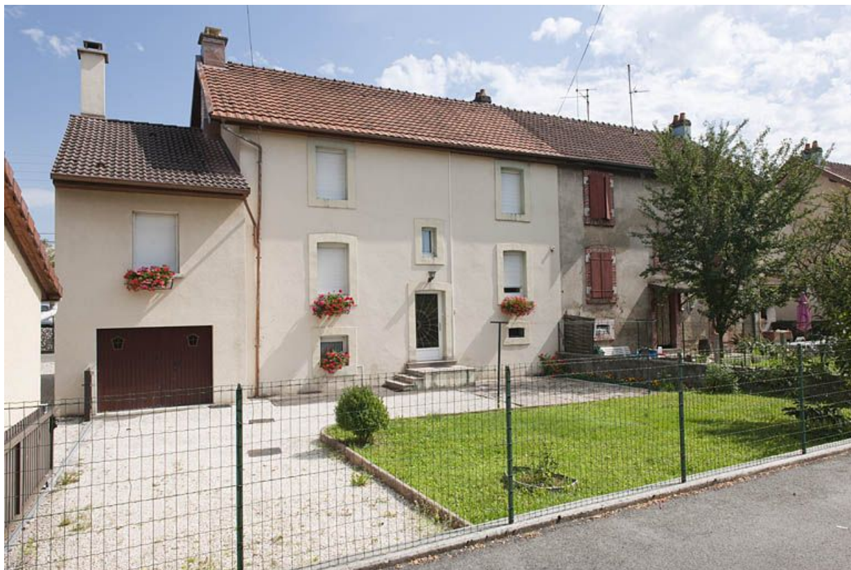
Rue de Verdun. Façade postérieure d'une habitation.