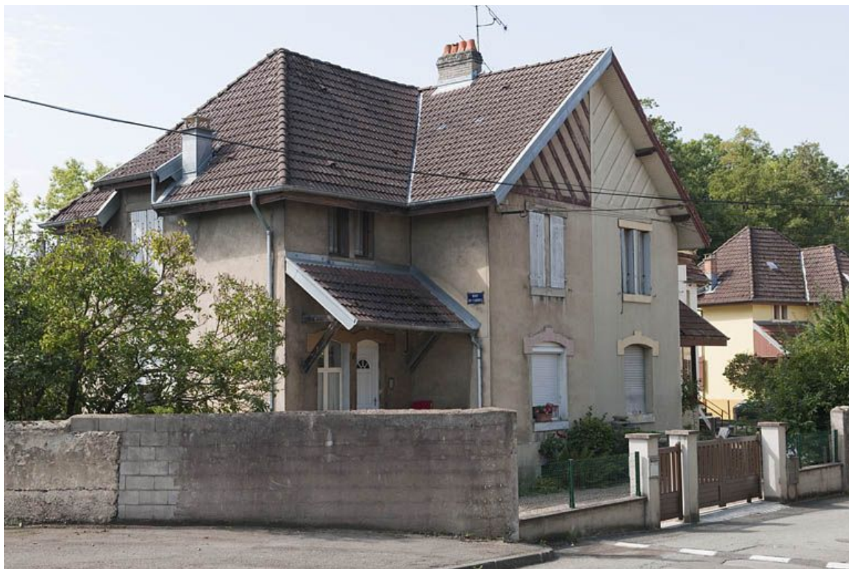
Maison jumelée à l'entrée de la rue de Flandres.