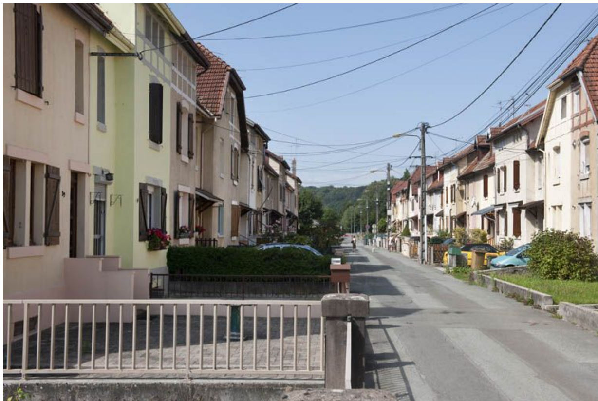
Rue de Somme. Vue d'ensemble.