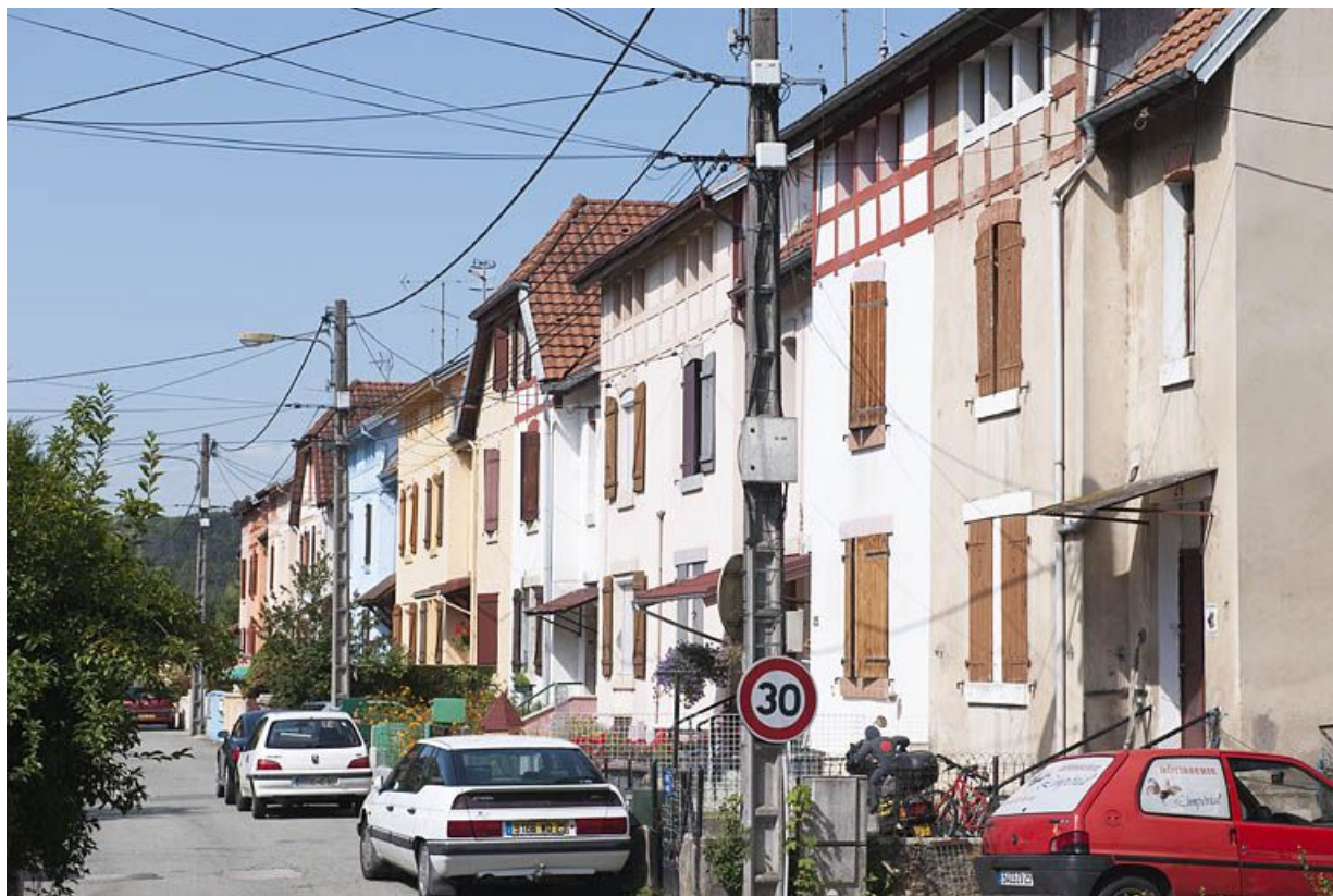
Immeuble rue de Flandres. Vue depuis l'est. 25, Audincourt rue des Flandres