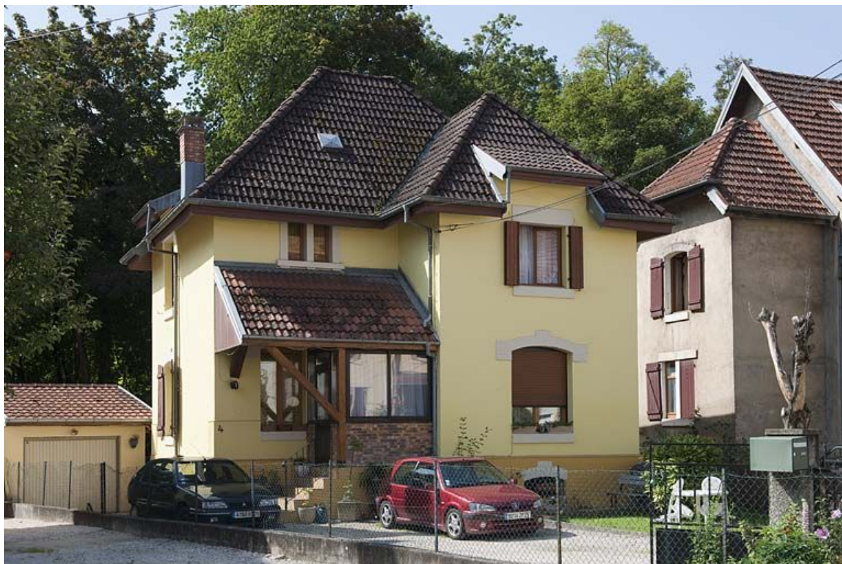
Maison individuelle rue de Flandres.