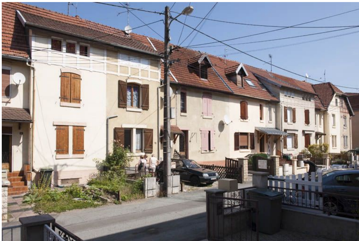
Rue de Somme. Façades nord vues de trois quarts.