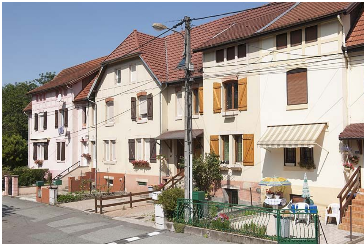
Rue de Somme. Extrémité occidentale de l'immeuble. 25, Audincourt rue des Flandres