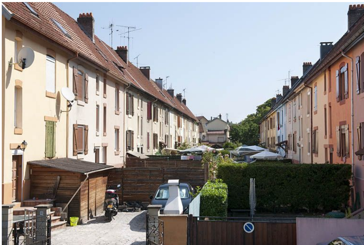
Jardins situés entre les immeubles des rues de Somme et de Flandre. 25, Audincourt rue des Flandres