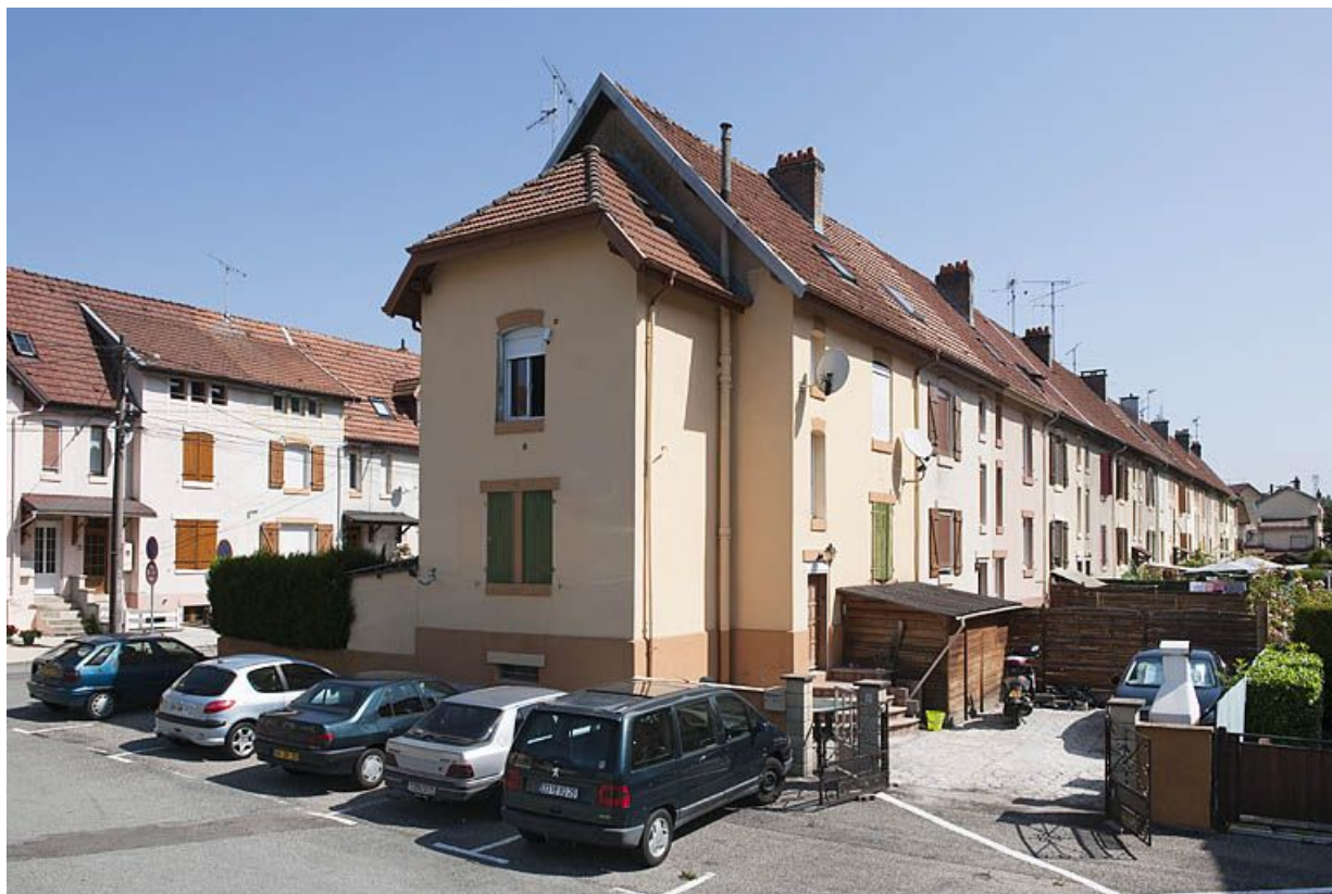
Immeuble rue de Flandres depuis le sud-ouest. 25, Audincourt rue des Flandres