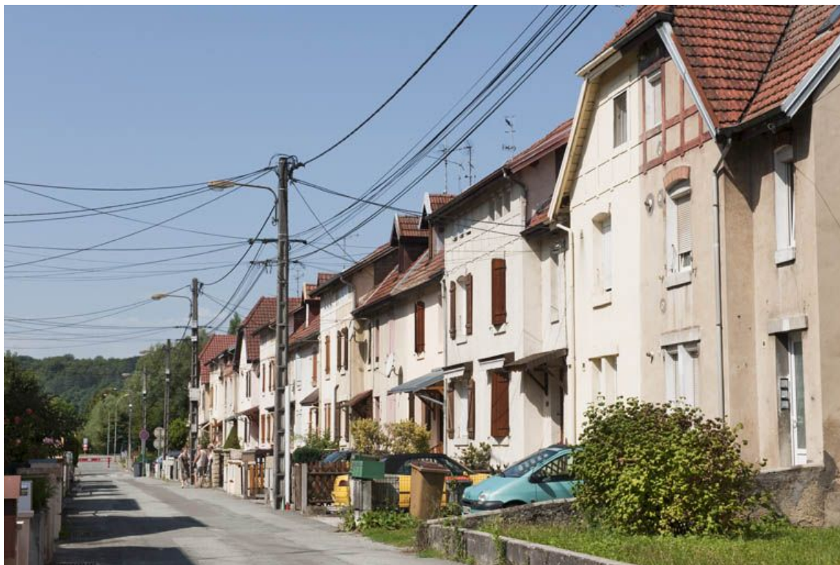
Rue de Somme. Façades sud. 25, Audincourt rue des Flandres