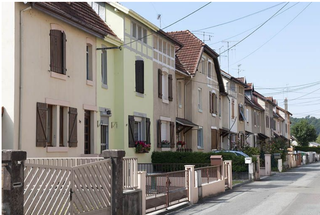
Rue de Somme. Façades nord.