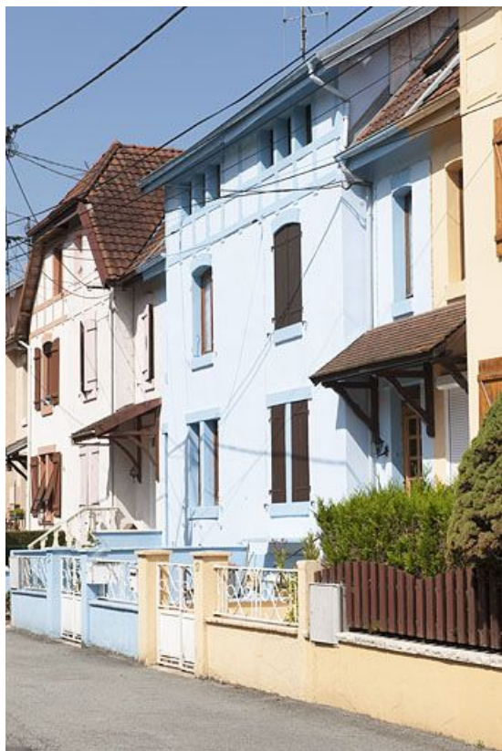
Immeuble rue de Flandres. Détail d'une travée.