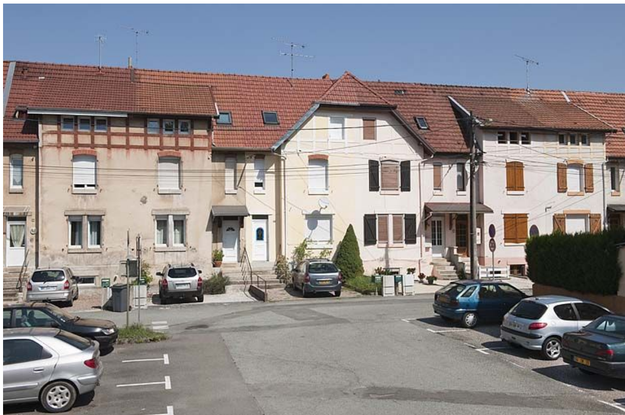
Rue de Somme. Façade antérieure à l'ouest de la rue. 25, Audincourt rue des Flandres