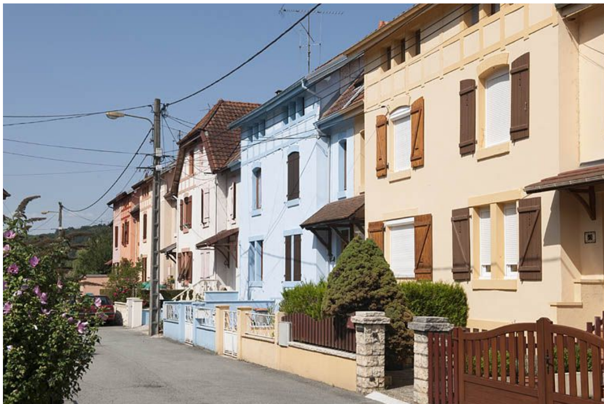
Vue rapprochée de l'immeuble rue de Flandres. 25, Audincourt rue des Flandres