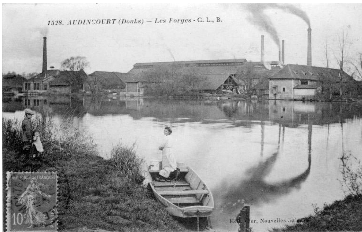
"1528. AUDINCOURT (Doubs) - Les Forges - C. L., B."