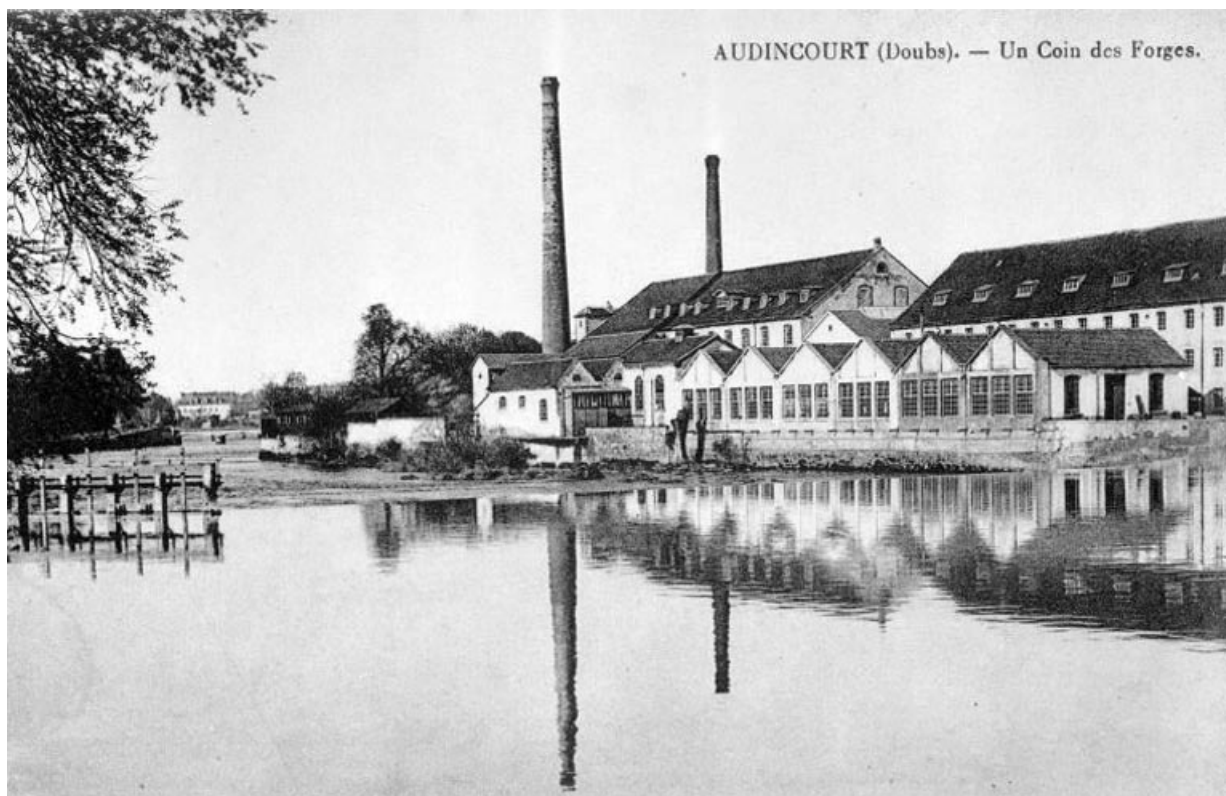
"AUDINCOURT (Doubs) - Un Coin des Forges"