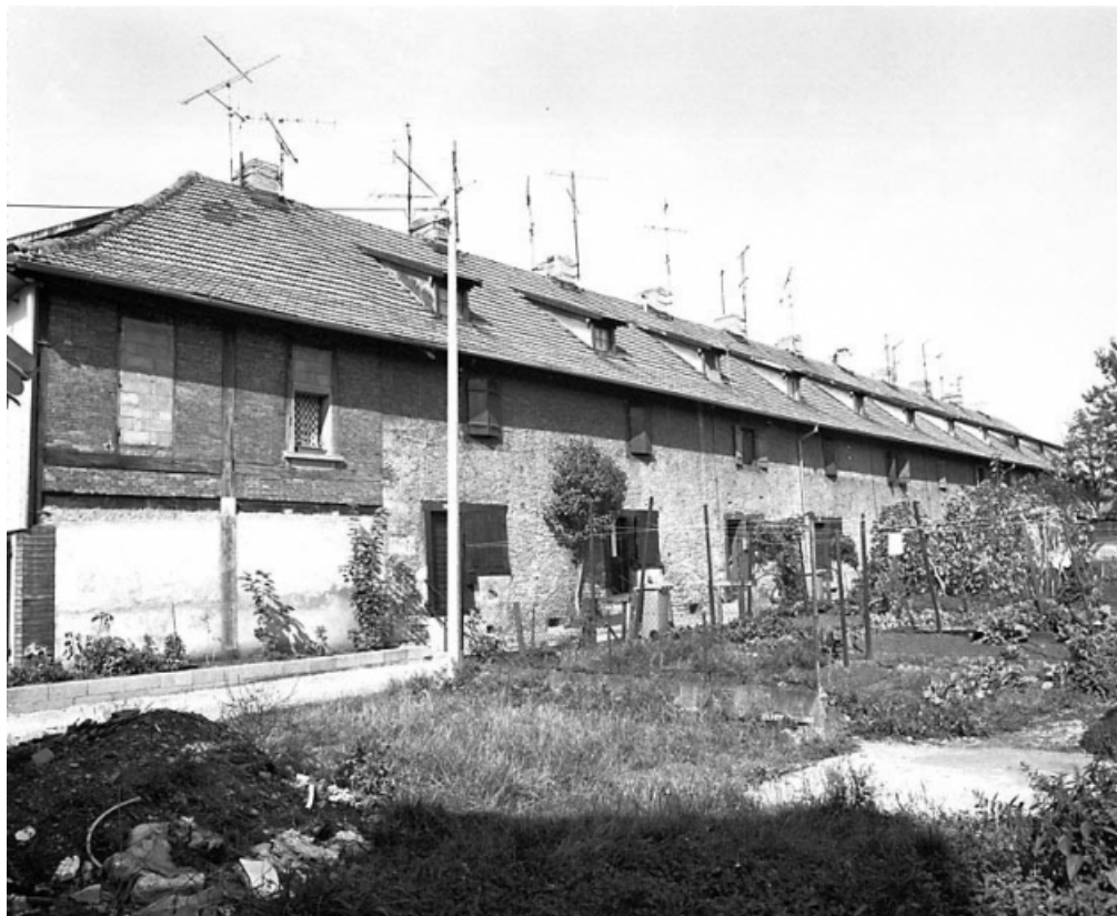
Cité ouvrière dite du Magasin. Façade sud.

25, Audincourt rue du Four Martin, lieudit : les Forges