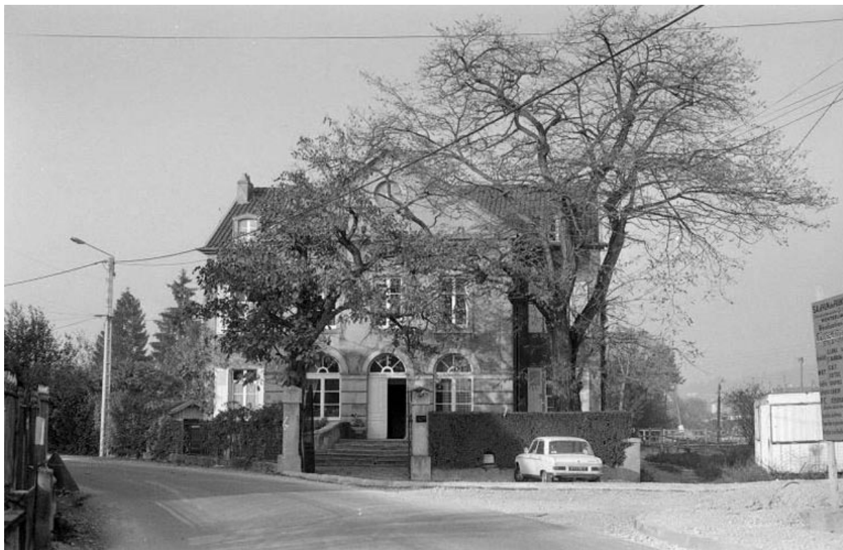
Vue d'ensemble. 25, Audincourt