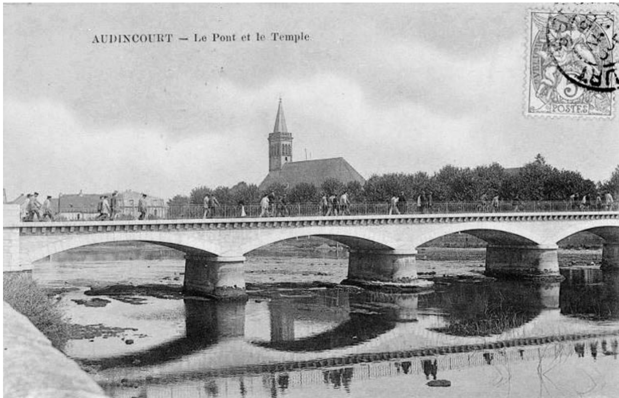
Vue du pont et du temple. 25, Audincourt place du Temple