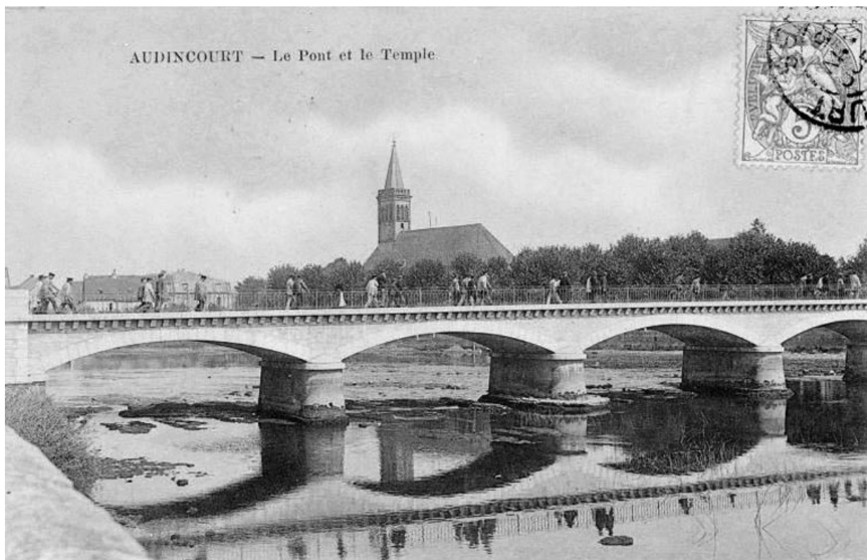
Vue du pont et du temple. 25, Audincourt place du Temple