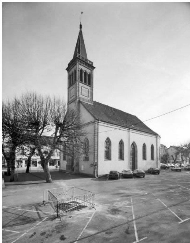
Vue d'ensemble de trois quarts droit.