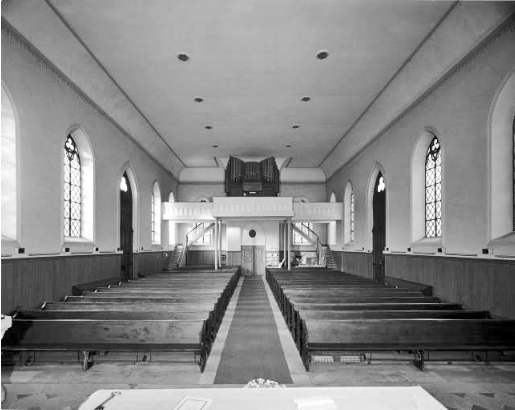
Nef vue depuis le chœur.