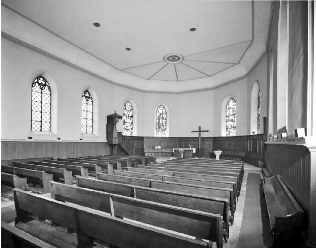
Nef vue depuis l'entrée.