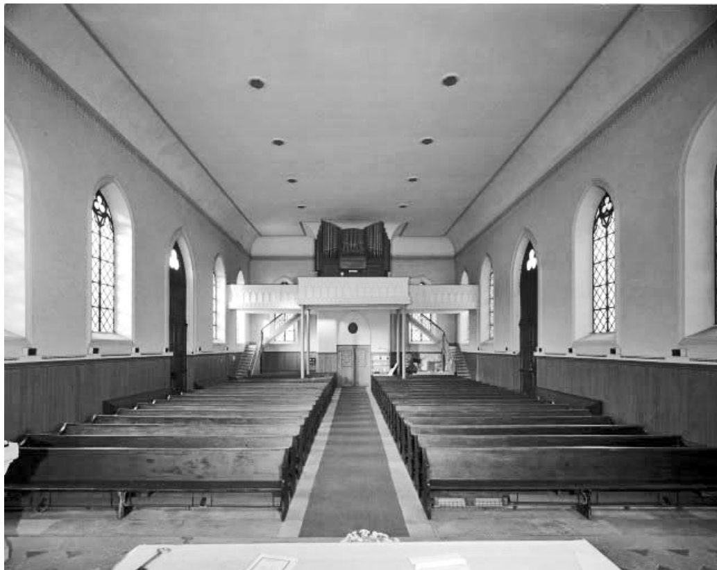
Nef vue depuis le chœur.