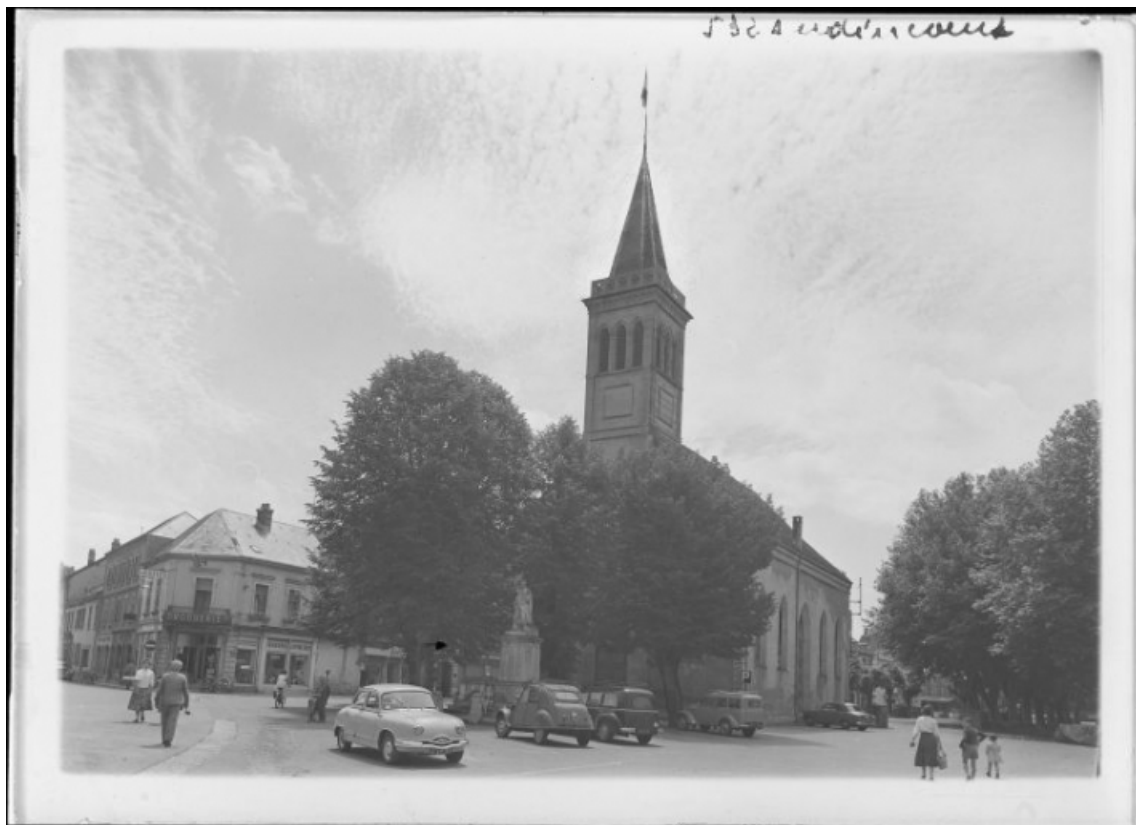
Vue d'ensemble [entre 1940 et 1960]. 25, Audincourt place du Temple