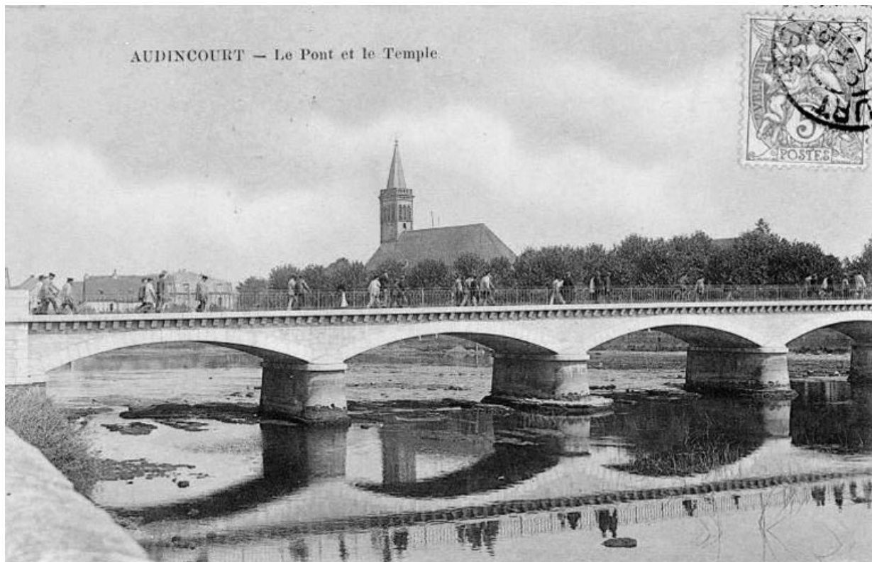
Vue du pont et du temple. 25, Audincourt place du Temple