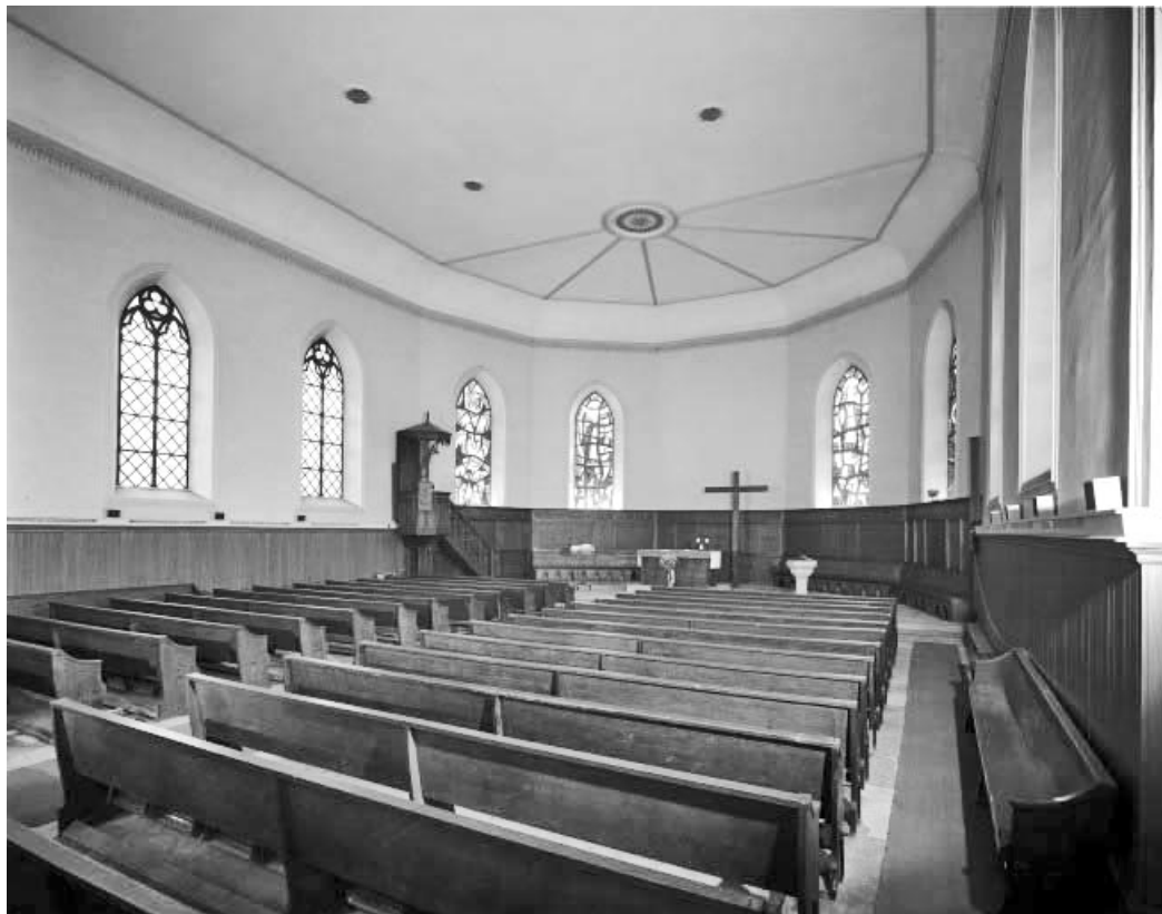
Nef vue depuis l'entrée.