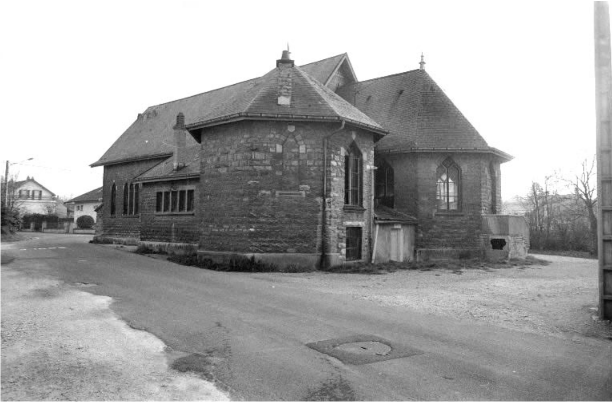
Chevet et façade latérale droite.