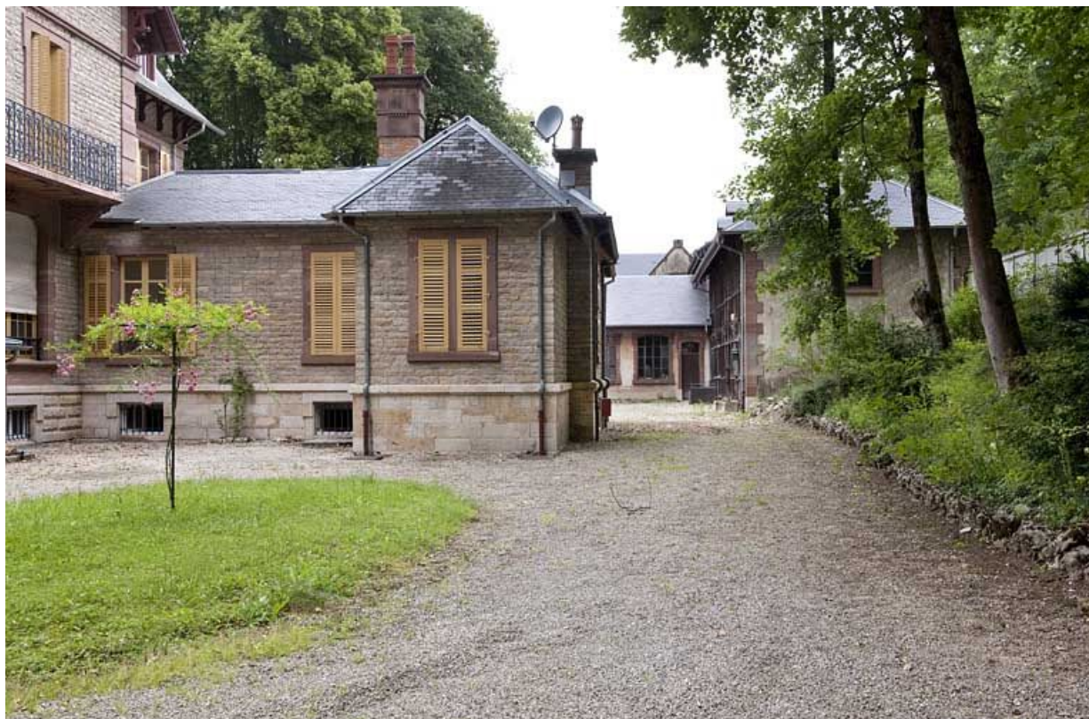
Façade sud de l'annexe et communs.