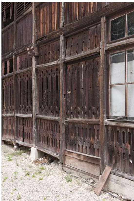
Détail de la façade ouest des communs (remise ou écurie). 25, Audincourt, 72 rue de Valentigney