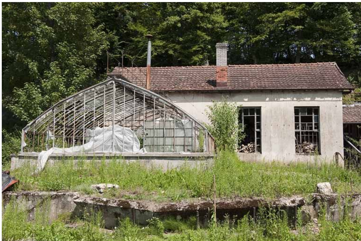
Serre adossée à une resserre.