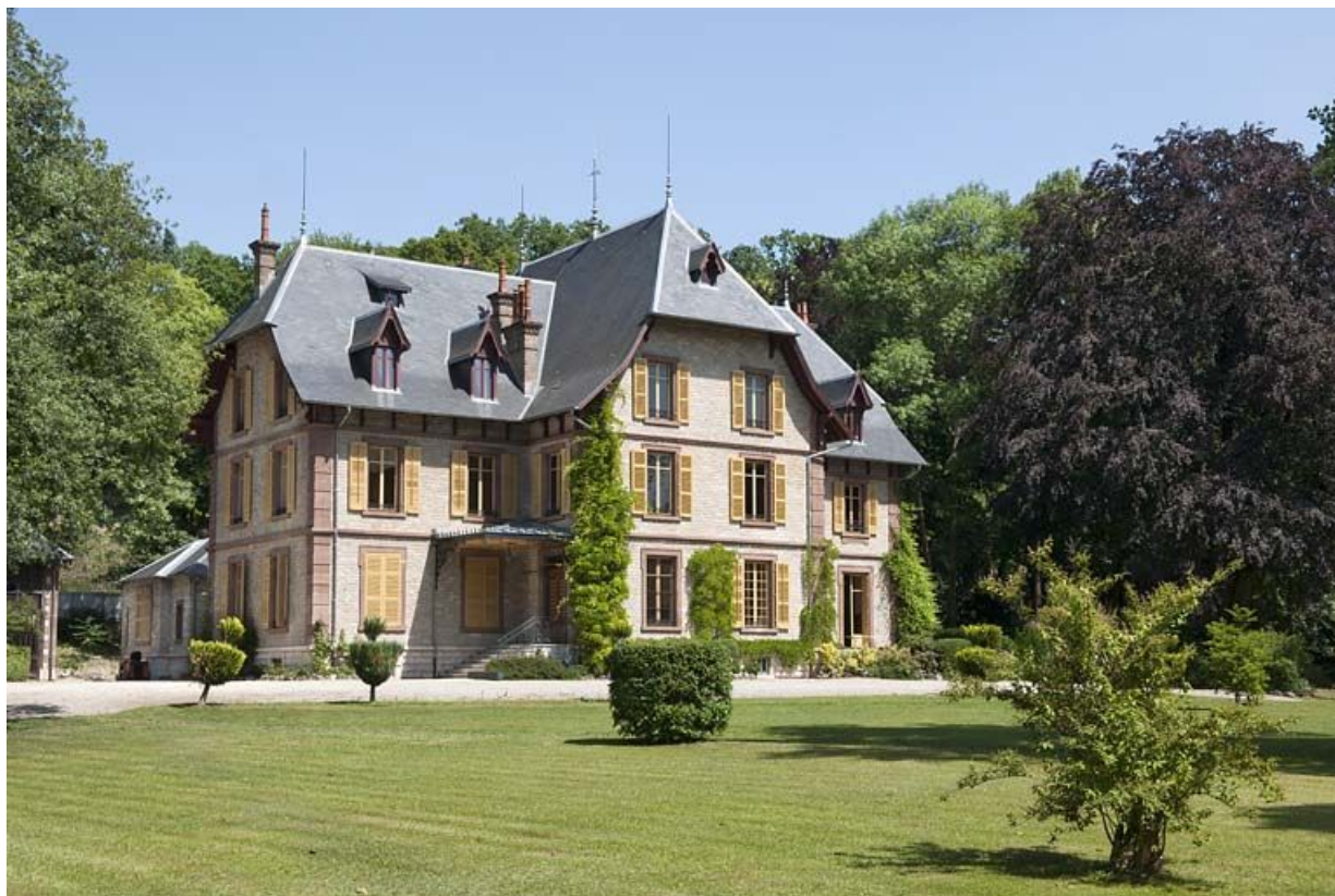
La demeure vue de trois quarts.