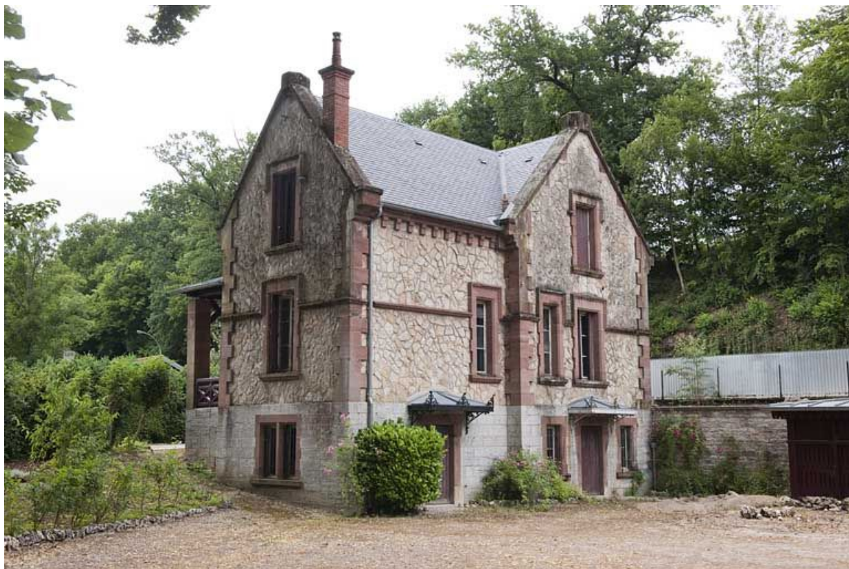
Conciergerie vue de trois quarts arrière.