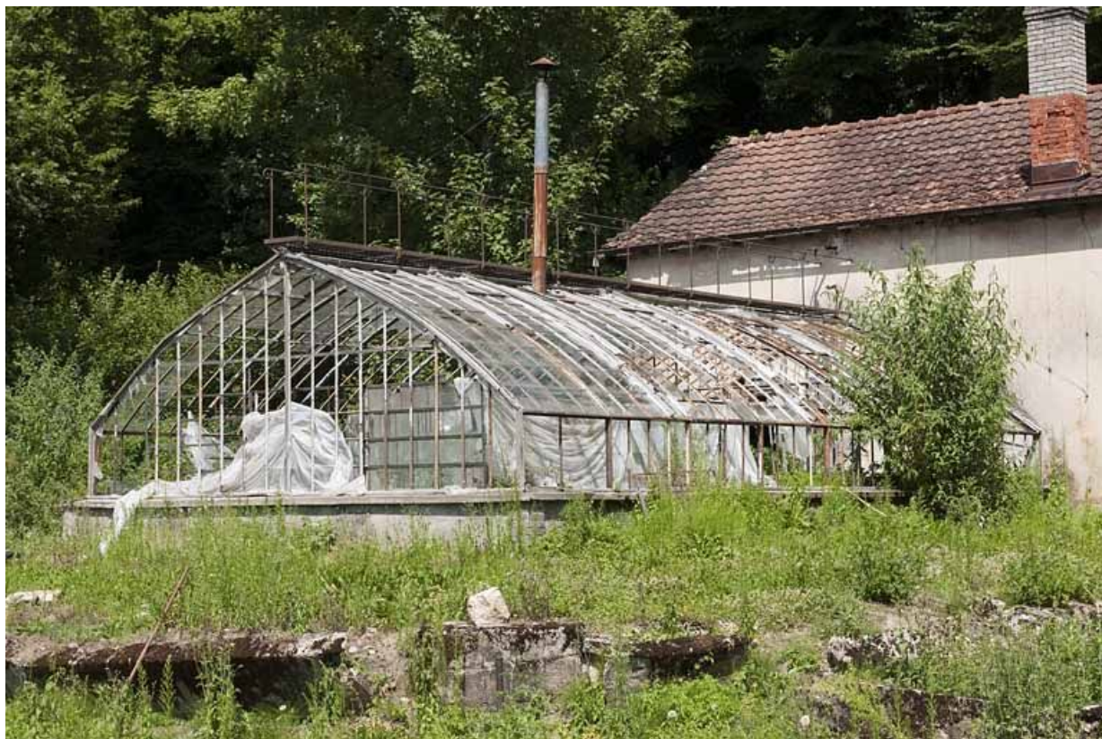
Serre vue de trois quarts.