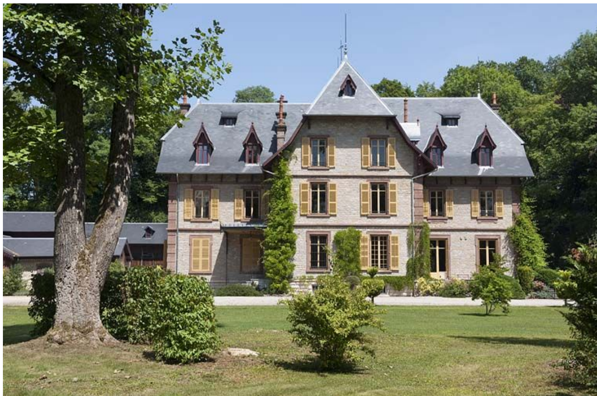
Façade antérieure vue de face.