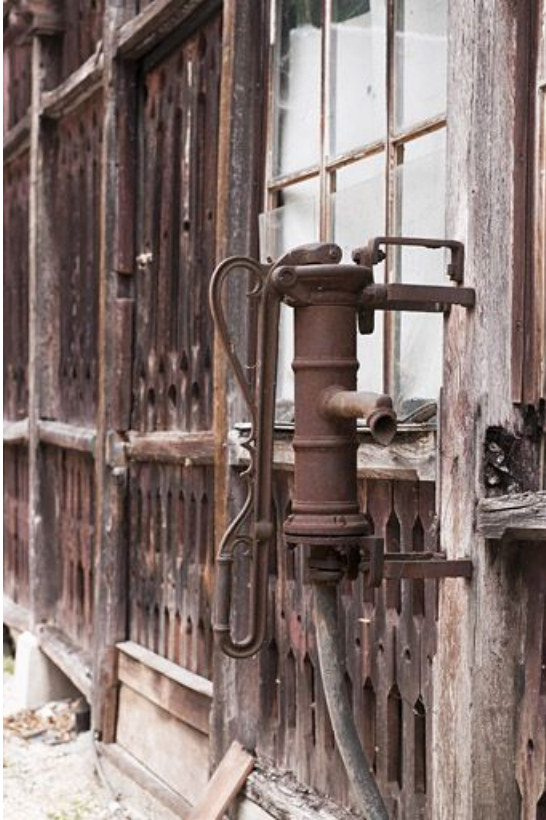
Pompe manuelle contre la façade ouest des communs. 25, Audincourt, 72 rue de Valentigney