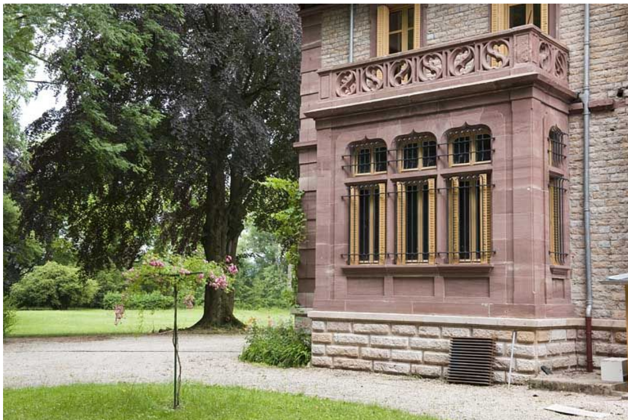
Avant-corps sur la façade antérieure de la demeure.