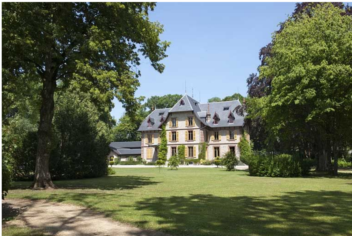
Vue d'ensemble de la demeure depuis le parc.