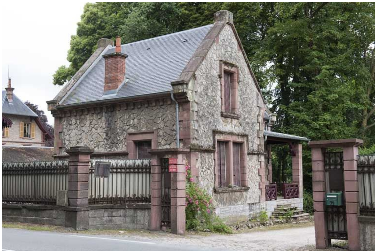
Conciergerie vue depuis la rue.