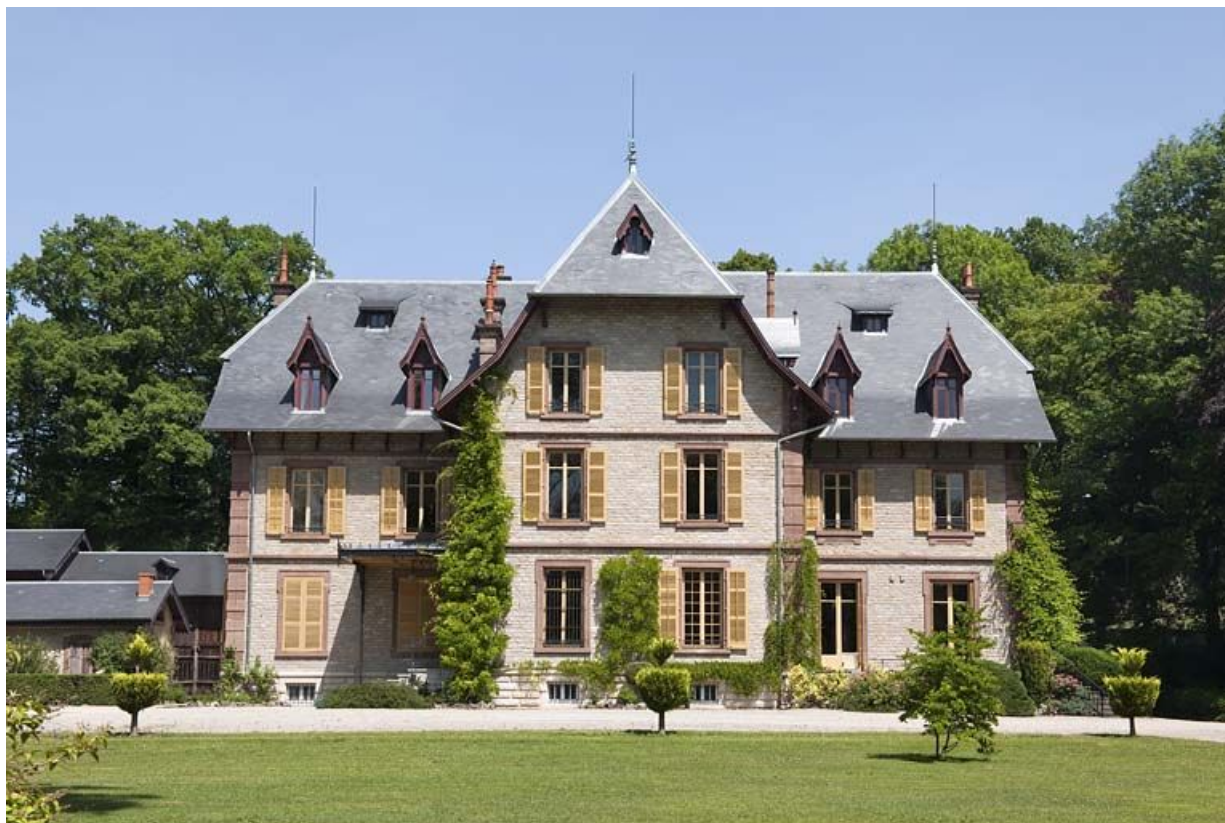
Vue rapprochée de la façade antérieure.