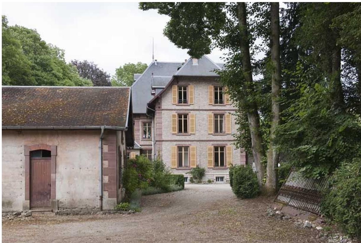
Pignon nord de la demeure.