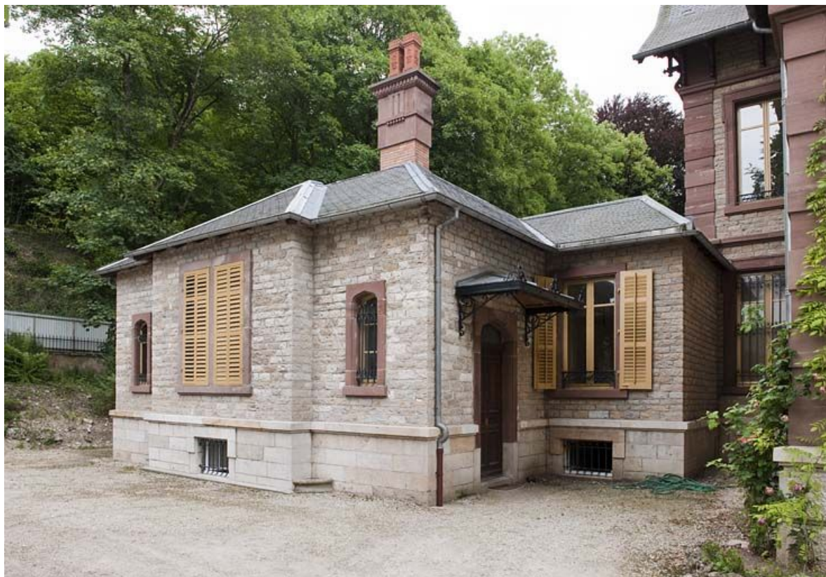
Annexe accolée à la façade postérieure de la demeure..