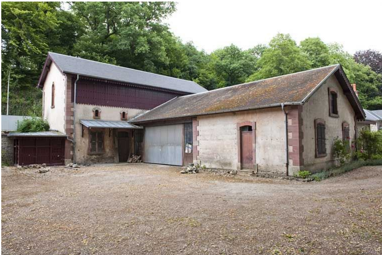
Communs vus depuis le nord-ouest.